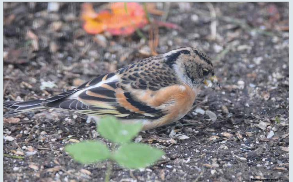
Rastaat, punarinnat ja tilhet käyttävät syksyisin paljon marjoja ravintonaan. Järripeippo käyttää ravinnokseen etupäässä siemeniä, kuten auringonkukan siemeniä ja viljelyksien hukkaviljaa.