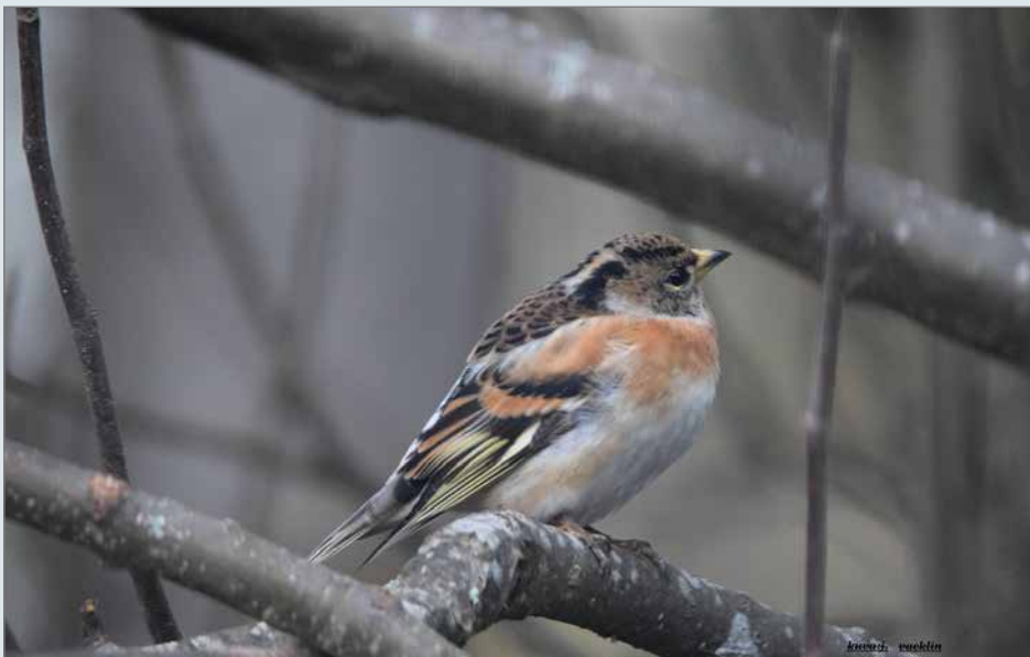
Lokakuussa järripeippo on saanut vaihdettua itselleen komean talvipuvun. Vaaleat talvihöyhenet tekevät puvusta hailakan värisen. Talvihöyhenet kuluvaan keväeseen mennessä pois ja tilalle paljastuu värikäs kesäpuku.