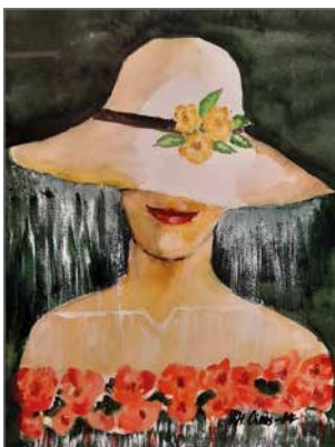
"Kukkahattu" 2021 akvarelli.