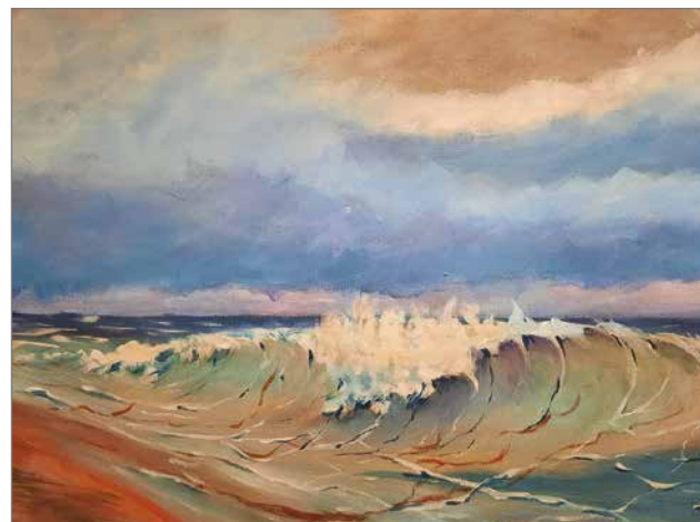
"Aallon harja" 2010 akryyli.