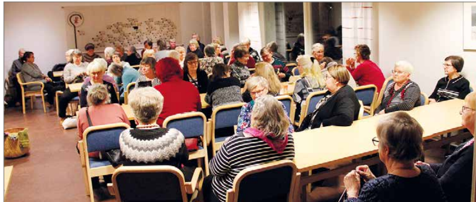
Vuoden ensimmäiseen Pudasjärven maa- ja kotitalousnaisten kerhoiltaan saapui 57 henkilöä.