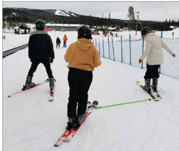
Kampuslaskijat-kerhossa harrastetaan laskettelutoimintaa kuljetuksineen.