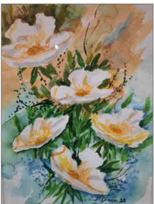
"Kukkaset" 2022 akvarelli.