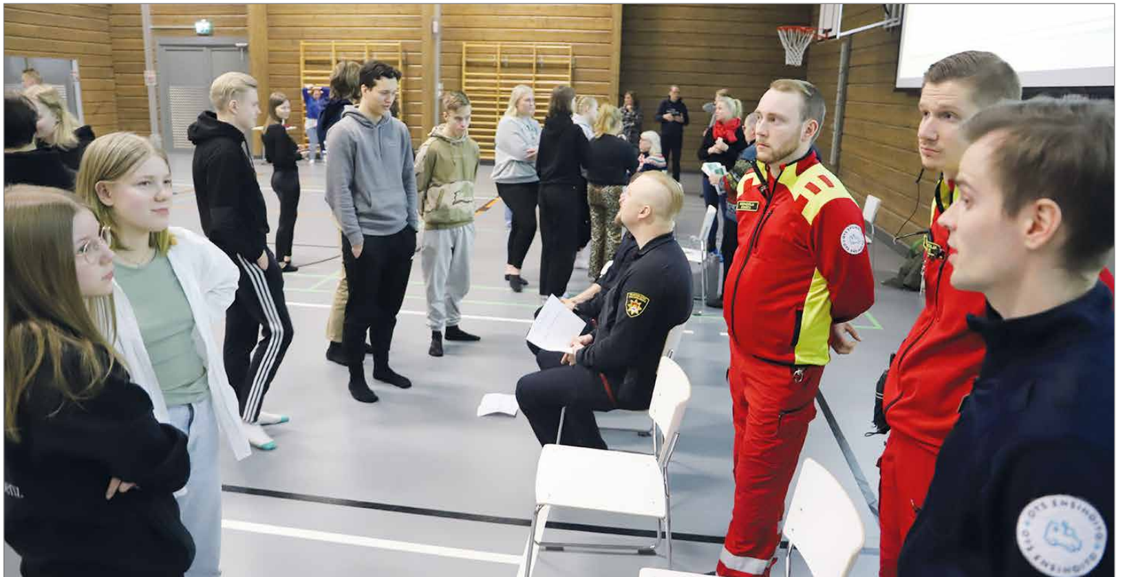
Palo- ja pelastusala oli oppilaille yksi kiinnostavimmista ammateista.

Lopuksi paikalle saapuneet eri ammattialan ihmiset ryhmittäytyivät eri puolille juhlasalia pikku ryhmiin, jossa nuoret saattoivat kierrellä ja kysellä