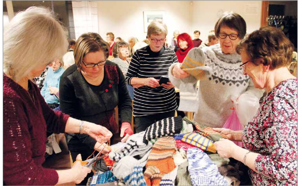
Maa- ja kotitalousnaiset asettelemassa kerättyjä ja kudottuja sukkaa. Samalla myös tarkistettiin, että sukkiparit on kiinnitetty yhteen, jottei tuhansien sukkiä käsittelyssä pari karkaa toisesta.

jestettiin Ranualla, missä saatiin kerättyä yli 500 paria sukkaa sekä muuta rintamalla tarvittavaa tavaraa, kuten kynttilöitä ja silmälasia.