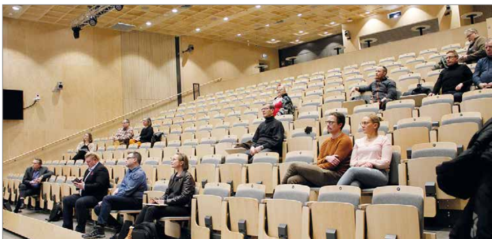
Hyvän olon keskus Pirtin Kurkikalissa pidetyllä tapahtumalla oli kaikkiaan reilu 20 kuulijaa paikan päällä ja etäyhteyden päässä.