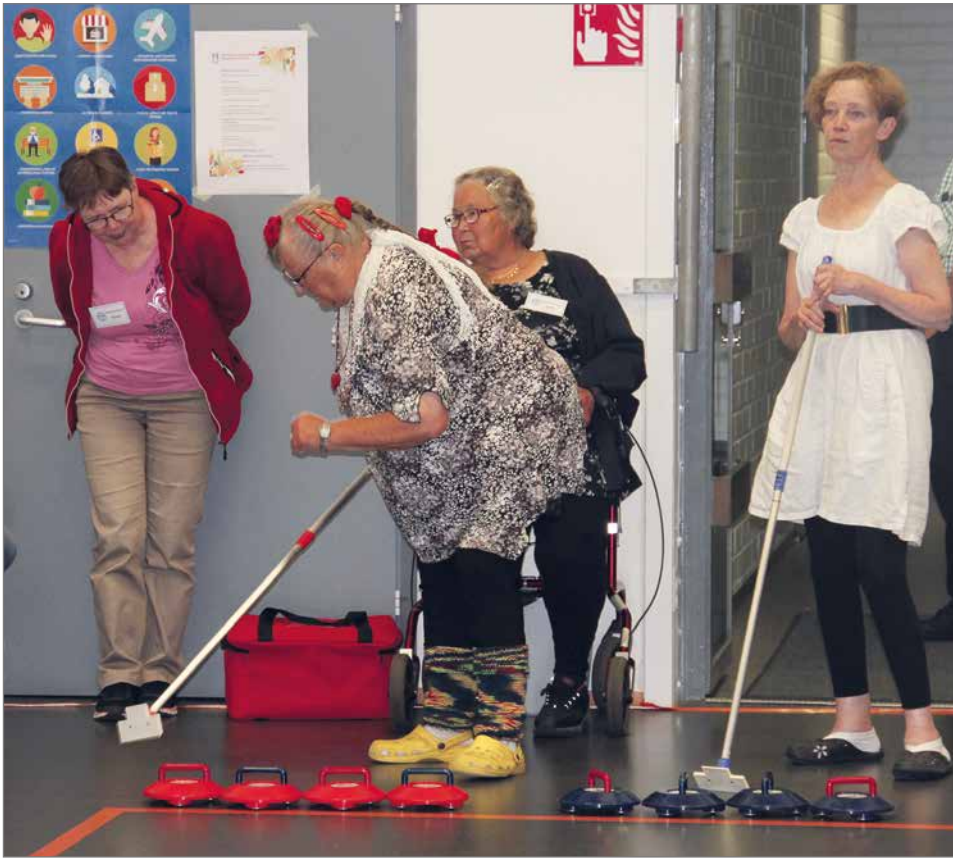
Curling sopii kaikille ja sitä voi pelata istuen tai seisten.

etty ilmainen linja-autokuljetus PoPLin Eloa ja iloa kylille -hankkeen sekä Siuruan Kylä ry:n toimesta. Kuljetus lähtee Tannilan rajalta kello 10.45 ja ajaa Asmuntin kautta Kurenalle. Tarvittaessa linja-auto kiertää myös Palvelukeskuksen, seurakuntakodin sekä Oikopolun pysäkin kautta. Kuljetus on maksuton mutta ennakoilmoittautuminen tarvitaan soittamalla joko Irjalalle numeroon 040