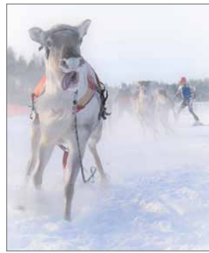
Kilpaporot koulutetaan ja valmennetaan ammattitaidolla, joka näkyy radalla totisena innostuksena.