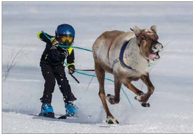
Porokilpailuissa myös juniorit pääsevät mitalioimään paremmuudesta.