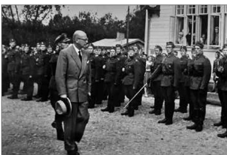
Presidentti Urho Kaleva Kekkonen tarkastamassa kunnianvartioston Kajaanin rautatieasemalla 1956.