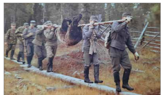
Porukalla piti kantaa kontio pois Hossan Latvajärven seudulta syyskuussa 1968.