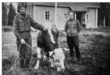
Lonkan kylästä karannut sonni palautettiin kyläläisille takaisin.