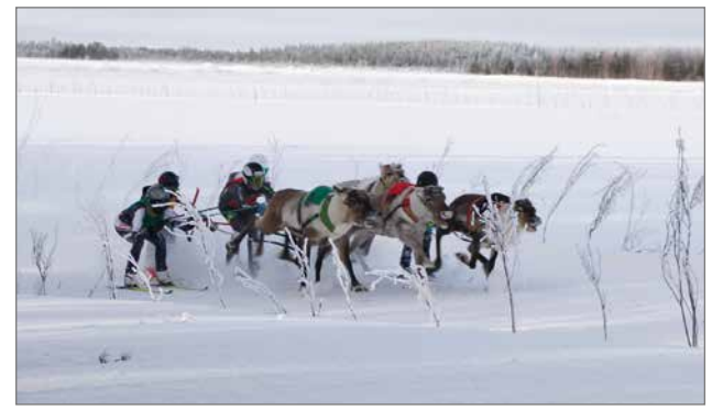
Kisaviikonlopun aikana on useita lähtöjä. Jokaisessa lähössä on viisi paria yhtä aikaa kilpailemassa jatkopaikoista ja cup-pisteistä.