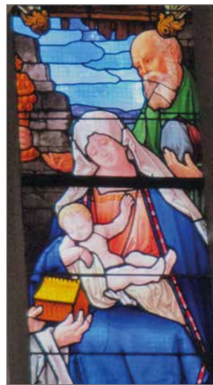
Lahja lapselle. (Linnankirkko, Wittenberg.)

Betlehemin tähden on nähty viittaavan niin sa-