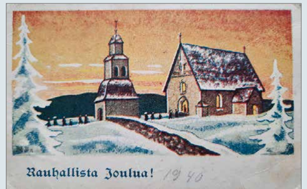
Martti Luther kirjoitti Jumala omi linnamme- virren vuonna 1528, jonka tuttuun säveleeseen saamme Joulurauhan julistuksen yhteydessä yhtyä.

ja huusivat Jumalalta apua. Pelkosenniemen suunnalla tapahtui ihme, kun aamun vesi sade muuttui illan kovaksi pakkaseksi ja venäläisten eteneminen hidastui ja lopulta he perääntyivät rajan taakse. Kirkkomaat ovat useilla paikkakunnilla sankarihautojen ympäröiminä. Vuoden 1940 Joulun suomalaiset saivat viettää rauhassa. Samaa ei voi sanoa vuosien 1941-1943 jouluisista. Vuoden 1944 joulua vietettiin kodeissa jo suurimmaksi osaksi rauhassa, vaikka miehet olivatkin karkoittamassa saksalaisia Lapista. Jouluevankeliumissa sanotaan, että taivaallinen sotaväki ylisti Jumalaa! Näiden