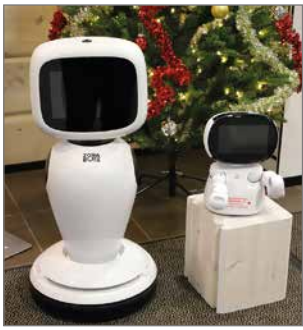
Tuloaulassa avoimien ovien kävijät saivat tutustua juuri hankittuihin James ja Emma-robotteihin. Ne otetaan käyttöön vuoden vaihteessa.