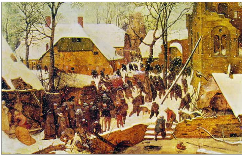
Pieter Bruegel vanh.: Kuninkaiden kumarrus lumisessa talvimaisemassa, 1560-luku. - Euroopassa oli 1500-luvulla hyvin kylmää, aikaa on kutsuttu pieneksi jääkaudeksi. Maalauksessa onkin pääosa talven kuvaamisella, seimi lapsineen jää vasemmassa reunassa lähes piiloon. Kun kylmästä hyttisevä seurue tulee tietäjien perässä, kaupunkilaiset jatkavat arkisia puuhiaan, noutavat vettä ja polttopuita. (Reinhart Collection, Winterthur.)