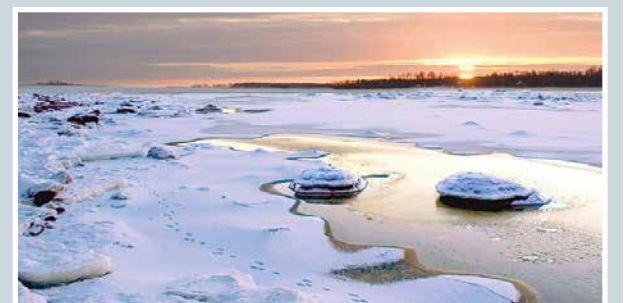
On suuri sun rantas autius.

Martti Kähkönen lukijoiden palaute ja jutut: vkkmedia.fi