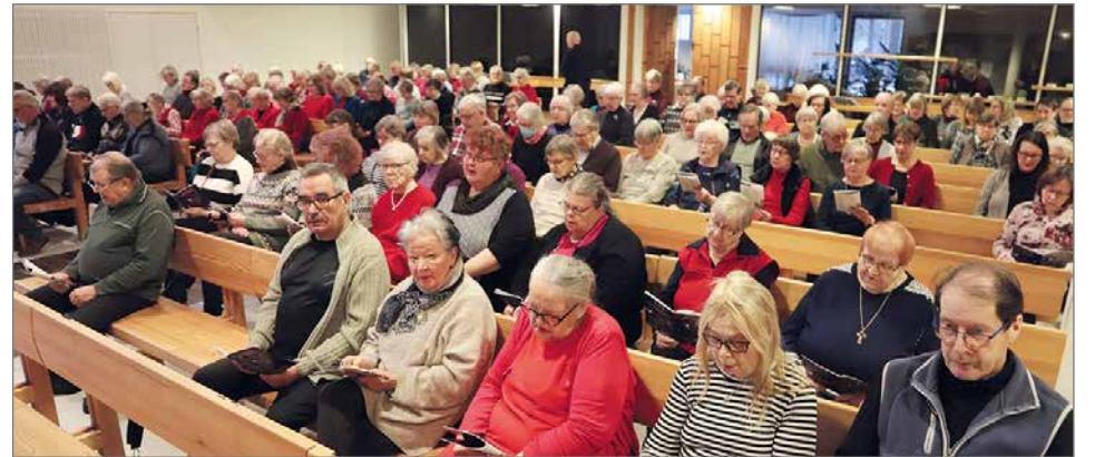
Kauneimmat joululaulut kokosi 15.12. seurakuntakodille lähes "tuvan täydeltä" väkeä. Samana päivänä oli myös seurakunnan kaiken kansan joulupuurotapahtuma, jossa kävi päivän aikana noin 760 henkeä.

Keskiviikkona 21.12. kirkosta striimattiin vielä Kauneimmat Joululaulu-tilai-