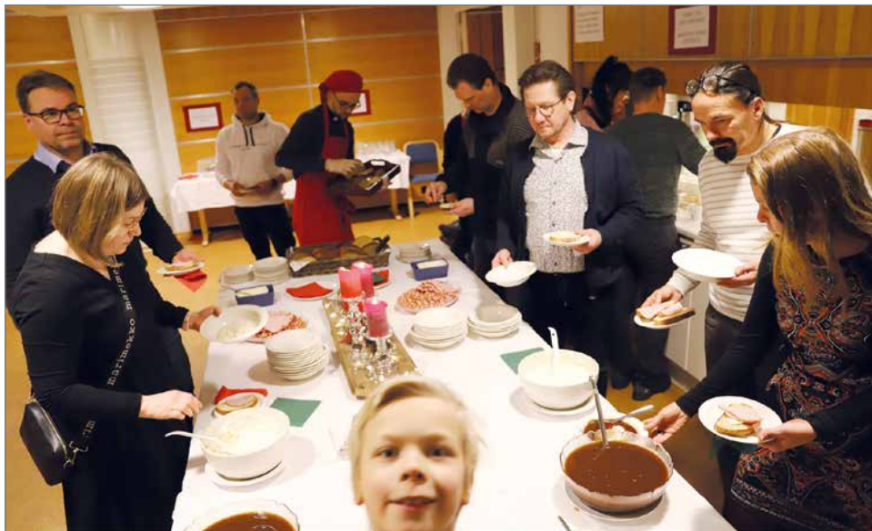
Ruokailijoita riitti tasaisena virtana koko päivän.