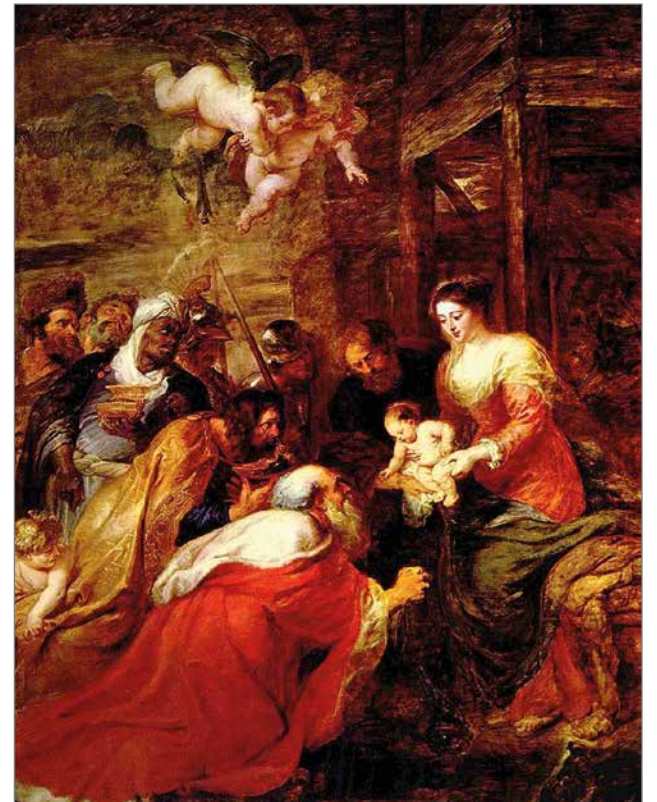
Peter Paul Rubens: Kuninkaiden kumarrus, 1630-luku. - Seimen ääressä lapsen edessä kumartuvat tietäjät ovat erirotuisia ja -ikäisiä ja heillä on mukanaan saattue turvamiehiä. Ylhäällä barokin ajan taiteelle tyypilliset kerubit laskeutuvat katsomaan kohtausta. (King's College Chapel, Cambridge.)