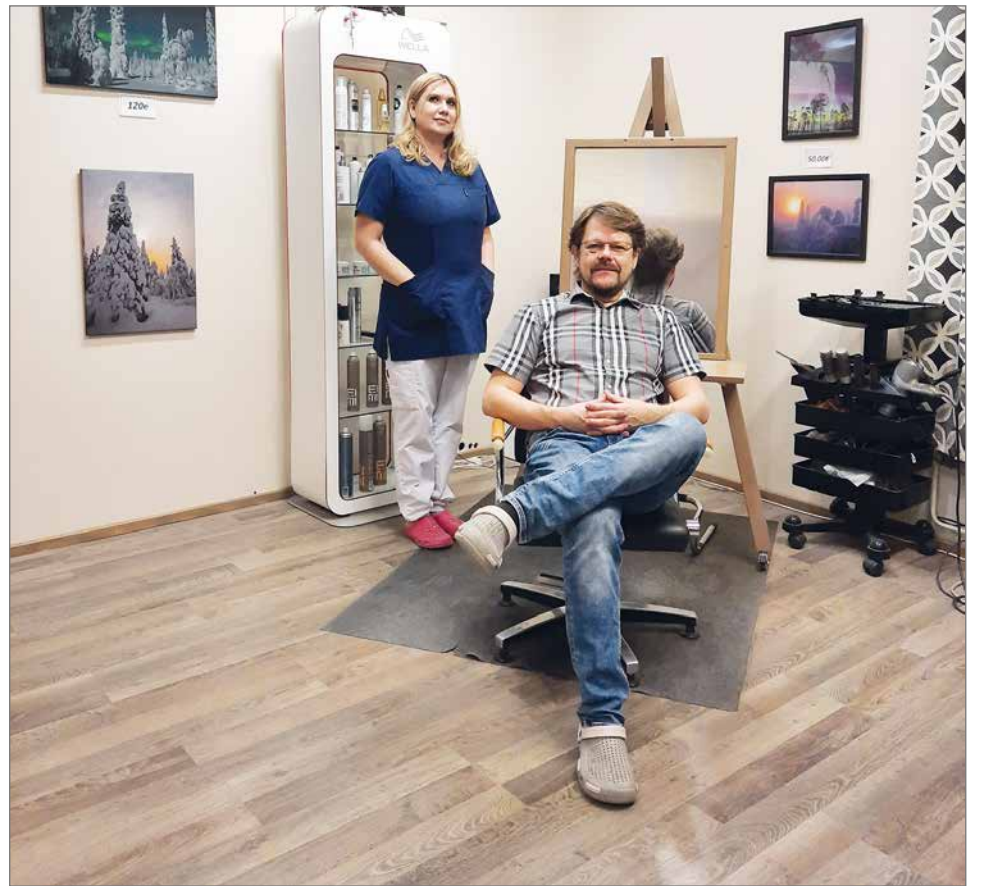
Teijan ja Harrin tarjoamien palveluiden vahvuutena on pitkäaikainen kokemus ja vahva ammattitaito hius- ja kauneushoitotalta.