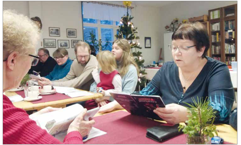
Jouluihme koettiin Korpisella, kun ennätysmäärä kyläläisiä osallistui joulupuurolle, torttukahveille sekä Kauneimmat joululaulut tilaisuuteen.

Sadattuhannet lapset kehittyvissä maissa saavat kiipeästi tarvitsemaansa apua joka vuosi Kauneimpien Joululaulujen kautta, kerrotaan Lähetysseuran laulukirjasssa. Lahjoitusten avulla monet saavat toivon paremmasta tulevaisuudesta, johon