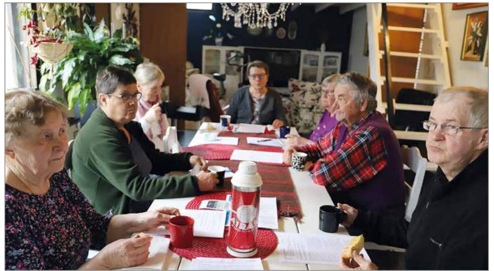
Hallitus on kokoontunut tarvittaessa suunnittelemaan toimintaa.