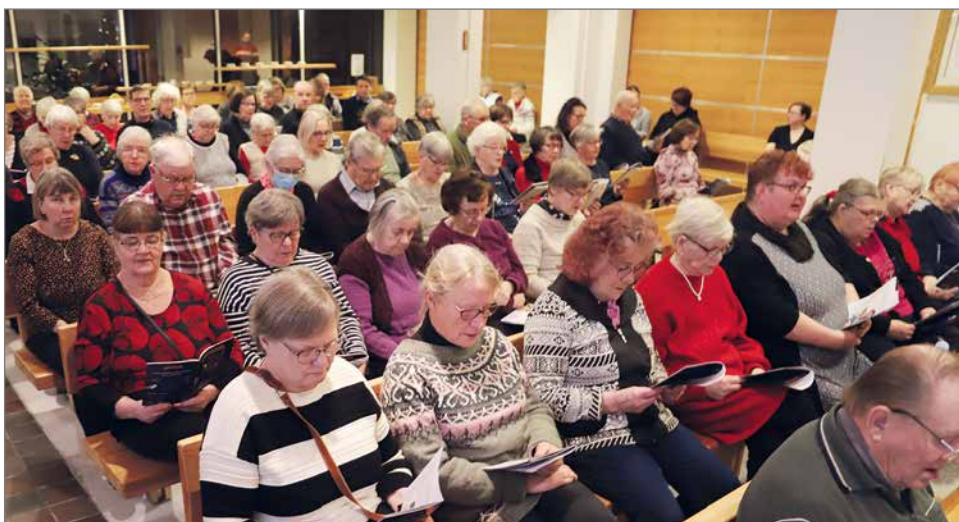
Kauneimmat joululaulutilaisuus oli mukana Kaiken kansan puurotapahtumassa ja kokosi seurakuntasalin lähes täyteen väkeä.

Pudasjärven seurakunta järjesti seurakuntakodilla kaikelle kansalle tarkoitetun joulupuuropäivän keskiviikkona 14.12. Idea tapahtuman järjestämisestä lähti liikkeelle vuonna 2016 työntekijäkokouksessa, jossa keskusteltiin joulun ajan tapahtumista. Tällaisen kaikkien yhteisen joulupuuropäivän on koettu olevan mukava ja yhteisöllinen tapahtuma, joka kokoaa seurakuntalaisia ja työntekijöitä yhteen.