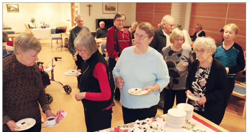
Pöydän antimet keräsivät väkeä jonoksi asti.