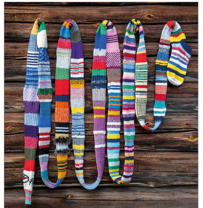
Vuonna 2007 alkanut sukkaaste on saanut tähän päivään mennessä pituutta noin 9,5 metriä.

Eri kylät ovat tehneet noin metrin verran sukkaa, jota on tällä hetkellä 9,5 metriä. Tällä sukkaasteella on tarkoituksena päästä Guinnessin ennätysten kirjaan. Aikaa sukankutomiseen on ensi vuoden kesämarkkinoihin saakka. Marja-Leena Tykkyläinen tietää kulloisestakin varauksesta, että millä kylällä