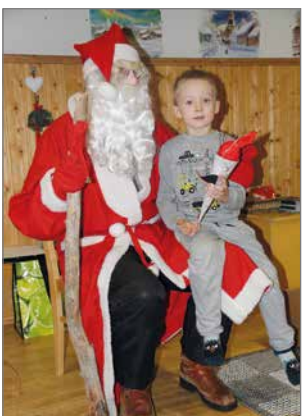
Lapset kävivät juttelemassa ja istumassa joulupukin polvella.