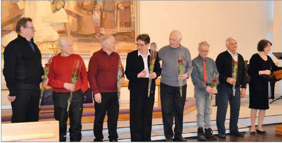
Suopunki-yhtye on tuonut iloa niin osaston omaan säännölliseen toimintaan, hoivakodeissa asuville ihmisille kuin toritapahtumiin ym. tilaisuuksiin osallistuville.