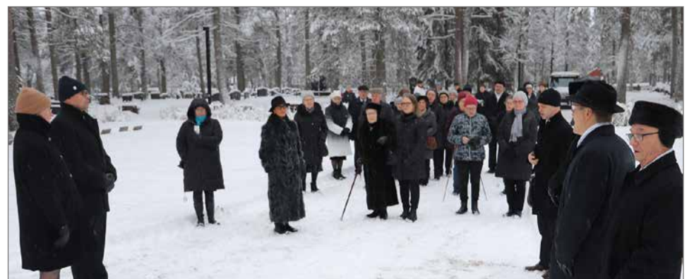
Jumalanpalveluksen jälkeen kokoonnuttiin sankarihaudalle seppeleiden laskuun.