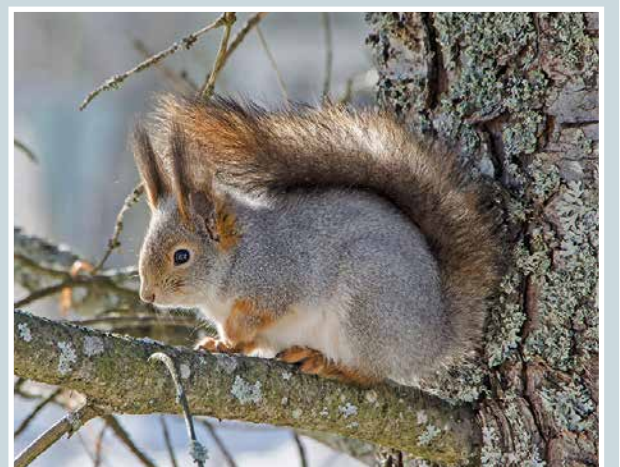
Oravainen puussa.

lukijoiden palaute ja jutut: vkkmedia.fi