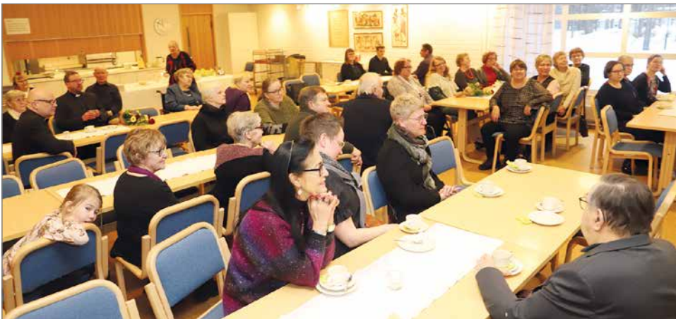
Messuun osallistui 71 henkeä, joista suuri osa tuli myös ison kahvion puolelle kirkkokahveille.