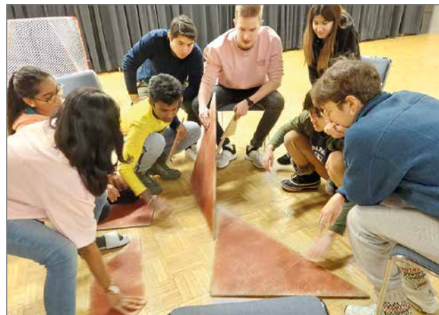
Tutustuminen aloitettiin erilaisten tiimitehtävien avulla.