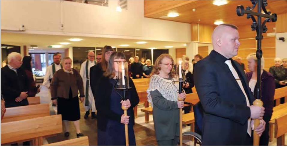
Siunattavat ja siunauksen toimittajat tulivat messuun kulkueena, samoin messun päättyttyä poistuivat kulkueena.