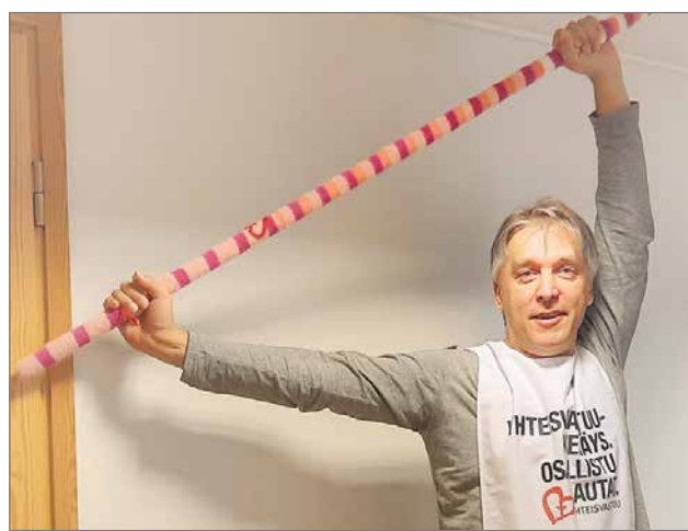
Keräyspäällikkö venyttelemässä tämän vuoden koitosta varten.

Yhteisvastuukeräys alkaa Pudasjärvellä niin kuin muuallakin Suomessa helmikuun 5. päivä. Kevään aikana on tulossa mm. Laskiaistiistain hernekeittopäivä, lipaskeräyspäivä ja Frisbeegolf -tapahtuma. Kesän jälkeen on suunnitteilla mm. Yhteisvastuun toritapahtuma. Kauppojen ja liikenneasemien kassoilla on Yhteisvastuukeräyksen lippaita, joihin voi lahjoittaa asiain yhteydessä. Lisäksi tarjolla on useampia sähköisiä lahjoitusmahdollisuuksia, joihin löytyy ohjeet mm. kotiseurakunnan nettisivuilta keräyksen alkaessa.