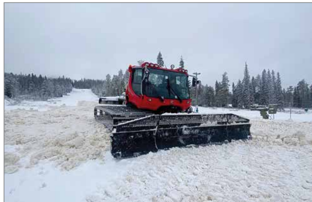
Olli Toivanen valmisteleo rinnettä laskettelukuntoon Iso-Syöteellä 25.10.