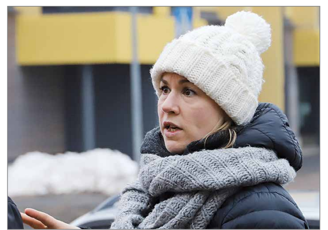
Sosiaali- ja terveysministeri Hanna Sarkkinen tapasi ihmisiä lauantaina 30.10. Kurenalla ja puhui Pohjois-Suomen Ay-päivillä Syötteellä.

Yksi keino työntekijöiden löytämiseksi on tarjota parempia työehtoja- ja olosuhteita. Tämä pätee paitsi yrityksissä, myös julkisella sektorilla, jota työvoimapuola aidosti koskettaa muun muassa sote-alalla. Hallitus on käynnistämässä poikkihallinnollista ohjelmaa sotealan työvoiman saatavuus-