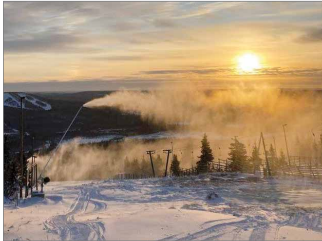
Uudet pillitykit tekevät lunta Iso-Syöteellä 22.10.