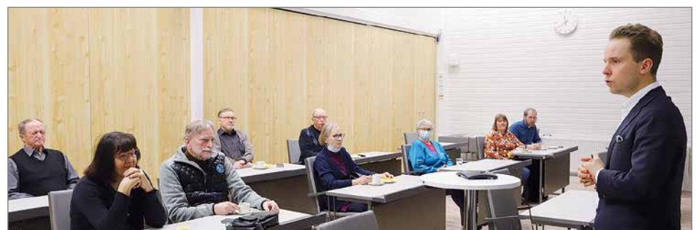
Polttoaineen alentamista alueellisesti voisi tutkia, totesi Honkonen.