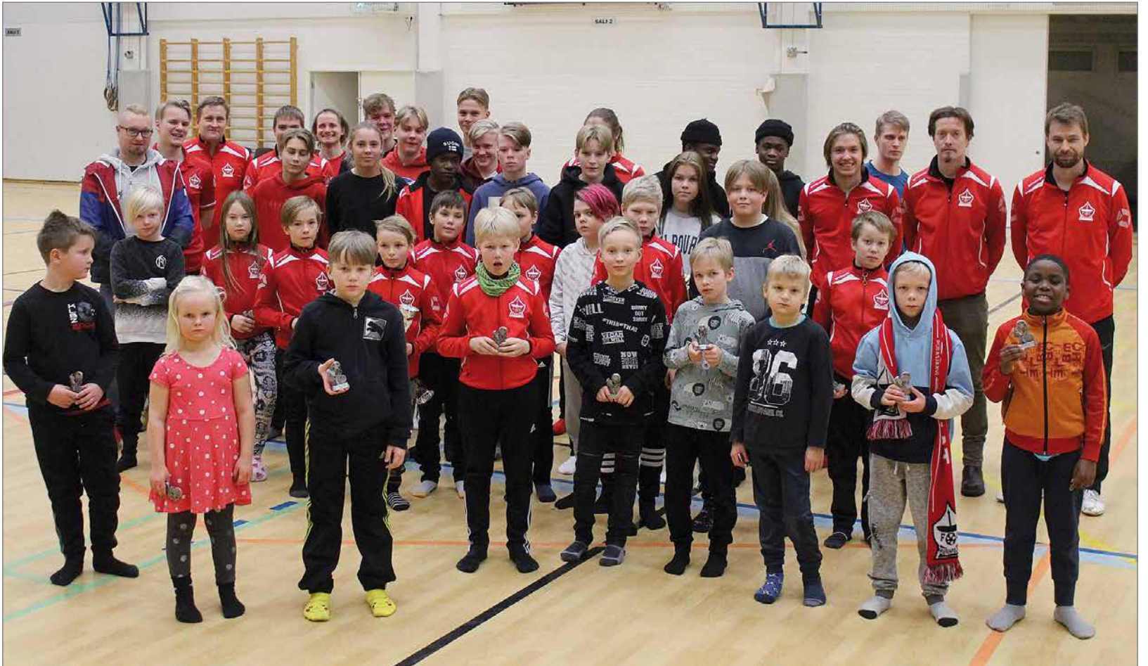
Seuran paikalla olleet palkitut pelaajat yhteiskuvassa.

Päätäjaisissa hymy oli herkässä etenkin pienimmillä palloilijoilla, kun mukanaolosta jalkapalloilijana tai futsal-pelaajana kiiteltiin pokaalin muodossa.