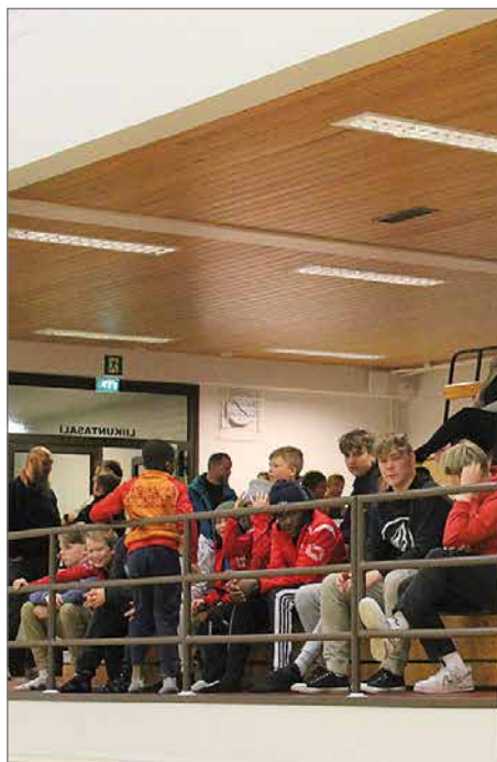
Yleisöä oli jo miesten kauden avausottelun aikana paikalla mukavasti.