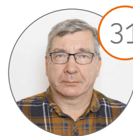
31 Turves Kalevi Yrittäjä Hetejärvi