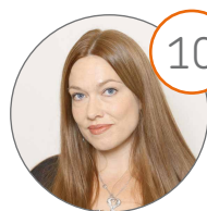
10 Kosamo Henna Maatalousyrittäjä, kirjanpitäjä Pintamo