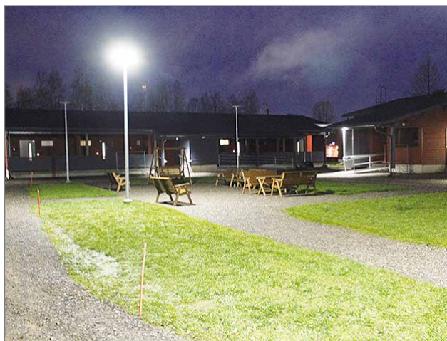
Pappilantien uusien Vanhustentalojen ulkoilueet ja kulkureitit ovat vaarallisia liikkua rollaattorin tai pyörätuolin kanssa irtokivisen sepelipinnan vuoksi.

pinnalla tai edullisemmalla kivituhkalla tai muulla tasaisemmalla pinnoitteella.