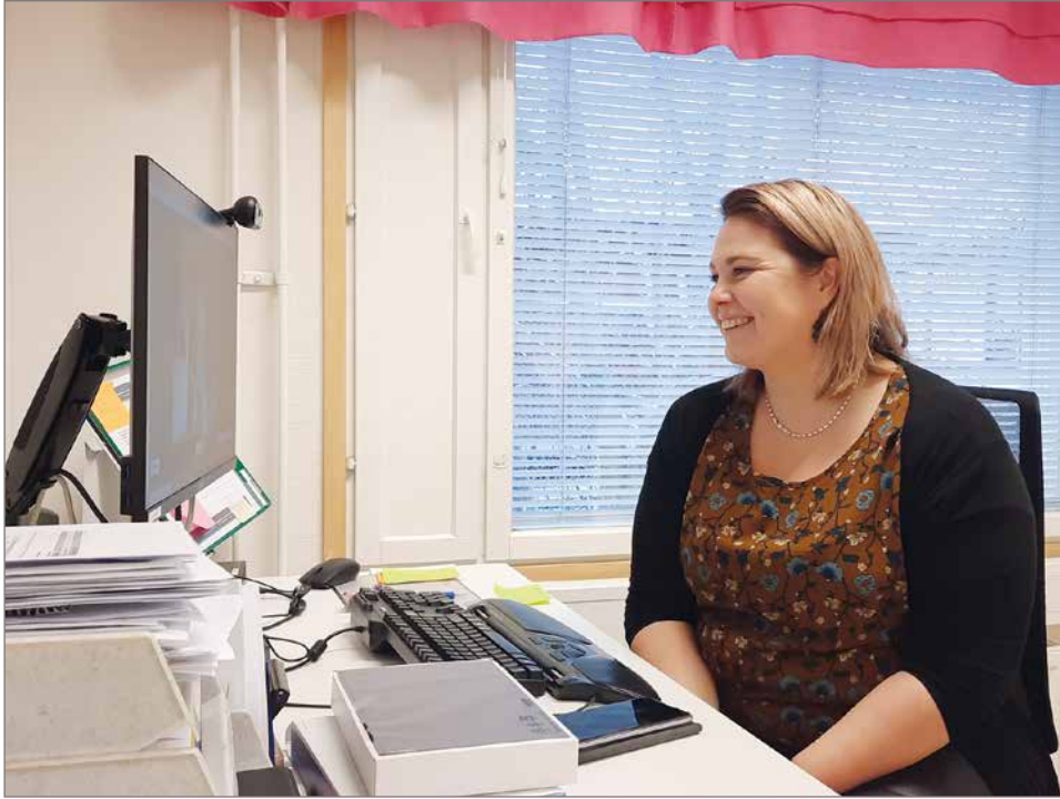
Yhteydenotto asiakkaan kanssa sovitaan päivää ja kellonaikaa myöten sekä, mitä asioita hoitajan kanssa käydään läpi. Tabletti annetaan ikäihmisille tarveharkinnan mukaan.

- Etähoivalla madalletaan kynnystä kotihoi-