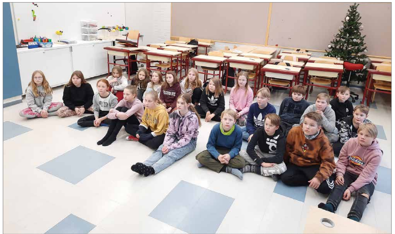
Sankarikoulutusta seurattiin tarkkaavaisesti internetin välityksellä.

- Sankarikoulutuksessa harjoitellaan muun muassa elvytystä ja tutustutaan 112-sovellukseen. Viidesluokkalaisten otollisessa iässä oppimaan näitä tärkeitä kansalaistaitoja