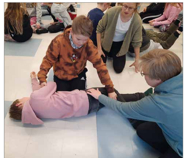
Tajuttoman ihmisen laittaminen kylkiasentoon oli yksi Sankarikoulutuksen käytännön harjoitteista.