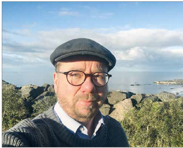
- Minulla on syvä arvostus ja kunnioitus luontoa ja paikallisia kohtaan. Etelä-Suomesta jään kaipaamaan merta. Vietin usein aikaa meren rannalla.

Jo nuorena koin seurakunnan omaksi paikakseeni olla ja tehdä työtä. Olen pohtinut, että työni tarkoitus ja mielekkäisyys löytyvät vain sitä kautta, että Jumala saa minun kauttani tehdä