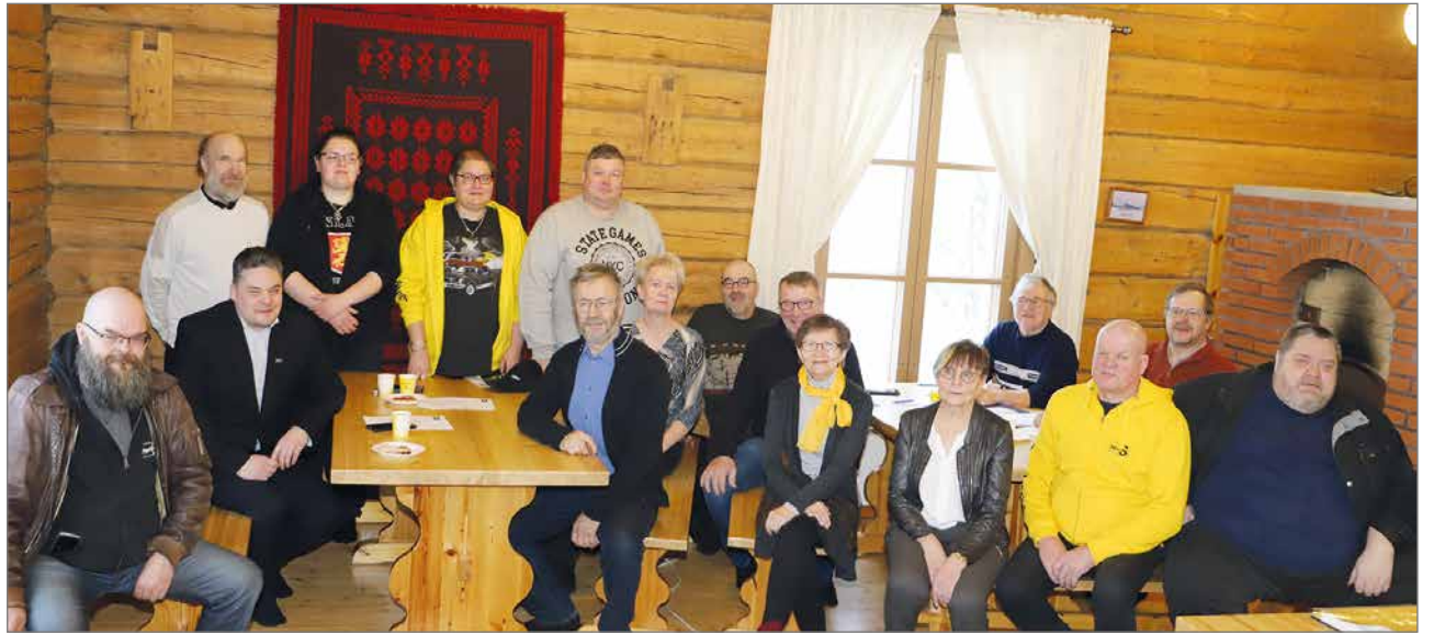
Perussuomalaisten syyskokousväki kokousti Liepeen väentuvassa.

#SEURAKUNTAVAALIT SUOMEN EV.LUT KIRKKO +