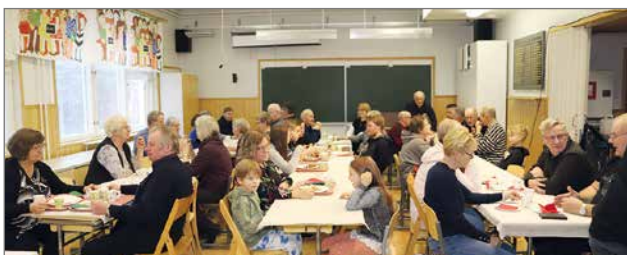
Juhlapeijaisiin osallistui reippaat 100 henkeä.