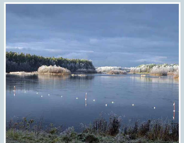
lijoen lumoa.

Tarkasti käyt läpi koko pöydän, mutta ei. Aina se katoaa. Mutta epätoivo pois. Löytyy se yleensä lautasen reunan alta piilosta. Sinne se meni.