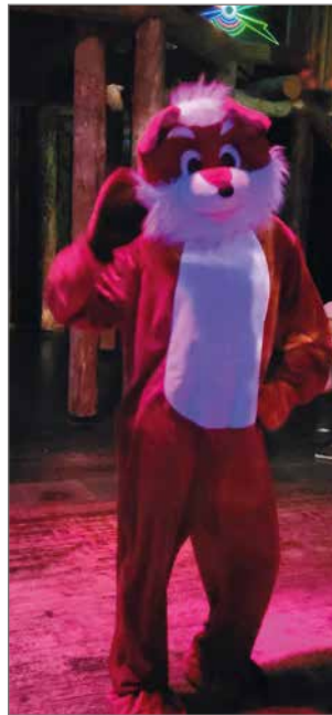
Yhdistyksen oma Sulevi-maskotti tanssitti discossa.