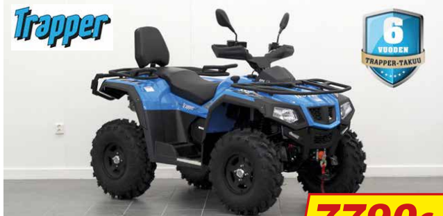
TRAPPER CHASER 550 EFI EPS T3B TRAKTORIMÖNKIJÄ