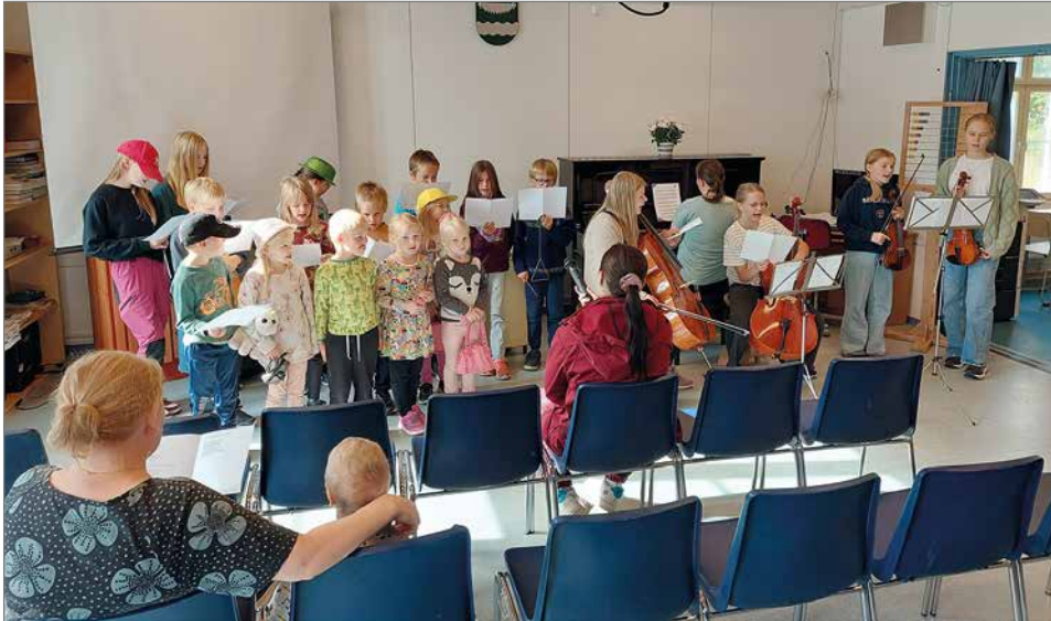
Kylien nuorilla ja lapsilla oli Maalaismarkkinoilla yhteinen laulu- ja musiikkiesitys.

kinoiden ajaksi on vakiintunut elokuun viimeinen lauantai.