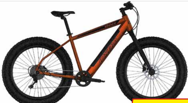
INSERA BRONCO 26" 9V. SÄHKÖFATBIKE

TARJOUKSET VOIMASSA VAIN PERJANTAINA 1.9.