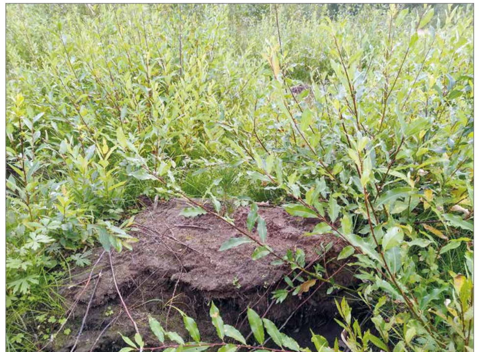
Mätäiden välin oli paju vallannut, kuva samalta kivennäismaan peltokohteelta elokuussa.