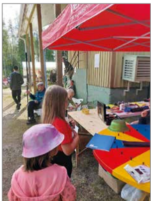
Tarjolla oli myös rulettia ja pika-arpoja.

Kuukasjärven Maalaismarkkinat ovat kolmen kylän, Kelankylän, Kuukasjärven ja Petäjätjärven asukkaiden vuosittainen suuri ponnistus ja varainkeruutahtuma yhteisen kokoontumispaikan, kylätalon ylläpitokulujen kattamiseksi. Kokoavana voimana toimii yhteinen kyläyhdistys Kyläkolmio ry. Maalaismarkkinat aloitettiin aikoinaan Kuukasjärven koulun vanhempainyhdistyksen ja koulun yhteistyönä. Kun koulu lakkautettiin 2013, niin markkinoita jatkettiin perustetun kyläyhdistyksen voimin. Alkuun markkinat olivat keväällä, mutta viime vuosina mark-