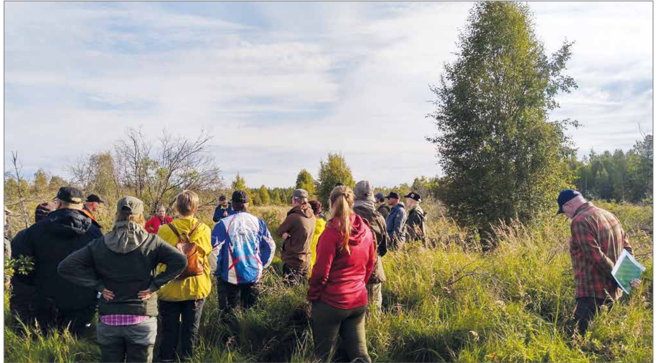
Retkeilijät viljelystä poistuneella peltokohteella, joka ei täyttänyt tukiehtoja ja saa näin hiljalleen metsittyä itseksensä.

-Pumppaamisen päätyttyä on Iso-Ahmansuon länsiosaan muodostunut noin 20 hehtaarin kosteikko. Läheisen ojitusalueen vedet ohjataan nykyisin kosteikolle, joka hidastaa veden virtausta ja kiintoaineen kulkeutumista, kertoivat