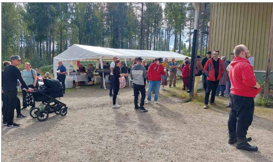
Markkinavieraita helli kaunis aurinkoinen sää ja kävijät viihtyivät hyvin koko päivän ajan.