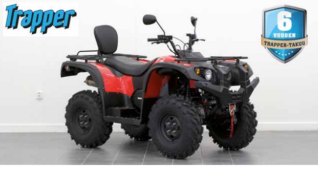
500 T3B TRAKTORIMÖNKIJÄ

PYÖRÄT LUOVUTETAAN SÄÄDETTYINÄ JA TÄYSIN AJOVALMIINA.