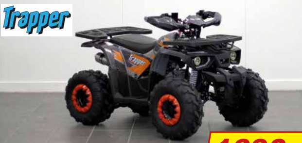
TRAPPER HUMMER 125 LASTEN JA NUORTEN MÖNKIJÄ

PE 1.9. TRAKTORIMÖNKIJÄN OSTAJALLE: LUMILEVYPAKETTI KAUPAN PÄÄLLE!