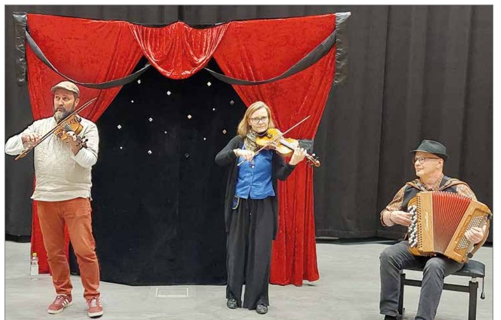
Kansanmusiikkiyhtye Rällä musisoi Hirsikartanossa ja Pirtissä.