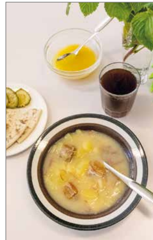
Perinteinen kuivalihavelli maistui Sarakylän maa- ja kotitalousnaisten valmistamana.