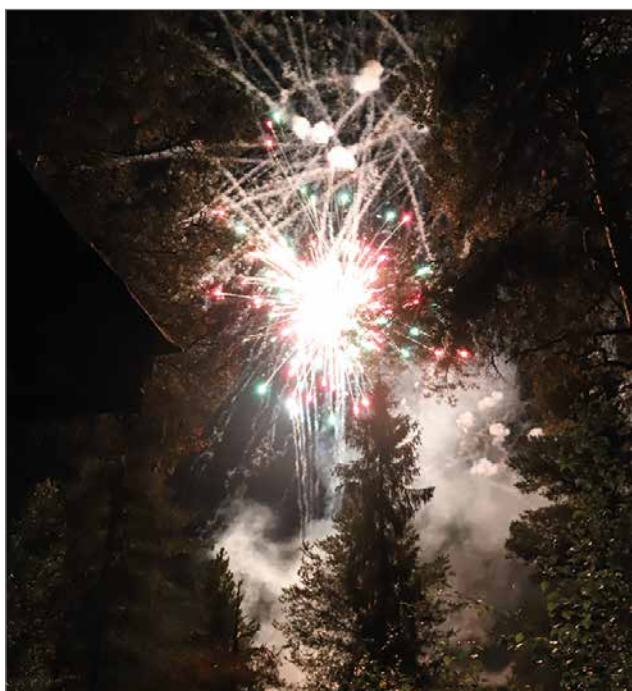
Kesäkauden päättänyt komea ilotulitus oli ennen puolta yötä kahdessa eri paikassa.