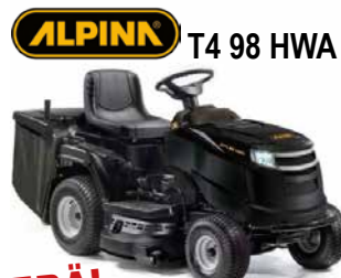
ALPINK T4 98 HWA