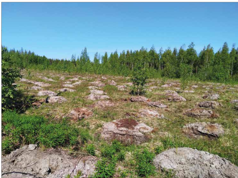
Männyn taimet vasta istutettuina kivennäismaapellon laikkumätäissä kesäkuussa.