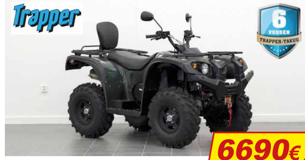
TRAPPER 500 T3B EPS TRAKTORIMÖNKIJÄ