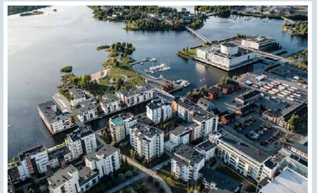
Elokuinen kuva Pohjolan Valkeasta kaupungista kuumailmapallostalla kuvattuna.

lukijoiden palaute ja jutut: vkkmedia.fi