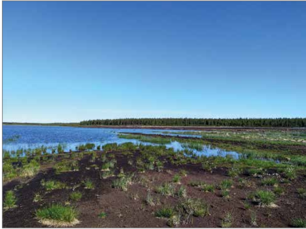
Iso-Ahmansuon kosteikkoalueella viihtyvät niin linnut kuin porotkin.

Joutoalueiden metsitys ja metsitystuki ovat herättäneet paljon kiinnostusta Pohjois-Pohjanmaalla. Metsitystukea on myönnetty maatalouskäytöstä poistuneiden peltojen ja turvetuotannosta vapautuneiden alueiden metsittämiseen. Tukea on myönnetty kaikkiaan 5300 hehtaarille ja siitä suurin osa on Pohjois-Pohjanmaalle.