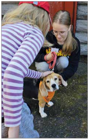
Paikalla kierrelleet koirakaverit saivat paljon rapsutuksia.