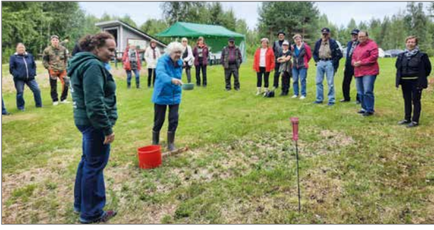
Siurualla seurataan, kuinka vedenheitto onnistuu.