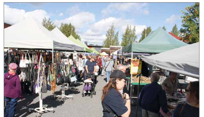
Tori täyttyi iloisista asiakasilmeistä lauantaina, kun Suurtori-päivän kauppiat toivat myytäviä tuotteitansa tarjolle.

Asiakkaat olivat mielis-sään tällaisesta yllätyksestä