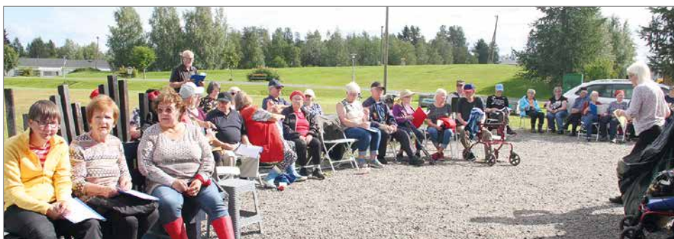
Kahden yhdistyksen jäsenistö nautti ja iloitsi aurinkoisesta iltapäivän hetkestä Rajamaanrannan laavulla.