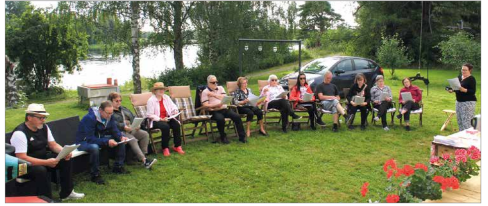
Entiset nuoret lauloivat omien nuoruusvuosien aikaisia Finnhitsejä.

myös pientä suuhun panta-vaa ja isäntäpari esitteli uu-distunutta, monelle kunnan-talon tai päiväkodin ajoilta tutummaksi tullutta pihapiiriä sekä kierrätysteemalla re-montoituja sisätiloja.