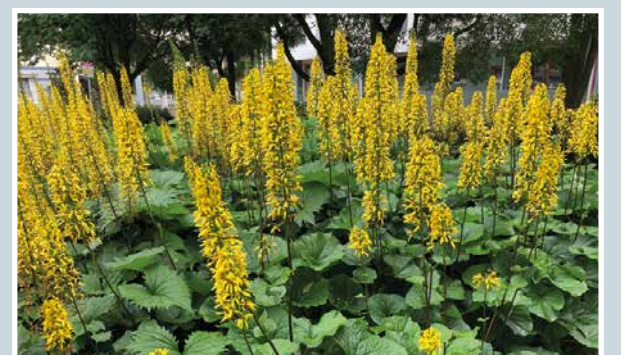
Kesän kultahiput.

Martti Kähkönen lukijoiden palaute ja jutut: vkkmedia.fi