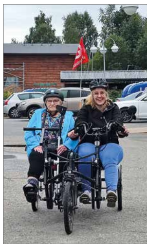
Vieripyörällä sujuvasti tapahtumapaikalle.