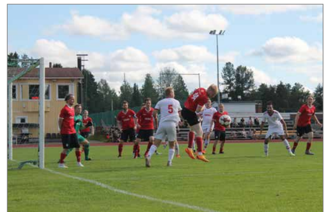
Valkoisissa pelaava Villan Pojat aiheutti Kurenpojille kauden ensimmäisen kotitappion.

Kurenpoikien osalta ensi lauantaina kotiottelulla kajaani- laista KaPaa vastaan. KaPa