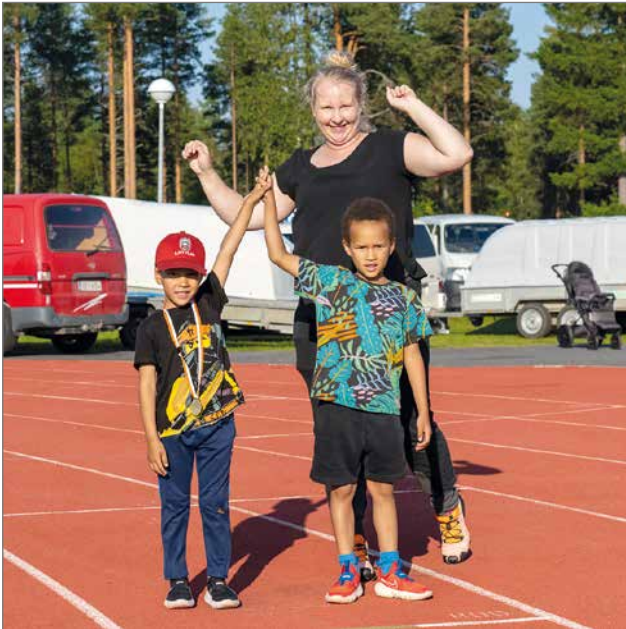
Yhteistä iloa äidin ja poikien kesken.