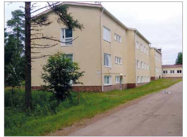
Helmikodista on entisillä työntekijöillä paljon muistoja.

Hänkö, joka oli Helmikodilla, mutta niin lähellä meitä.