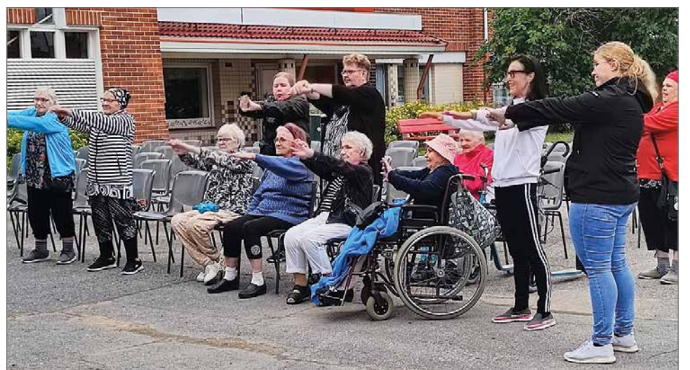
Torilavalla oli tarjolla jumppaa, visailua sekä yhteislaulua nuorten veisujen parissa.