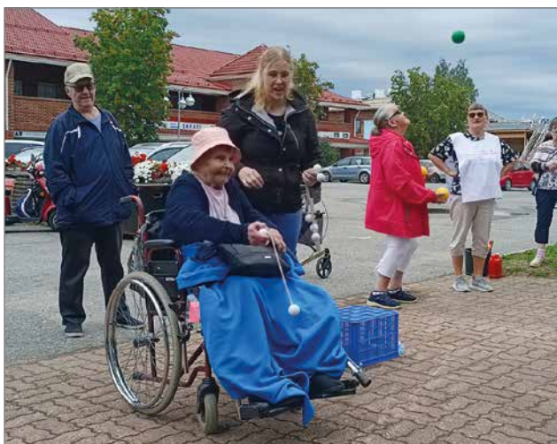
Narugolfin heitossa kokeiltiin silmän ja käden koordinaation tarkkuutta.