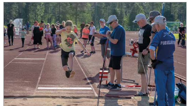
Pituushyppyä siivitti mukavan lämmin myötätuuli.