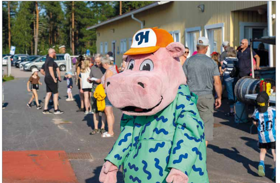
Hippo oli paikalla yleisurheilukentän laidalla tervehtimässä osanottajia.