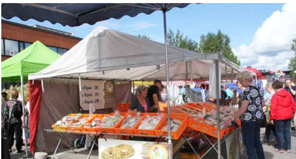
Tunnelmaa Pudasjärven torilla heinäkuun alussa.