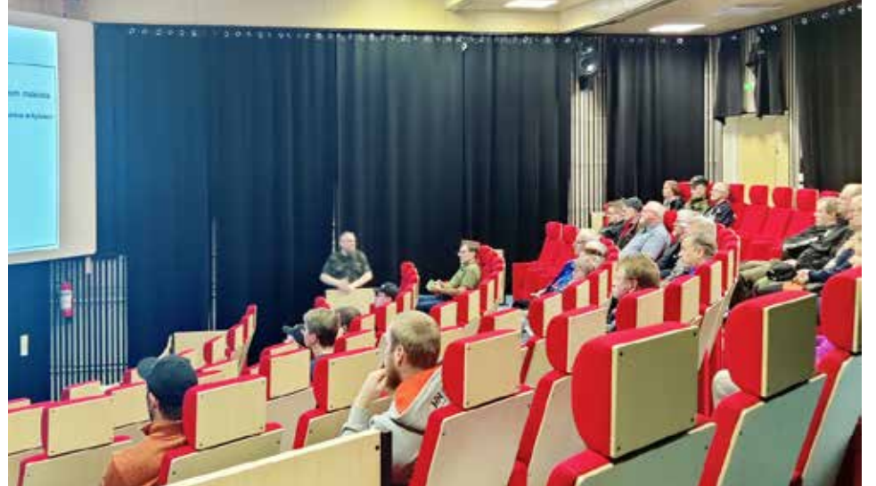
Jatkokoulutukseen jo hirvenhaukkukokeen palkintotuomarin oikeuden omaaville henkilöille osallistui Pohjantähdessä noin 30 henkilöä.