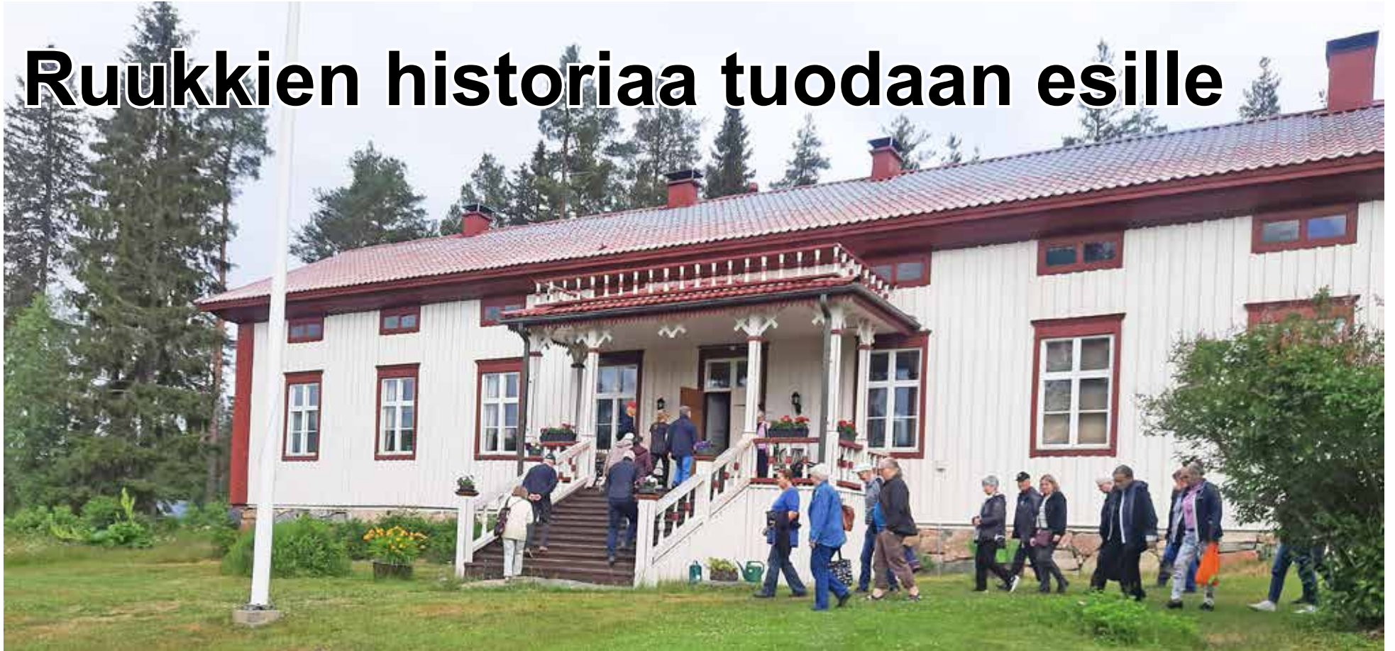
Hirvaskosken Kartano Pudasjärvellä. Kuva Hirvaskosken kartanosta on otettu Oulun sukututkimusseuran vierailun aikana 1.7.2023.