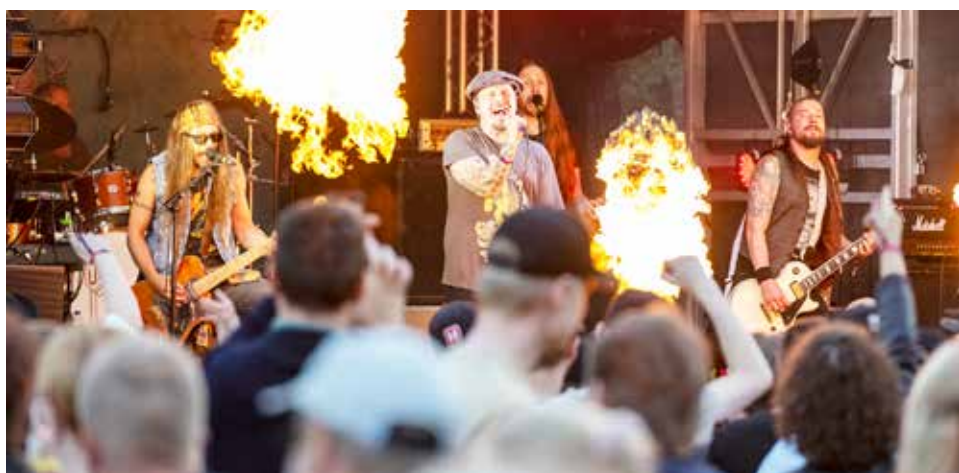
Uniklubin energinen lavashow innosti yleisöä Jongulla.