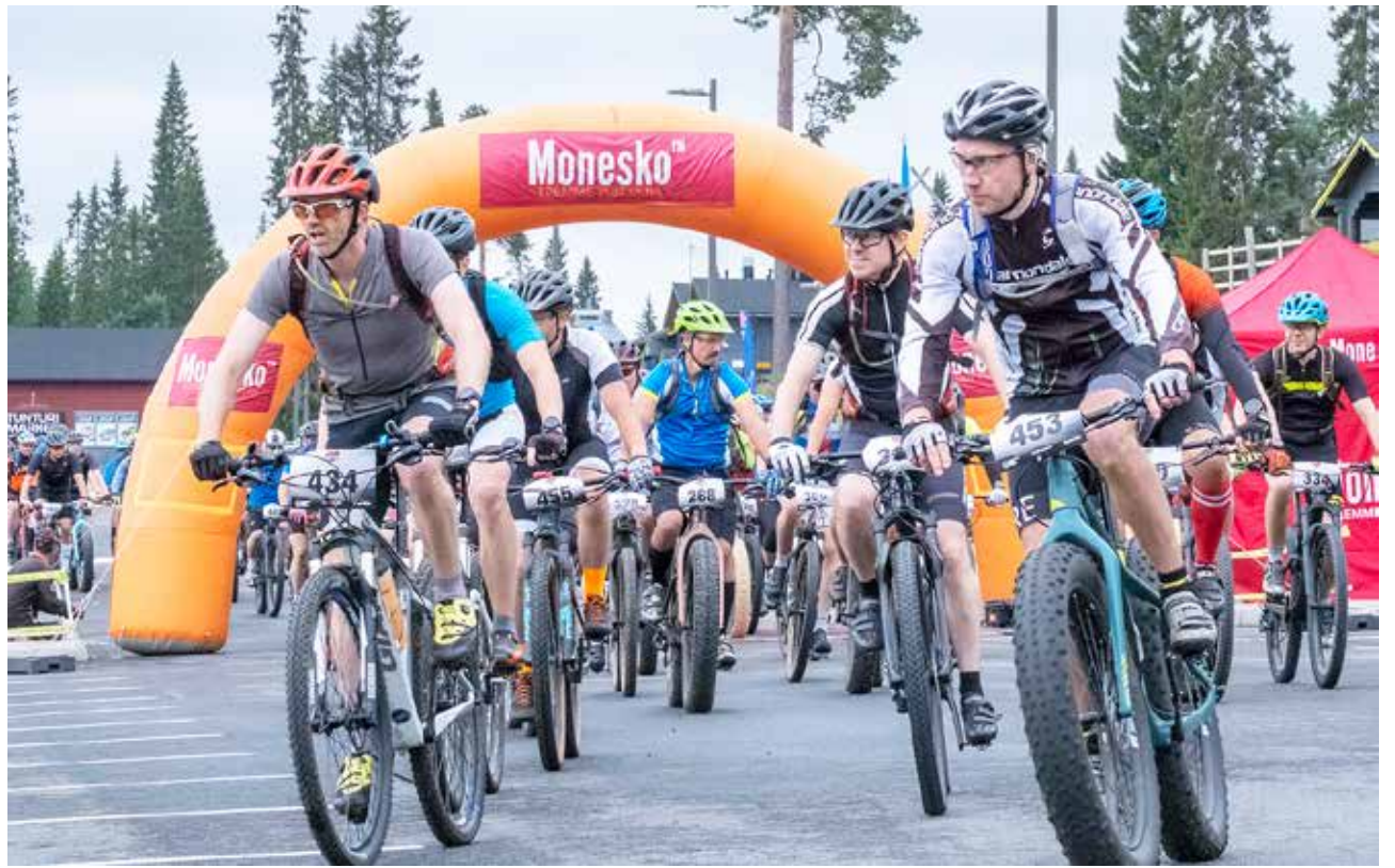
Lähtölaukauksen jälkeen kiihdytetään kohti Syötteen maastoreittejä.