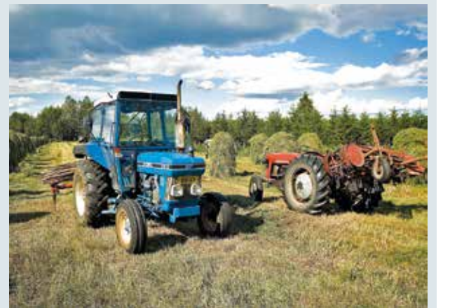
"SADE ON HYVÄKSI MEIDÄN PERUNOILLEMME JA NAAPURIN HEINILLE!"

lukijoiden palaute ja jutut: vkmedia@vkmedia.fi