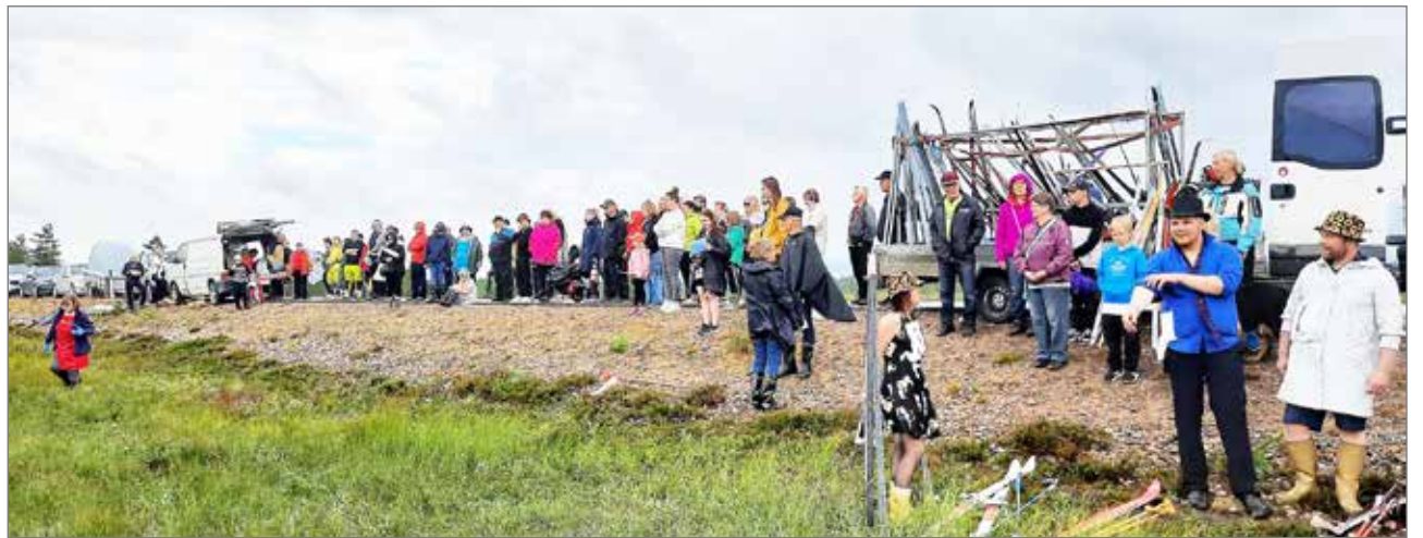
Lopulta sää suosi järjestävän tahon vaivannäköä ja yleisöä Kapustasuon hiihtokisoissa.

vaikka osallistujia oli viime vuoteen vähemmän. Riemukasta! Ihmiset näyttivät nauttivan suossa rypemisestä, se on aina kiva merkki. Oli mukavaa huumoria. Konttilan Erän hirvituvala meillä on järjestettynä kilpailijoille ja huoltajille sauna iltapaloinen.