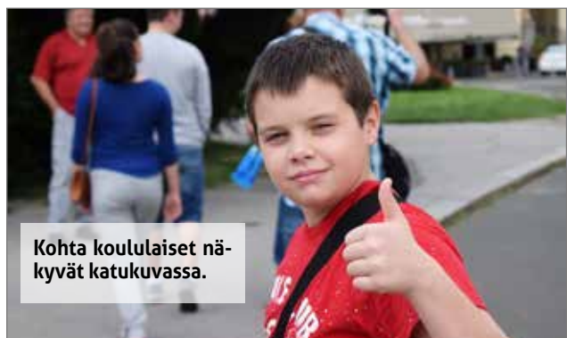
Kohta koululaiset näkyvät katukuvassa.