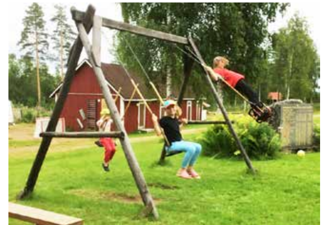
Keinut olivat monien kerholaisten suosiossa.