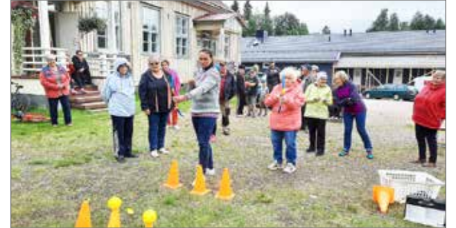
Syötteellä oli tarkkakätisiä jousiampujia.