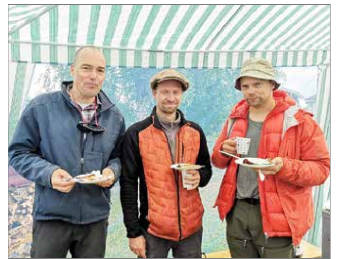
Nämä miehet tulivat taivaan tuulista herkuttelemaan makosilla letuilla.