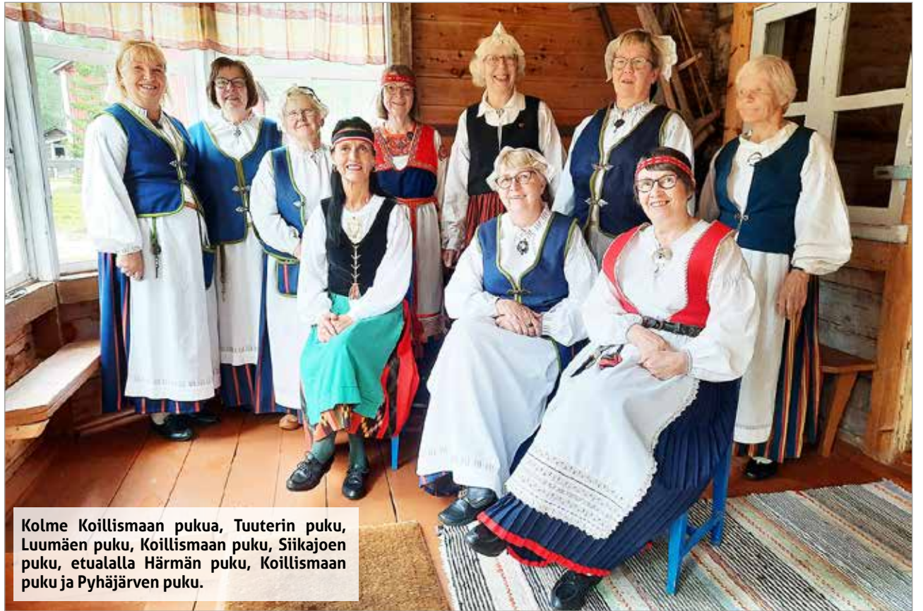
Kolme Koillismaan pukua, Tuuterin puku, Luumäen puku, Koillismaan puku, etualalla Härmän puku, Koillismaan puku ja Pyhäjärven puku.