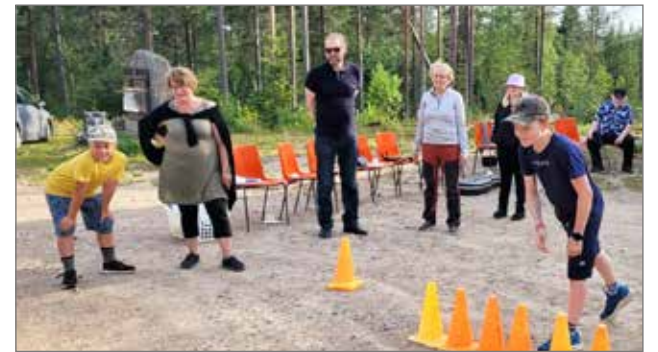
Korpisella seurattiin tarkkaavaisena mihin mölkkäkapula osuu.