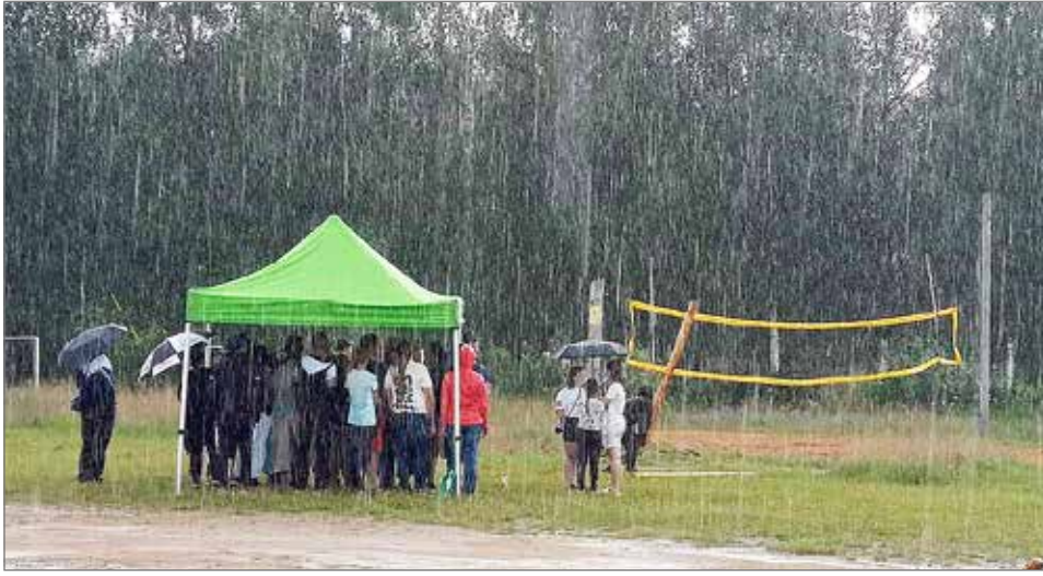
Pöllin SM-kisat käytiin raikkaassa kesäsäässä.