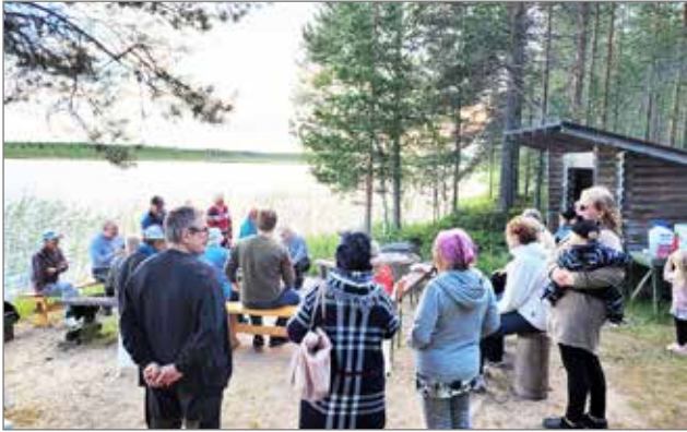
Marikaisjärvellä vietettiin iltaa virkistävissä tuulessa.