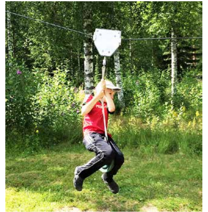
Vaijerissa kerholaiset pääsivät nauttimaan vauhdin hurmasta.