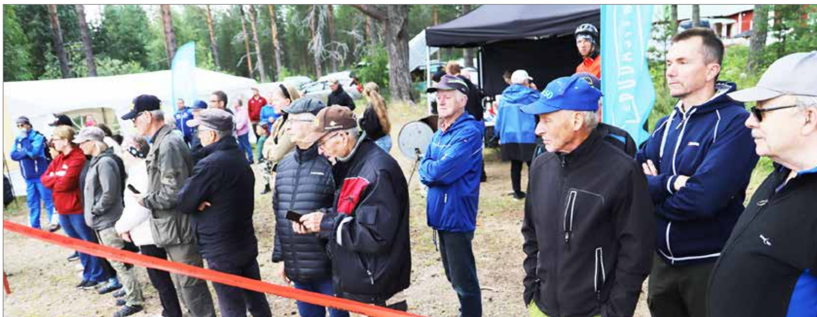
Yleisöä oli joka päivänä paikalla seuraamassa kisa. Eniten sunnuntai-iltana finaalin palkintojen jaon aikana.