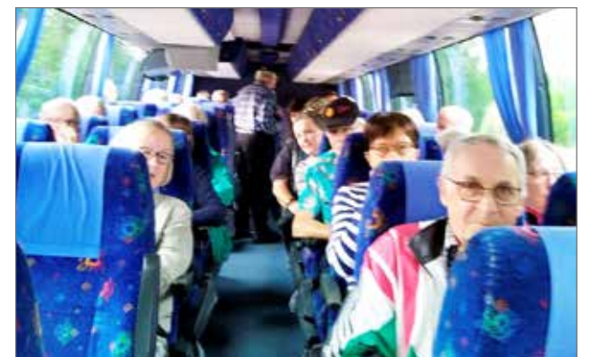
Linja-autossa oli tunnelmaa ja visaisia kysymyksiä.