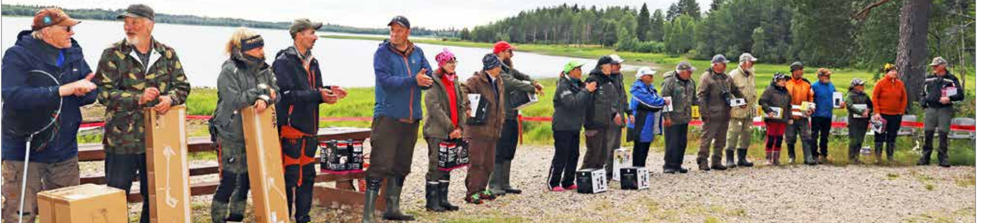
Finaalissa 4-25 sijoittuneet pilkkijät palkintoineen Havulanrannassa.