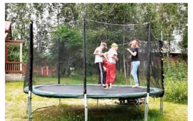
Trampoliini houkutteli kerholaista pomppimaan sekä leikkimään erilaisia leikkejä.