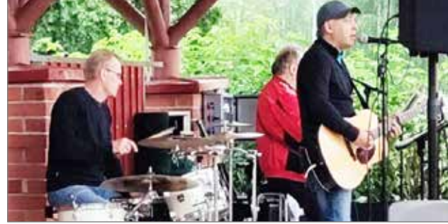
Trio Vauhko Varsa esiintymässä.

Tämän kesän viimeistä ohjelmallista toripäivää Pudasjärvellä vietettiin torstaina 4.8. Torilla oli sateisesta säästä huolimatta muutama myyjä ja enimmillään yli neljäkymmentä torin tapahtumiin osallistujaa.