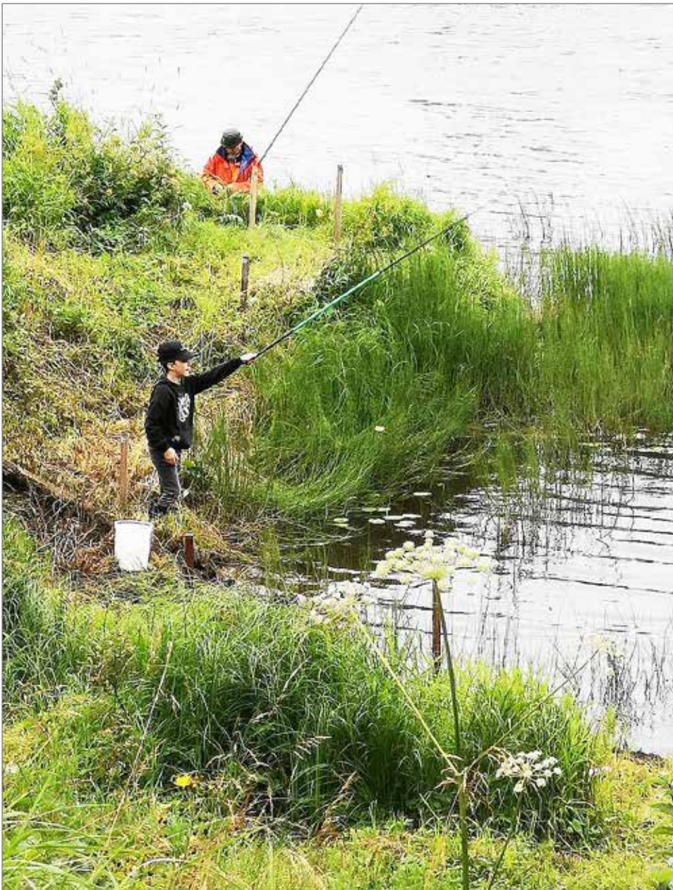
Tärkeintä onkikilpailussa taitaa olla hyvät eväät? No, tulihan sitä kalaakin!