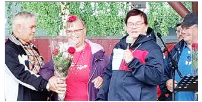
Kiitoskukkasia ojennettiin puolin ja toisin.