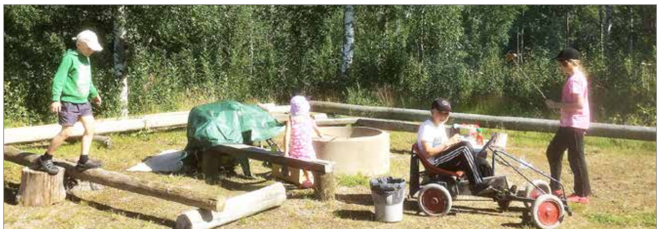
Kesäkerho huipentui elokuun alussa järjestettyyn makkaranpaistopäivään.