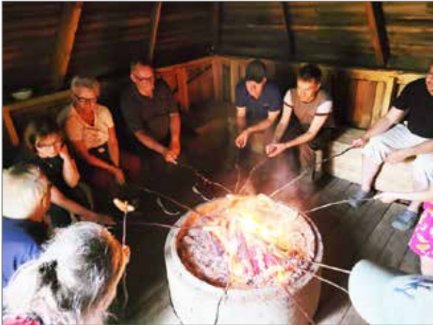
Metsälän kylätalon kodassa tunnelmoitiin makkaranpaiston äärellä.

Seurakunnan nuotioilloja pidettiin yhteistyössä kylien kanssa heinä- ja elokuussa. Nuotioillat kokosivat kylän väkeä, lomalaisia ja vapaa-ajan asukkaita enemmän kuin muutamana edellisvuotena. Tänä kesänä pidettiin 12 nuotioiltaa, joihin osallistui kaiken kaikkiaan lähes kolme sataa henkeä. Ikäjakama nuotioilloissa on "vauvasta vauriin", mutta keski-ikä taitaa lähennellä kuuttakymmentä vuotta.