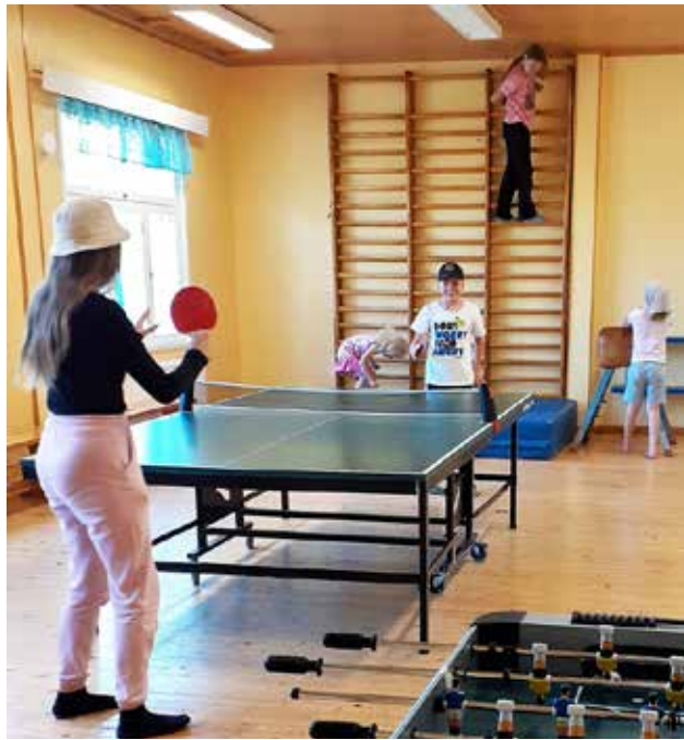
Kerhossa lapset pääsivät pelaamaan monenlaisia pelejä yhdessä toistensa ja kerho-ohjaajien kanssa.