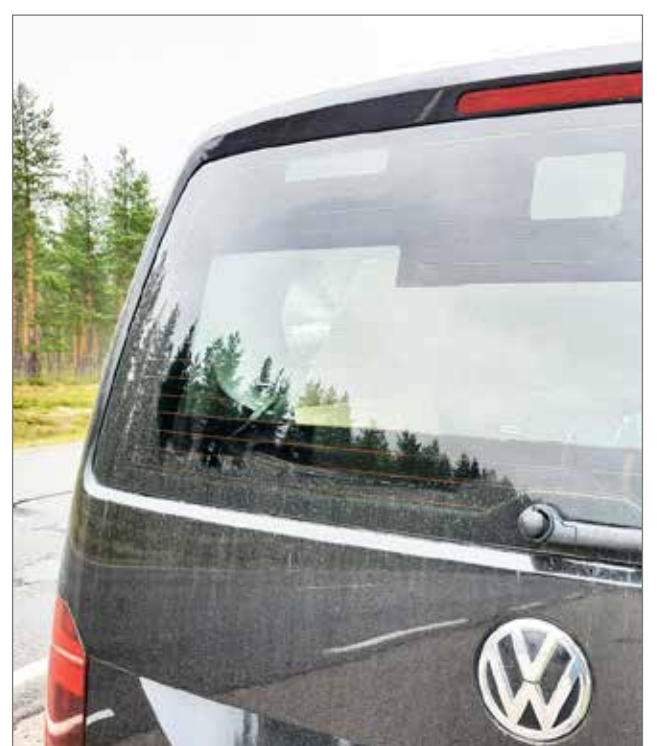
Kamera ehtii ottamaan letkan jokaisesta autosta kuvan, jos nopeutta on liikaa.