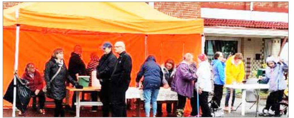
Pudasjärven Eläkeläiset pitivät lettukahvilaa.