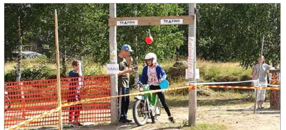
Pistelinkosken moporallin jännittävin hetki. Kuva vuoden 2018 kisasta.