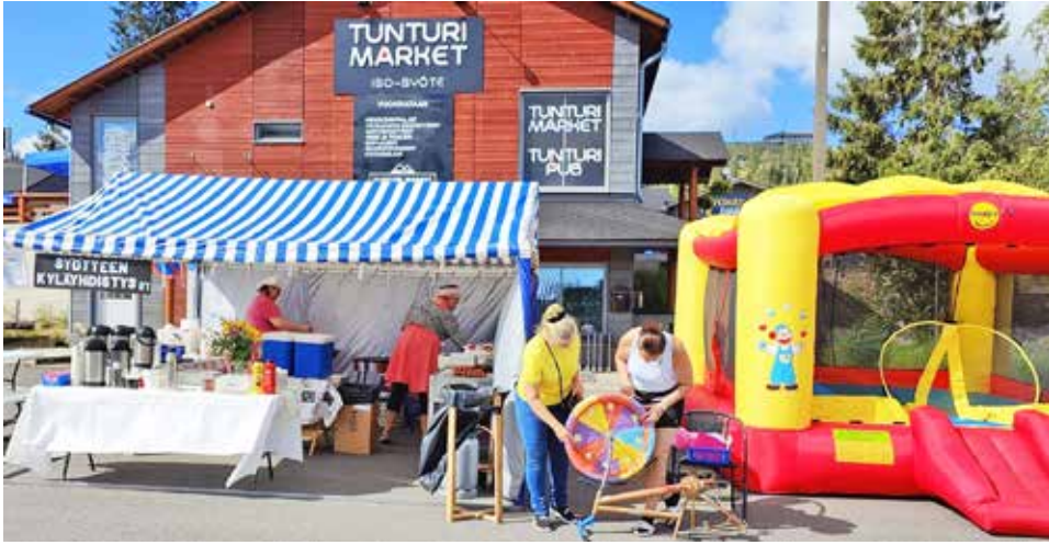
Kyläyhdistys oli mukana Syötteellä tapahtuu -päivässä rinteiden juurella olevalla parkkipaikalla