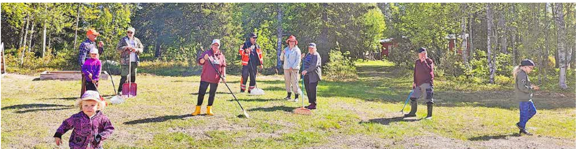
Avoimet kylät päivää vietettiin kesäkuussa kylätalon pihalla ja kodalla.