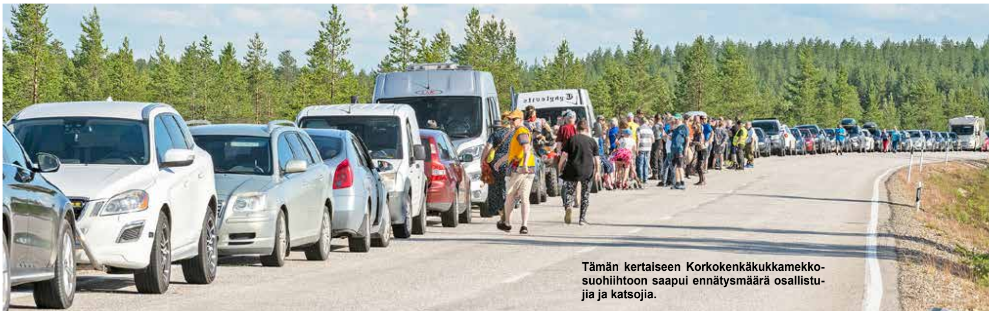
Tämän kertaiseen Korkokenkäkukkamekko-suohiihtoon saapui ennätysmäärä osallistujia ja katsojia.