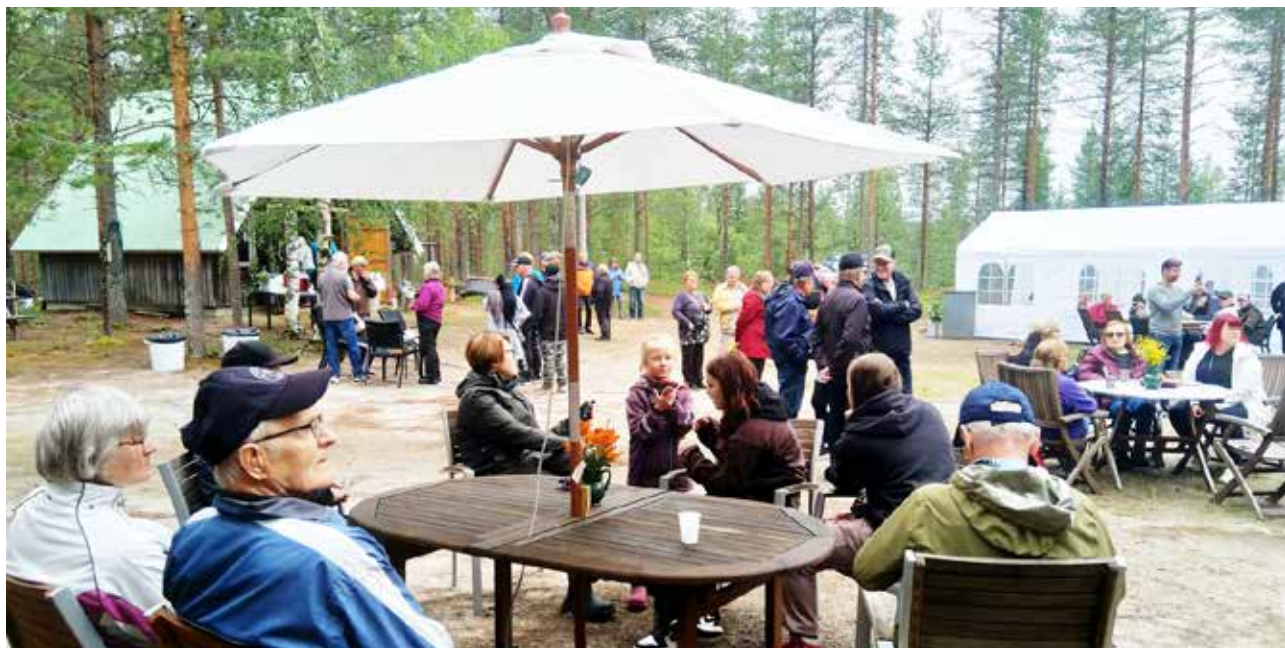
Kyläjuhlan pitopaikaksi valikoitui luontevasti metsästysmaja Ohtapirtti, joka on jo vuosikymmeniä toiminut myös hirvipeijaisien pitopaikkana.