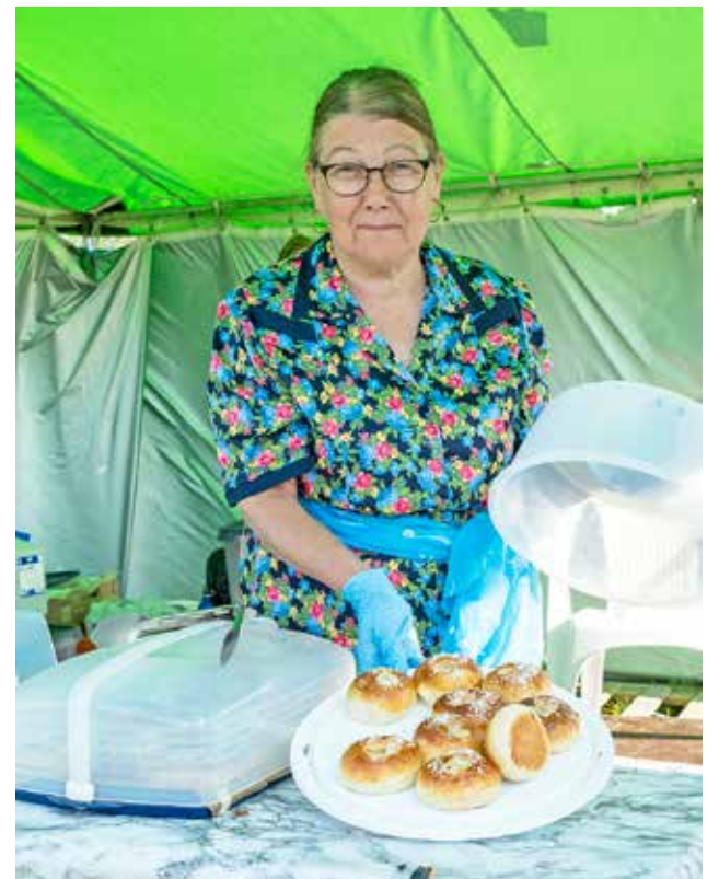
Siuruan Kylä ry:n teltalla pullat olivat tuoreita ja palvelu pelasi.