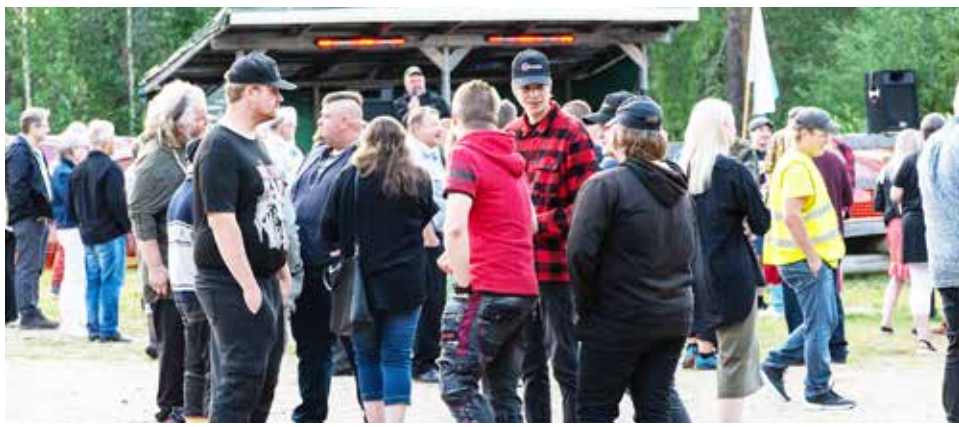
Sikajuhlien yleisö on nuorentunut vuosi vuodelta. Vanhempi väki viihtyi sisätiloissa tanssin pyörteissä.