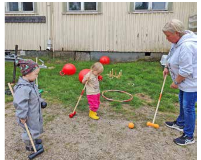
Pienimmätkin osallistajat tykkäsivät pelata Kesäpäivässä.