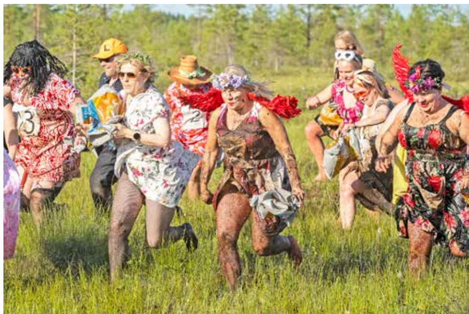
Naisten takaa-ajo -kisa sujui vauhdikkaasti alusta loppuun