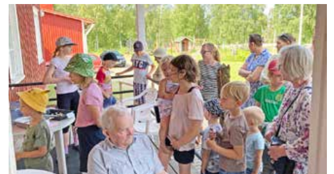
Onnenpyöräytys oli suosittu ja piti välillä jonottaakin.