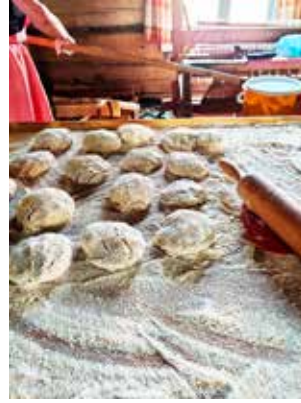
Taikinapallot odottamassa leivontapäivän leipojia.

LauluMatka konsertoi perjantaina illalla Kurkissa Hyvän olon keskuksessa. Vauhdikas ja nostalginen sikermä vanhoja tuttuja ja ikivihreitä lauluja niiden alkuperäisillä kielillä ja olihan siellä mukana myös muutama uusi tuttavuus. Esiintyneiden kappaleiden suomenkaiset näkyivät lavalla olleella näytöllä. Esiintyjät jutustelivat ja kertoivat kappaleiden synnystä ja historiasta. Noin parin tunnin konsertin väliajalla Siuruan