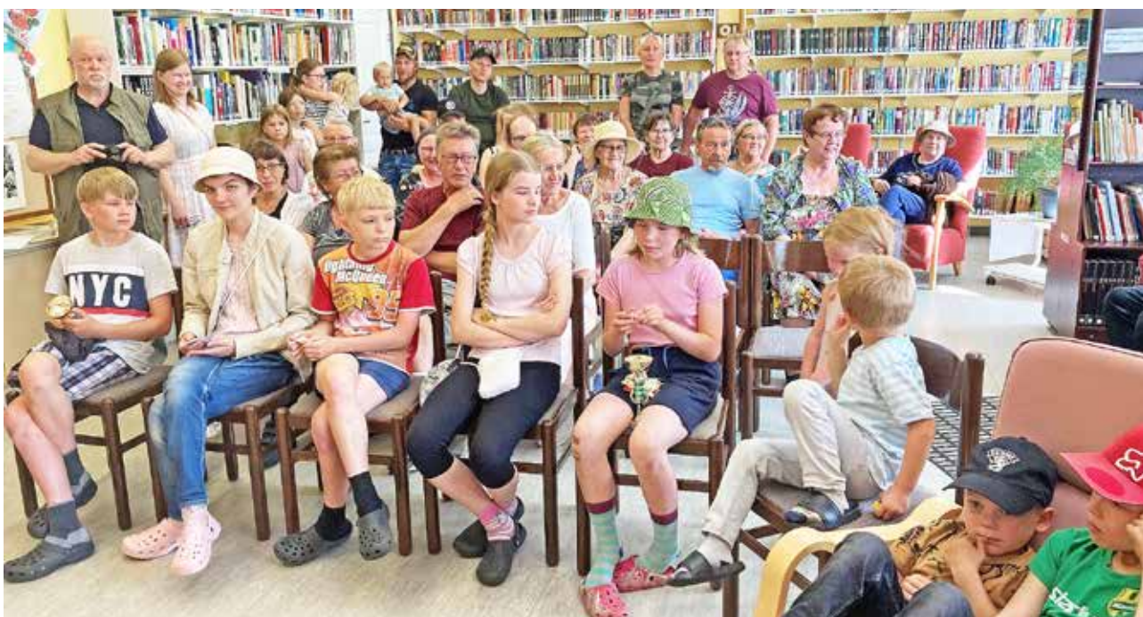
Lopuksi kokoontuttiin sisälle arvontaan ja palkintojen jakoon.