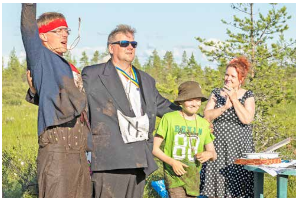
Team Otsanauha oli oman sarjansa voittajajoukkue.