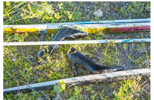
Kisavälineet, sukset ja korkokengät.