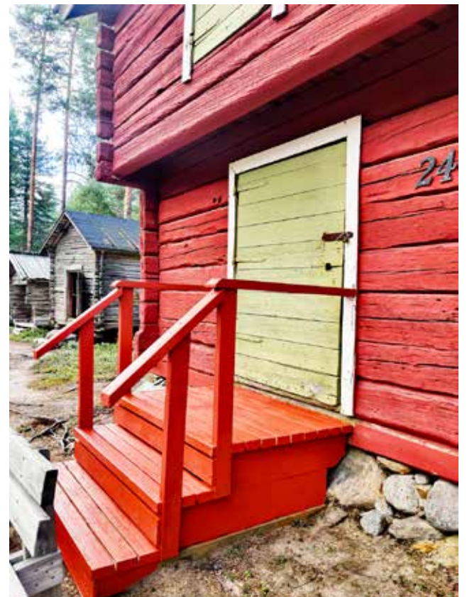
Punamullalla maalatut portaatin.