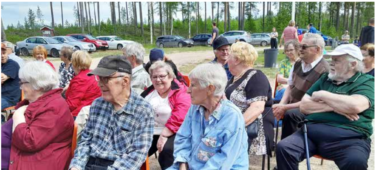
Kaunis aurinkoinen sää helli Korpisen kylätapahtuman väkeä, joita oli tapahtumassa mukana noin 60 henkilöä.