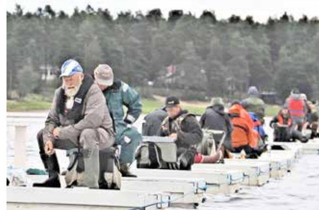
Osallistujia tänä vuonna saman verran, kuin viime kesän kisassa, jonka finaalista on tämä kuva.