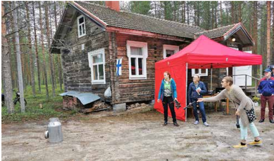
Tonkkumi oli yllättävän haastava laji.

Yli-Kuussa vietettiin lauantaina 22.7. kaikkien aikojen ensimmäistä kyläjuhlaa, joka oli yleisömenestys epävakaisesta säästä huolimatta. Paikalla oli vieraskirjankin mukaan noin 90 henkeä, ja koska kaikki eivät olleet huomanneet kirjoittaa nimiään vieraskirjaan, voidaan hyvällä syyllä olettaa sadan hengen rajapyykin rikkoutuneen selvästi. Suuri osallistujamäärä oli järjestäjillekin iloinen yllätys, varsinkin kun ottaa huomioon, että viime aikoina on useita kesätapahtumia jouduttu perumaan vähäisen osallistumisen takia.