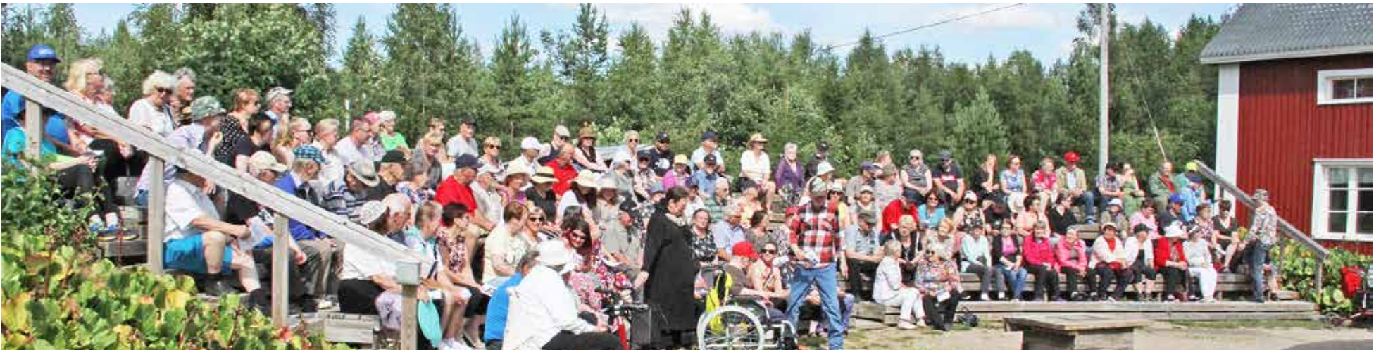
Koskenhovin katsomo oli viimeistä paikkaa myöten täynnä heinäkuuisena sunnuntaina.