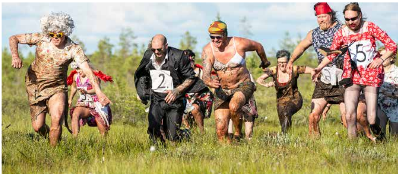
Kilpailuun osallistui sekä miehiä että naisia. Menossa miesten takaa-ajo -lähtö.