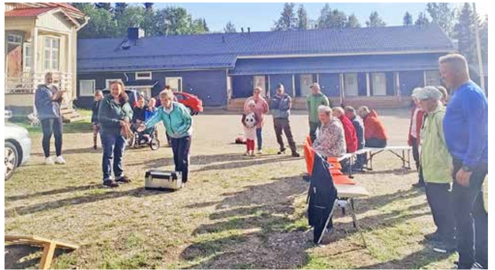
Kettingin heitto kiinnosti seurakunnan nuotioillassa.

Syötteen entisten ja nykyisten asukkaiden sekä mökkiläisten tapaaminen Syötteen kesäpäivä oli viime lauantaina 22.7. Juhlapäivän kunniaksi nostimme Suomen lipun salkoon ja kylätalolle saapui vajaa sata osallistujaa. Sääennusteet lupaili viikon jokaiselle päivälle sadekuuroja, mutta jälleen