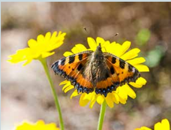
KESÄN VÄRILÄIKKÄ: PERHONEN.

Martti Kähkönen lukijoiden palaute ja jutut: vkkmedia@vkkmedia.fi