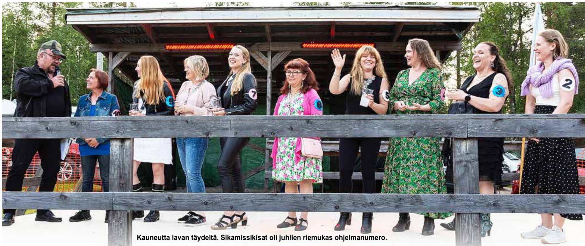
Kauneutta lavan täydeltä. Sikamissikisat oli juhlien riemukas ohjelmanumero.

Puhoskylän iloisilla Sikajuhlilla nautittiin kesäyöstä - leikkimielinen ohjelma ja tanssin taika nostivat hymyn huulille Puhoskylän suurin ja kaunein tapahtuma Sikajuhlat keräsi suuren joukon innostunutta yleisöä lauantaina 15. heinäkuuta. Onnistuneen juhlan tunnelmaa kehuivat sekä nuoret että vanhat.