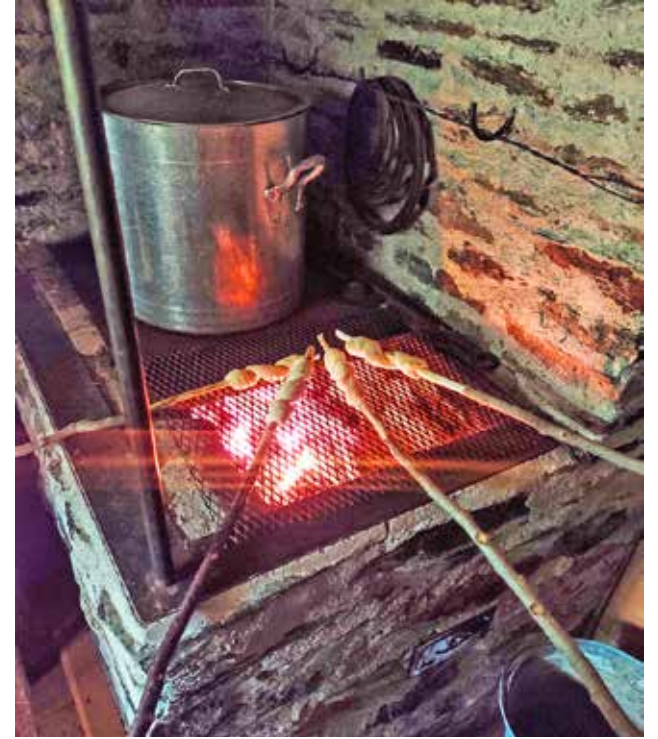
Tikkupullan paistoa lasten päivässä.