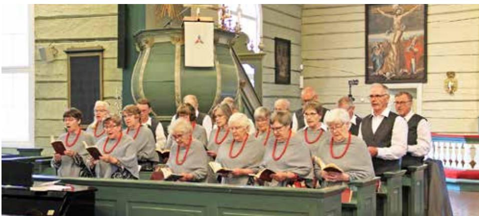
Eläkeliiton Pudasjärven yhdistys ry:n Kööri lauloi sekä messussa että kotiseutujuhlassa.