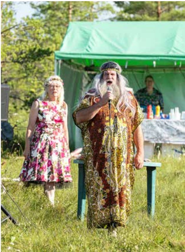
Maamme-laulu kajahti yhteisesti Siuruan Kapustasuolla.