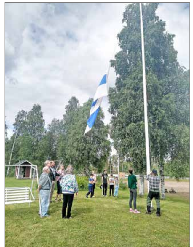
Kesäpäivät aloitettiin Suomenlipun nostolla.