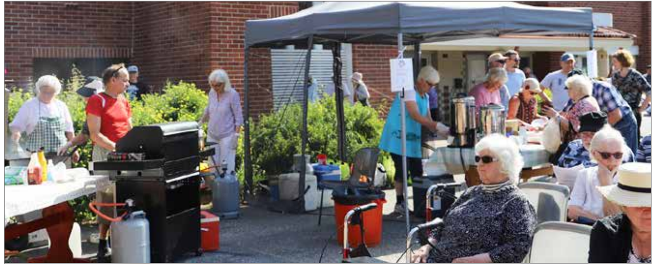
Pudasjärven Syöpäkerhon kahvilateltassa grillimakkarat, kahvit ja muurinpohjaletut kävivät hyvin kauppansa.