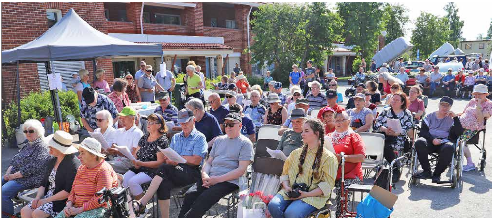
Kotiseutuviikkoon kuuluvassa torikonsertissa ja yhteislautilaisuudessa oli hyvin yleisöä. Taustalla näkyy myös peräkärkykirppiksen myyntipisteitä.