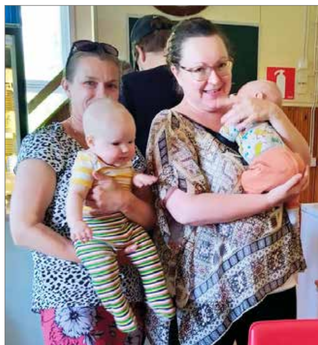
Ensi vuonna pelit jatkuvat. Uudet pelaajat ottavat tarkkoina oppia tulevista koitoksista. "Vapiskoon Etelä-Suomi – täältä tullaan!"