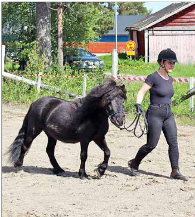
Poni oli esittelyn pienin.