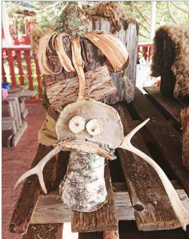
Myntse-peikko miettii elämän tarkoitusta.