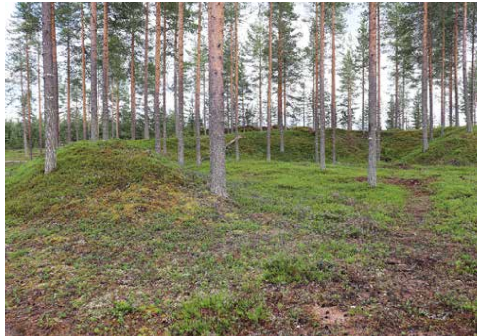
Maavalleina erottuva lentokoneen sirpalesuoja Jyrkkäkosken ulkoilun alueella.