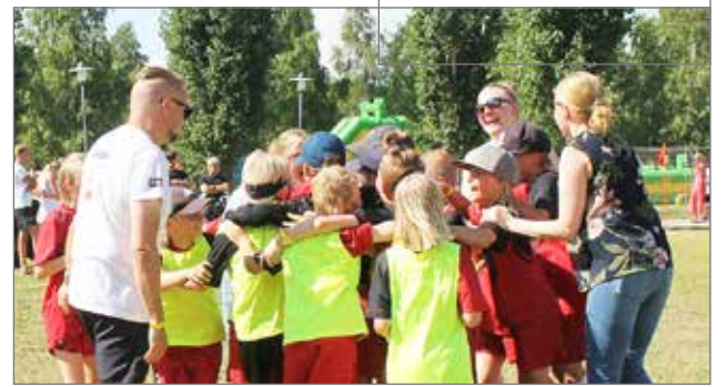
Riemu oli katossa P9 joukkueen ottaessa historiallisen ensimmäisen voittonsa. "Voitto!Voitto!Voitto"-huudot raikuvat vielä linja-autossa.