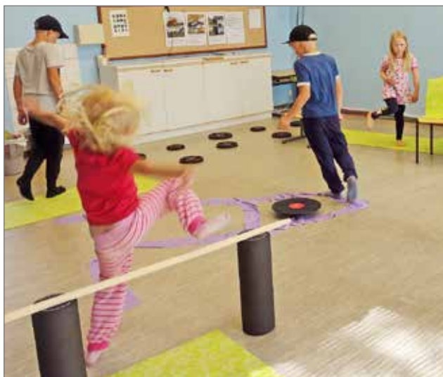
Lasten temppuradalla kävi vilske ja vilinä.