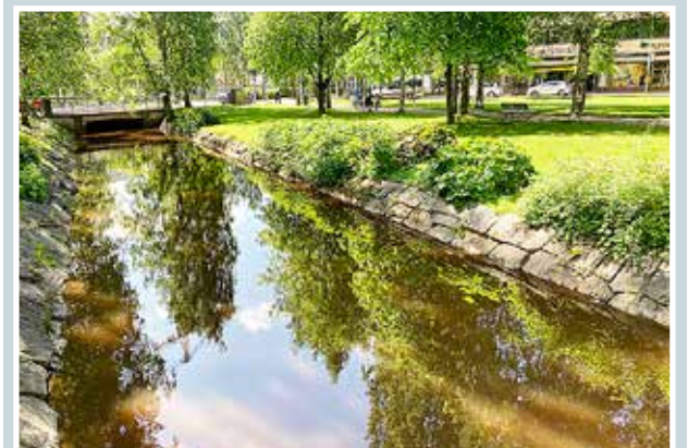
KAUPUNGIN KESÄÄ.

lukijoiden palaute ja jutut: vkkmedia.fi