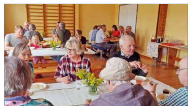
Lohikeittolautasten äärellä päästiin vaihtamaan kuulumisia.