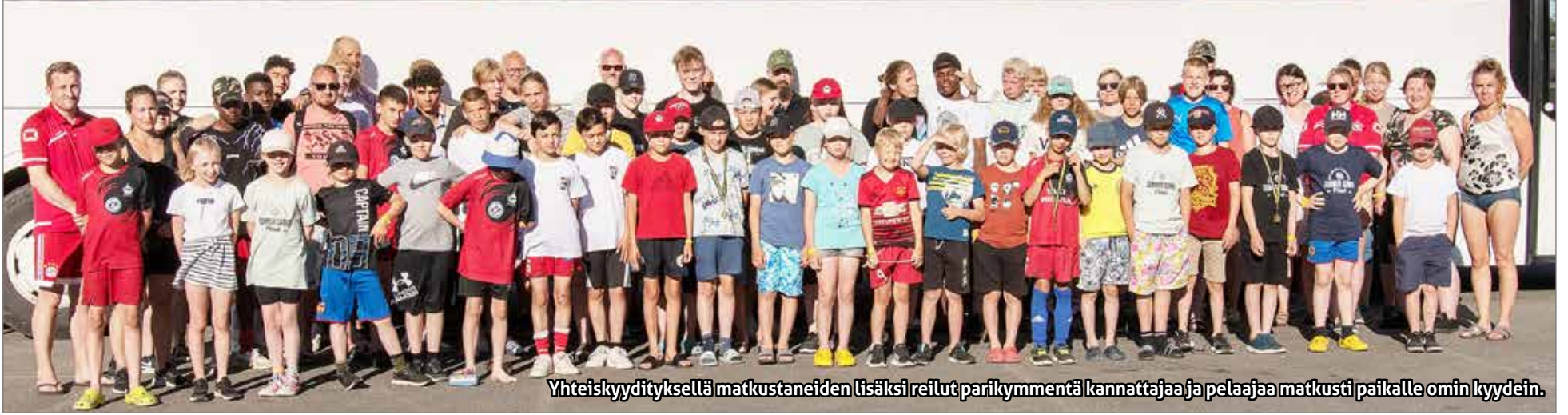
Yhteiskyydityksellä matkustaneiden lisäksi reilut parikymmentä kannattajaa ja pelaajaa matkusti paikalle omin kyydein.

Kurenpoikien joukkueita on kulkenut kansainvälisessä suurturnauksessa Ruotsin Piteåssa jo 1990-luvulta lähes säännöllisesti. Koronarajoitukset estivät turnauksen järjestämisen vuosina 2020 ja 2021. Tänä kesänä kisat järjestettiin teemalla #welcomehome. Kurenpojat otti tietysti kutsun vastaan ja palasi mukavaan suurtahtumaan suurella joukolla.