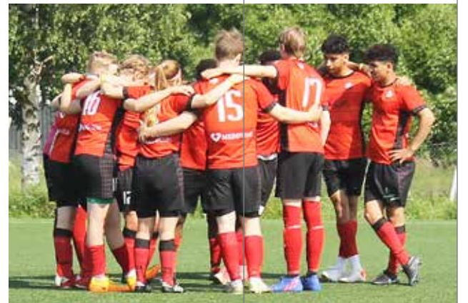
Kurenpoikien vanhin juniorijoukkue pelasi jäähyväisturnauksensa juniorisarjoissa.