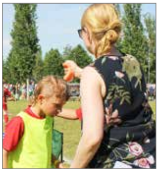
Huolto toimi kentän reunalla ja tarjosi viiennystä pelaajille helteisillä pelikentillä.