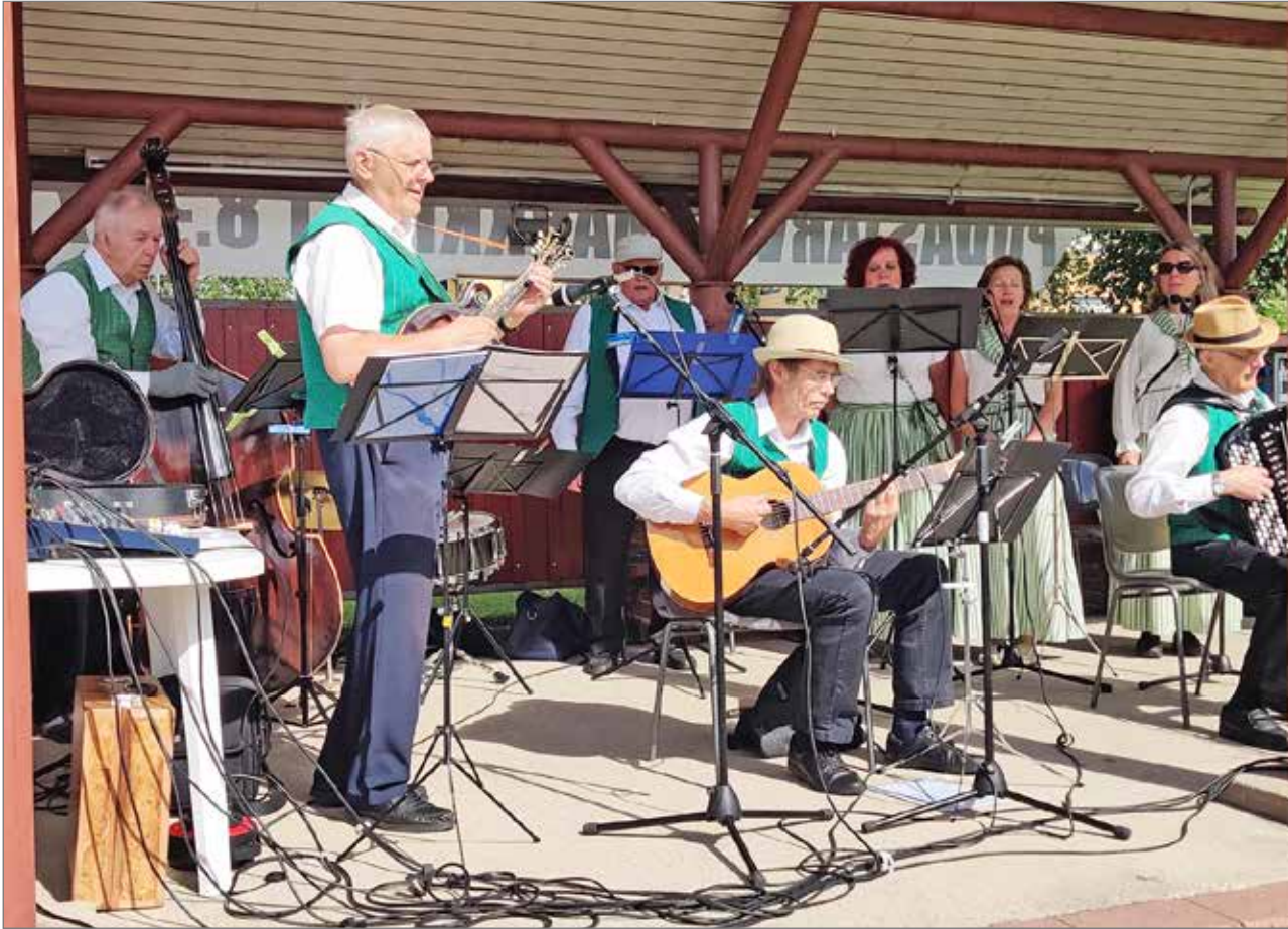
Iin Laulupelimmannit käyvät vuosittain esiintymässä Pudasjärven torilla.

Tarjoilupuoesta huolehti Siuruan Kylä ry. TS