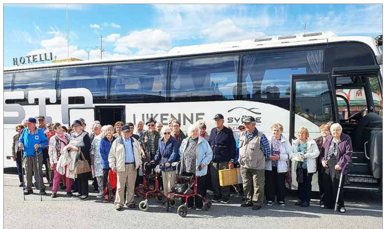
STP Liikenne huolehti turvalisesta ja mukavasta kuljetuksesta kahden yhdistyksen yhteisellä teatteriretkellä.