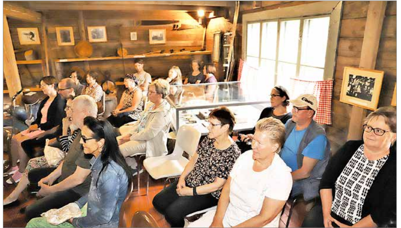
Metsämuseolla Vauhko Varsa esitettiin keskiviikkona 20.7. Pudasjärvi-tunnelmaista komeaa musiikkia. Jutun kirjoittaja istui edessä.

Kotiseutuviikosta enemmän juttua ja kuvia ensi viikon Pudasjärveläinen-lehdessä.