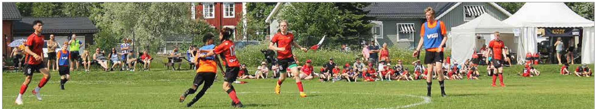
Kurenpoikien muut pelaajat kannustivat P17 joukkuetta.