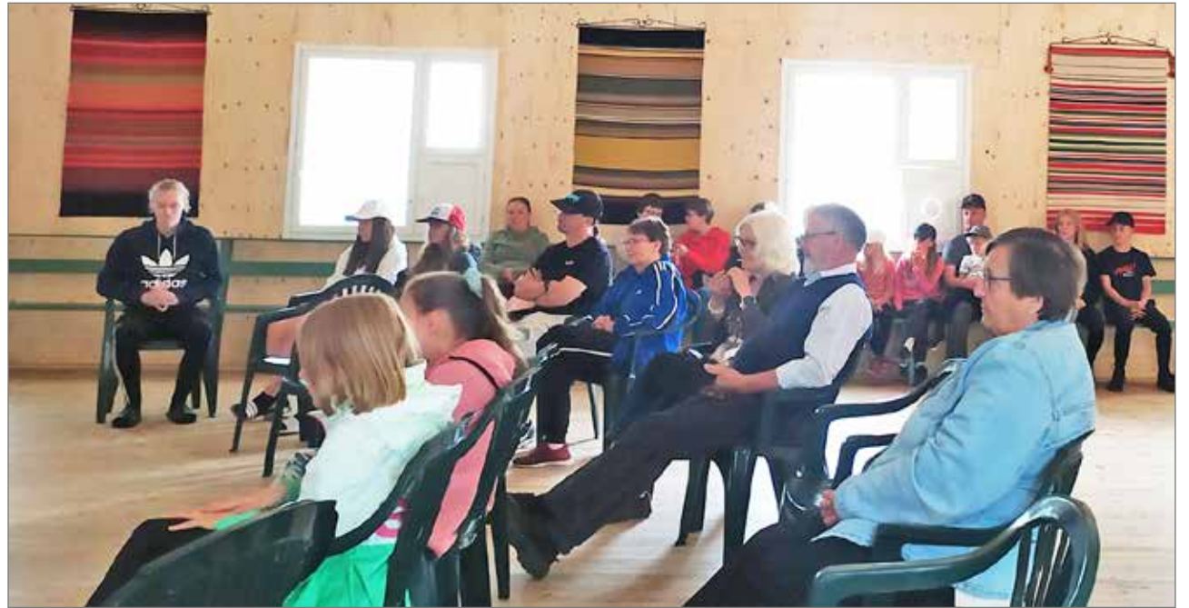
Aihe kiinnosti. Luentoa kuulemassa oli kymmenittäin ihmisiä.