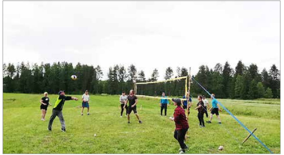
Pallo lentää Kipinän ja Panuman välisen lentopallo-ottelun 1. erässä.

Ukkoskuuron tauottua väki palautui rannalle jatkamaan kesken jäänyttä suvipäivää. Myrskän jälkeen lapset pääsivät uimaan ja rantaleikkeihin sekä jatkaamaan peikkojen rakennusta. Kesäherkut maistuivat ja syömisestä lomassa tehtiin tuttavuutta vielä tuntemattomiin mökkiläisiin, ja samalla mietittiin rannan ja