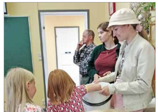
Arpajaisissa oli odottava tunnelma.