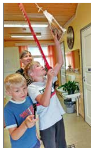
Lapsille oli järjestetty myös ongintamahdollisuus.