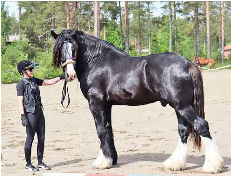
Maailman suurimman hevosrodun edustaja shirehevon esittelyssä.