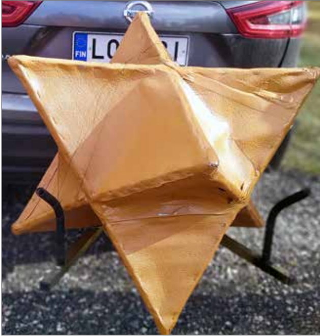
Jättimäinen Pissikivi tuotiin auton vetokoukkuun asennetun telineen päällä. Myöhemmin päivän aikana teos nostettiin talon katolle.

Vuoden 2022 Pissikiven maailmanmestaruudesta kisailtiin lauantaina 2.7. Siuruan Työväentalo-Kylätalolla. Helteinen päivä keräsi talolle kilpailijoitten lisäksi yleisöä jännittämään tämän vuoden mestaruudesta. "Moskovan" tanssisalin lattialla "istumatyönä" suo-