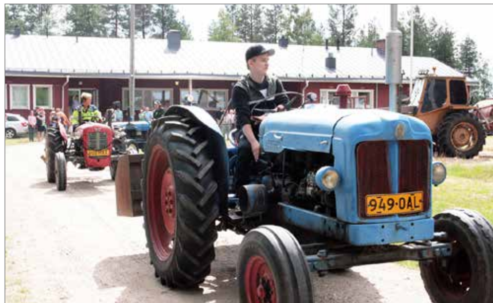
Juhlan päätteeksi siirryttiin sisätiloista pihalle seuraamaan vanhojen traktoreiden "ohimarsia".

Aittojärven Kyläseura ry. vietti lauantaina 16.7. tapahtumapäivää Aittojärven koululla 30-vuotisen toiminnan merkeissä. Jo hyvissä ajoin ennen tapahtuman alkamista pörräsi pihalle riviin vanhoja traktoreita eri työkonein varustettuna. Niitä käytiin tutkimassa ja traktoreiden omistajat selvittivät traktoreiden vuosimalleja ja työhistoriaa. Tapahtuman lopuksi kaikki traktorit käynnistettiin ja ne kiersivät pihaa näytösluon-