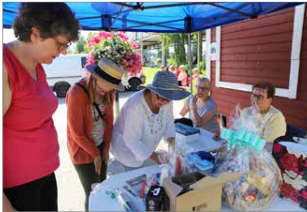
Torin laidalla olevassa pisteessä ostettiin vilkkaasti levyjä ja arpoja.