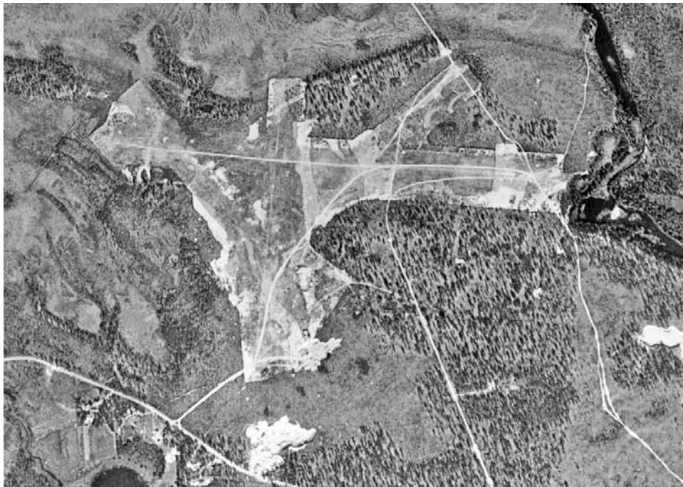
Pudasjärven lentokenttä vuonna 1957.

Kirjoittaja on arkeologi ja Turun yliopiston väitöskirjatutkija, joka tutkii väitöskirjassaan Saksan ilmavoimien lentokenttäverkostoa ja sota-ajan muistipaikkoja.