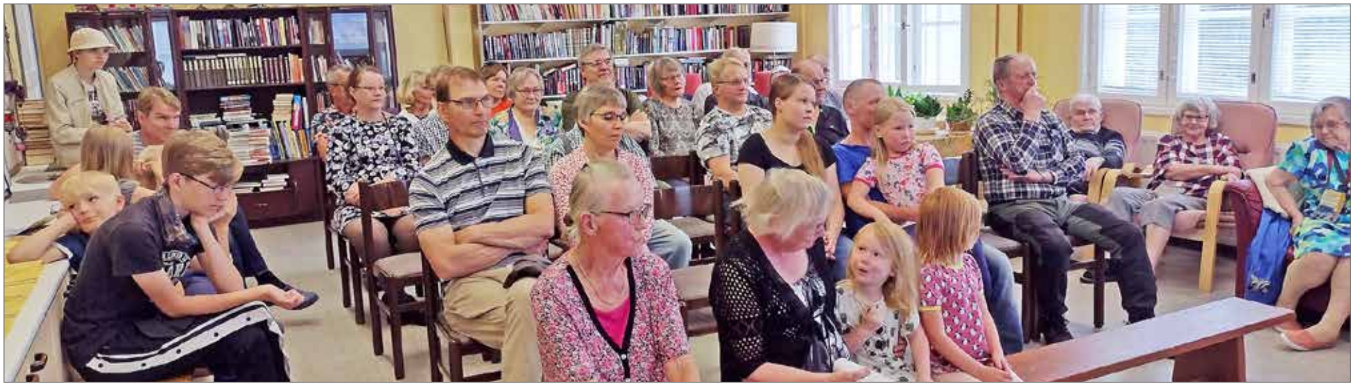
Ohjelmaa seuraamaan kokoontui mukavasti väkeä.