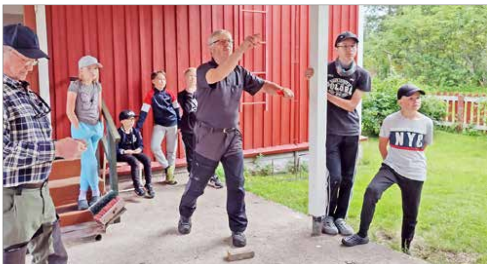
Tikanheittopaikalla jännitettiin yleisöä myöten.