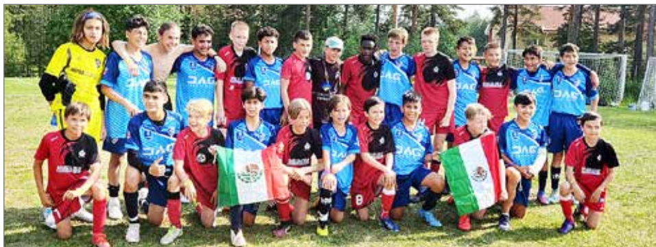
Kurenpoikien P13 asettui yhteiskuvaan meksikolaisen vastustajansa kanssa ottelun päätyttyä.