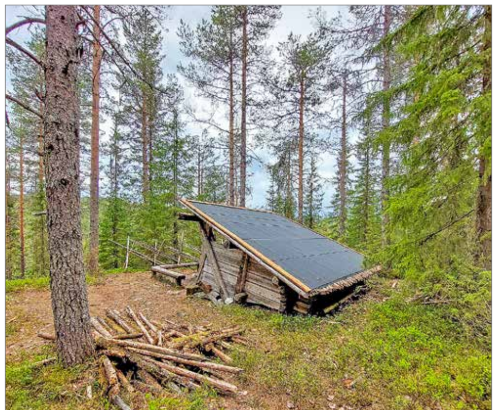
Lomaojan laavu on saanut uuden katon.