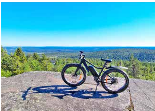
Pyörä Iso-Syötteen maisemissa.

Metsähallitus tiedotus, kuvat Vilma Gröhn