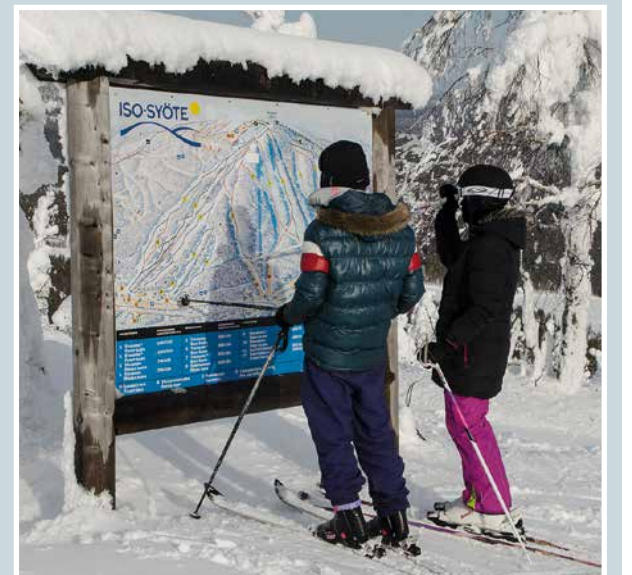
Talvisen luonnon kauneutta.

Martti Kähkönen lukijoiden palaute ja jutut: vkkmedia.fi