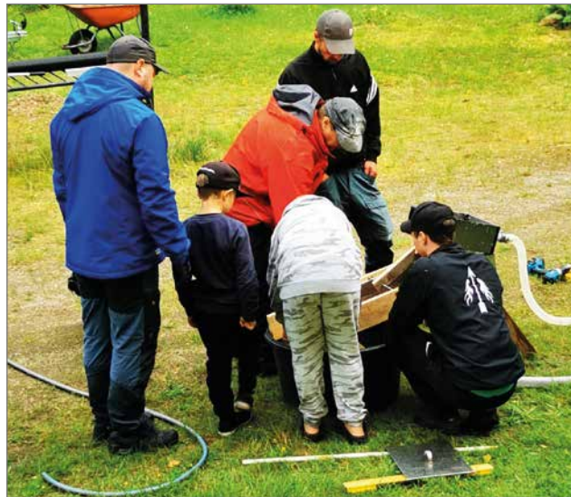
Monen ikäisiä talkoolaisia testaamassa tapahtumaan tulevaa laitetta.

Kylillä järjestettävät tapahtumat ovat saaneet koronan jäl-