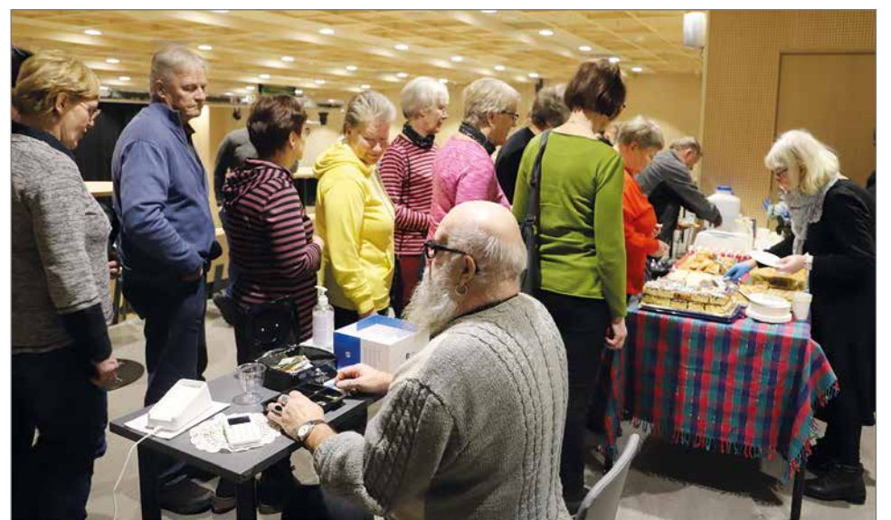
Väliajalla nautittiin Siuruan Kylä ry:n järjestämät kahvit runsaine leipomuksineen.