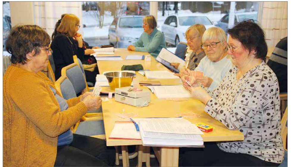
Korttipelit, palapelit, laulut, lautapelit ja väritystehtävät siivittivät kerhopäivää kahvituokion ja arpajaisten lisäksi.