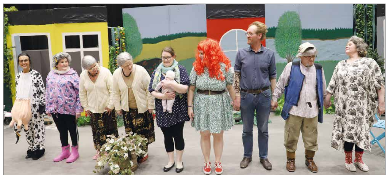
Ensimmäinen esitys on ohi ja näyttelijät ottavat vastaan yleisön runsaat ablodit.