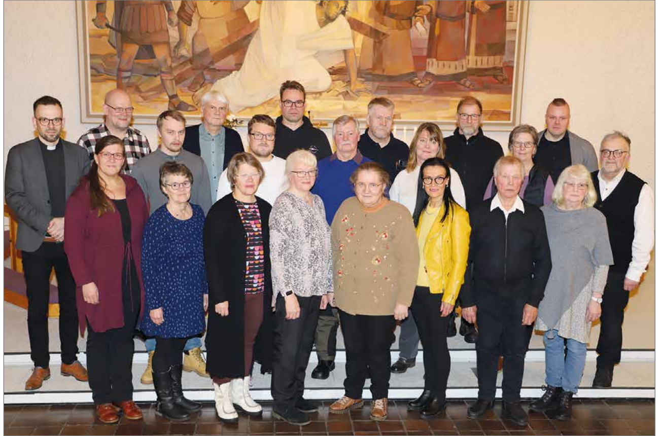
Uusi kirkkovaltuusto kokoontui kokouksen päätteeksi yhteiskuvaan.