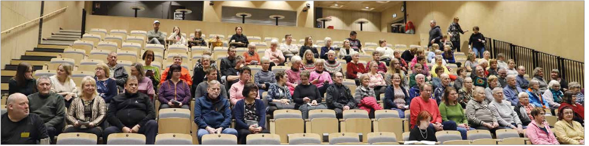
Ensimmäisessä esityksessä lauantaina oli yleisöä noin 100.