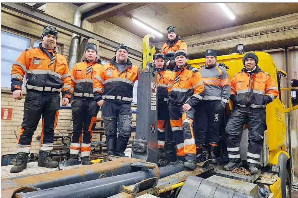
Rieki työllistää parikymmentä työntekijää. Pudasjärven mittakaavassa se on merkittävää.