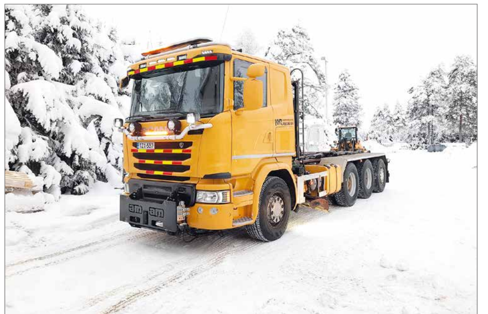
Kalustoa uusitaan ja huolletaan tarpeen mukaan.