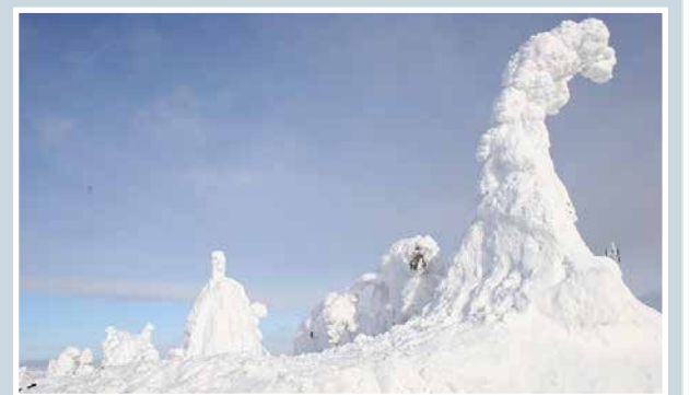
Kuva: Martti Kähkönen: Iso-Syöte

Martti Kähkönen lukijoiden palaute ja jutut: vkkmedia.fi