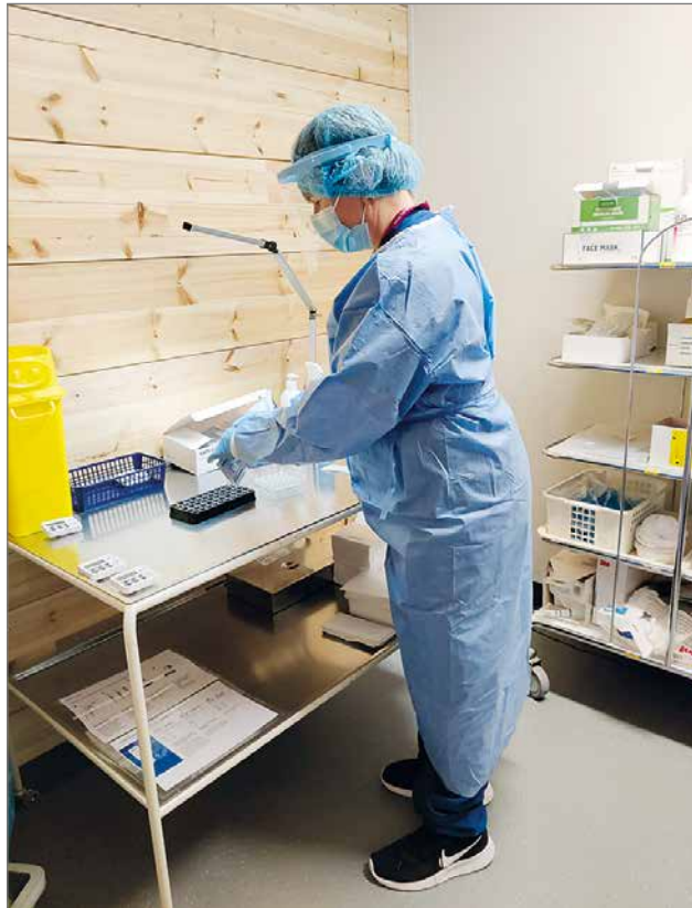
Lähihoitajia työskentelee myös koronanäytteen otossa tai sitten, korona on tuonut muutoksia myös lähihoitajien työnkuvaan.

Tulevaisuus mietityttää monin tavoin, meillä on halu tehdä työmme hyvin. Mistä saamme riittävästi työkavereita? Jaksammeko pienellä palkalla vastuullista ja vaativaa työtämme? Miten tuleva soteuudistus vaikuttaa työpaikkojemme säilymiseen ja ennen kaikkea kehittämiseen ja asiakkaisiimme. Tahtoisimme antaa asiak-