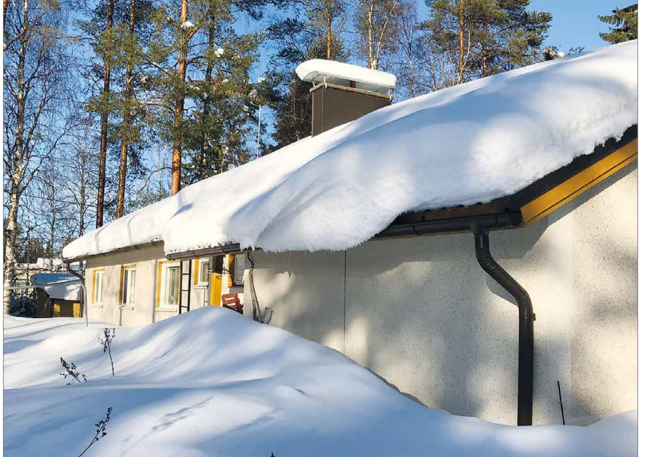
Kuva Jukolantien kotitalosta viime talvelta. Lunta riitti ja jännäsimme milloin lumet jytisee alas katolta. Peltikatolta lumet luistelee itsekseen alas muutaman kerran talvessa.

Mukanamme Pudasjärvelle muutti myös yrityk-