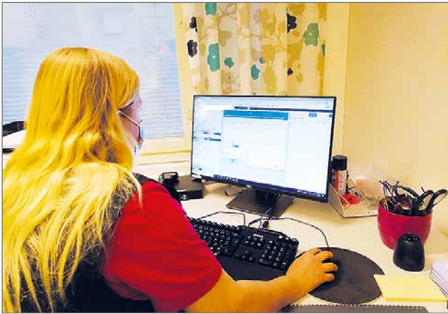
Lähihoitajan työhön kuuluu olennaisesti hoito- ja palvelusuunnitelmien teko, arviointi, ja päivittäiset kirjaukset.

Tiesitkö, että kansallinen lähihoitajapäivä on torstaina 27.1? Päivän tarkoitus on tuoda julkiseksi lähihoitajan merkityksellistä ja monipuolista työnkuvaa.