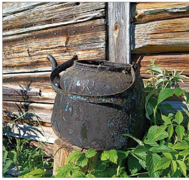
Kalliokosken jokiuomassa uinunut savottakokki kahvipannu on kotimuseossa taltioituna.