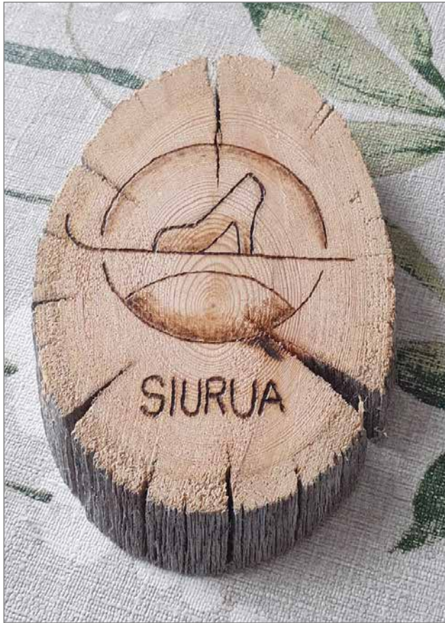
Siuruan logolla varustettuja jääkaappimagneetteja on myynnissä kaikissa yhdistyksen tapahtumissa.