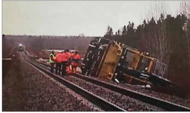
- Teksteri-työkone meni kumolleen, kun laskettiin viimeistä suurta pylväselementtiä ratakiskon varteen. Kukaan ei onneksi loukkaantunut eikä työnjohtajat moittineet meitä vahingosta.