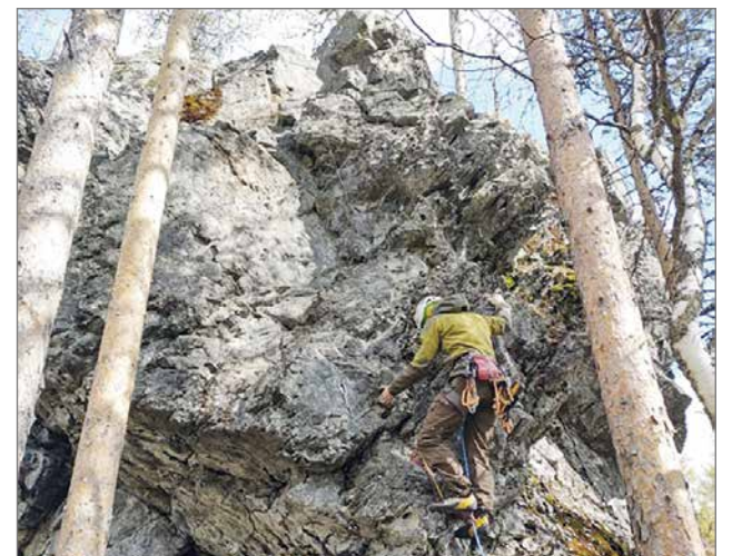
Kallioseinämät, joita pitkin harrastekiipeilijät nousevat, ovat pystysuoria ja ulokkeisia.