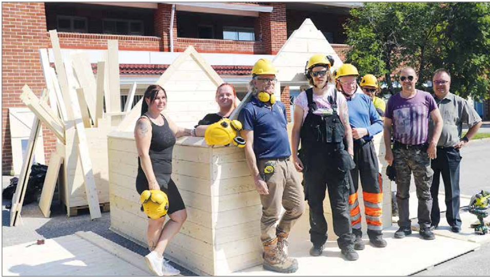
Markkina-arpajaisten päävoiton hirsisen aitan kokoamisen suorittivat OSAOn Pudasjärven yksikön hirsikurssin opiskelijat yhdessä opettajiensa kanssa.

Pudasjärven Yrittäjien markkina-arvat 3000 kpl menivät kaikki kaupaksi. Hirsisen aitan voitti pudasjärve-