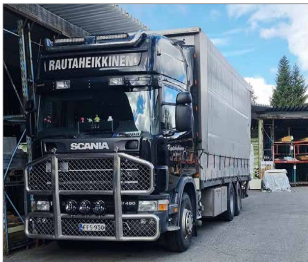
RautaHeikkinen palvelee asiakkaita omalla kuljetuskalustolla ihan rakennuskohteeseen saakka.

Tyttäremme toimii Pudasjärvellä parturikampajana ja toinen poikamme on LVI-alan yrittäjänä Kiimingsissä. Hänen yrityksensä LVISHeikkinen palvelee asiakkaita myös kaikkialla Pudasjärvellä. TS