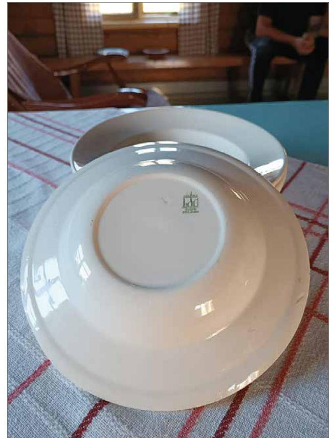
Uittossa käytettiin laadukkaita Arabian posliinilautasia. Kokkiveneen kaaduttua koskessa, nämä lautaset tippuivat joki-pohjaan, mistä ne kesäveden aikana löytyivät ehyenä ja ovat nyt arkiston aarteita.