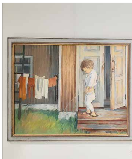
Kevätaamu 1981 ja Aku-setä 2008.