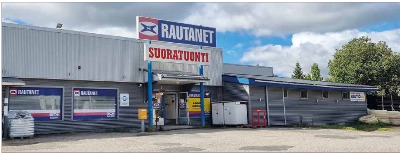
Monipuolinen rakennustarvikkeiden myymälä sijaitsee Ranuan keskustassa, osoitteessa Aapiskuja 2.

Ajanvaraus hoituu helpoiten nettiajanvarauksen kautta www.fysioaurea.fi tai puhelimitse 040 650 1992.