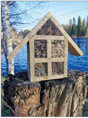
Siuruan Kylä ry. on valmistanut ötökkähotelleja myyntiin ja eri tapahtumissa niitä voi itse valmistaa ohjaajan avulla.

Siurualaisilta eivät ideat tunnu loppuvan koskaan! Siuruan Kylä ry. on panostanut omalla, persoonallisella tavalla taiteeseen ja kulttuuriin, joista kyläyhteisö on niittänyt kuuluisuutta ympäri maailmaa, lähinnä Tykkyläisten ideoimien tapahtumien ansiosta.