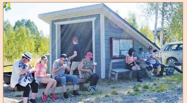
Osakaskunnan laavulla on monenlaisia tapahtumia sekä kesä- että talvikaudella.

Vuosien varrella on laitettu alulle kaikenlaisia pikku hankkeita ja tapahtumia. Tärkeimpiä ovat olleet joen rapu- ja kalakannan elvyttäminen. Nykyisestä osakaskunnan laavualueesta on muodostunut paikka missä järjestetään kesäisin onkikilpailut. Seurakunta käyttää myös säännöllisesti laavualueutta nuotioitansa järjestämispaikkana.