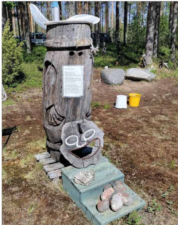
Pihalla oli monen moista nähtävää, vanhimmat puuveistokset olivat vuosien takaa.