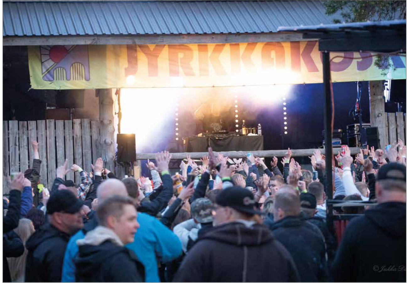
Enimmillään yleisöä oli perjantai-iltana noin 400 henkeä.