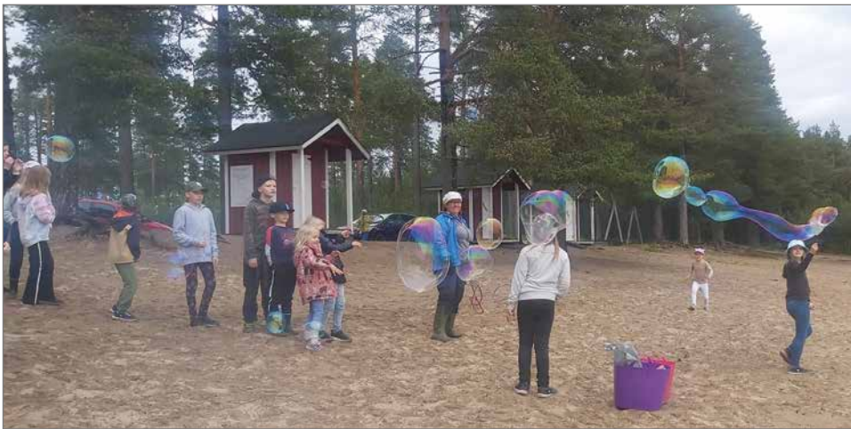
Isujen saippuapallojen teko oli illan yksi ohjelma-numero.