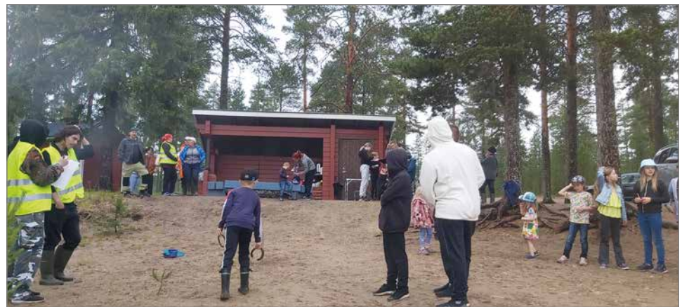
Leikkimielisiin kilpailuihin kuului myös hevosenkengän heittoa.