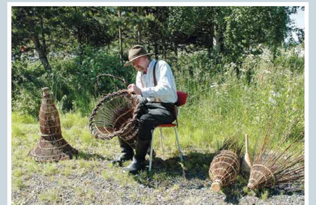
Nahkismerran tekoa.

Martti Kähkönen lukijoiden palaute ja jutut: vkkmedia.fi