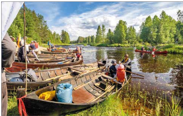
Ijokisoudussa Tynnyrimutkan aamutunnelmia.

Ijokeen omien alkupe-räisten vaelluskalakantojen palauttamisesta pu-huttiin ja suunniteltiin eri reittejä myöten koko 1990-luku. Aika ei ollut vielä kypsä, mutta 2000-luvulle tul-taessa otettiin esiin mm. lohien ylisiirrot, kuten oli tehty 1960-luvulla muuta-man vuoden ajan. Alkoivat eri tahojen yhteistyöhank-keet vaelluskalojen palaut-tamiseksi Ijokeelle. Kuitenkin merkittävin asia tapahtui vuonna 2017, kun kalaviran-omainen laittoi aluehallinto-virastossa (AVI) vireille Ijokeen säännöstelijälle, Pohjolan Voimalle määrättyjen istu-tusvelvoitteiden muutoshakemuksen. Yhtiölle haetaan vanhentuneiden istutusvelvoitteiden tilalle velvoitet-