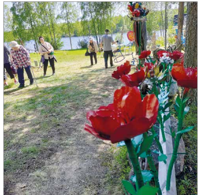
Tämän kesän Eetenin taidepihan uutuutena olivat iloisen väriset pellistä muotoillut kukat.