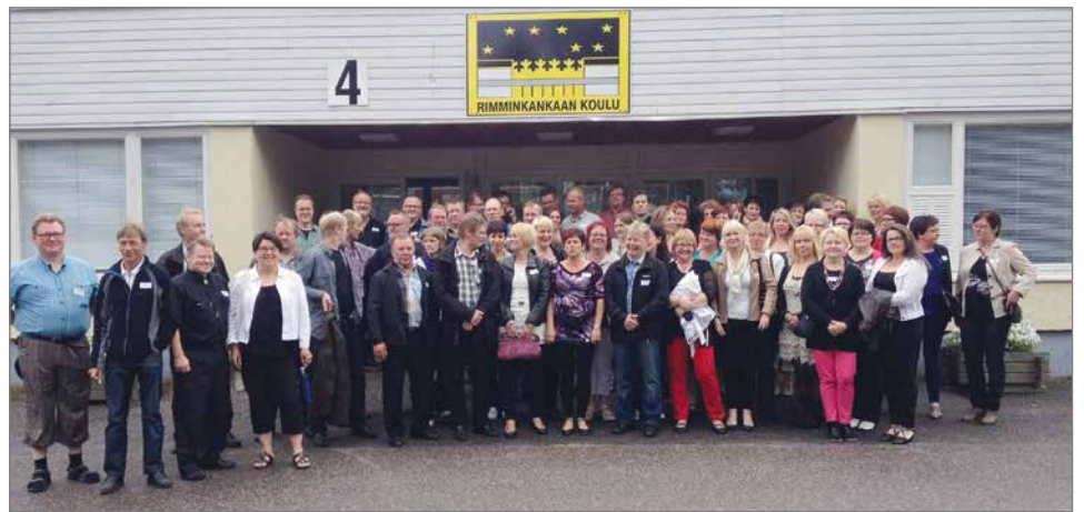
50 v. -kokoontumiseen sisältyi käynti Rimminkankaalla ennen Jyrkälle siirtymistä.

mat v. 1979 Rimmiltä päässeet olemme juhlineet ja juhlimme pyöreitä vuosiamme, kuka milläkin tavalla ja missäkin seurassa, ympäri Suomen maan tai muualla maailmalla. Kukin omalla tavallaan, mutta olisiko näiden haastavien vuosien jälkeen aika juhlistaa isolla porukalla taaksejääneitä vuosiamme? Kyllä olisi! Meidän ikäluokalla on mitä muistella, olemme nähneet paljon muuttuvaa maailmaa, mutta juuret ovat vankat ja sitä paitsi, meidän taidamme olla kaikkiruokaisia musiikin suhteen, niin monta genreä olemme nähneet ja kuulleet, meihin uppo-