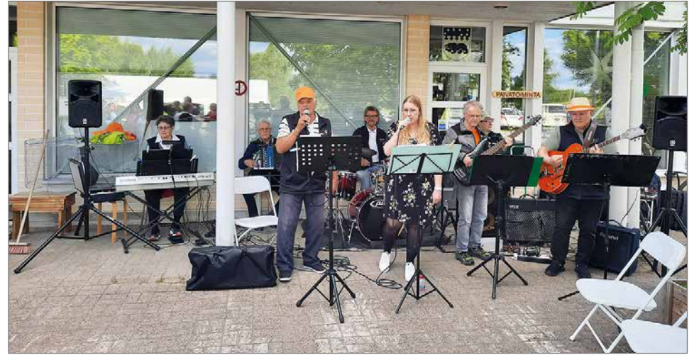
Syntymäpäiväjuhlat päättyivät tanssien Suopunki-yhtyeen tahdittamana.

juhla järjestettiin vihdoin, koska korona muutti meidän kaikkien elämän. Minäkin odotin tätä juhlaa ja ohjelma on vaikuttanut ihan hyvältä. Minusta väkimäärän paljous oli yllätys. Minä tunnen jokaisen täällä olevan. Kesäterveisinä haluaisin sanoa, että toivottavasti tällaisia lempiviä hellepäiviä tulee lisää ja hyttysset saivat pysyä kurissa. Odotan, että loppuilta menee kaikilta hyvin ja mukavasti. Kaikkein mukavinta tässä juhlassa on ollut nähdä kaikki