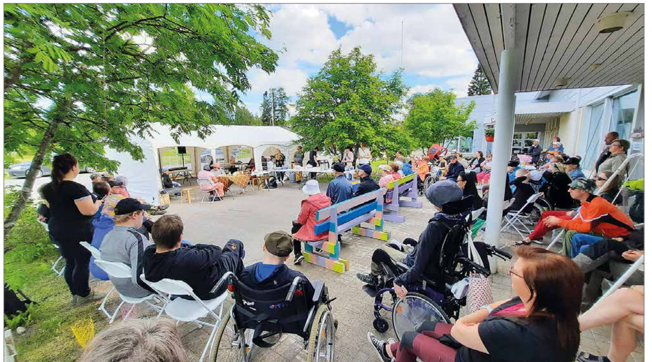
”Kyllä mummo maksaa”-näytelmää seurattiin silmä tarkkana.