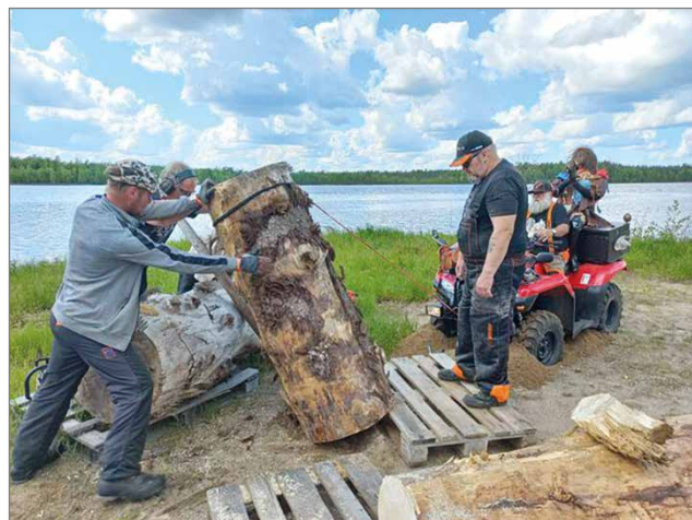
Veistopölkyn nostoa Kierikissä.

Kolme viikkoa moottorisahojen pärinää alkaa jo surista korvien välissä. Ensin oli naisille tarkoitettu moottorisahaveistokurssi omalla kylällä Siurualla, siitä päivän viiveellä Yli-lin Kierikissä toistakymmentä aloittelevaa veistäjää ja kahden päivän päästä veistettiin jo suomenmestareiden kanssa kilpaa Kivijärvellä Keski-Suomessa. Kivijärvi on kunnostautunut tekemällä keskelle kuntaa veistospuis-