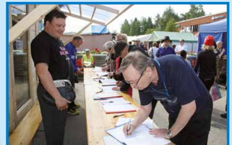
Arpojen myyntiä markkinoilla