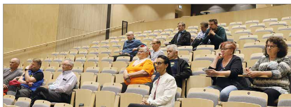
Tuulivoimasta kiinnostuneita osallistujia oli paikalla Pirtissä ja sekä teams-yhteyden päässä etänä.