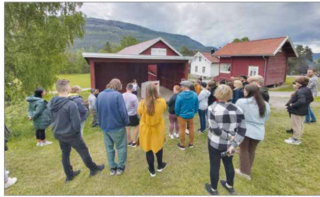
Ryhmäkuvaa seminaariin osallistuneista nuorista ja nuorisoyöntekijöistä saaren ulkokokouspaikalla.

Nuoriso- ja vapaa-ajankeskus Pikku-Syöte on kuluvaan vuoden aikana asettanut tavoitteekseen lisätä nuorten kansainvälistymismahdollisuuksia. Olemme lähteneet mukaan EU:n ylläpitämiin nuorten Erasmus+ ohjelmaan sekä Euroopan Solidaarisuusjoukot vapaaehtoistyön piiriin.