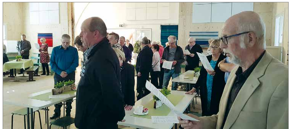
Juhlaohjelmaan kuului myös yhteislaulua.