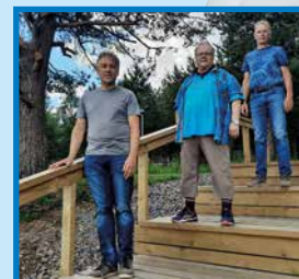
Musiikkia Vauhko Varsa yhtye