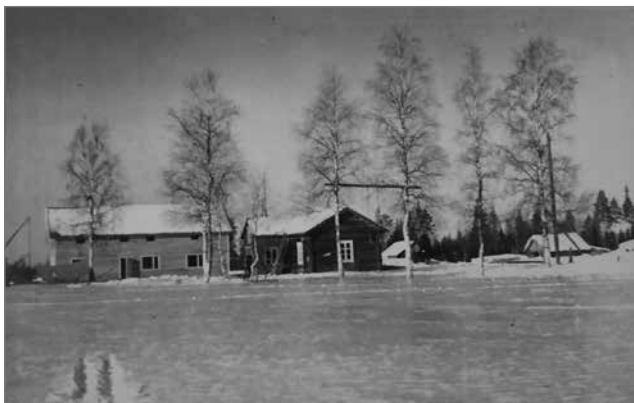
Rajalan taloon asennettiin ensimmäisenä vesikeskuslämmitys ja toisena Naavalan uuteen taloon Livon kylällä 1950-luvulla.