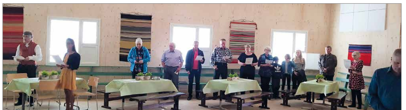
Hampushallilla on monipuolinen kalusto sekä myös astiasto erilaisten juhlien järjestämiseen.