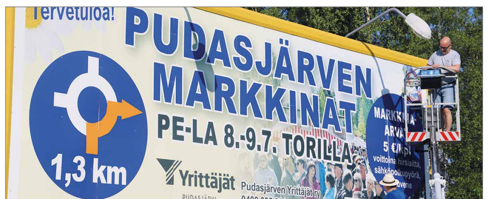
Valtatien varteen yrittäjät asensivat markkinoista kertovat kaksi suurta mainostaulua.

Uutta on valtatie varrelle laitettut suuret 9x3 metrin markkinoista kertovat mainostaulut. Kuusamon suunnasta mainos on Koskitraktorin luona peräkärryn