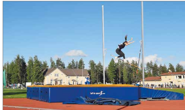
Aina ei voi onnistua. Vastoinkäymiset on voitettava. Uutta suoritusta peliin.