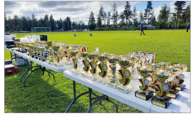
Palkintopöytä houkutteli urheilijoita huippusuorituksiin.