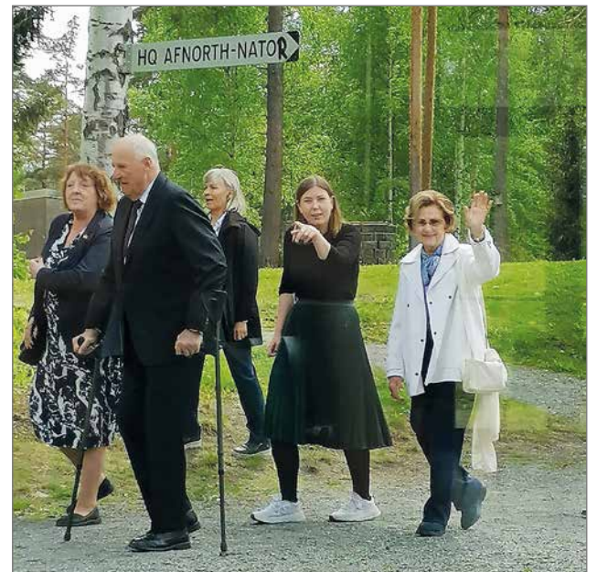
Tapasimme ikkunan takaa Norjan kuninkaan ja kuningattaren, jotka vierailivat saarella siellä ollessamme.

Nuoriso- ja vapaa-ajankeskus Pikku-Syöte tarjoaa siis tulevaisuudessa mahdollisuuden nuorille lähteä Eurooppaan viikon-parin nuorisovaihtoihin, osallistua nuorisovaihtoon eurooppalaisten nuorten kanssa Pikku-Syötteellä tai lähteä vapaaehtoistoihin Eurooppaan jopa vuodeksi tai lyhyemmäksi ajaksi. EU-rahoittaa nämä reissut, joten kaikilla on mahdollisuus osallis-