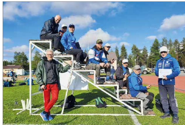
Ajanottajien tehtävänä on olla hereillä silloin, kun starttilaukaus kuuluu ja juoksija ylittää maaliviivan.