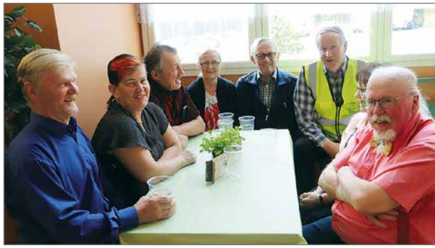
Pintamon Kyläseurasta oli hyvä edustus avajaistanssissa ja seuran väki viihtyi myös avajaistansseissa.

Iinattijärven Nuorisoseura haluaa välittää kiitokset paikallisille yrityksille, joiden kanssa rakennushanketta on toteutettu; K-Rauta Pudasjärvi, Kontiotuote Oy ja Pudasjärven LVI- ja Rautatarvike Oy. Suurin kiitos kuuluu tietenkin aktiivisille