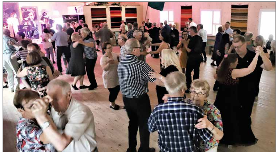
Avajaistanssit saivat suuren suosion, lippuja myytiin yli 200 kappaletta.