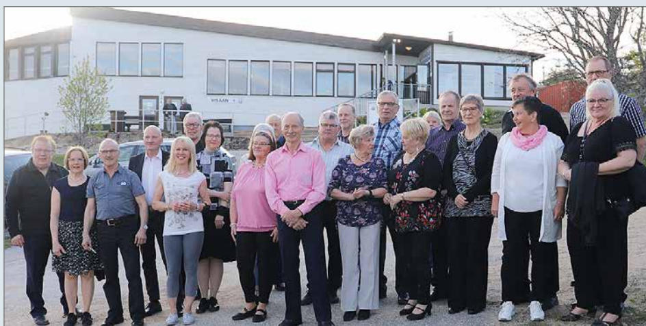
Ennen tanssisalille menoa kokoonnuttiin ryhmäkuvaan.

Edullista ilmoitustilaa PALVELUHAKEMISTOSTA