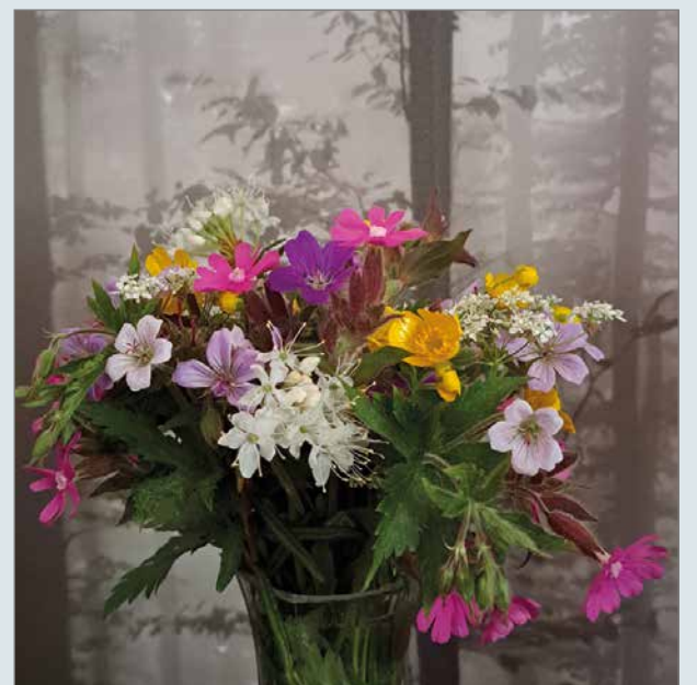
Juhannukseen kuuluu perinteisesti luonnonkukat.

Kauniisti ilta aurinko paistaa suomenlippuun, joka liehuu salossa. Linnut laulavat kirkaasti. Maatilalle menevän soratien pientareet ovat täynnä kauniin värisiä luonnonkukkaa.