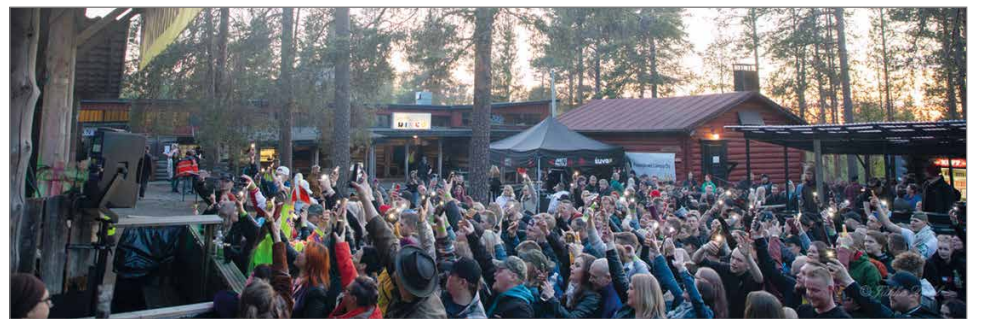
Enimmillään yleisöä oli perjantai-iltana noin 400 henkeä.

Ilta yhdeksältä kuultiin uutta tuttavuutta Pudasjär-