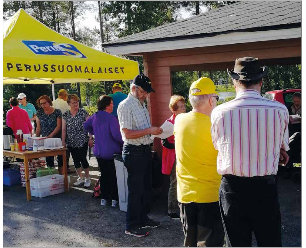
Kauniissa kesäillanvietossa kävi mukavasti väkeä, mukana myös nuorisoa.

vasti juuri hallitusneuvottelujen päättymisajankohtaan, joten juhlaan oli siltäkin osin aiheutta. Osaa kansasta neuvottelujen lopputulos ei varmasti miellyttä, mutta kaikille on selvää, että koalitionhallituksessa yhden puolueen on mahdotonta saada