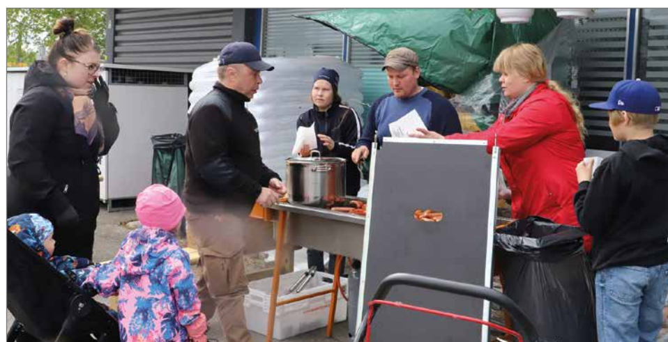
Perjantaina makkaratarjoilusta huolehtivat MTK Pudasjärven hallituksen jäsenet.