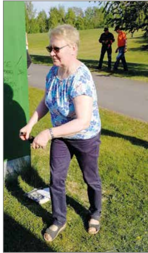
Nännikumien heitto tonkkaan oli vaativampi, kuin aluksi luulisi.

Mitpä olisi illanvietto ilman leikkimielisiä kilpailuja ja siksi ohjelmassa olikin tikkakisa sekä uutena lajina nännikumien heitto maitotonkkaan. Molemmat lajit kiinnostivat ja jälkimmäinen