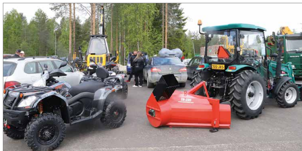
Pihalla oli runsaasti koneita ja tarvikkeita, joita esittelivät eri tehtaiden ja maahantuojien edustajat.

tä, moottorikelkkoja, traktoreita ja erilaisia koneita. Tavaroiden ostajille oli tarjolla myös hyviä rahoitusvaihtoehtoja. HT