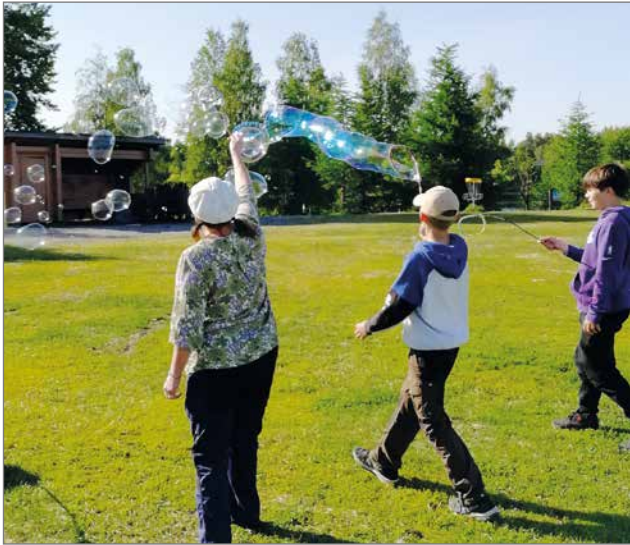
Jättisaippuakuplien puhaltaminen kiinnosti niin nuorempaa kuin hieman varttuneempaakin väkeä.

Aurinko paistoi pilvettömältä taivaalta, kun lauantaina 17.6. kokoonnuttiin Pudasjärven Perussuomalaisten Pikkujuhannuksen viettoon Rajamaanrantaan. Iltapäivän kääntyessä kohti iltaa lempeä tuuli viilensi ilmaa sopivasti. Kauniissa kesäilänvietossa oli kirjaimellisesti väkeä vauvasta vaariin ja oli mukava huomata, että tilaisuus kiinnosti myös nuorisoa.