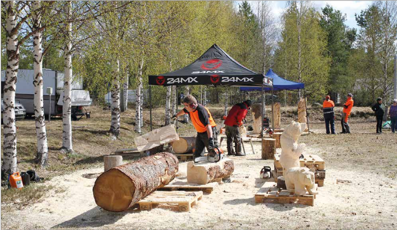
Livokas ry. oli hankkinut yhteistyökumppaneilta työstettävää materiaalia Karhunveistoviikolle.