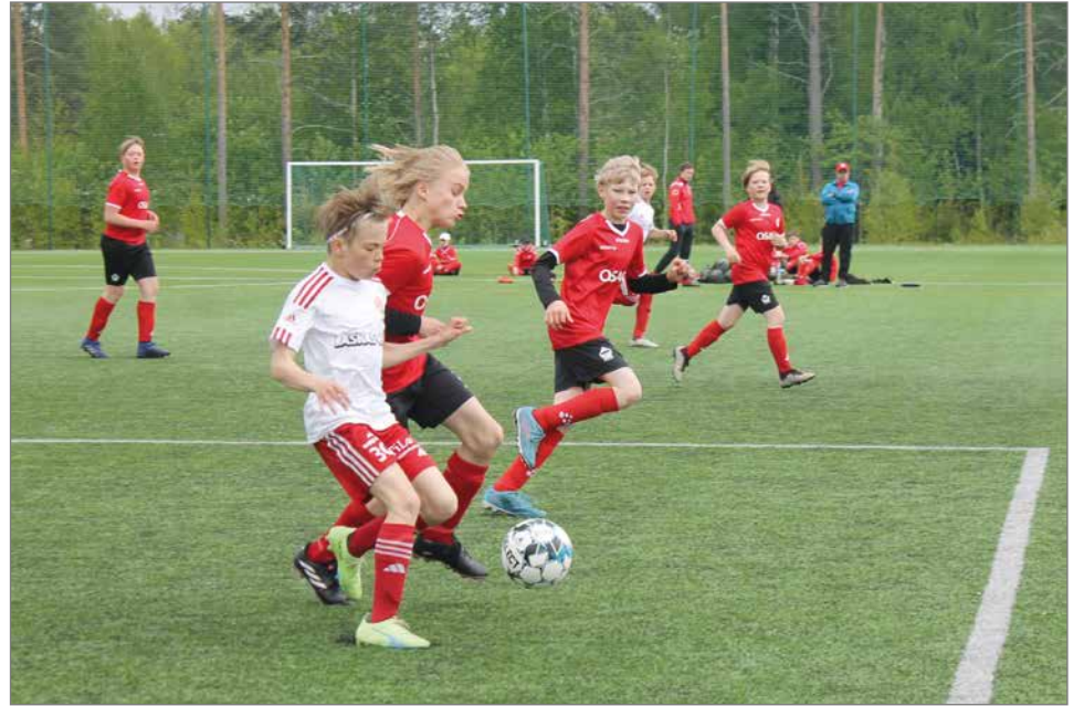
Ennen miesten peliä Kurenpoikie P13-joukkue pelasi kotipelin rovaniemeläistä FC Santa Claus junioreita vastaan. Kurenpojat otti sarjapisteet maalein 5-3.