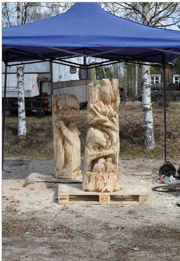
Metsän eläimet yhdestä puusta yhdessä puussa.