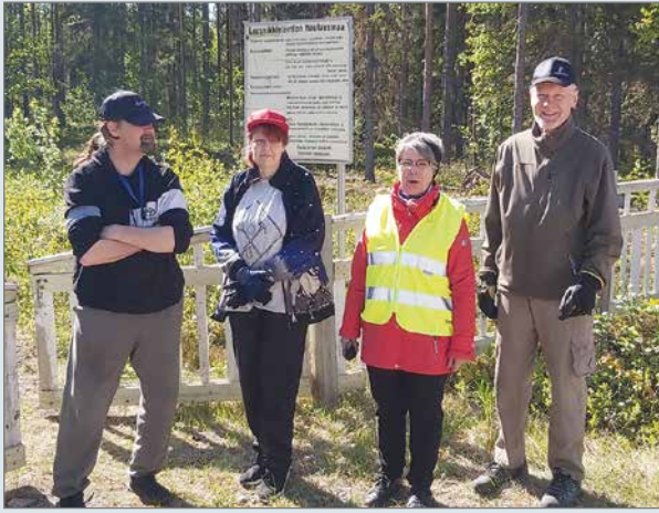
Siivoustalkoisiin olisi mahtunut enemmän väkeä. Elokuussa yritetään uudelleen.