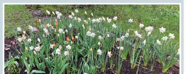
Kesän merkit.

Martti Kähkönen lukijoiden palaute ja jutut: vkkmedia.fi