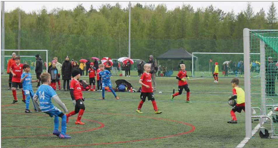
P11 sarjan ensimmäinen turnaus pelattiin Oulussa Hovinsuon kentällä 28.5. Kurenpojilta oli mukana kaksi joukkuetta.

Junioreiden pelit alkavat kello 10 ottelulla FC Kurenpojat - ONS/T. Tunnin kulluttua tästä Kurenpojat pelaa toisen ottelunsa Ajax/sinistä vastaan. 11.50 otte-