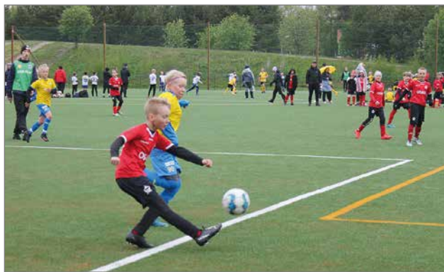
Pudasjärvellä pelataan yksi sarjan turnauksista. Turnaukseen osallistuu 20 joukkuetta ja arviolta lähes 300 pelaajaa. Kurenpoikien molemmat joukkueet pelaavat turnauksessa kumpikin kolme ottelua.

Turnaukseen osallistuvat joukkueet tulevat eri puolilta Pohjois-Suomea. Joukkueet matkaavat Pudasjärvelle aina Ouluisista, Kuusamosta ja Rovaniemeltä sekä Kajaanista asti, sekä monilta paikkakunnilta tältä väliltä. Tiedossa on todellista lasten urheilujuh-