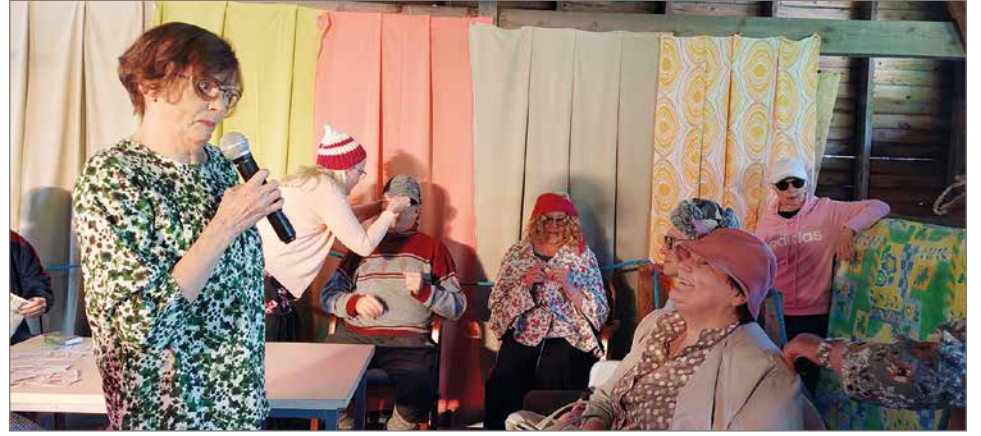
Eläkeläisten Pudasjärven yhdistyksen näytelmäporukka nauratti yleisöä.