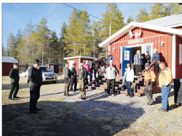
Hirvipirtin lämpöön Yli-Siurualla oli kokoontunut kyläiltaan noin 30 henkilöä mukavaan jutusteluun.

KIRPPIS MA-TI Lukiontie 1 (ent. leipomo) Tervetuloa! 20.-21.6. KLO 11-16