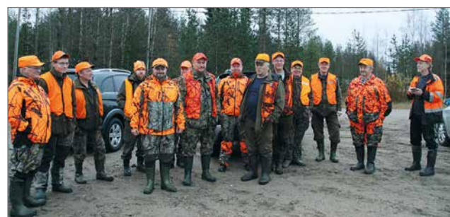
Hirviporukka lähtöpalaverissa ennen metsään siirtymistä.

Sääntöjen mukaan seuran tarkoituksena on harjoittaa alueellaan järkiperaistä metsästystä ja riistanhoitoa. Tämä velvoittava määritelmä on ollut ohjenuorana koko seuran reilun viisikymmenvuotisen toiminnan