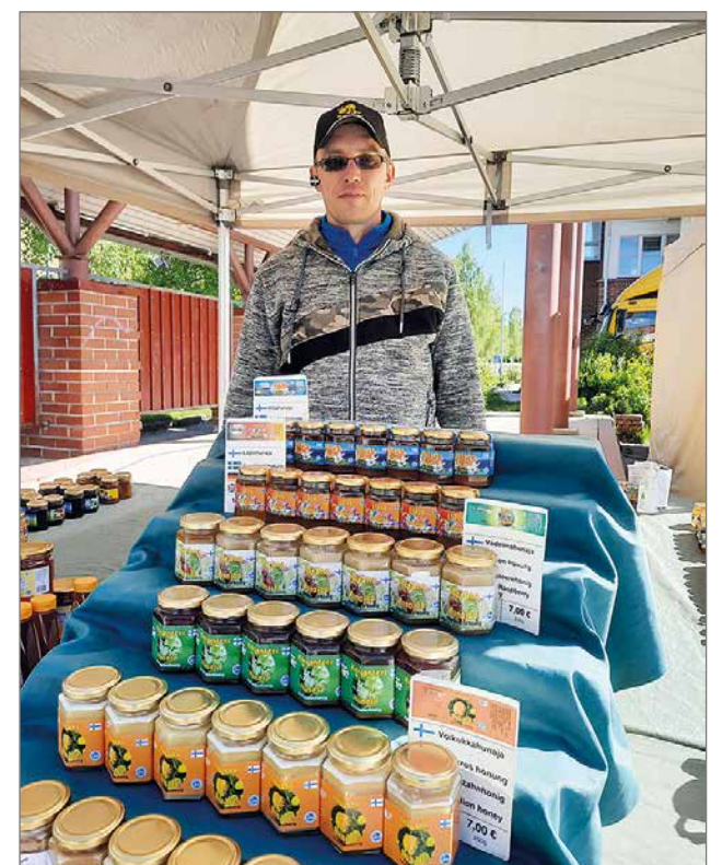
Terveellisiä hunajatuotteita oli tarjolla Vääräkankaan myyntipöydällä.