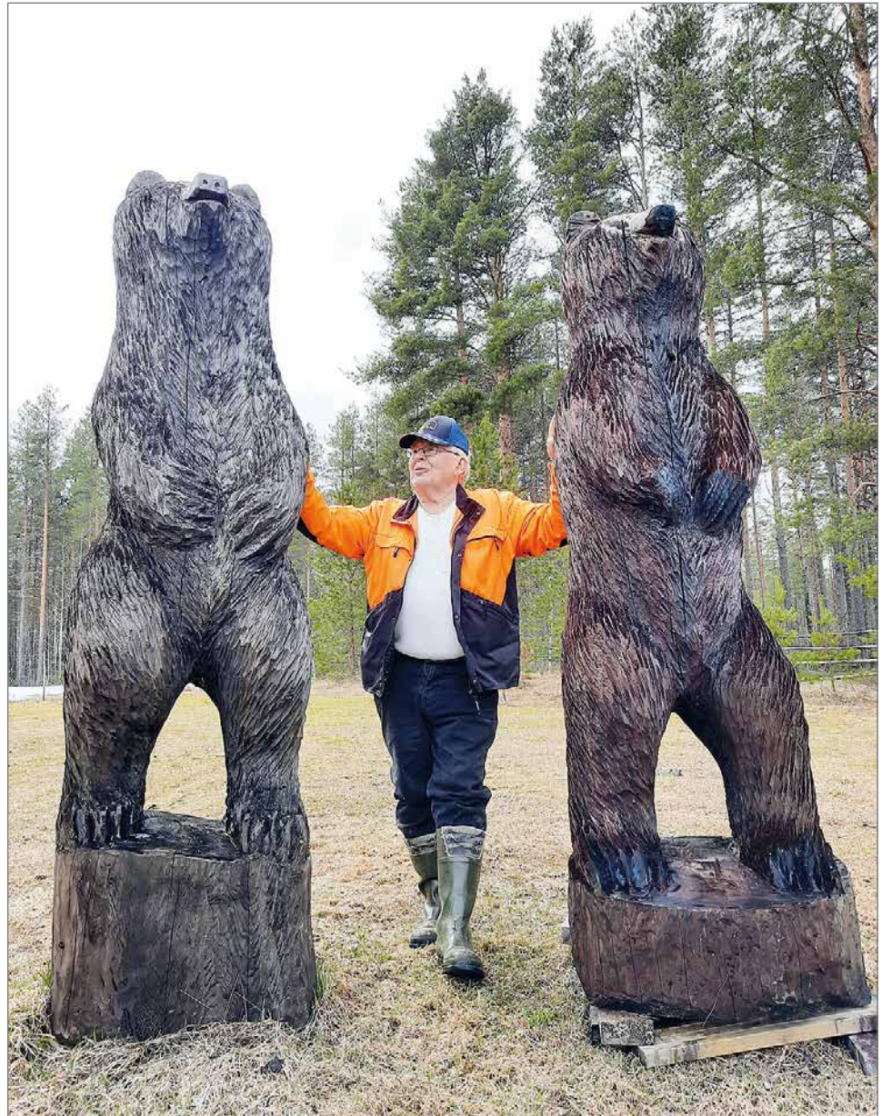
Kerran soitti nainen, joka halusi ison karhun miehensä syntymäpäivälahjaksi Kotkaan.