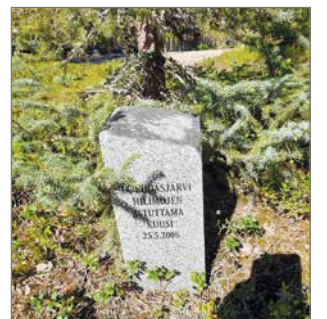
Hilimojen istuttaman kuusen muistolaatta.