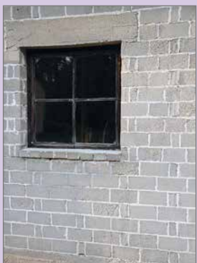
Kynkään tiilitehtaan tiilet ovat edelleen hyväkuntoisia.