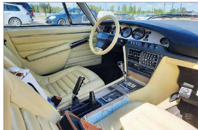
Sisustus oli ennen tumman ruskea.