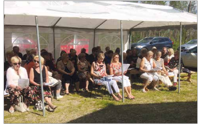
Edellisen tapaamisen juhlaväkeä.