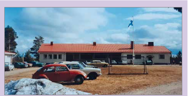
Lippu liehuu 50-vuotisjuhlaa viettävän koulun pihalla vuonna 1979.