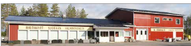
Koilliskivi Oy:n uudet tilat Pudasjärvellä sijaitsevat osoitteessa Teollisuustie 2.

Kaiverrustyöt, puhdistukset ja kiillotukset tehdään sisätiloissa, mikä takaa oikean pintakäsittelyn kultauskäsien ja hopeointien säilymiseksi