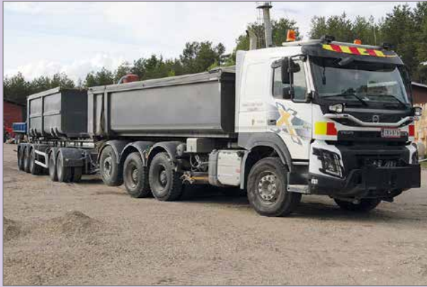
Särkelä&Mattila Oy toimii maarakennuspuolella Pudasjärven alueella.

Maarakennuspuolella töitä on riittänyt. Yritys tekee urakoita Destialle, jolta Ely-keskus tilaa työsuorituksia. Kesäisin yritys kunnostaa teitä ja niiden luisia puhdistamalla pajukot koneellisesti sekä vahvistamalla tienreunojen kantavuutta. Korjauskohteita on Pudasjärven ja Taivalkosken alueella riittämiin. Yksityiset henkilöt, tiehoitokunnat ja muut tahot tilaavat Särkelä&Mattila Oy:ltä mursketta tai seullottua hiekkaa eri tarpeisiin. Talvella yritys hoitaa