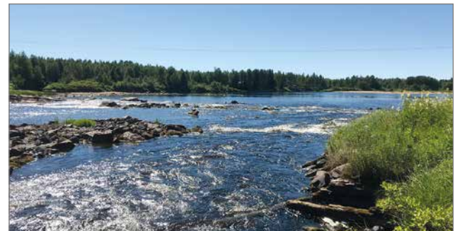
Kyngään koskessa on vieläkin nähtävissä vanhan sahan pohjat. Näiltä pohjilta on noussut koko Kyngään kylä.

viimeisen vuosikymmenen aikana pohjoismaiden johtavaksi lasiliukuseinien valmistajaksi. Tämän taustalla on Aasian markkinoilta saadut opit lasiliukuseinistä yhdistettynä pohjoisten olosuhteiden teknisiin vaatimuksiin.