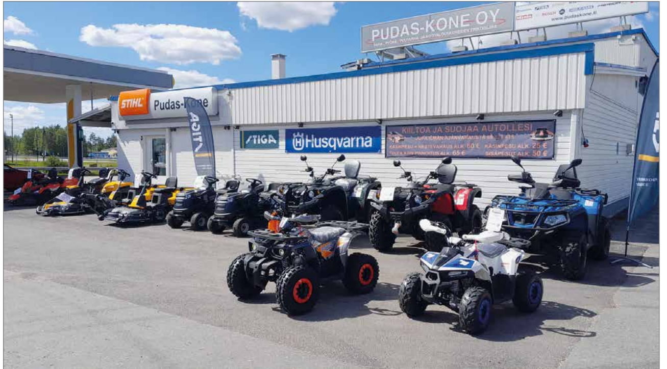
Pudas-Koneesta löytyy ajoleikkureita jokaisen tarpeeseen.