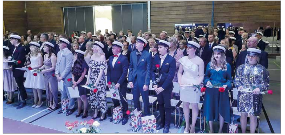
Suvivirren kolmas säkeistö laulettiin ylioppilasjuhlassa kunnioittavasti seisaaltaan.