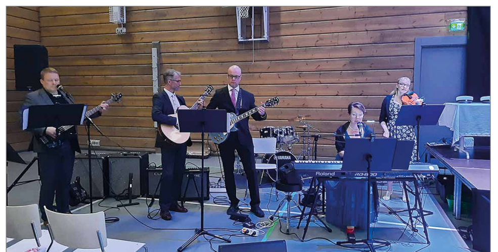
Opebändi esitti kappaleet "Toukokuu" ja "Maailma on kaunis"