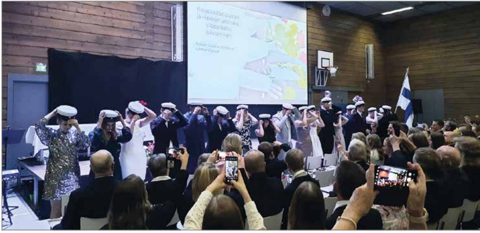
Valkolakit päähän! Kolme vuotta opiskelua takana ja odotettu H-hetki täyttyy!