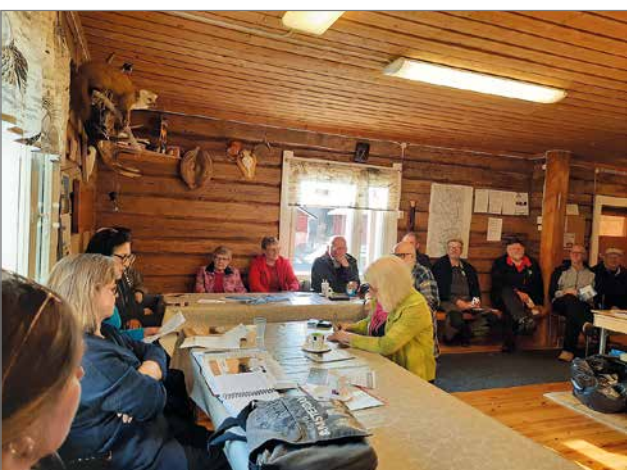
Siuruan kyläillassa olivat edustettuna myös kylällä toimivat eri yhdistykset.