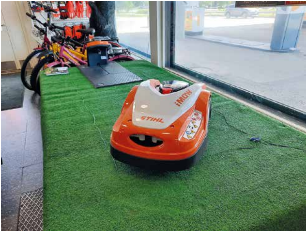
Konepäivien työnäytös hoitui automaattisesti robottileikkurilla.

Pudas-Kone järjesti näyttävät konepäivät perjantaina 10. kesäkuuta. Aurinkoinen sää suosi muun muassa ajoleikkureiden esille laittamisen liikkeen ulkopuolelle. Esillä oli Stigan, Husqvarnan ja Alpinan nurmikoneiden ajon soveltuvat päältä ajettavat leikkurit. Hyviä tarjouksia oli myös trimmereistä, ruohonleikkureista ja robotiruohonleikkureista. Pudas-Koneen pienkonekorjaamo korjaa ja huoltaa monenlaisia pienkoneita ja polkupyöriä. Saman katon alta löyty-