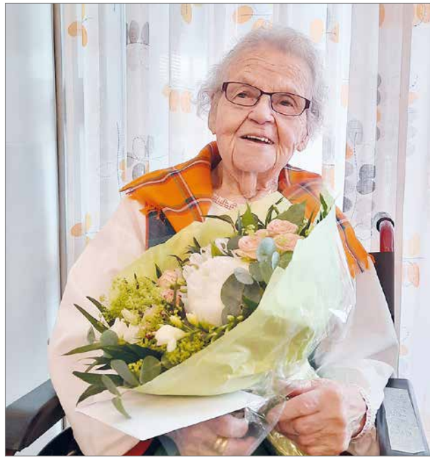
Marjattan elämänohje 90-vuotiaana: "Nukun, kun nukuttaa, syön, kun on nälkä, teen töitä, kun siltä tuntuu."

Se lämmin läikähähdys. Aito tunneside sydämeistä sydämeen. Näitä kultaisia lankoja olet kutonut, elämässäsi valtavan verkoston. Sinun luoksesi on voinut tulla raskain sydämin, multaisain saappain. Sinun luotasi on kulkija lähtenyt, kyläläisenä, kevein mielin. Olet ollut meille paras suvaitsevaisuuden opettaja. Siihen ei ole tarvittu suuria sanoja,