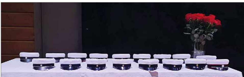
Pudasjärven lukion uudet valkolakit vuosimallia 2022.