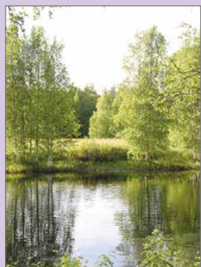
Lammintauspellolla on toiminut tiilitehdas 1950-luvulla.

Perimätiedon mukaan Kynkäällä, Kiiskilammen päässä on toiminut 1600-luvulla leprahospitaali. Tuolloin lepra eli spitaali levisi Suomessa nopeassa tahdissa ja Kustaa II Adolf määräsi Turun spitaalisairaalan siirrettäväksi Seilin saareen tartuntojen leviämisen hillitsemiseksi. Leprasairaaloita perustettiin tarpeen mukaan ympäri Suomea ja yksi on kirjattu myös Pudasjärvellä toimineeksi. Suhteellisen runsaslukuisesti esiintynyt lepra katosi Pudasjärveltä 1860-luvulle tultaessa.