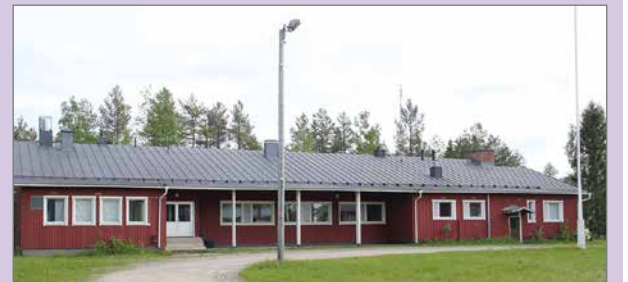
Aittojärven koulurakennus on hyväkuntoinen ja kelpaisi vaikka opiskelukäyttöön, mitä kylällä suuresti toivotaan. Rakennusten väri on vuosikymmenten aikana muuttunut keltaisesta punaiseen.