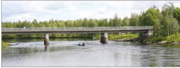
Kyngään uusi betonisilta ylävirran puolelta kuvattuna.

Sahan jälkeen Kyngäs kehittyi kylänä. Esimerkiksi Pudasjärven Osuuskauppa rakensi myymälän 1920-luvulla, joka oli seudun kylien yhteinen Osuuskauppa. Lisäksi Kyngäällä toimi kansakoulu