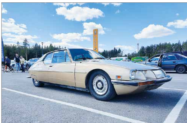
Kuva puhukoon itse.