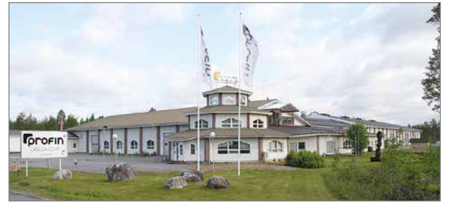
Tehdasrakennus on näyttävällä paikalla Ouluntien varrella.