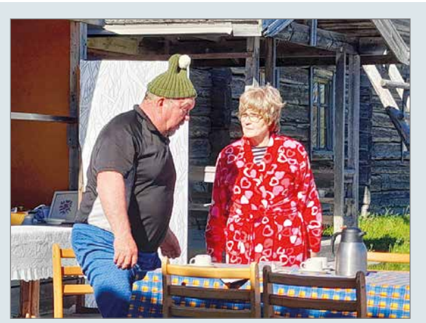
Jussilla ja Allilla on aamutuimaan keskusteltavaa.