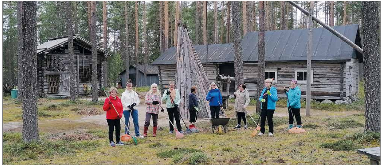
Hilimat aloittelemassa haravointia.

Kausi oli valoisampi osittaisista rajoitteista huolimatta kuin edellinen kausi. Saimme järjestää Isänpäivänkonsertin viime syksyn isänpäivänä ja tämän