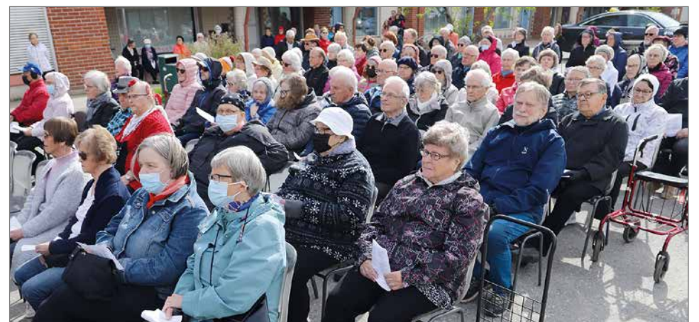
Helatorstain torimessuun osallistui reilut 200 henkeä.