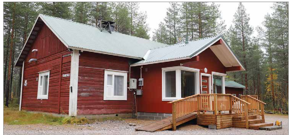
Vuonna 1988 käyttöönotettua Marikaisjärven toimitaloo on pidetty hyvässä kunnossa. Taloo vuokrataan myös matkailukäyttöön.