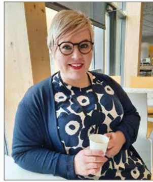
Terveystulot puoluokokoukseen Lappeenrantaan. Jos puolueväki ja keskustalainen liike niin suo, haluaisin jatkaa tehtävääni puolueen puheenjohtajana, sanoi puheenjohtaja Anneli Saarikko.

maa joutuu aina tekemään uudelleen valintoja ja asemoimaan itsensä uudelleen. Me olemme pitkään rakentaneet Suomen yhteensopivuutta Naton kanssa. Meidän paras turva ei ole Nato, vaan Suomen oma armeija, Puolustusvoimat ja vahva maanpuolustustahto. Suhteemme Venäjään on muu-