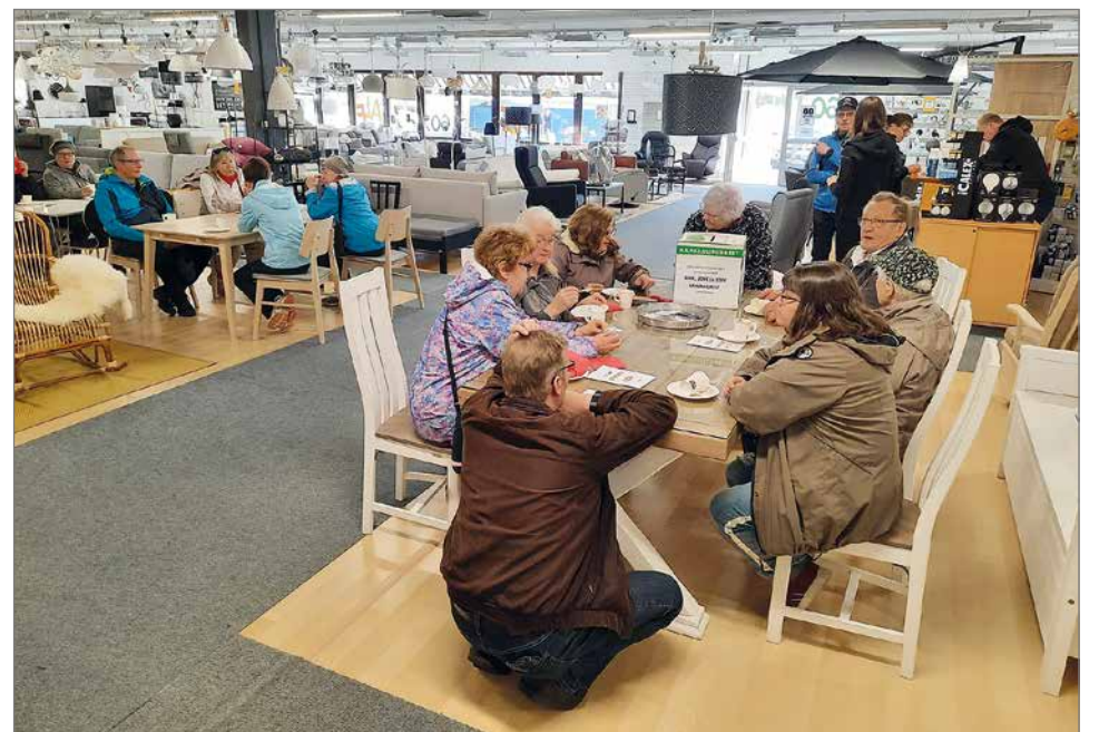
Hilimat hoitivat syntymäpäivien kakkukahvitarjoilun. Kahvin lisäksi kävijät osallistuivat lahjakorttien arvontaan.

tirakennuksessa. Sitten liike muutti Jukolantie 4:ään, jossa ennen toimi Osuuspankki. Pankin muutettua pois tilalle tulivat K-kauppa ja Heikkilän huonekaluliike. Kun K-kauppa muutti Hartsun tiloihin, sai One koko alakerran käyttöönsä.