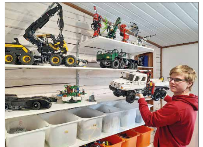
"Lego-rakentamisessa sain hyvin nollattua ajatukset opiskelusta ja jos molemmat alkoivat tökkimään, niin löysin aina jonkun muun aktiviteetin".