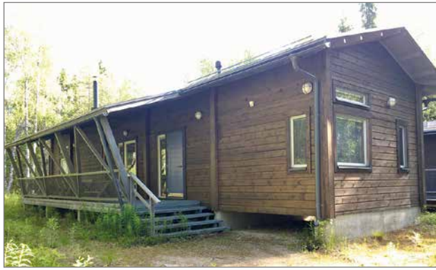
Kipinän kalastusmatkailukeskuksen kesäinen kuva vuodelta 2019.