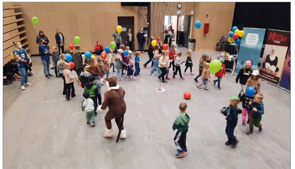
MisseKissan konsertissa oli jäykkyys kaukana. Lapset osallistuivat monella tavalla musiikkiin, taputtaen, nauraen, tanssien ja liikkuen.

tynyt televisiossakin. MisseKissa esiintyy mielellään siellä, missä on lapsia ja lapsenmielisiä.