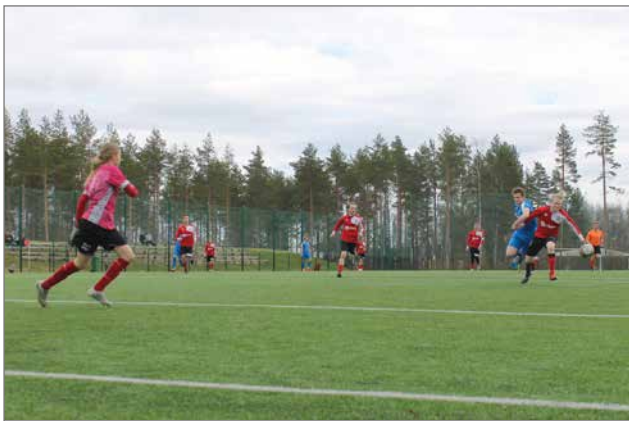
Suojalinnan kenttä saatiin pelikuntoon päivää ennen kauden kotipelin avausta.

Kurenpoikien kausi Nelosessa jatkuu viikonloppuna vieraisa Haukiputaalla. Seuraava kotipeli pelataan 11.6. Suojalinnalla. TN