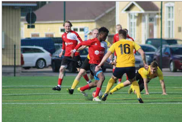
Kotipelit ovat keränneet jo alkukaudesta paljon yleisöä.