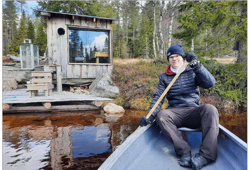
"Kun tekee jotain fyysistä, niin henkinenkin puoli rauhoittuu. Takapihan lammella voi meloia, uida ja sauna"

- Täytyy muistaa, että opiskelu tai menestys kokeissa ei ole ainoa asia, joka määrittää