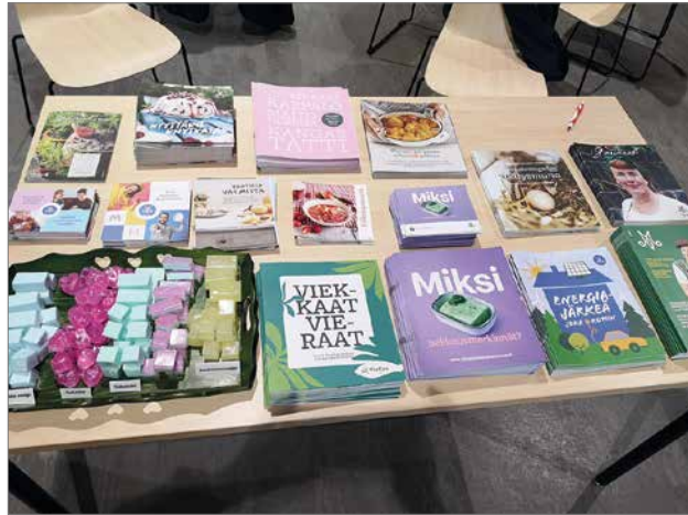
Pöydällä oli Marttojen esitteitä ja kävijät saivat mukaansa itsetehdyn saippuan muistoksi.