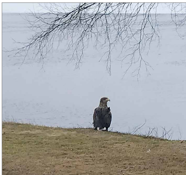
Merikotka Korentojärven rantatörmällä. Kuvan ottohetki 2.5. kello 7.07.

- Aamulla 2.5. satuin katselemaan ulko-oven ikkunas-ta ulos. Kello oli noin seitsemän. Ihmettelin, että mikä suuri tumma lintu seisoo rannalla. Oli se erikoinen näky näin aamutuimaan. Kuka tietää, kuinka kauan lintu siinä ollutkaan? Arvelin, että se oli tullut ilmeisesti syömään kuollutta lokia, joka lojui vielä rannalla. Lapset olivat huomanneet lokin rannassa edellispäivänä ja kertoivat siitä minulle ja ajattelin, että se pitää haudata. Jälkeenpäin kävin rannassa. Lokista oli jäänyt vain höyhenet ja sulat rannalle. Ilmeisesti kotka oli syönyt sen.