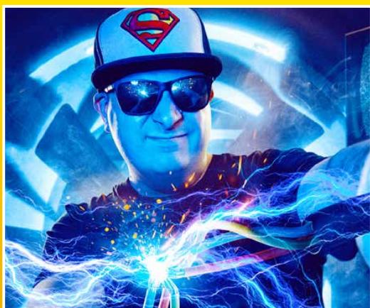
Dj Ice K