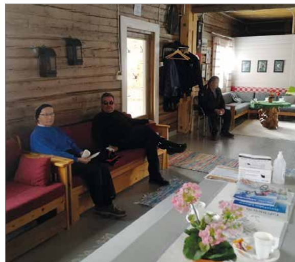
Pirtin uunin lämmössä kyläkierroksen väki jutteli kylälaisten kanssa.