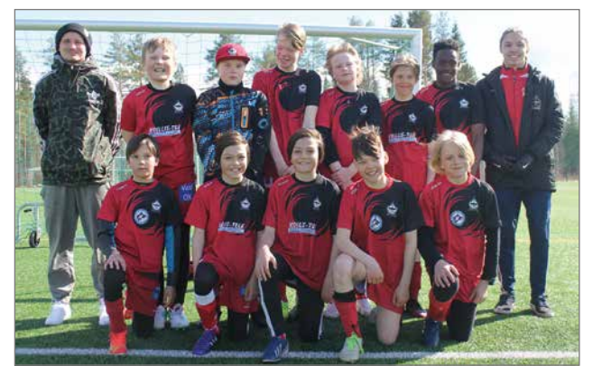
Kurenpoikien 2009-2010-syntyneet pelaavat tällä kaudella P13 Kakkosta.