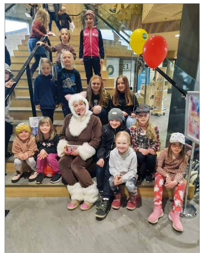
MisseKissa sai heti ystäviä pudasjärveläisistä lapsista.