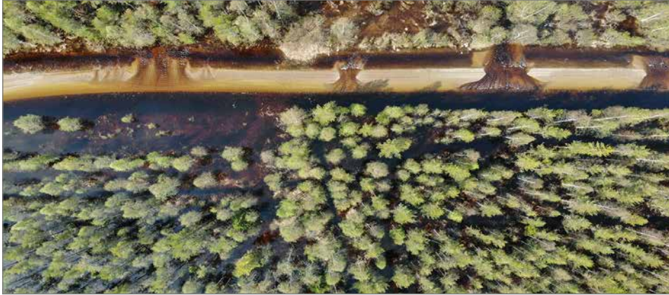
Tulvavesi virtaa Jongunjärvestä Kiiminkijoen puolelle Länsirannantien ylitse.

Kuusamossa Karhunkierros katkesi tulvaveden