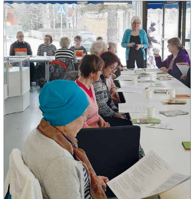
Tilaisuudessa kävijät saivat mukaan esitteitä ja syöpäsairauteen liittyvää tietoa sekä paikallisosaston toiminnan esitelyä.