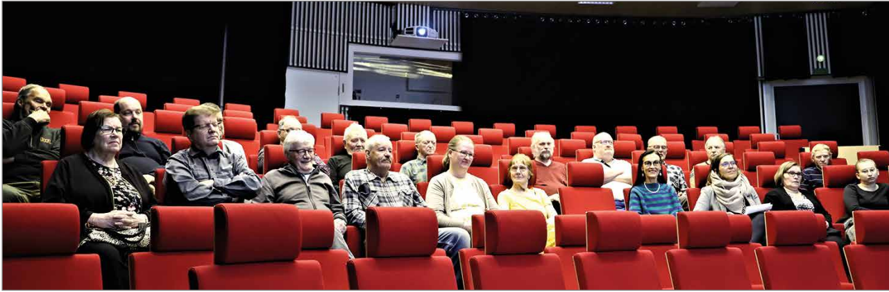
Kokoukseen osallistui reilut 20 Keskustan jäsentä.