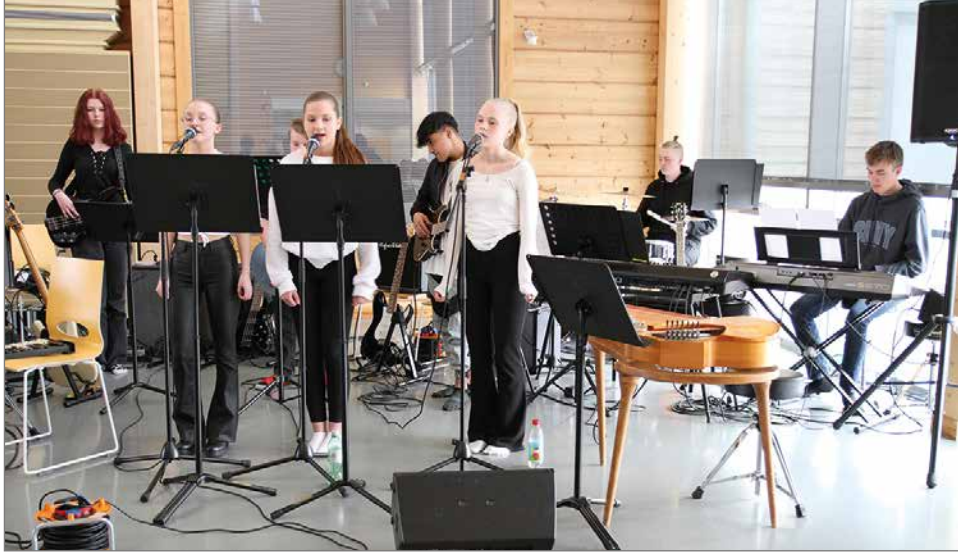
8-luokkalaisten bändi omassa esiintymisessään.

Hirsikampuksen oppilasryhmät, opettajat ja paikalliset esiintyjät yhdessä SPR:n Pudasjärven osaston kanssa järjestivät jo toisen kerran yhdistetyn Äitienpäivä- ja hyväntekeväisyyskonsertin keskiviikkona 10.5. Hirsikampuksella.