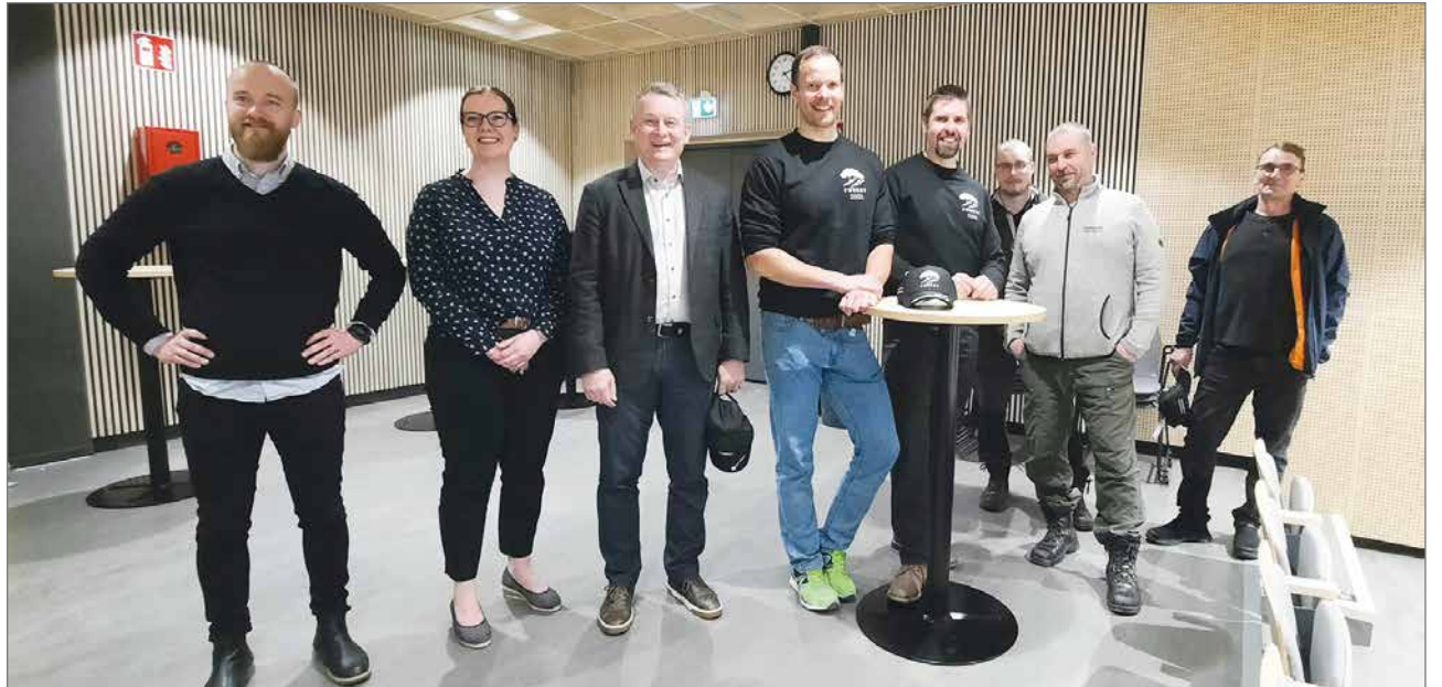
Pudasjärven Osuuspankki järjesti asiakastilaisuuden yhteistyössä Pitkämäki & Ruuskanen Forest Oy:n kanssa.