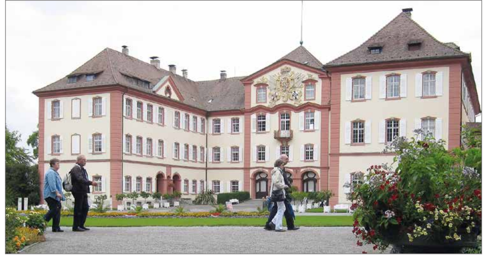
Badenin herttuaperhe vietti kesiään Mainaun linnassa.

Ruotsin väreihin pukeutunut oppaamme kertoo, että saarella tarvitaan lukuisia hyväselkäisiä puutarhureita hoitamaan kukkaistutuksia