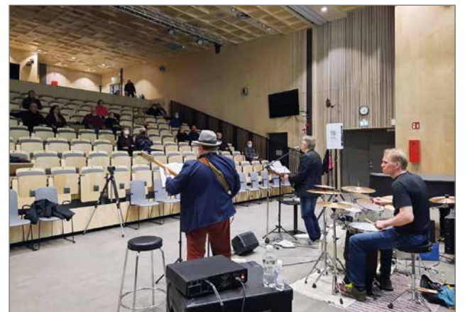
Enempikin olisi väkeä mahtunut Kurkisalisiin, mutta siitäkin huolimatta Vauhko Varsan jäsenet iloitsivat, kun saivat esiintyä oikealle yleisölle.