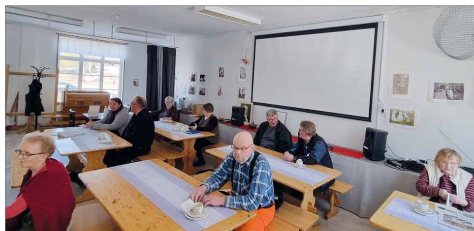
Korpisen kyläillassa oli koolle yhdistystoimijoita ja kylän asukkaita.