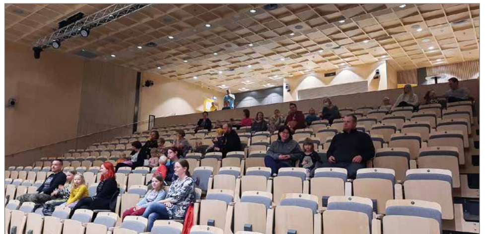
Lastenmusiikkikonsertti veti ihan mukavasti lapsiperheitä Kurkisaliin.