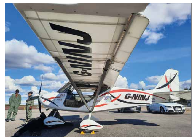
Tämä ultralight eli kevytrakenteinen lentokone vie vähän yli toistakymmentä litraa bensiä tunnissa.