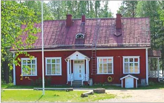
Tapahtumia Korpisen kylätalolla on koronasta huolimatta järjestetty lähes 30 vuosittain.

Korpisen kylälle on tulossa uudet nettisivut entisten ti-