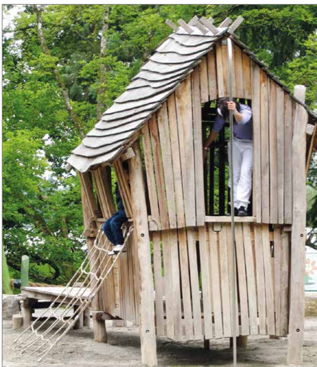
Kukkasaarella on lapsille mieluisia leikkipaikkoja.

Prinsessa Viktoria (1862–1930) oli taiteellisesti lahjakas ja hyvin koulutettu, siis mainiota kuningatarainesta. Hänestä tulikin Ruotsin tulevan kuninkaan Kustaa V:n puoliso ja kolmen pojan äiti. Siten Badenin suurherttualliseen runkoon varttui oksia Ruotsin Bernadottejen ja myöhemmin Venäjän Romanovienkin sukupuista.