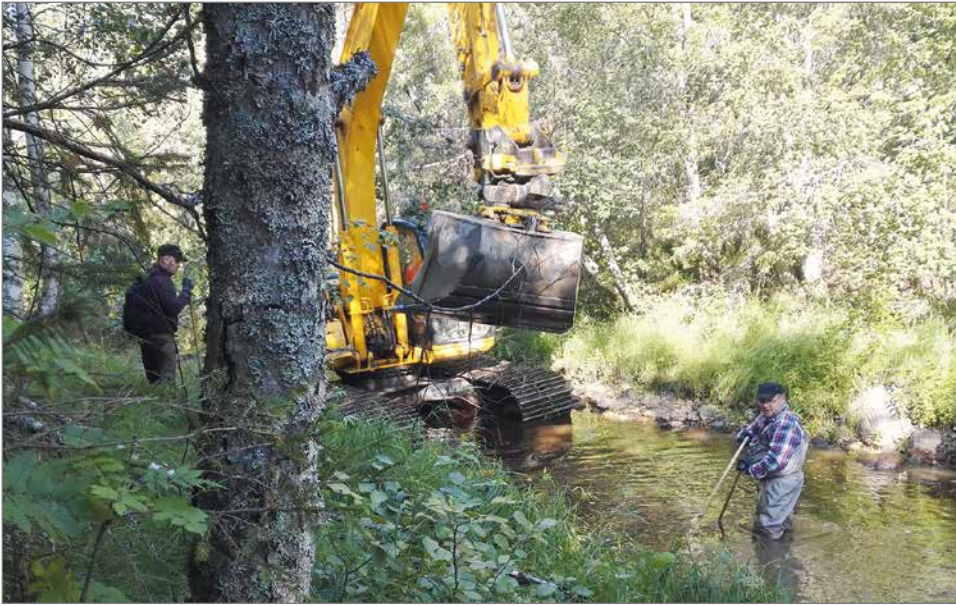
Panumaojan virtavesikunnostuksen aloitusvaiheita.