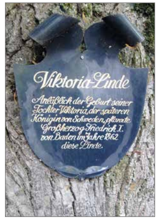
Prinsessa Viktorian syntymästä kertova laatta 160-vuotiaan lehmuksen rungossa.

Judith Pfindel & Heinz-Dieter Meyer: Die Pflanzenwelt der Mainau. Hampp-Verlag 2005.