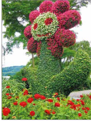
ervetuloa Mainaulle! Bodensjärvi pilkkahtaa vasemmalla.