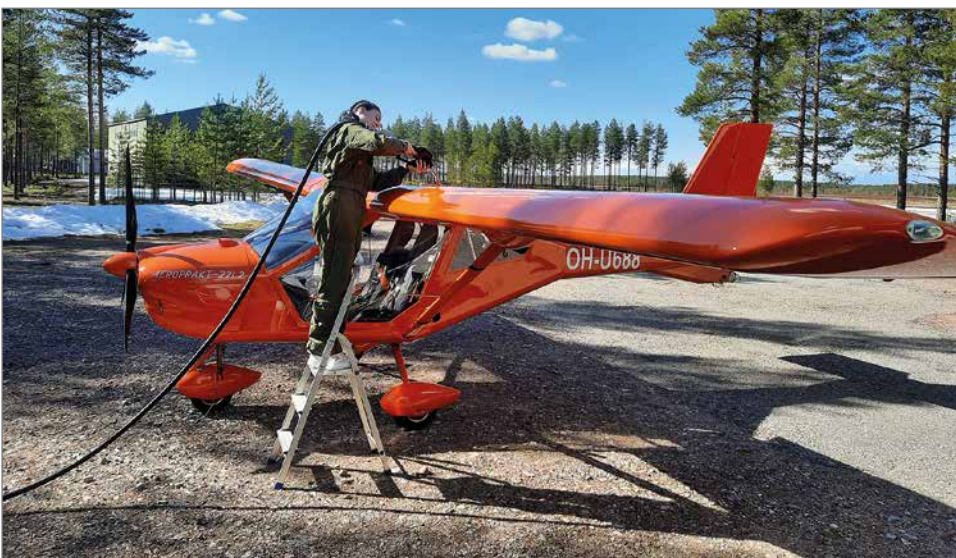
Kiia Tapio tankkaamassa Pudasjärven Ilmailukerhon 100.000 euron arvoista koulutuskonetta ennen lähtöä.