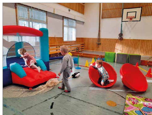
Illan vastuuhenkilöt olivat järjestäneet riemukasta tekemistä lapsille.

Suurkiitos Kipinän koululle ja Kipinän kyläseuralle mutkattomasta yhteistyöstä ja mainioista tiloista! Tietysti erityiskiitos illassa mukana olleille vanhemmille ja lapsille! Perheen parhaaksi -projekti järjestää touko-