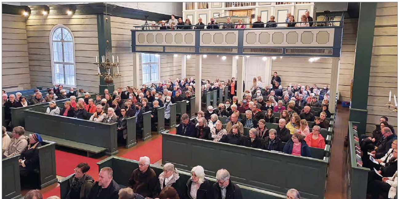
Kaatuneiden muistopäivänä järjestetty konsertti väki kirkon lähes täyteen.