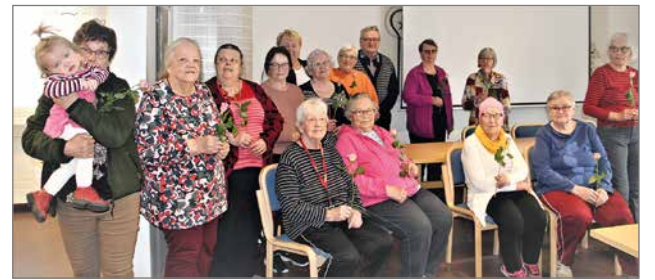
Toukokuun kerhopäivässä jaoimme ruusut kaikille naisille.

Sihteerit kertoivat tulevasta tapahtumasta, joista seuraavana tulee olemaan Oulussa Kainuun alueen Invalidiyhdistysten RYPÄS-tapahtuma Hilturannassa, jonne saamme vieraita Kajaanista ja Kuhmosta. Pudasjärven Invalidit ry. on tässä järjestelyvastuussa. Päivän ohjelmaan kuuluu koulutusluento, ruokailu, kahvit, tutustumista toisiin yhdistyksiin ja heidän toimintaansa, sekä tietenkin haluamme näyttää vieraille