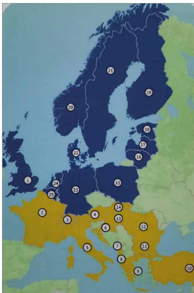
Mielenkiintoinen lentoreitti. Varsinaista seikkailua.