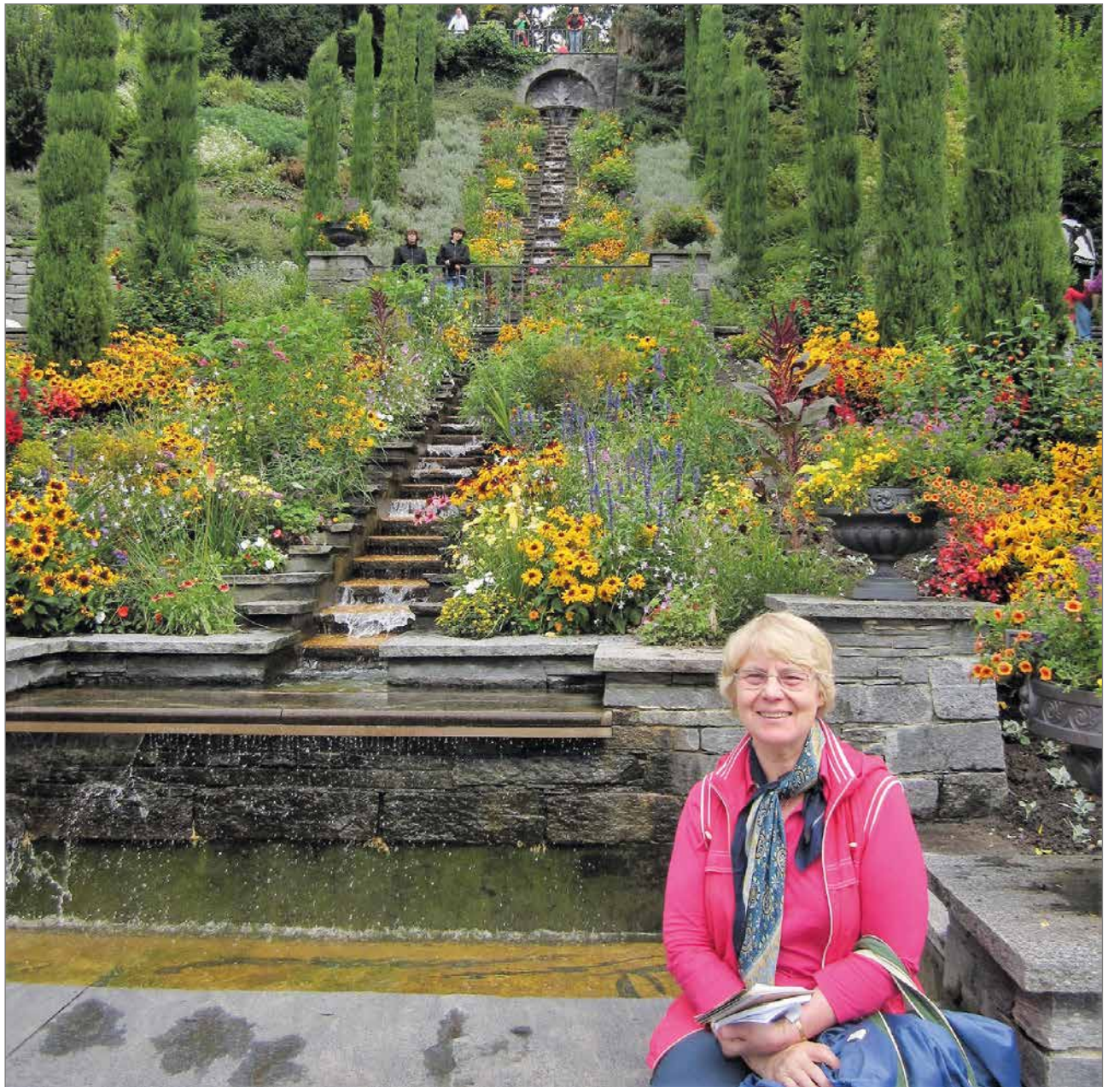
Kirjoittaja elokuussa 2010 Mainaun italialaisilla vesiportailla. Loppukesästä kukkivat daaliat.