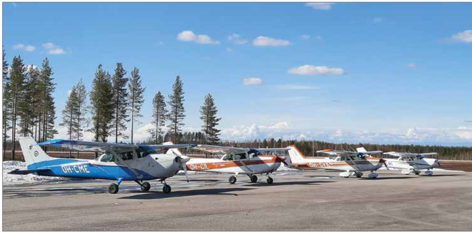
Harjoituspäivään osallistui lentokoneita kuudesta eri Pohjolan Lentopelastajat ry:hyn kuuluvasta kerhosta.

Tämän päivän harjoitus keskittyy enemmän näihin palovalvontalentoihin. Me varmistamme, että meidän miehistö, koneet ja ka-