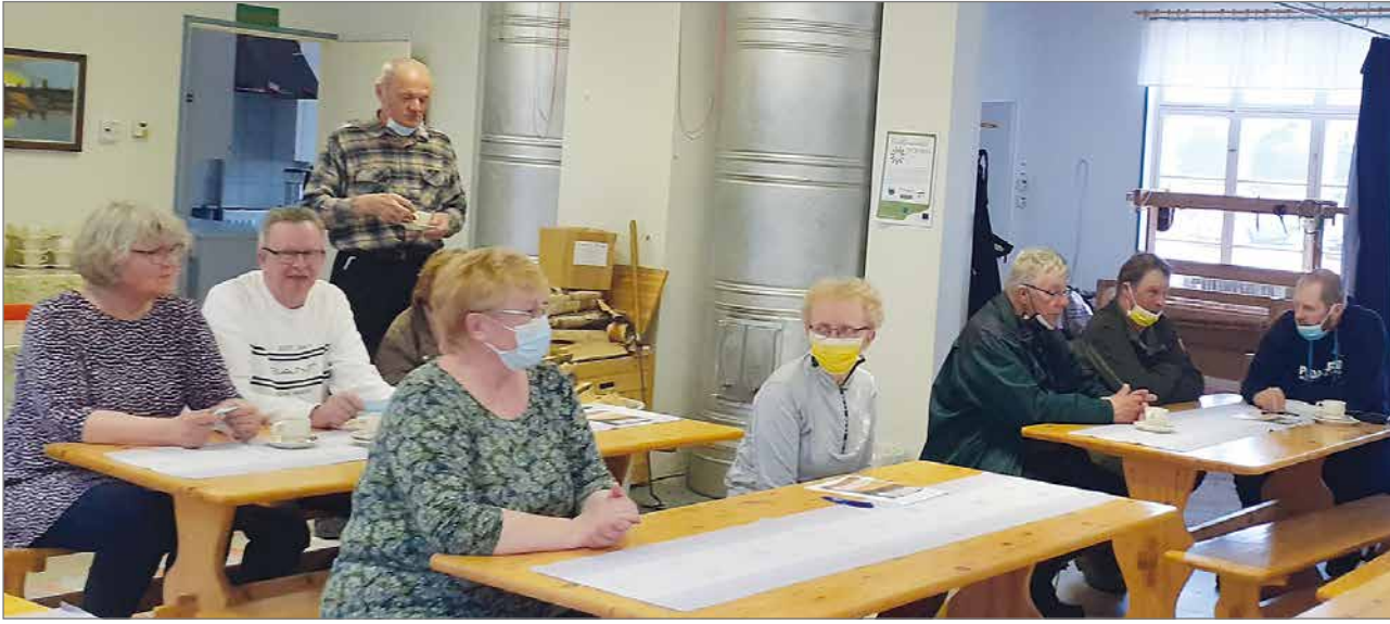
Korpisella saatiin ajankohtaista tietoa yksityisteille myönnettävistä kunnossapitoavustuksista.