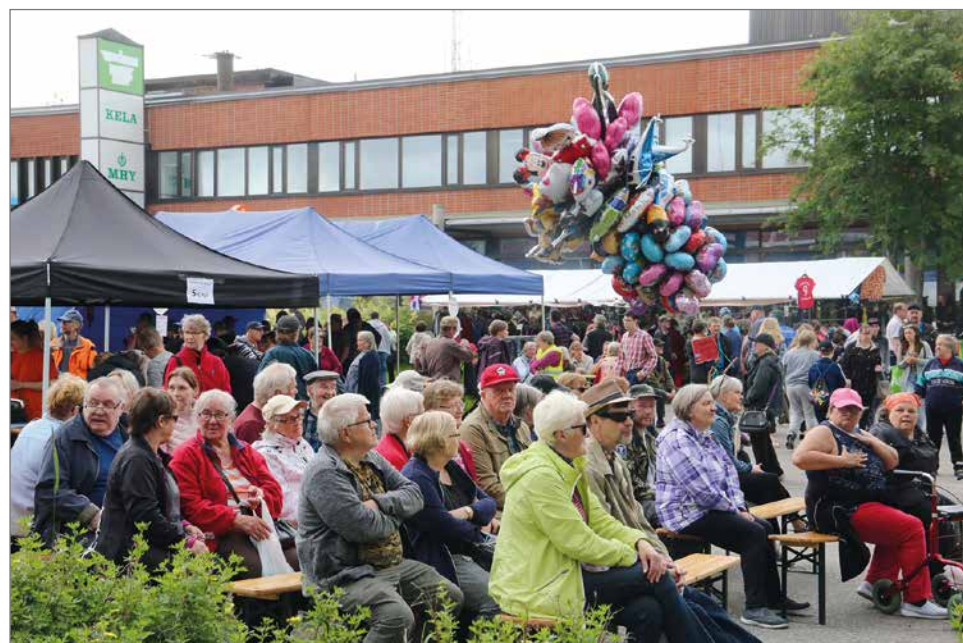
Markkinat järjestetään 8.-9.7. Pudasjärven torilla kahden vuoden tauon jälkeen. Kuva viimeksi pidetyiltä markkinoilta vuonna 2019.