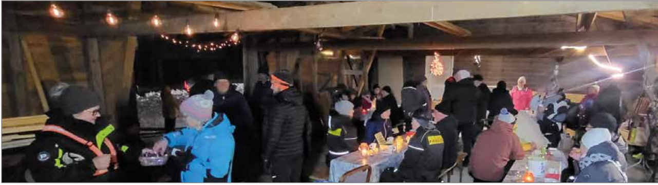
Entisen Ahosen kaupan Varastosaliksi nimetty tila antoi lämpöistä suojaa juhlijoille.