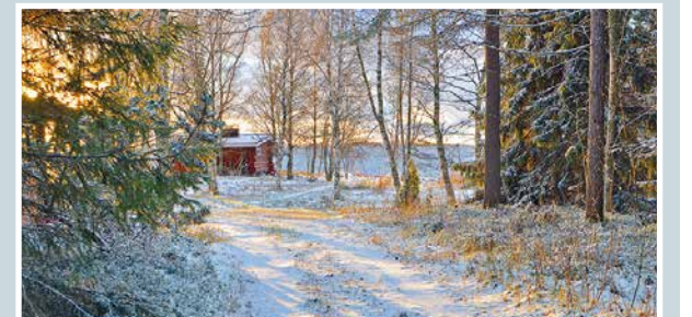
Ranta. Maaklaama.

lukijoiden palaute ja jutut: vkkmedia.fi