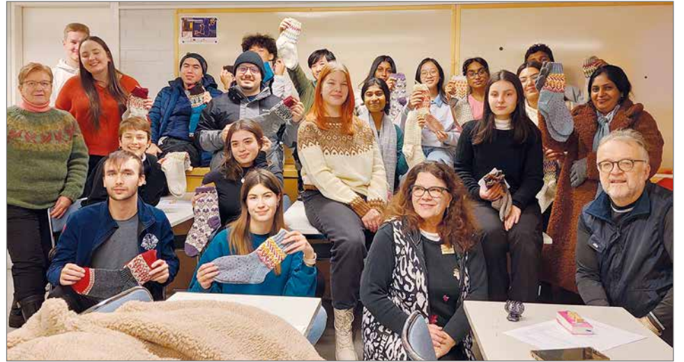
Reilun viikon perhemajoitusjakson jälkeen kokoontuttiin lauantaina 7.1. Pikku-Syötteelle. Pudasjärviset villasukat olivat leiriläisille miellyttävä lahja.

LC Pudasjärvi vastaa leirikokonaisuudesta ja Pikku-Syötteeltä on ostettu Nuorisokeskuksen palvelut. Vierailupäivän järjestävät alueemme muut klubit LC Pudasjärvi/Hilimat, LC Posio ja LC Ranua. Lions liitto ja L-piiri tukevat leirin kustannuksissa ja Pudasjärven kaupunki mahdollistaa vierailun Hirsikampukselle tu-