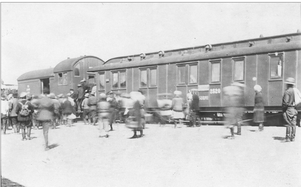
Kapinointia Nivalan asemalla.