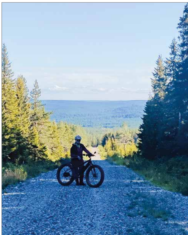
Maastopyöräilyn harrastajamäärä on lisääntynyt huomasti ja mm. Syötteen metsissä vilisee pyöräilijöitä ympäri vuoden.