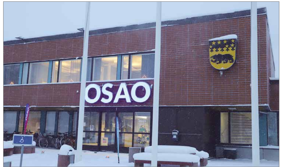
OSAOn Pudasjärven yksikkö on toiminut kuluvaan lukukauden alusta entisessä kaupungintalossa. Puuteollisuuden ala ja asuntola toimivat edelleen Jyrkkäkoskentiellä, mutta muut alat Varsitillä.

Uhkakuva OSAO:n toiminnan loppumisella on myös yrityksille työvoiman saatavuuden vaikeutuminen. Siitä on taas seurauksena, että kaupungille verotulot laskisivat ja paik-