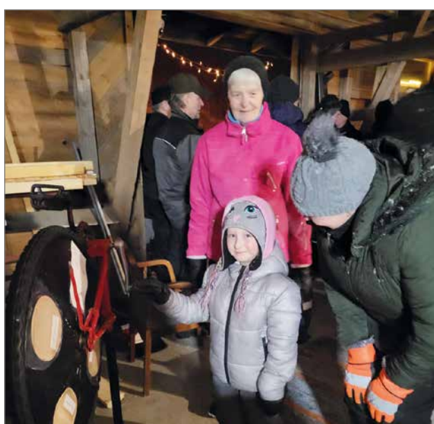
Lapsille oli järjestetty myös tekemistä koko perheen uudenvuoden tapahtumassa Siurualla. Onnenpyörän pyörittämisestä lapset saivat palkinnoksi heijastimen.