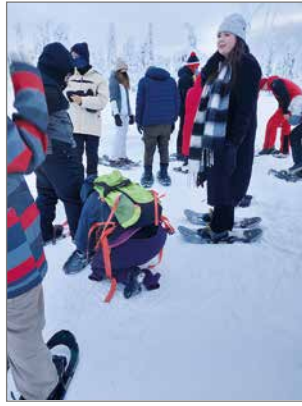
Lumeen tutustuttiin ensimmäiseksi lumikenkäillen.

Saunakulttuuriin emme saaneet nuorta tottumaan, vaikka kuulimme muissa perheissä nuorten nauttineen saunan lämmöstä. Jotkut ovat jopa uskaltaneet avautua. Hiihtokin on jo osalle tuttua.