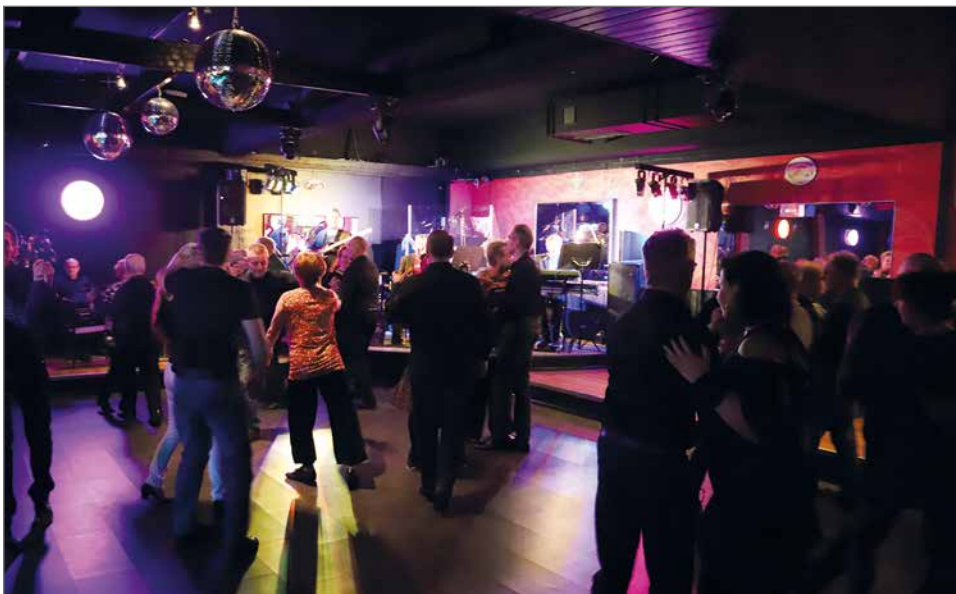
Uudistetusta ja aikaisempaa tilavammasta tanssilattiasta tuli tanssijoilta myönteistä palautetta.