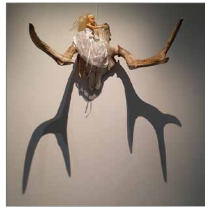
Hirvenkallo ja barbinukke 2019.