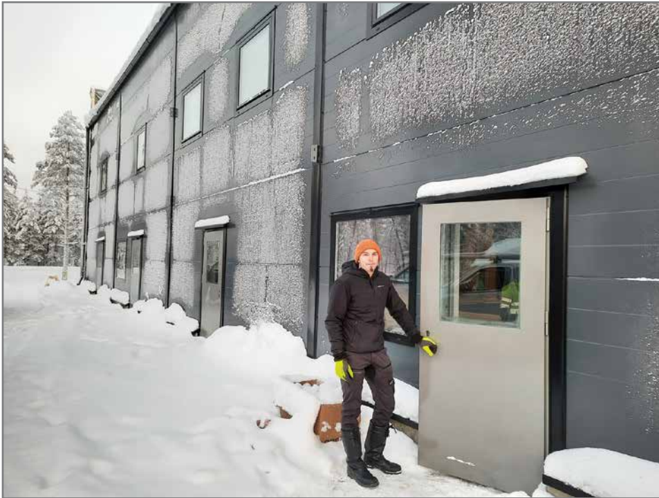
Rakennusvaiheessa on kuunneltu tulevien yrittäjien tilatoiveita.