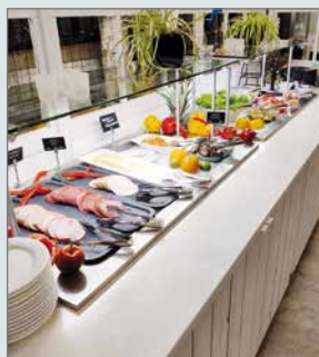
Ruokien makujen maailma oli aivan käsittämätön. Kylä sen mausta huomasit, että ruuat olivat itse tehtyjä.

den päästä uudestaan joko konserttireissu tai pikkujoulureissu. Toiveena oli, että mentäisiin kylpylään. Sen aika näyttää mihin päin suuntaamme. Kiitos kaikille mukana olleille. Sekä kiitos Syötteen Taksipalvelulle yhteistyöstä ja kyydityksistä.