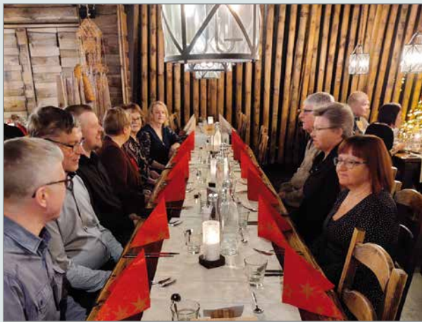
Mukana olleiden mielestä reissu oli onnistunut ja mukava. Seuraavaa pikkujoulureissua ehdotettiin kylpylämatkaksi.

Luantaina aamiaiselle mentäessä huomasimme, miten hyvin oli otettu huomioon koronarajoitukset. Aamiaisaikaa oli pidennetty kello 11 asti, jolloin jokainen hotellivieras sai syödä aamiaisen rauhassa ja kiirehtimättä. Täytyy sanoa, että aamiaispöytä oli yksi parhaimmista mitä olen kokenut.