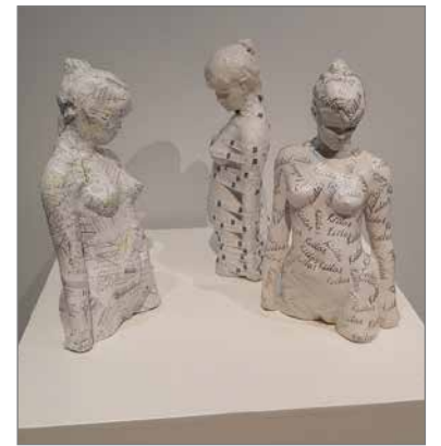
Myydyt morsiamet 2017.