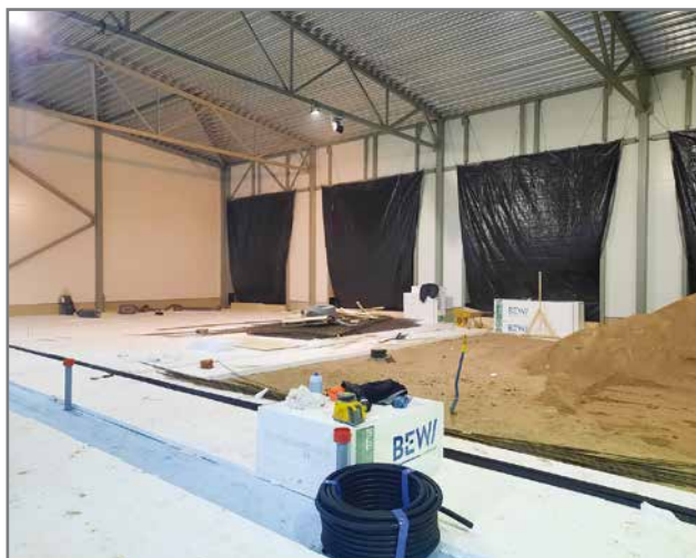
Uusi halli antaa hyvät ja tilavat puitteet halliin muuttaville yrityksille.