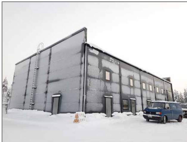
MS-vuokratilat Oy uusin projekti on valmistumassa Kuusa- montien varteen.

- Alun perin idea uuden hallin rakentamiselle läh- ti siitä, että meillä on entuu- destaan vuokrattavaa tilaa. Meillä on asuntoja ja toinen teollisuushalli, joka on kau- pungin toisella teollisuus- alueella. Olemme nähneet, että nykyaikaiselle hallitilal- le on kysyntää. Pudasjärvel- lä sitä ei ollut tarjolla. Aja- tus uuden rakentamisesta on hautunut pitkään. Nyt tuli sopiva aika. Sitäkin on mietitty, että voisiko Pudas- järvellä olla tarvetta ns. ci- tytallien vuokraamiselle yksityisille. Meillä on muu- tamia lämpimiä noin 10 ne- liön varastotiloja vapaa- na teollisuuskylässä. Siellä meillä on toimisto- ja halliti- laakin. Meillä on teollisuus-