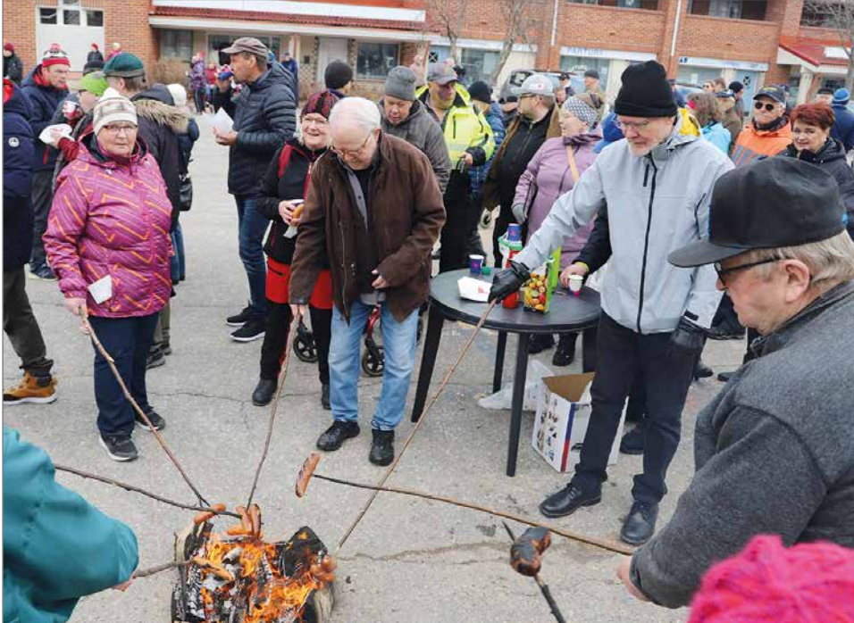
Grillimakkarat olivat hernekeiton ohella suosittuja. Tilaisuuden järjestäjät kävivät hakemassa useita kertoja makkaroita lisää.