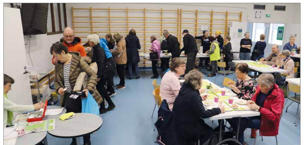
Hilimat myivät omaa arpoja messutilassa. Erikseen peilihuoneessa heillä oli vielä kahvio, jossa oli tarjolla Lapin ukon juhlakeittoa ja kahvia leivonnaisten kera.