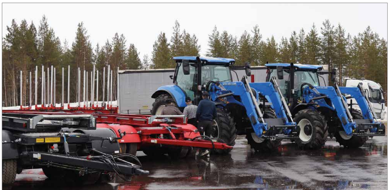
Kilaforsin ja New Hollandin uutuuksia esittelyssä.