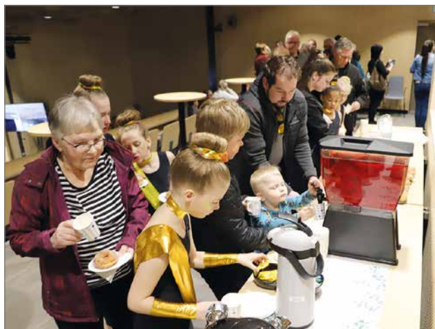
Lopuksi voimistelijoille ja yleisölle oli mehu- ja kahvitarjoilu munkkien kera.