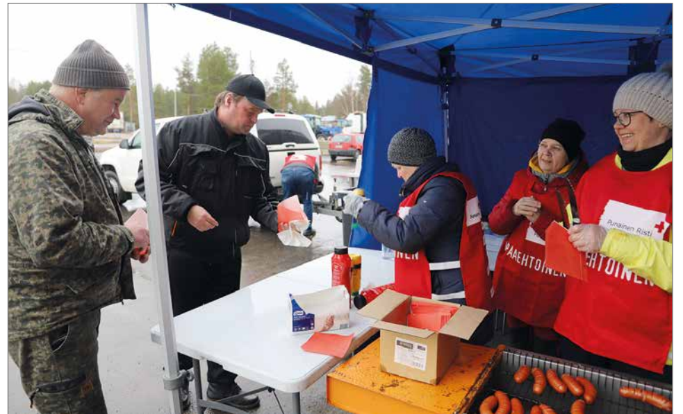
Esittelyssä ja koeajettavana oli New Holland T6, T7 ja T4-malleja sekä Valtra N175, A105 ja Fendt 724 traktorit.

SPR:n vapaaehtoiset huolehtivat, että kaikille kävijöille riitti grillimakkaroita.