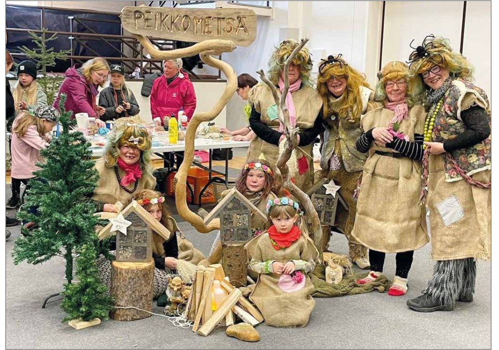
Siuruan peikot esiintyivät ja heillä oli oma työnurkkaus, jossa sai valmistaa peikkoja.