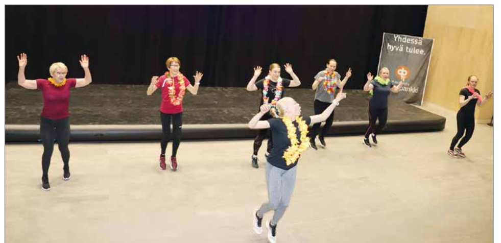
Maanantain tehotreenin jumpparyhmä esiintyi teemalla Loma, loma, loma!