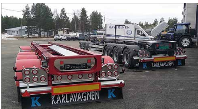
Koskitraktori Oy toimii Kilaforsin jälleenmyyjänä Suomessa.