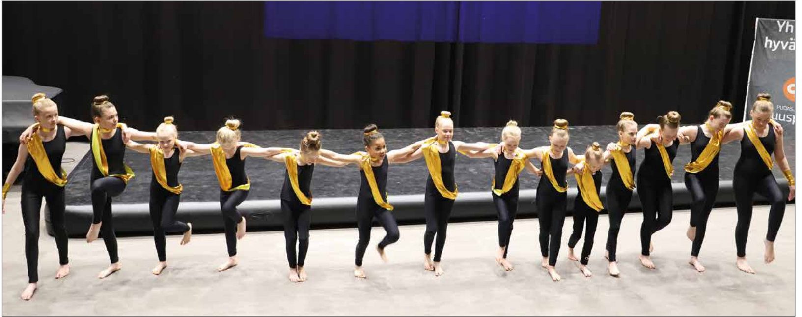
Illan avasivat voimistelukoulun 8-13 -vuotiaat tytöt Queen of Kings -esityksellä.

Illan avasivat voimistelukoulun 8-13 -vuotiaat tytöt Queen of Kings -esityksellä,