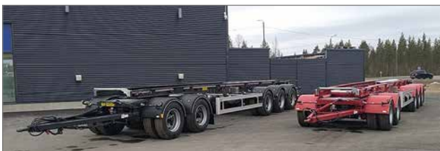
Esittelyssä oli uusia Kilafors Karlavagnen puuperävaunuja.

Heimo Turunen