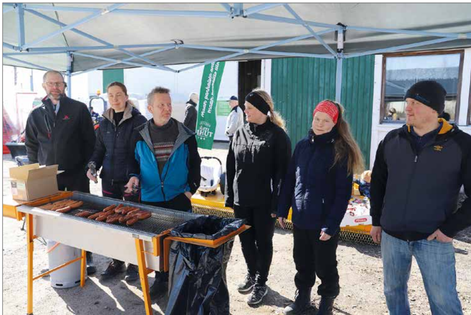
MTK Pudasjärven johtokunnan jäsenet huolehtivat avajaispäivän grillimakara- ja kahvitarjoilusta.

Avajaispäivän grillimakara- ja kahvitarjoilun hoitivat MTK Pudasjärven johtokunnan jäsenet. Kinnusen Myllyn edustaja oli myös paikalla. Pudasjärven myyntitoimisto on avoinna maanantaista perjantaihin 8.30-16.30 tai sopimuksen mukaan. HT