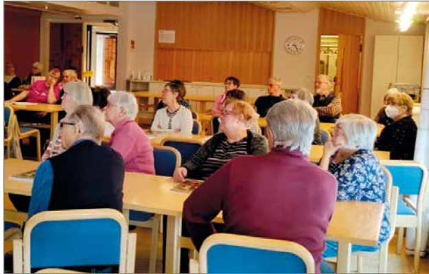
Kerholaisia kiinnosti syöpäpotilaiden ja läheisten neuvonnan ja vertaistuen tärkeys ja niiden saatavuus.