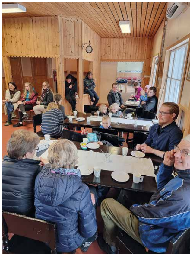
Kyläläiset toivoivat kyläkoulun pihalle lasten leikkivälineitä ja kylälle kunnollista lasten leikkipaikkaa.