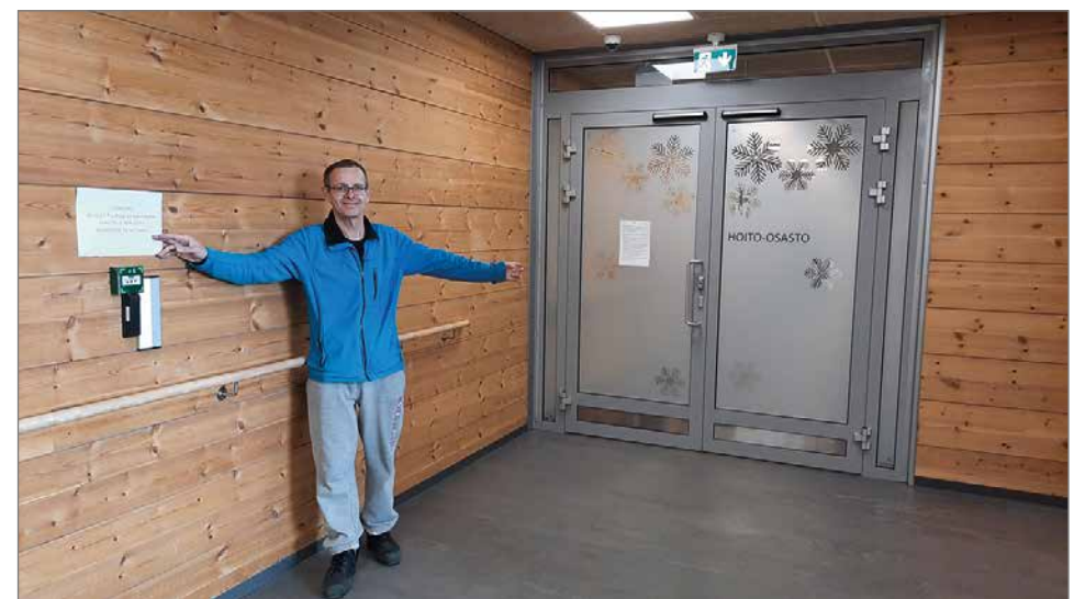
Kello 8.00-16.00 välillä, soita puhelinnumeroon, niin hoitaja avaa vuodeosaston oven.