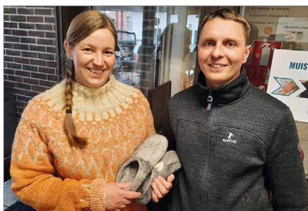
Murasilla on Ely-keskuksen kautta maisemanhoitosopimukset. Lampaiden tekemä työ näkyy maisemanhoitokohteissa.