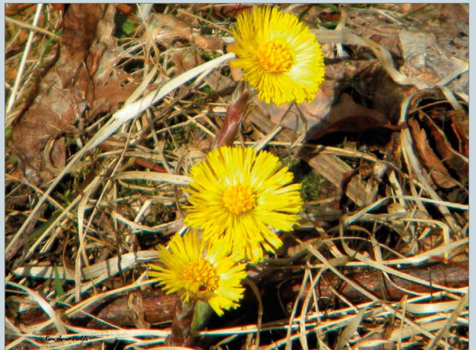
Leskenlehden käytöstä on viitteitä jo tuhansien vuosien ajalta niin lääkekasvina kuin muunkinlaisena hyötykasvina. Leskenlehti on ollut merkittävä kasvi myös eri uskonnoissa. Katolisessa kirkossa leskenlehti tunnetaan Neitsyt Marian kukkana.

Leskenlehti kasvattaa uudet lehdet vasta kukkimisen jälkeen. Keskikesällä parhailla paikoilla saattaa olla laaja yhtenäinen leskenlehden vihreä matto. Tiheässä kasvussa muut kasvit eivät pääse tunkemaan itseään leskenlehden joukkoon. Koska leskenlehti kasvattaa jo kesällä uudet lehdet, näin sillä ei kulu seuraavana keväänä aikaa uusien lehtien kasvatamiseen. Vaikka leskenlehden myrkyllisyydestä ollaan oltu montaa mieltä, kasvia käytetään yhä joissakin Euroopan maissa muun mu-