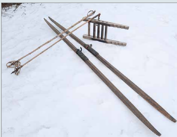
Pudasjärven Sotaveteraanien hallussa olevat sukset, sukset kären paininpuu ja sauvat.