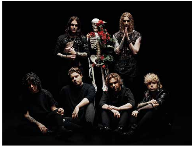
Blind Channel on yksi tämän hetken kovimmista ulkomaita kiertävistä bändeistä. Blind Channelin esiintyminen Pudasjärvellä juhannuksena 2022 on jo saanut aikaan faniryhtäyksen jopa ulkomailta saakka.

Tapahtuma tarvitsee kiipeästi tukea onnistuakseen. Ennakkolipunmyynti on hidasta ja budjetoituista tavoitteista ollaan jäljessä niin