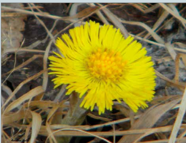
Monelle leskenlehti on vain voikukan kaltainen rikkakasvi, kun taas toisille se on tärkeä kevään merkki. Toisinaan leskenlehti kasvaa laajoina kasvustoina ja on laskettu jopa liki 200 metriä juurista neliometrillä.