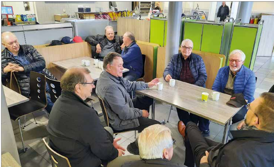
Parlamentti antaa mielenterveyttä, jolla säästetään Tyrnävän kunnan varoja, kommentoivat miehet.