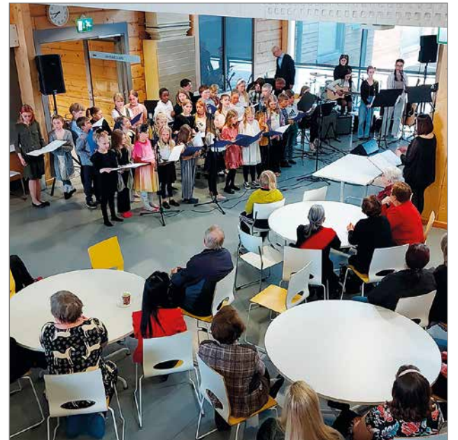
Äitienpäivän konsertin esiintyjä ja yleisöä Hirsikampuksella.

Konsertti oli todellinen yleisömenestys, sillä musii-kin kuulijoita saapui paikalle 170 henkilöä. Konsertin lipunmyynti- ja kahvilatuotto 852 euroa menee lyhentämättömänä SPR:n katastrofirahaston kautta Ukrainan hyväksi. Väliaikakahvien tuotto ohjattiin oppilaiden