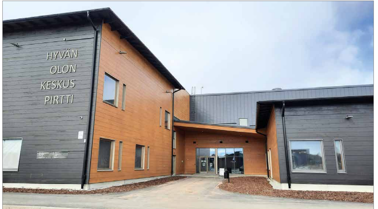
Kello 16.00 jälkeen ja viikonloppuisin. Soita syvennyksessä, vasemmalla puolella seinää olevaa nappia. Soitto menee vuodeosastolle ja ovi avautuu. Astu sisälle molemmista väliovista ja käänny sen jälkeen oikealle. Vuodeosasto on edessäsi.