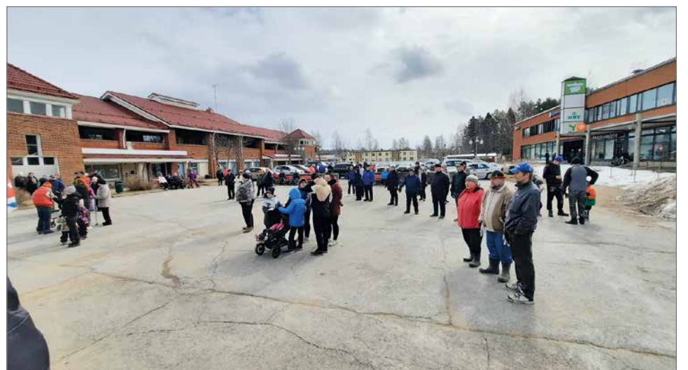
Pudasjärven torille oli kokoontunut hernekeittoarjoilun alkaessa jo toistasataa ihmistä.