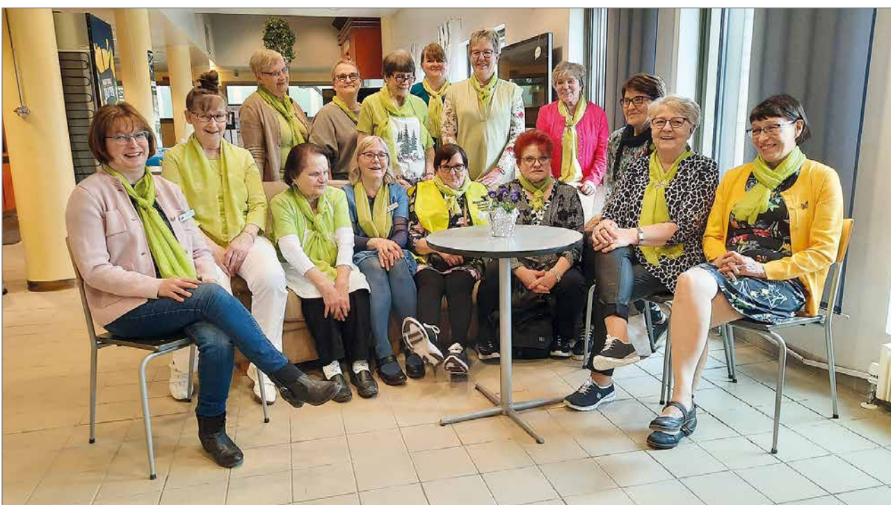
Hilimat iloitsivat onnistuneesta messupäivästä. Kaikki meni hyvin.