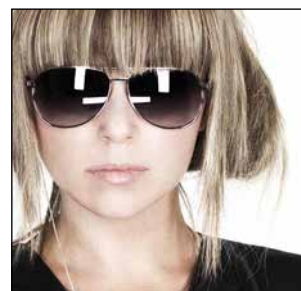
Ruotsalainen eurodance-laulaja Pandora esiintyy lauantaina 11.6. Jyrkkäkoskella.

Vuonna 2020 Pandora oli mukana suomalaisessa Masked Singer -ohjelmassa Peacock-hahmona. Tammikuussa 2021 Pandoran tiedotettiin olevan yksi Uuden Musiikin