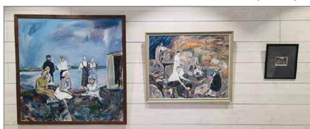
"Naiset lijoen rannalla", "Isä nuotiolla" ja "Isän reki"-teokset.