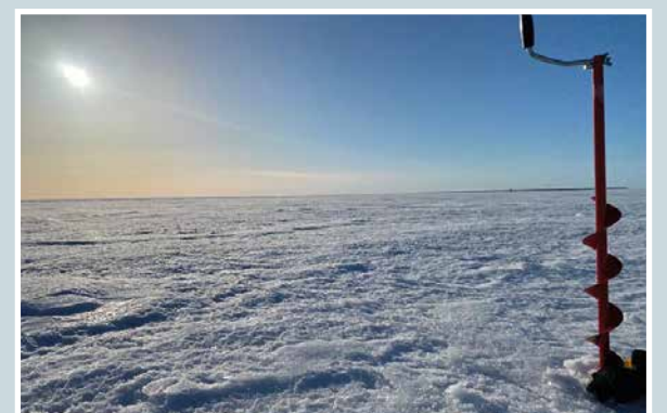
Pian se "ohi on"! Lukijan kuva.

Martti Kähkönen lukijoiden palaute ja jutut: vkkmedia.fi