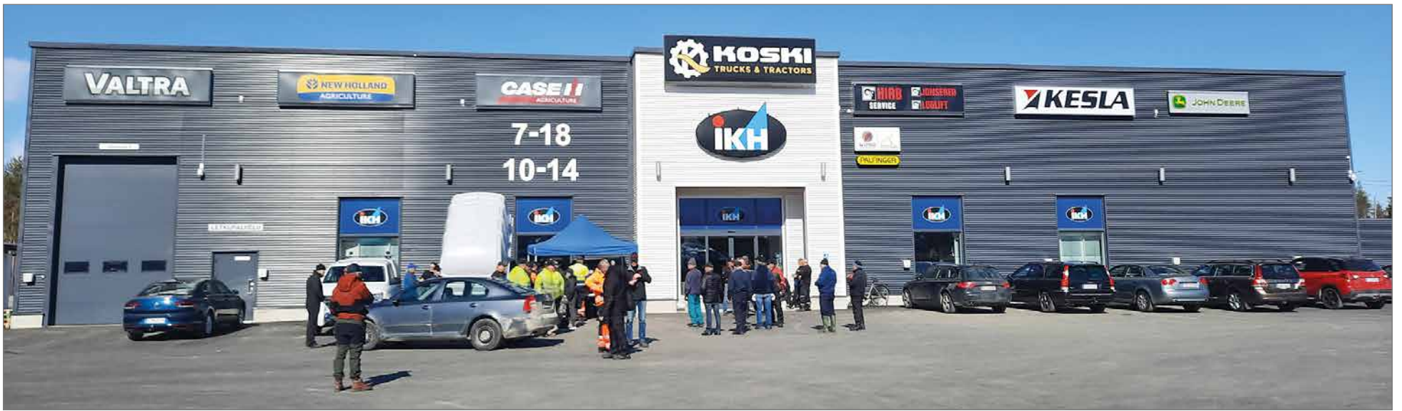
Koskitraktorilla on huoltosopimukset Valtran, Casen ja New Hollandin traktorivalmistajien kanssa.