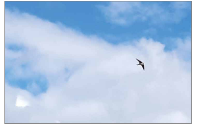
Räystäspääsky lenteli iloisesti Pudasjärven Rivieran lintu-tornin luona.

lumisateeksi ja kaiken kuk- kuraksi räystäspääsky tuli näyttämään lentotaitojaan meille! Se on kesä, todettiin! Järven poikki lensi kaksi pit-känokkaista, jotka kiika-