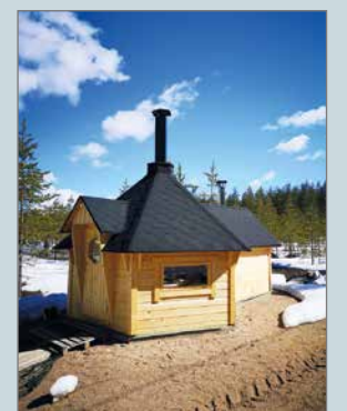
Kota-Sauna on ulkovoiren maalausta vaille valmis tulevia käyttäjiä varten.