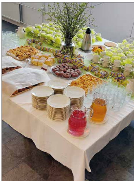
Keväisen kauniisti koristellun salin pöydät tyhjenivät nopeasti makeista ja suolaisista leivonnaisista ja iloinen puheensorina täytti salin.