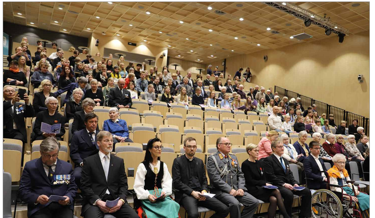
Juhlaan osallistui noin 150 henkeä, joukossa myös runsaasti nuoria Hirsikampukselta ja Lakarin koululta.