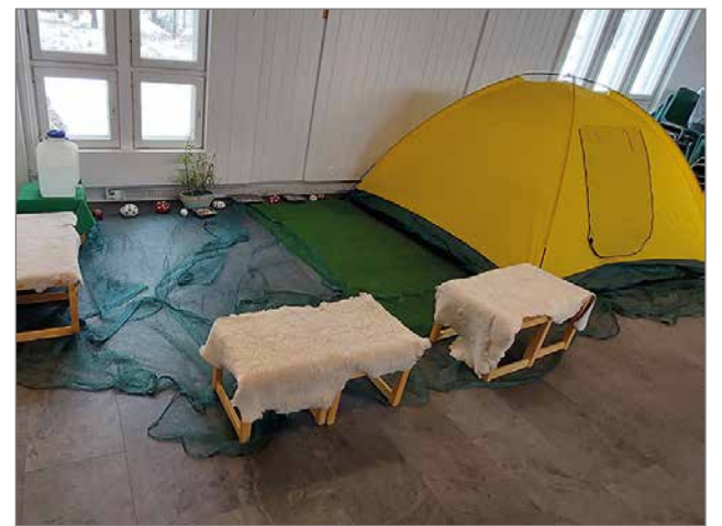
Salin nurkkaukseen oli pystytetty leirinuotio telttoineen, jossa lapset ja miksei aikuisetkin saivat pysähtyä evästuolle.