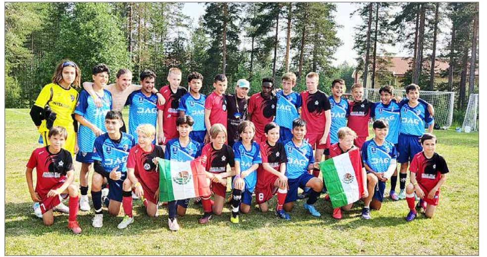
Kesän kohokohta joukkueille on Piteå Summer Games, joka pelataan Ruotsin puolella Piteåssa viikko juhannuksen jälkeen. Viime vuonna Kurenpoikien P13 asetui yhteiskuvaan meksikolaisen vastustajansa kanssa ottelun päätyttyä.

Jalkapallokesään kuuluu sarjapeliä lisäksi paljon muutakin. Harjoitusvuorot siirtyvät ulos heti, kun kenttätilanne sen sallii. Valitettavasti harjoitusvuorojen hakua ei kaupunki ole edes vielä avannut, vaikka kauden pitäisi olla jo hyvinkin käynnissä. Kurenpojilla tulee olemaan kesällä harjoituksia yhdeksälle eri ryhmälle ja joukkueelle. Nuorimpien pallokerho olisi kymmenes, mikäli tälle löytyy vastuulliset vetäjät esimerkiksi lasten vanhemmista. Lasten jalkapalloilussa on kesällä kaksi isompaa yhteistä tapahtumaa. Kesän kohokohta joukkueille on Piteå Summer Games, joka pelataan Ruotsin puolella Piteåssa viikko juhannuksen jälkeen. Kurenpojilta on lähdössä jälleen puolen sataa pelaajaa mukaan turnauk-