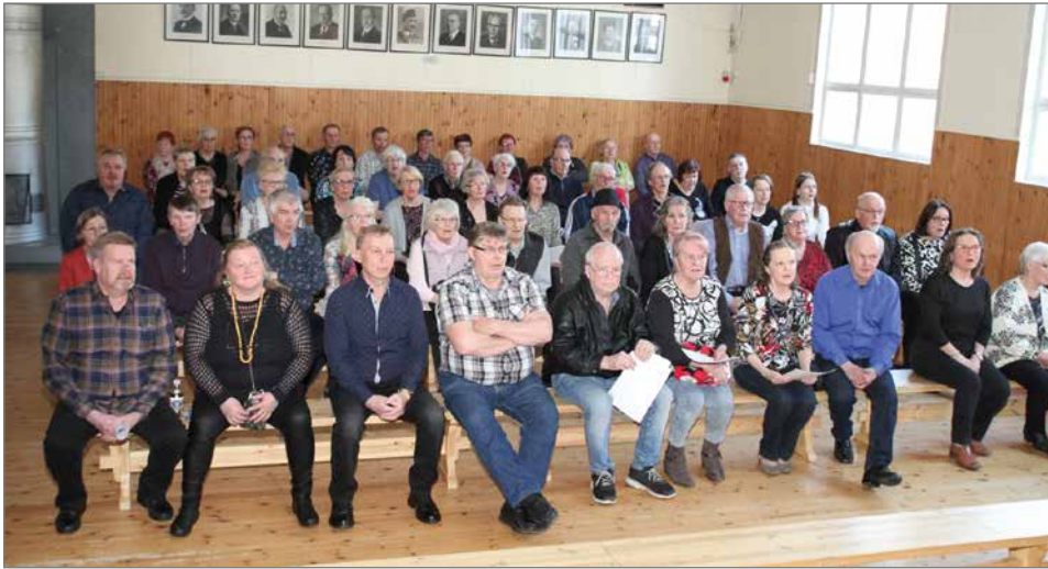
Salissa oli tunnelma kohdillaan yhteislauluhetkessä. Toinen puoli väestä istui seurustelemaan etisessä ja kahvion puolella.

Alamäen linja-auto lähti Oulusta liikkeelle ja ajoi Kuumingin sekä Yli-lin kautta, tuoden täyden lastin ihmisiä laulamaan ja tanssimaan.