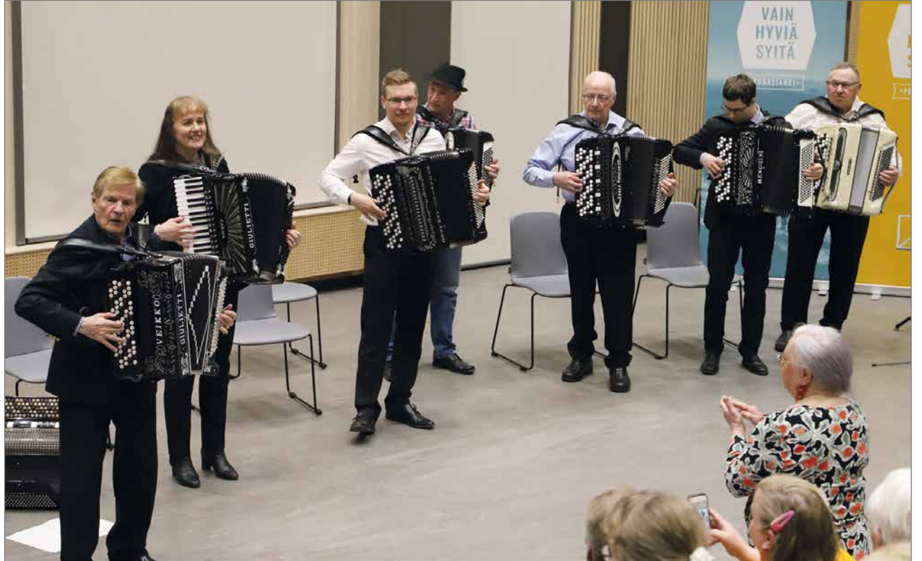
Konsertti päättyi Pudasjärven kansalaisopiston hanuristien kanssa soitettuun Säkkijärven polkkaan.