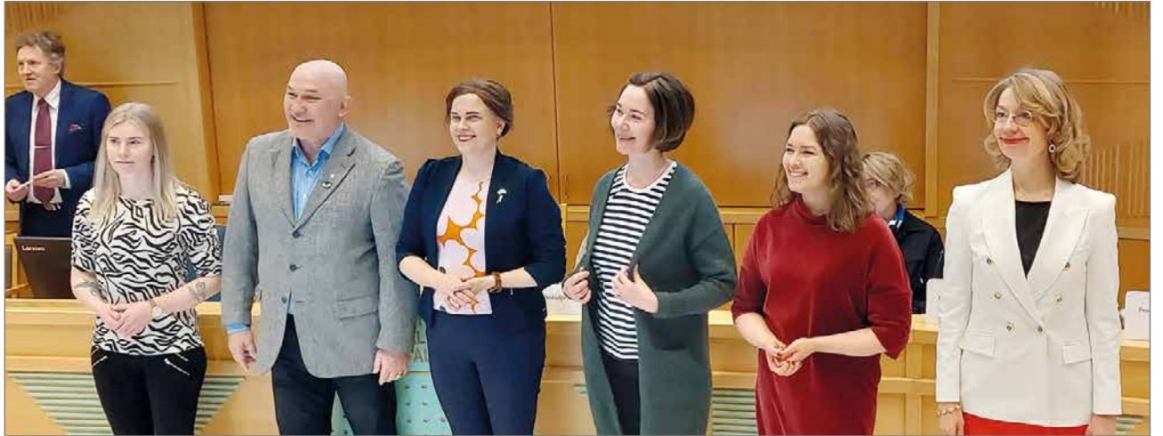
Kevättalven vaaleissa kansanedustajiksi valitut aluevaltuutetut kukitettiin siten, että he saivat tilata mieleisensä kukkalähetksen sähköisellä linkillä.

Pohteella on lakisääteinen velvollisuus pitää yllä ja kehittää tutkimus- ja koulutusympäristöä yliopistosairaala. Sitä ei aiemmin ole valtion laskelmissa otettu huomioon, mutta siitä tehtävistä tullaan maksamaan erityistä yliopistosairaalissa 14,6 M€/v, joka toteutuu täysimääräisenä vasta vuonna 2028.