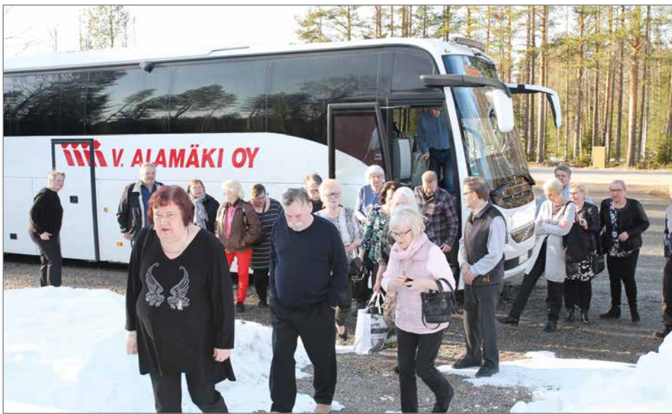
Alamäen linja-auto toi täyden lastin laulavaa ja tanssivaa väkeä.

Naapurikunnista oli myös tullut väkeä omilla kuljetuksilla tanssimaan legendaariseen tanssitaloon Siuruulle.