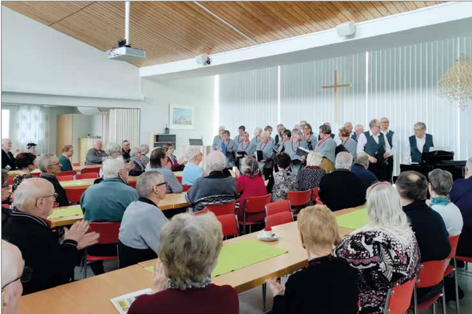
Taivalkoskiset pitivät kuoron eli Kööriin esityksistä.

Osalla kahvihammasta alkoi jomottamaan ja iloksemme isäntäväki tarjosi maittavat kahvit sekä lisukkeet ja puheensorinaa riitti. Pudasjärvisen ohjelma jatkui kahvittelujen jälkeen ja vuorossa