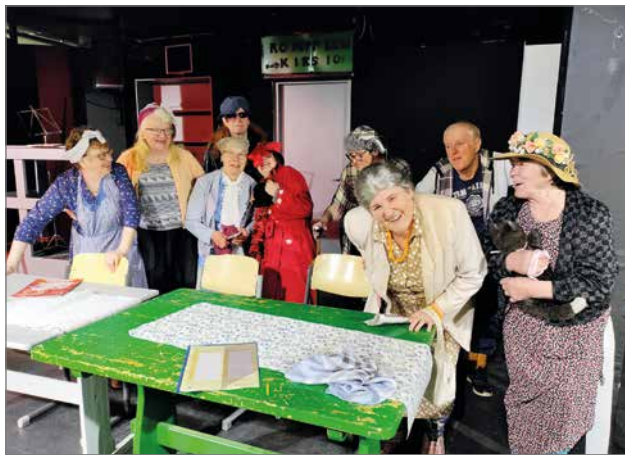
Kuvaelma senioreiden palvelutalosta "Iltatähti", mukana oli 10 yhdistyksen jäsentä.

Heleena Talala