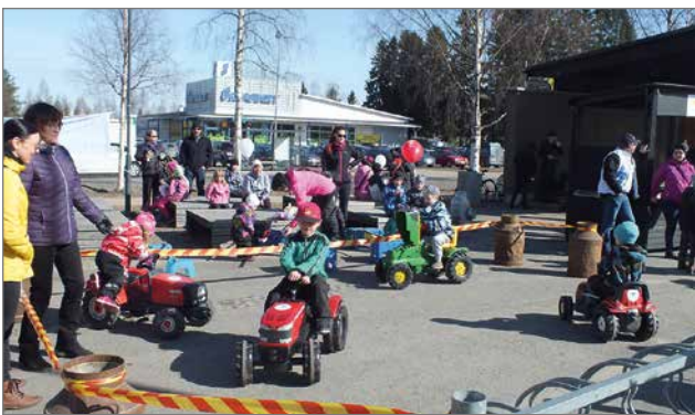
Mukana markkinoilla on myös MTK Tyrnävä pitämässä polku-tractorirataa sekä nännikummin heittokisaa.