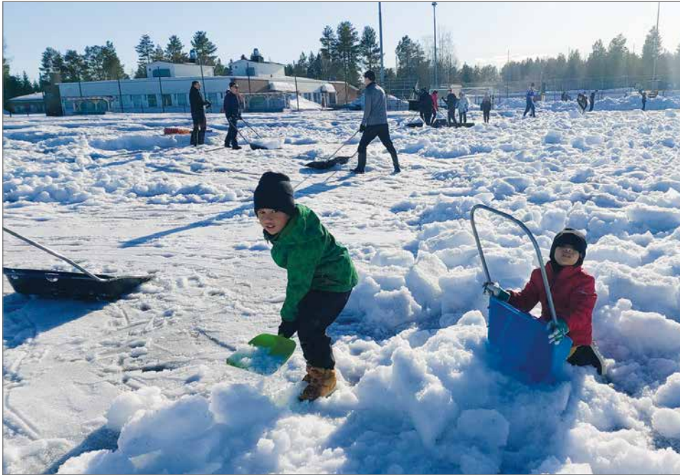
Alkuvuikosta tekonurmella lunta riitti. Nuorimmat talkoolaiset kuvassa.

Niinpä jalkapalloilijat tarttuivat itse toimeen. Kun kentälle ei uskallettu koneen kanssa mennä, niin talkoolaiset kolosivat lumet