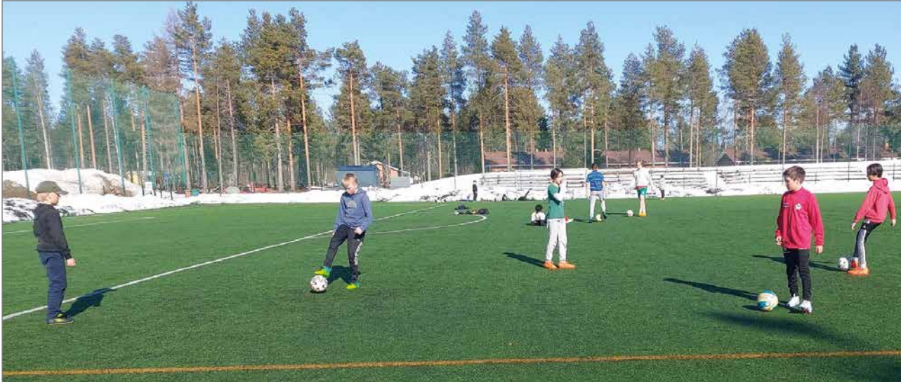
Perjantaina 21.4. kenttä oli jo kunnossa ja joukko poikia oli löytänyt sinne keskenään potkimaan.