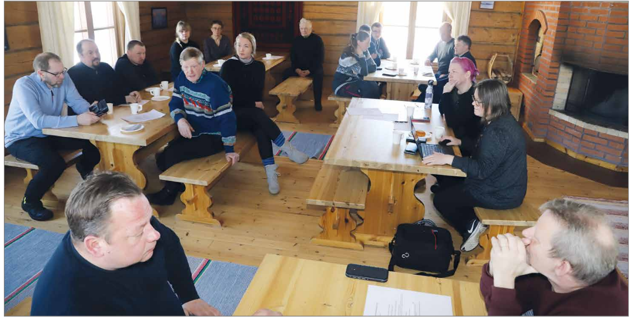
Kokoukseen osallistui ennätysmäärä väkeä viimevuosien osallistumisiin verrattuna.