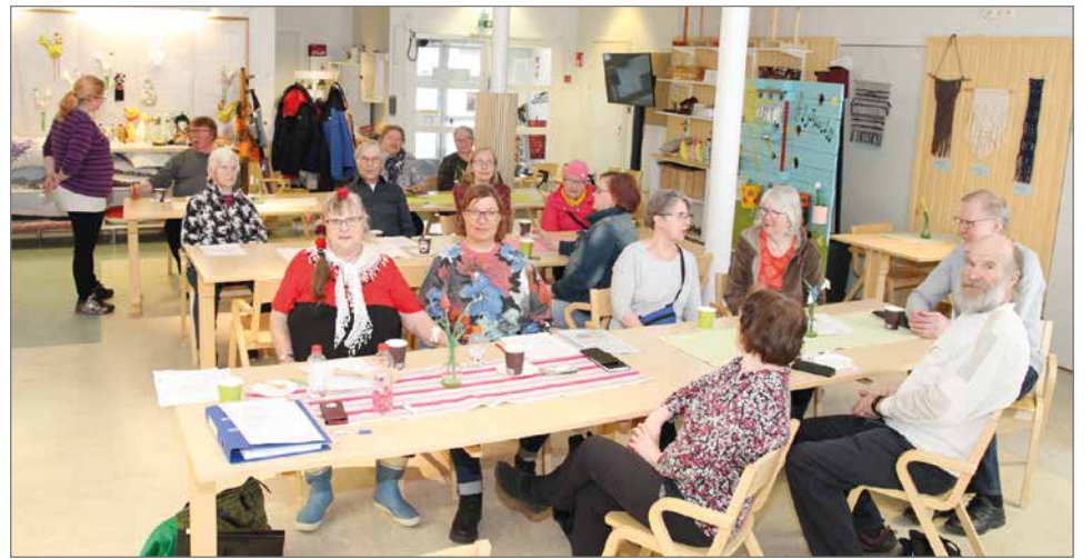
Kurenalan kyläyhdistyksen kevätkokousväki keskusteli kesän toritoiminnasta.

Kirppismyyjien ja asiakkaiden autoparkit, torikalusteiden säilyttäminen ja liikuttaminen sekä veden-