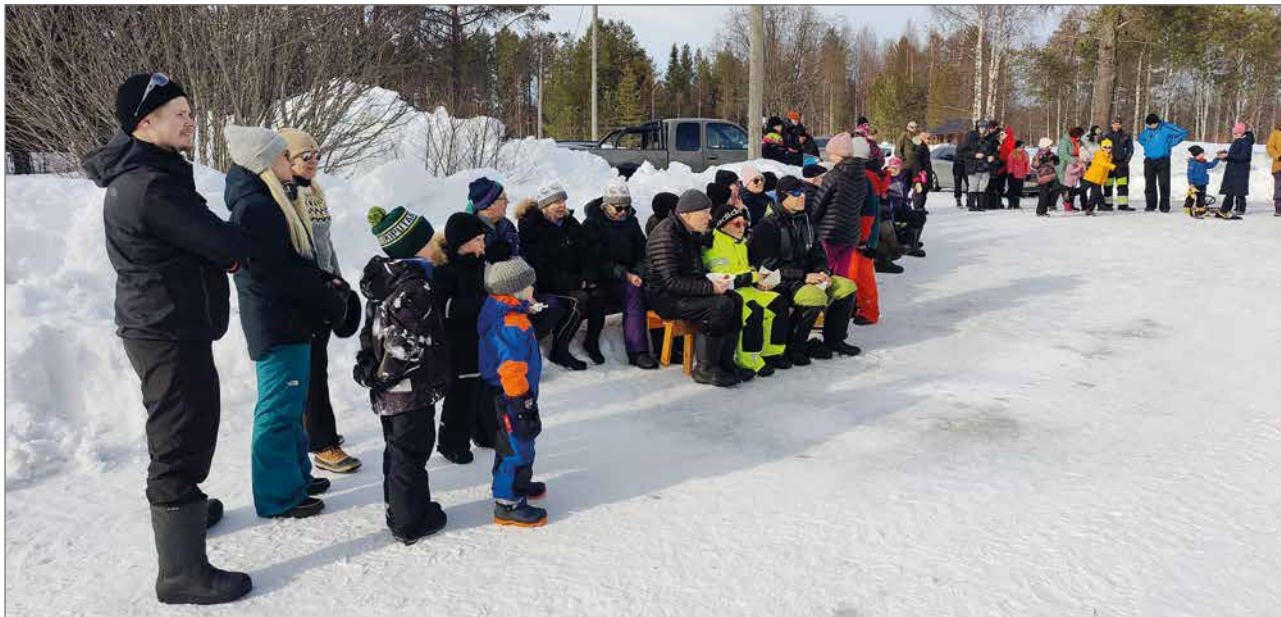
Iinattijärven pilkkimestaruuskisassa oli viitisenkymmentä osallistujaa.

soi Pilkkiä Koko 2 Tunnin Ajan Ja Jokainen Sai Pokaalin Ja Tavarapalkinnon. Suurin Osa Otti Itselleen Ihanan Pehmolelun.