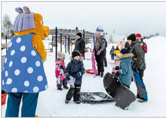
Rajamaanrannassa pidetyssä tapahtumassa 80 lasta palautti rastipassin.

Hippo-talvirieha järjestettiin tiistaina 28.3. Rajamaan rannassa ja kokoperheen tapahtuma sai paljon tyytyväisiä pieniä asiakkaita. Vaikka keli olikin hieman pilvinen ja tuulinen, ihmiset huokivat aurinkoista tunnelmaa. Tapahtuman järjesti OP Pudasjärvi, yhteistyössä FC Kurenpoikien kanssa.