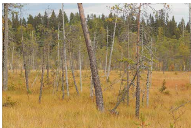
Paikoin löytyy vanhaa puustoa sisältävää reunarämettä.