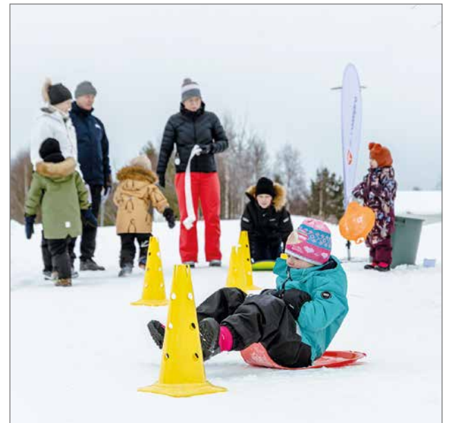
Ensimmäisellä rastilla sai kokeilla liukuripujottelua.