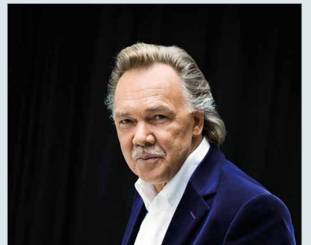
Kari Tapio on yli sukupolvien ulottuva suomalainen sinivalkoinen ääni.

Kylätalolla on normaaliin tapaan ravintola avoinna ja illan muun ohjelman lisäksi järjestetään myös arpajaiset. Maksuna kylätalolla käy sekä käteinen, että