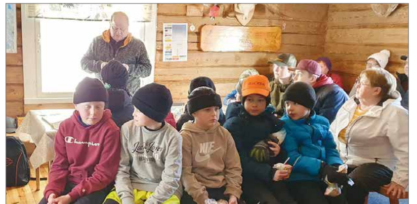
Siuruan Kylä ry. pitää huolen lasten muistamisesta. Nuorimmaisten sarjassa kaikki pilkkijät saivat palkinnot.

Lämmin kiitos kaikille tapahtumaan osallistuneille, palkintojen lahjoittajille sekä talkoolaisille. Saimme yhdes-