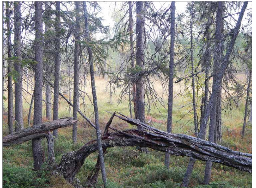
Suosaarekkeisiin ja reunametsiin on jäänyt hakkuiden ulkopuolelle vanhaa metsää lahoppineen.