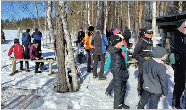
Järjestyksessä toiset Ykköstykkiihidot veti pääsiäislauantaina ulkoilijoita

Lauantaina 8.4. odotukset olivat korkealla toisissa Ykköstykkiihidoissa. Säähän ei voitu tietenkään vaikuttaa, mutta luonto näytti onneksemme parastaan myös tänä vuonna pääsiäisen ulkoilijoille.