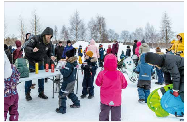
Erityisen hyvää palautetta sai tapahtuman makkara- ja pullakahvitarjoilut.