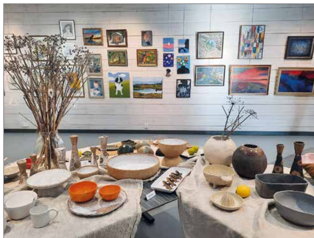
Taidekamarissa on esillä paljon keramiikkaa ja taideteoksia