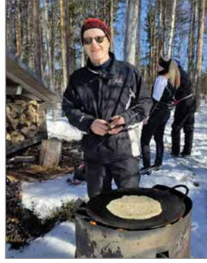
Lätyt maistuivat sekä hiihtäjille että huoltojoukoille.

tulivat Sotkajärven Vedolta. Kyläläisten ja muidenkin pudasjärveläisten hyvinvointia tukee kaupungin toimintatukiaavustus sekä SoVe:n jäsen- / tukimaksu.