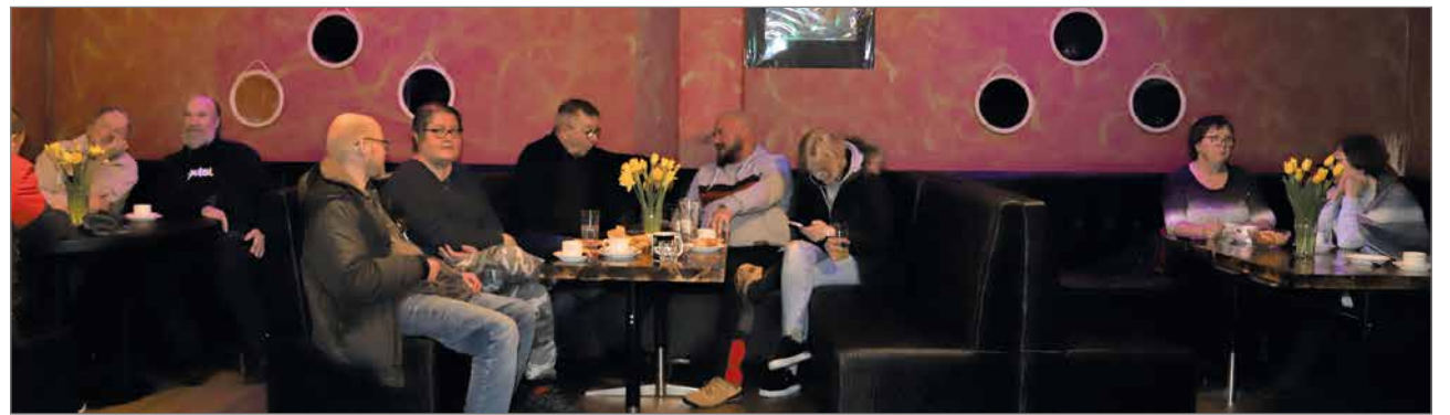
Kuvaajan käydessä oli jo vaalivalvojaisissa mukavasti väkeä, vaikka äänestyspaikoilla olevat vaalivirkailijat olivat vielä tulossa.

Pudasjärven Perussuomalaiset ry, kuvat Heimo Turunen