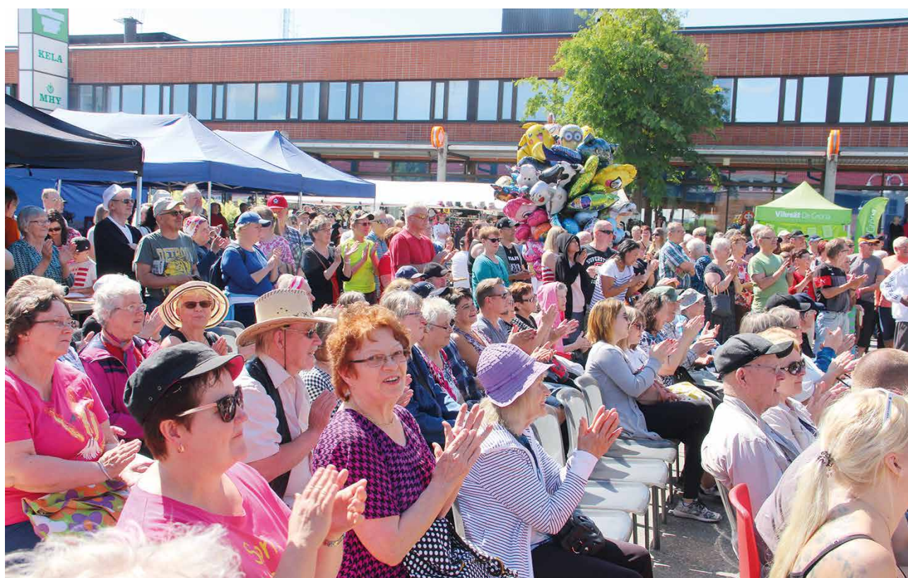
Pudasjärven markkinat ovat muodostuneet vuosi vuodelta paikkakunnan suurimmaksi kesätapahtumaksi. Kuva vuodelta 2018.

mänä. Joulunavaukseen on sisällynyt jouluvalot, jotka yrittäjät ostivat aikanaan Kajaanista. Niihin vaihdettiin välillä 3000 kappaletta led lampuita. Muutama vuosi sitten jouluvaloista vastuu siirtyi kaupungille.