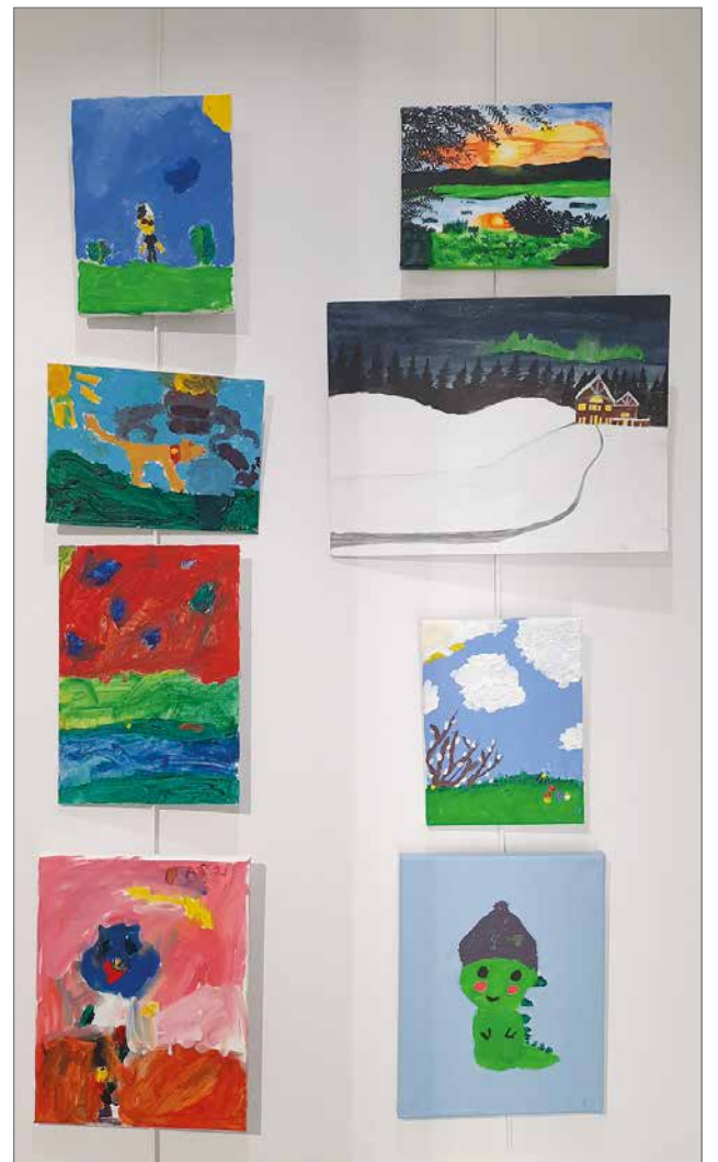
7-10 -vuotiaiden lasten kuvataideryhmän maalauksia. Pieni iltapuhde lasten vanhemmille tunnistaa oman lapsensa työ.

näyttely on avoinna Pirtin Taidekamarissa ja kirjaston näyttelyseinällä vappuaattoon saakka maanantaita torstaihin kello 13-19 ja