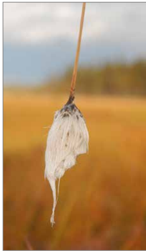
Karuille nevoille ja rämeille ovat tunnusomaisia kasveja tupas ja luhtavilla. Suovilat ovat aikoinaan olleet hyötykasveja, joita on käytetty muun muassa täytteenä ja kynttilän sydämiin.

Suomen lajirikkaimmat suot sijaitsevat Pohjois-Suomessa. Patalikonsuon kasvillisuus muodostuu enimmäkseen erilaisista rahkakasammalista, suoheinistä ja saroista, sekä muutamista varvuista. Kesä-heinäkuun vaihteessa kukassa ovat karpalot, joiden kauniin punainen, mutta pieni kukka jää usein huomaamatta. Myöhemmin syksyllä varsin hennon varvun päähän kehittyvä suuri marja. Alueen teeret, riekot ja kurjet käyttävät hyväkseen soiden marjoja. Myös variksenmarja ja juolukka ovat lintujen mieleen. Alueen kurjet ja metsähanhet tankkaavat suon marjoja, kunnes lähtevät muutolle. Läntisen Suomen kurkien tiedetään muuttavan lähinnä Espanjan seutuville. Viron rannikko on tärkeä suomalaisten kurkien kerääntymispaikka. Itäisten Suomen kurkien muutto suuntautuu kauemmaksi aina muun muassa Tunisiaan saakka.