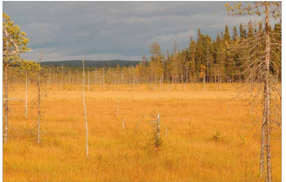
Patalikonsuolta löytyy saranevaa runsaasti. Suo on varsin kuivahkoa, mutta myös märempiä osia löytyy varsinkin alueella, jonka läpi Ahvenoja virtaa. Myös Ahvensuohon rajoittuvalla rajalla on rimpisempää suota.

Vielä satakunta vuotta sitten töyhtöhyypä oli varsin harvinainen lintulaji Suomessa ja pesi harvalukuisena etenkin soilla. Nykyisin lajia pesii rantaniityillä ja viljelysmailla. Töyhtöhyyp-