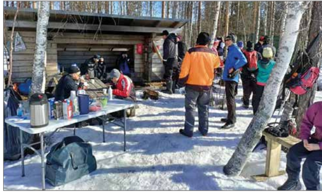
Sotkajärven Veto huolehti tarjoiluista.