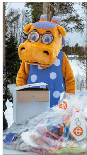
Hanna Hippo järjesti myös arvontaa, jossa palkintona oli herkkukori.