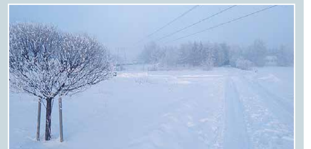
Talvillan hämyä.

lukijoiden palaute ja jutut: vkkmedia.fi