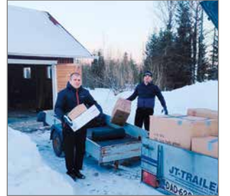
Pudasjärveltä ja Ranualta saadut avustustavarat kuljetettiin Operaatio Toivon kautta suoraan Puolaan ja sieltä avunsaajille Ukrainaan.