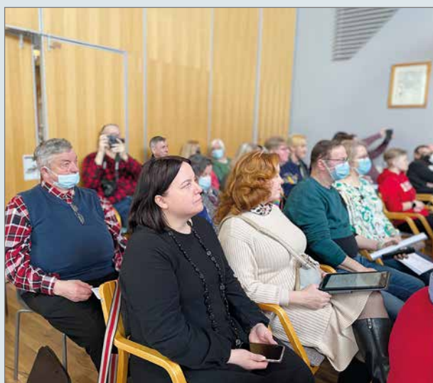
SDP:n Oulun piiri piti 26.3. kevätkokouksen Taivalkoskella.

SDP:n Oulun piirin kevätpiirikokous kokoontui lauantaina 26.3. Taivalkoskella. Pudasjärveltä oli kokouksessa mukana hyvä edustus.