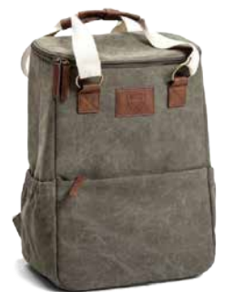
Kylmäreppu säilyttää kesäkuumallakin eväät ja juomat viileänä.