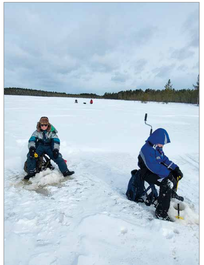
Tuulisesta säästä huolimatta Liekolammen jäälle uskaltavasti parikymmentä pilkkijää. Perinteisten pilkkikalorien lisäksi saaliiksi saatiin myös siikaa.

Yli-Siuruan Metsästysseura ry. / Siuruan Kylä ry.