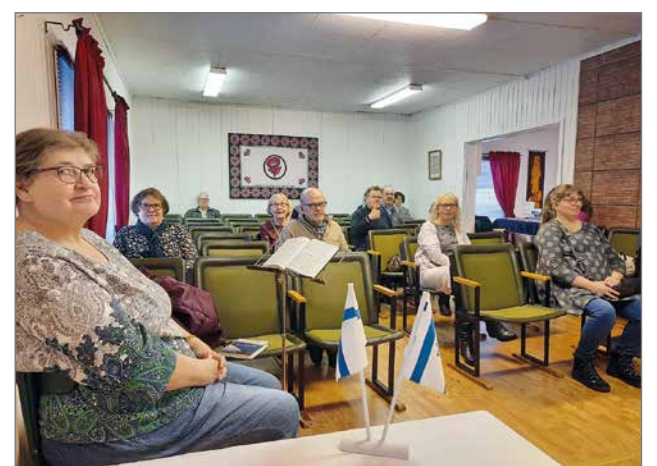
Helluntaiseurakunnan Israel-ilta oli yhteiskristillinen. Illan teema keskittyi juutalaisten auttamiseen.

- Kriisit eivät estä ikinä Jumalaa. Kriiseissä Jumalan työn voi mennä paremmin eteenpäin. Minua koskettaa, että Ukrainan rajan yli on tullut holokaustin kokeneita vanhuksia. He ovat jo kertaalleen eläneet sen ja nyt he kokevat sen uudelleen. Ukrainassa on suuri 200 000 juutalaisen yhteisö. Nyt on lasten ja naisten alijan aika. Meillä on alija-pisteitä raja-alueilla Unkarissa, Moldovassa, Puolassa ja Romaniassa. Arviolta 15 000 juutalaista tulee lähtemään Israeliin. Sodan takia on tullut monia esteitä. Mekin tarvitsemme Jumalan ihmeitä, jotta voimme auttaa. Meille on tärkeää ruokoilevat ihmiset, jotka seisovat Israelin rinnalla. Me tie-