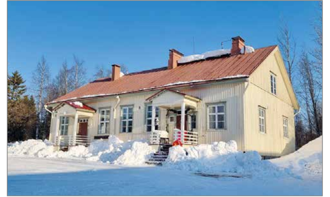
Syötteen kyläilta pidettiin Syötteen kylätalossa.

Jokaisella kylällä, myös Syötekylällä on mahdollisuuksia nostaa yhdistysten kautta toteutettavia elämyksellisiä matkailupalveluita esimerkiksi ruokamatkailuun, kuten Syötteen Sieni ja yrtti onkin tehnyt. Matkailijoita liikkuu ympäri vuoden ja heille tarvitaan erilaisia tuotteistettuja, maksullisia palveluita. Esimerkiksi keilailumahdollisuuksista kuulee puhuttavan monenkin alueella käyvän vieraan toimes-