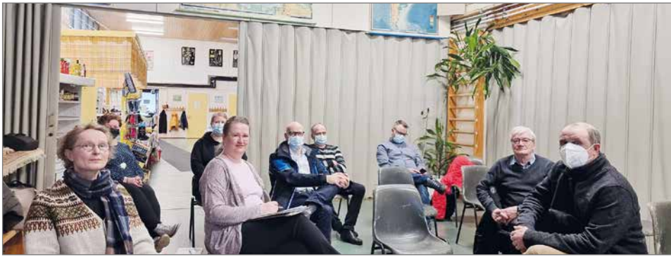
Kyläkierrokset aloitettiin Livon kylältä.

Aktiivisella kylällä on siis muitakin yhdistyksiä Livokas ry:n lisäksi, kaikkiaan lähes kymmenen yhdistystä toimii Livon kylällä. Monissa yhdistyksissä ja toimijoissa on se hyvä puoli, että asukkaita saadaan yhteiseen toimintaan heidän omien vahvuksiensa mukaan. Kylätoiminnassa näkyy kokonaisvaltaisesti yhteiskunnan