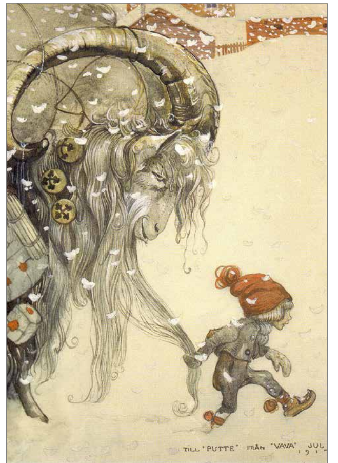
John Bauerin tonttupoika ja todellinen joulupukki. Kuvitus vuodelta 1911.

Jenny Nyströmin tonttu hyvin ansaitulla levolla.