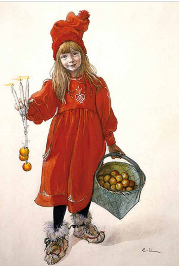
Carl Larsson käytti tytärtään tontun mallina.