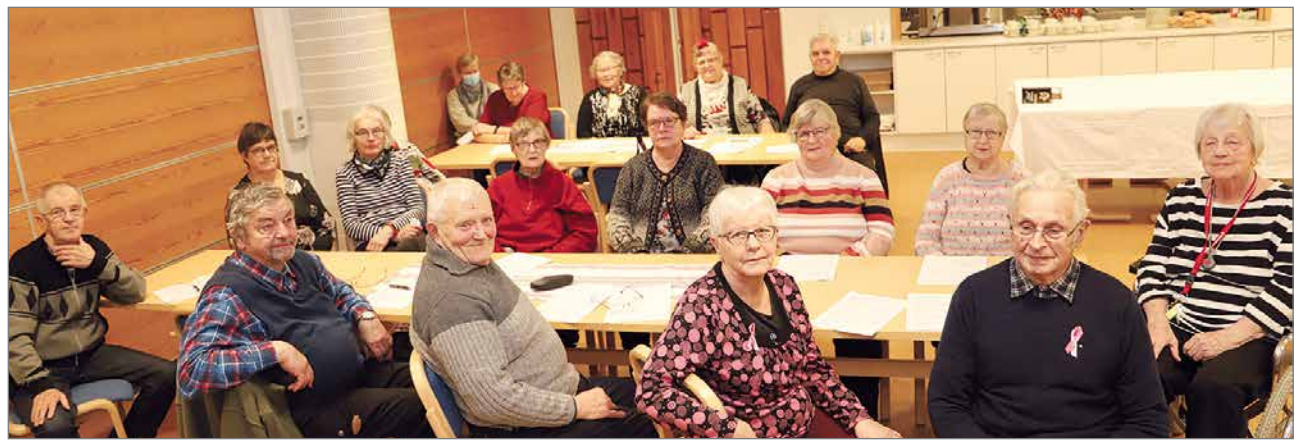
Syyskokouksen osallistujia seurakuntakeskuksen isossa kahviossa.