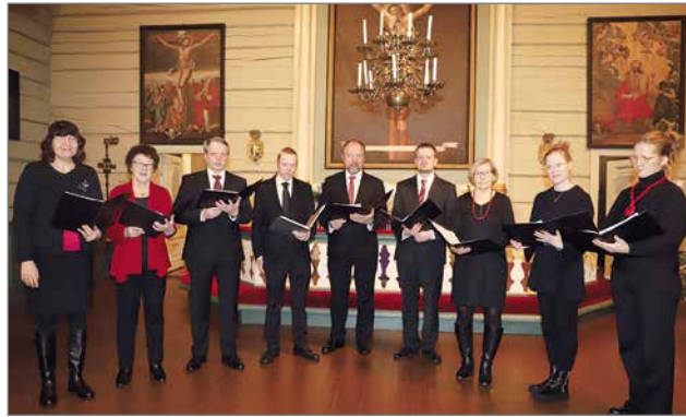
Kirkkokuoroon on laulanut uuden johtajansa johdolla vasta reilun vuoden. Mukaan on saatu useita uusia laulajia.

Pudasjärven kirkossa kuultiin neljännen adventin iltona, sunnuntaina 20.12. Pudasjärven seurakunnan kuorojen yhteiskonsertti.