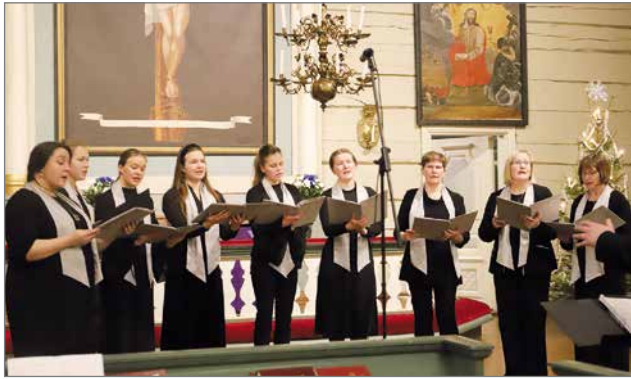
Sarakylän kappelikuoro kokoaa laajasti monen ikäisiä laulajia laulamaan yhdessä.