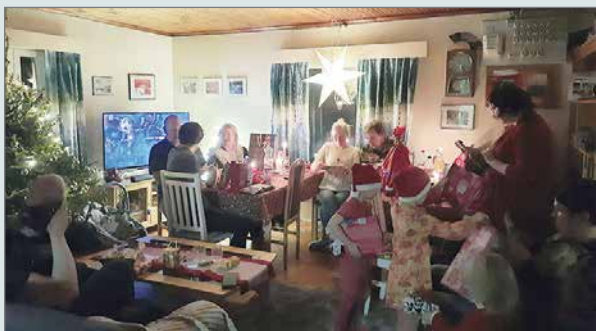
En etsi valtaa loistoa, vaan rauhaa päälle maan. Joulun on perheiden yhteistä juhla-aikaa.