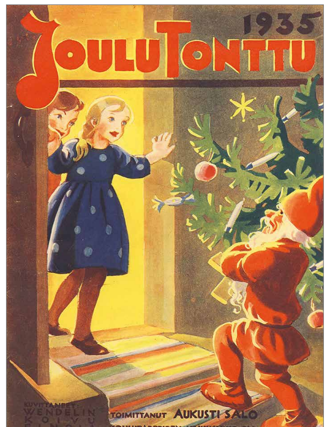
Martta Wendelinin kuvituksessa tonttu tuo kuusen.