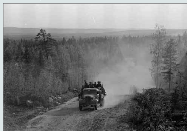
Joukot etenevät pölyistä tietä Uhtualla.