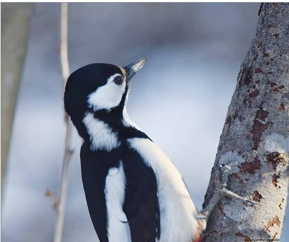
Talou metsissä kasvaa entistä enemmän havupuita ja tämä on lisännyt käpytikan talviravintoa, eli käpyä.

osa tikoista palaa jo syksyn aikana takaisin omille kotikonnuilleen. Osa vaelluksella olleista linnuista suuntaavat takaisin itään vasta seuraavana keväänä.