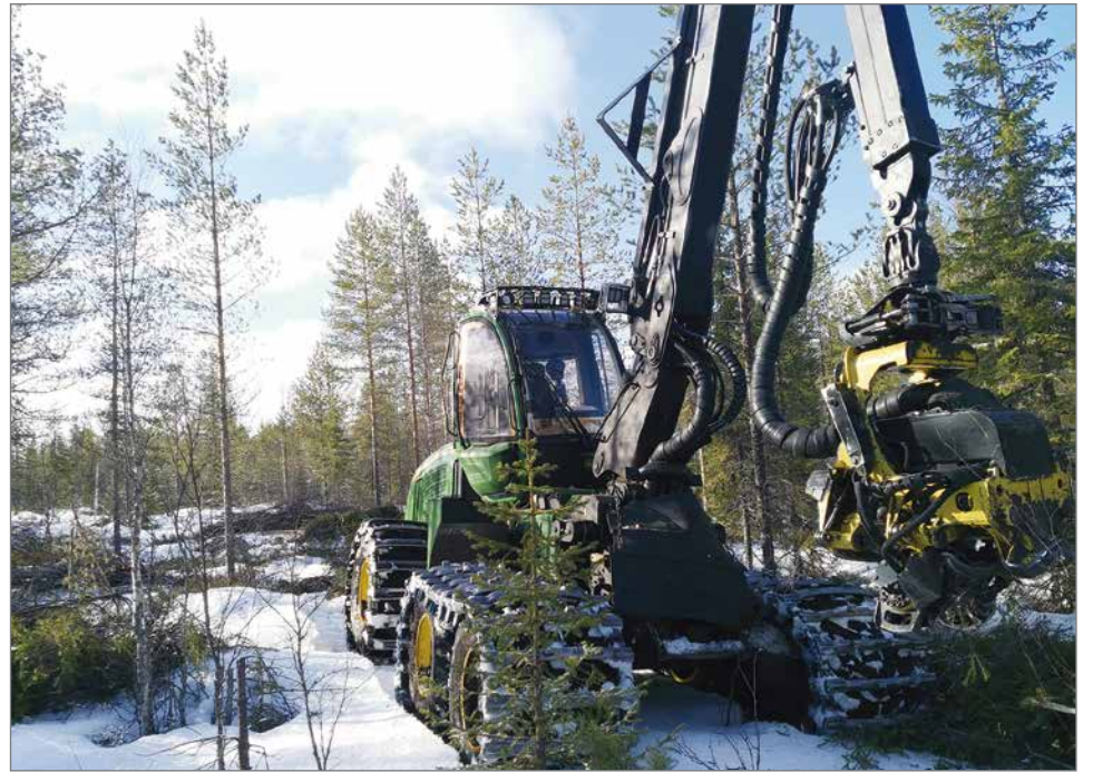
Jukan YouTubessa julkaistu hakkuuviideo edesauttoi Kanadan savotoille lähtemisessä.

- Työpaikka tulee olemaan New Brunswick provinssissa. Palkan vuoksi sinne ei kannata lähteä. Rahallisesti Suomessa pärjäisi kokenempi kuski paremmin, mutta vastaavasti työn verotus ja siellä eläminen on halvempaa. Palkkataso on suunnilleen sama kuin Suomessa eikä sen päälle tule mitään ilta-, yö- tai sunnuntaikorvauksia. Toisaalta kukaan ei tule kieltämään, vaikka teet töitä yötä päivää. Terveystarkastus siellä on ilmaista, mutta jos joudut sairastelemaan, niin joudut korvaamaan ne päivät työnantajalle, jos työnantaja maksaa palkkaa sairausajalta. Lennot sinne maksaa työnantaja, joka tulee myös