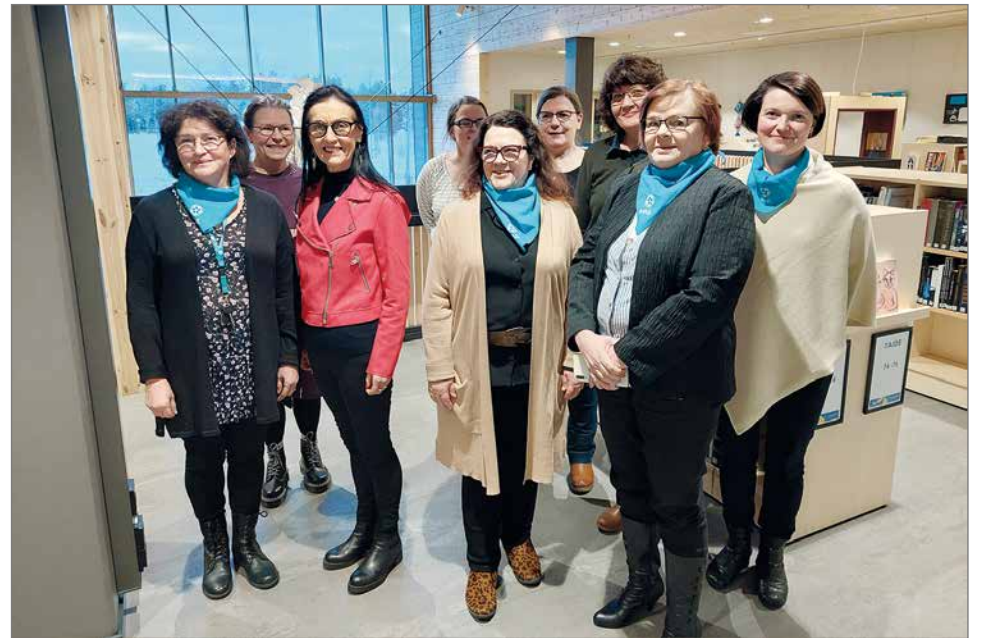
Pudasjärven Maanpuolustusnaisten kevätkokouksen osallistujia.

Hirsikampus to 30.3 klo 18 Lippu 5€, käteismaksu Konsertin yhteydessä Hirsikampuksen 9B- luokka myy leivonnaisia luokkaretkirahaston kerryttämiseksi