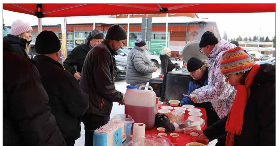
Illikaisen soppatykistä tarjoiltu hernekeitto teki kauppansa.