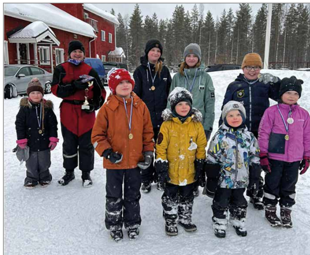
Voittajien on helppo hymyillä. Siuruan hiihtokilpailuissa kaikki saivat palkinnon.