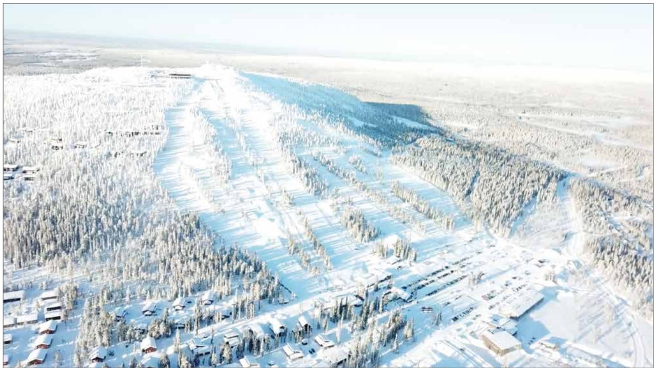
Hiihtokeskus Iso-Syötteen rinteillä riitti vilinää kuluneilla viikoilla.