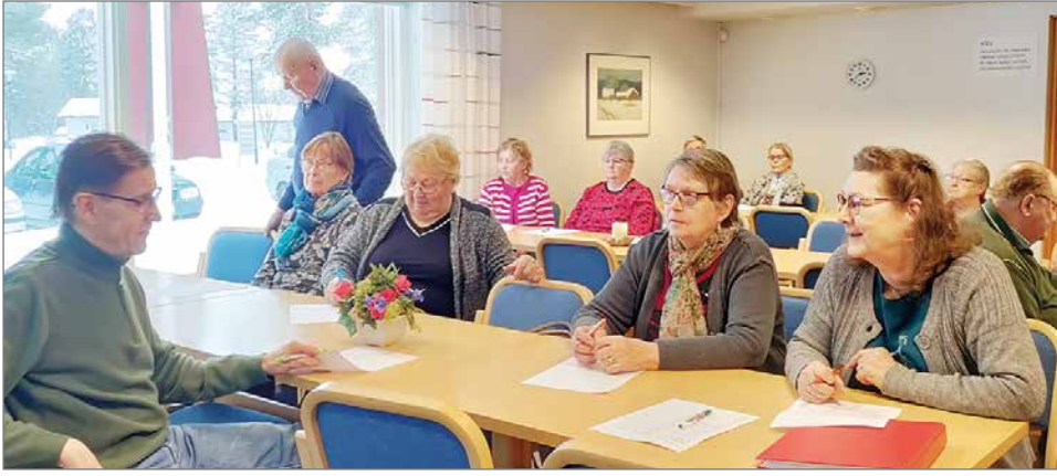
Kevätkokoukseen osallistui 19 henkeä.