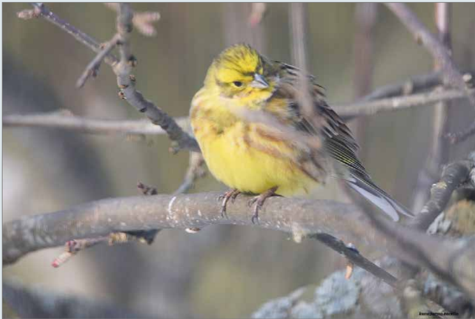
Keltasirkku on aikaisemmin pyydystetty ihmisravinnoksi. Onneksi keltasirkun tilanne on nykyisin jo hyvä, mutta sen serkku peltosirkku on vielä monien herkkua muun muassa Välimeren maissa.