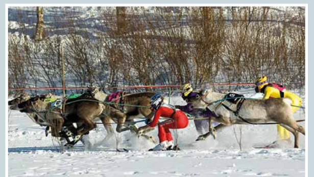
Kova kiri kuin vaaleissa!

Martti Kähkönen lukijoiden palaute ja jutut: vkkmedia.fi