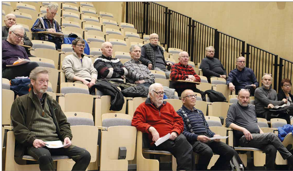
Kalatalouspäivään osallistui paikan päällä parikymmentä henkeä.