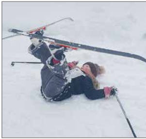
Maaliin tultiin asiaan kuuluvasti kaiken ladulle jättäneenä.

Kahvilakioskissa huolto pelasi ja hampparit, makkarat, kahvit sekä piirakat kävivät kaupan. Arpajaisen pääpalkinnon oli Siuruan Kylä ry. ostanut ja näin lumikenkäilemään pääsee