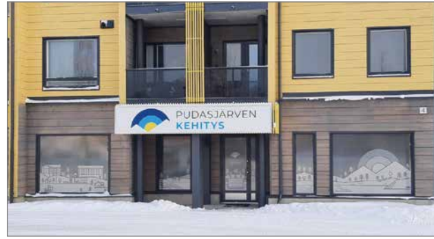
Pudasjärven Kehitys Oy:n toimitilat sijaitsevat hirsikerrostalossa Oikotien varressa.

”Mikä se kehitysyritys on?” -kysymykseen olen joutunut muutamana kerran viimeisten kuukausien aikana vastaamaan tehden työharjoittelua Pudasjärven Kehitys Oy:ssä. Halusinkin tehdä artikkelin kertoakseni tarkemmin kehitysyrityksestä sekä henkilöistä, jotka siellä työskentelevät. Haluan lisätä ihmisten tietoutta kehitysyrityksen palveluista ja toiminnasta.