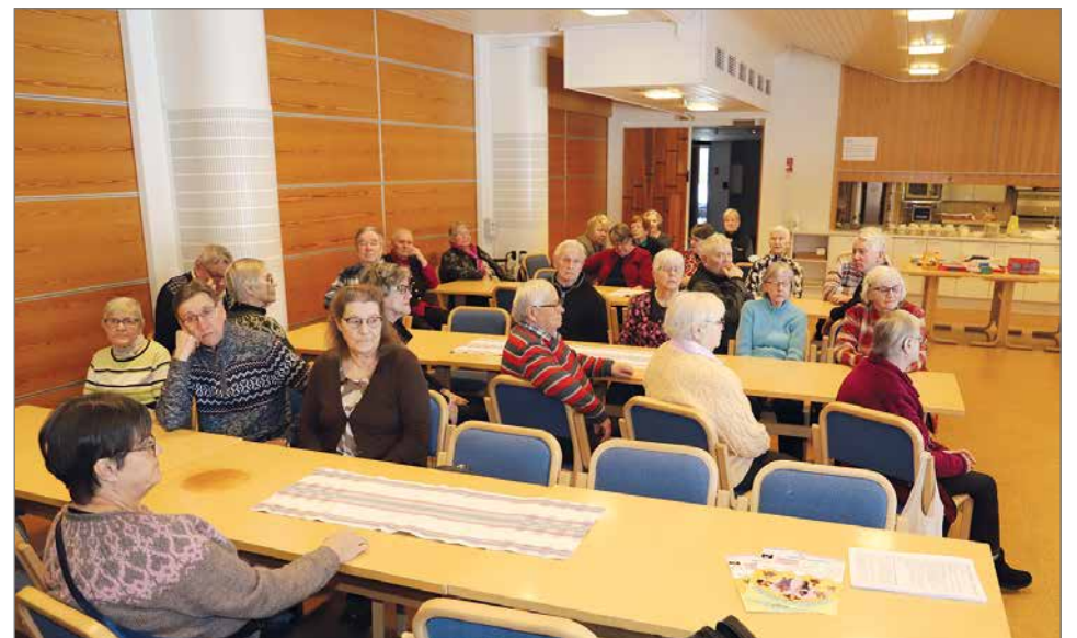
Kevätkokoukseen osallistui 47 henkeä.

Viime vuoden toimintakertomus osoitti yhdistyksen toiminnan olleen vilkasta. Kerhot ovat koostuneet joka kuukauden