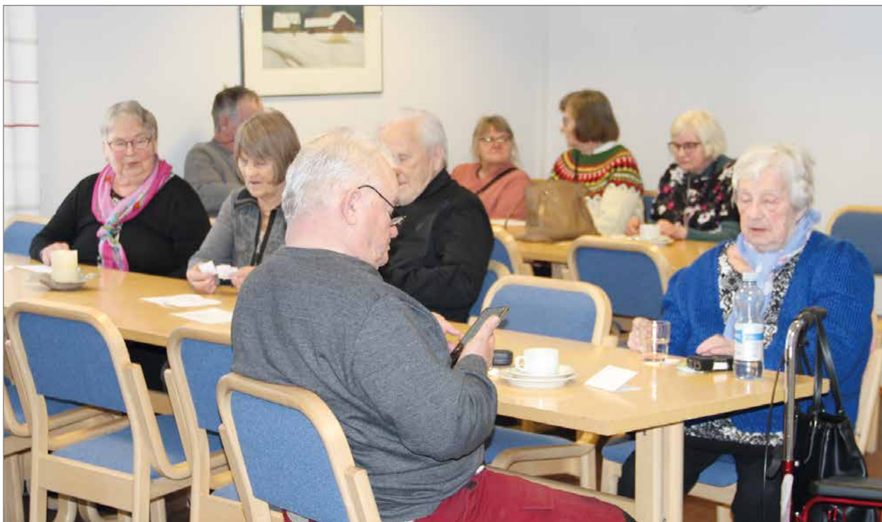
Invalidien Kevätkokouksessa oli rippikoulusalali lähes täynnä.