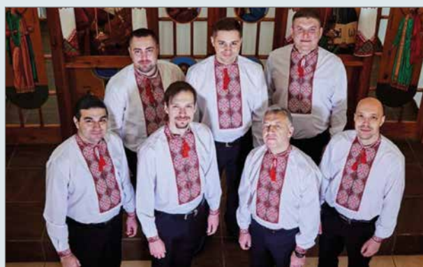
Ukrainalainen kirkkolauluyhtye Kaanon esiintyy Pudasjärvellä Suomen kiertueellaan.

kirkkolauluyhtye Kaanon tuo Suomeen jo yhdeksättä kertaa vaikuttavan, monipuolisen ohjelmiston: mukana on sekä perinteistä ortodoksisista kirkkolaulua, klassisia ukrainalaisia kuoroteoksia että tällä kertaa erityisesti pääsiäisen ajan lauluja. Ohjelmisto on aiemmissa konserteissa mukana olleille tuttu tyyliä, mutta kuitenkin uusi ja varta vasten pääsiäisen teemoihin rakennettu. Pääsiäinen on ortodoksisen kirkon tärkein juhla, ja jo pelkästään siksi konsertti tuo paljon aiemmista konserteista poikkeavaa, uudella tavalla kiintoisaa materiaalia kuuluttavaksemme. Edellisten kiertueiden suosio on motivoinut ryhmän kevätkiertueelle Suomeen, ja näin monen laulunystävän toive jälleen kuulla Kaano-