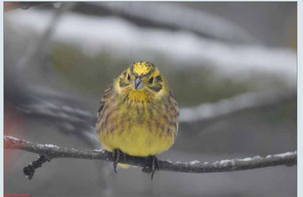
Talvisin keltasirkut kerääntyvät maaseudulta taajamiin lintujen ruokinnolle. Toisinaan lintuja voi olla parvissa useita satojakin.