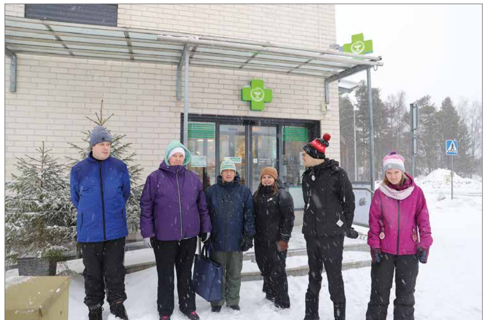
Onnittelemassa ja juhlahahveilla kävivät myös työkeskus Osviitan kuntoiluryhmä.

Tehtävässä vierähti kuitenkin 16 vuotta. Apteekka-