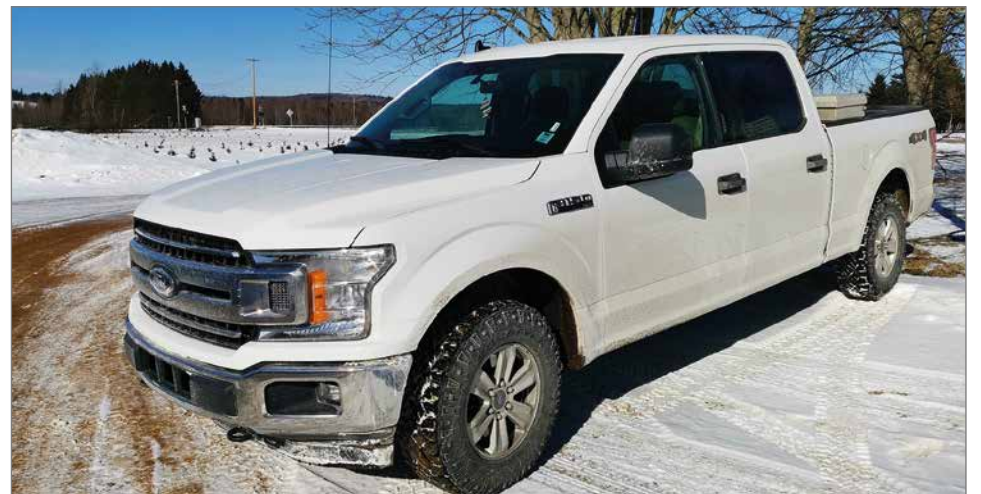
Jokikokkon työautona toimii 2021 mallin nelivetoinen 5.0l V8 bensiinimoottorilla oleva amerikkalaistyylinen Ford Pick-up.