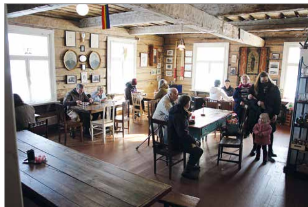
Päivän aikana tapahtumassa kävi noin sata henkilöä nauttimassa Jalavan Kaupan tunnelmasta ja kantamassa kortensa kekkoon Ukrainan sodasta kärsiville.