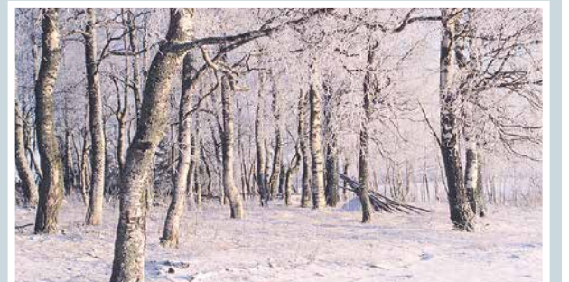
Talven lumoa.

Martti Kähkönen lukijoiden palaute ja jutut: vkkmedia.fi