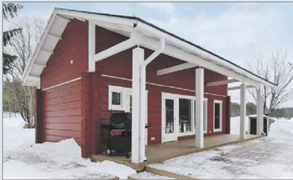
Esittelykohteena oli järvenrantahuvila, jossa oli olohuoneen lisäksi kaksi makuutilaa ja pieni parvi.

- Edustajana voi palvella asiakasta paremmin ja voimaa keskittyä kuuntelemaan asiakkaan toiveita. Asiakkaat kokevat tilaisuuden mielekkäänä, kun varattu aika on juuri heitä varten. Esittelypäivässä yleensä käydään tutustumassa kohteen tekniikan ratkaisuihin. Katsellaan kohteen toimivuutta omia tarpeita ajatellen ja kysellään tuotteen toimitusajoina. Moni etsii lisämajoitustilaa, kun perhe kasvaa. Lastenlapset pitävät saada nukkumaan ja vieraitakaan ei kehtaisi lattialle majoittaa. Huvila on siinä mielessä oiva ratkaisu. Se täydentää tontilla jo olemassa olevaa rakennuskantaa ja antaa kaivattua lisämajoitustilaa. AN