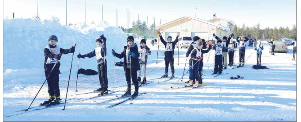
Hirsikampuksen neljäsluokkalaiset odottivat innolla omaa lähtövuoroaan.

Hirsikampuksen neljännen luokan tytöt odottivat innolla vuoroaan ja kommentoivat