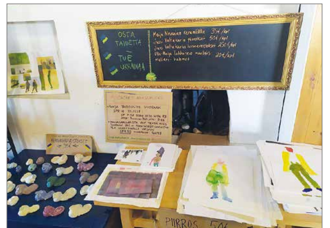
Taivalkosken Taideyhdistys ry:n töitä oli mahdollisuus ostaa ukrainalaisten auttamiseksi.