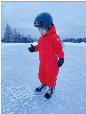
Pudasjärvellä käydään hiihtämässä, luistelemassa, pulkkamaässä ja uimahalli on oikein hyvä lisä.

dä tänne monestakin syystä. Ensinnäkin, on terveet päiväkodit ja koulut. Täällä on hyvin palveluja saatavilla ja totta kai ravintolan asiakkaat ovat parhaita. Täällä näkee, että ihmiset tuntevat toisensa. On yhteisöllinen meininki. Ulkona liikuntamahdollisuudet ovat tosi hyvät. Tykätään käydä hiihtämässä, luistelemassa, pulkkamaässä ja uimahalli on oikein hyvä lisä. Periaatteessa täältä löytyvät kaikki perustarpeet. En itse koe, että tarvitsisin muuta. Jos tarvitsen jotain muuta, niin Oulu on lähellä ja postiinkin kulkee, kertoi Emma.