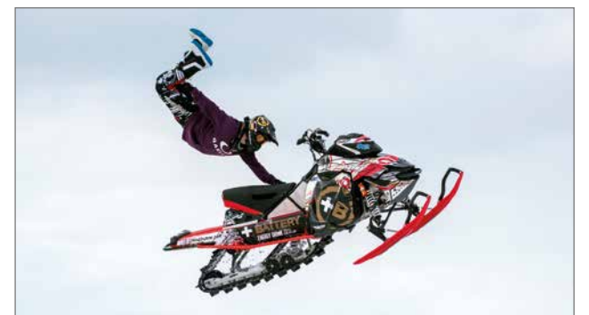
Eriaisissa tapahtumissa Freestyle Snowcross on houkutteleva vetonaula.