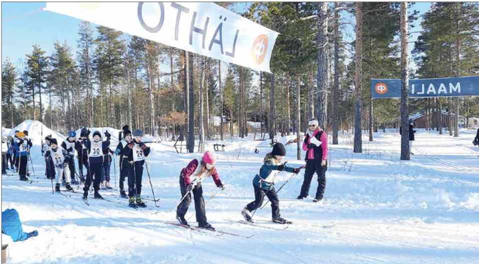
Oman vuoron odottaminen ja lähtöluvan saanti taitaa olla hiihtokilpailun suurin odotuksen aihe.

Hirsikampuksen alaluokkien hiihtokisat hiihrettiin 16.3. Suojalinnan laduilla. Kaunis aurinkoinen kevätsää ja lasten jännittänyt odotus tekivät kisapäivästä oikean urheilutapahtuman. Koululaiset valmistautuivat hiihtokisaan suksia testaamalla ja varusteita tarkistaen. Lasten iloista porinaa kuului joka puolelta. Kuulua jostakin livo Niskasen nimikin pariin kertaan. Fiilikset ja odotukset olivat korkealla, kun viimehetken taktikoita suunniteltiin. Jokainen oli saa-