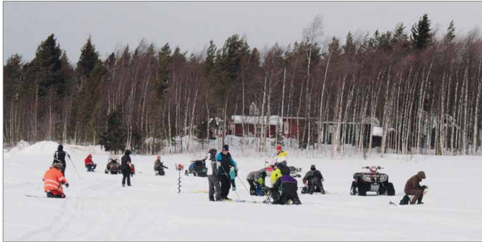
Kovasta, puuskittaisesta tuulesta huolimatta ilmoittautuneita pilkkijöitä oli jäällä neljäkymmentä.

kävijämäärä nousi yli kuudenkymmenen. Tämä lämminhenkinen, leikkimielinen pilkkikilpailu on saanut vankan jalansijan Aittojärven kyläseuran tapahtumakalenterissa, josta on tullut jokakeväinen piristys kaamosajan jälkeen. Kevätpäivän viettoon oli oman kyläseuran väen lisäksi saapunut vieraita myös naapurikylistä ja jopa naapuri pitäjän puolelta.