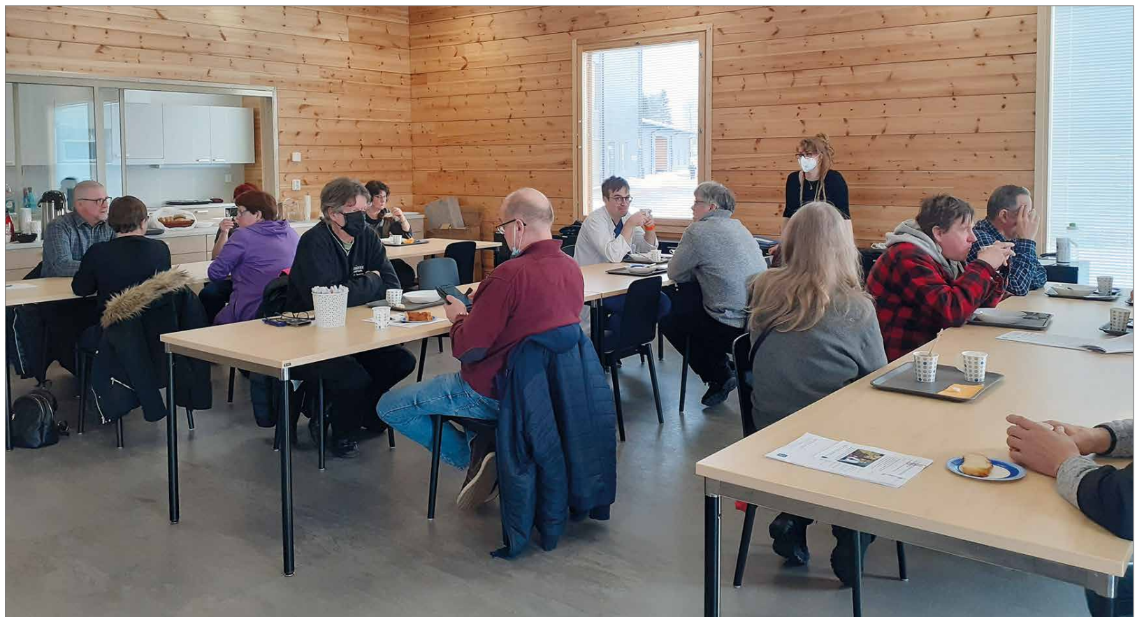
Lopuksi poristiin keittolounaalla Pirtin nuorisotiloissa.