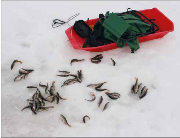
Joillekin pilkkijöille Aittojärvi antoi paistinahvenia ihan näkymään asti.

Lauantaina 19.3. narrattiin Aittojärvestä kilokaupalla Ahdin anteja. Saalismäärät vaihtelivat nolasta jopa 2,5 kiloon saakka. Navakka tuulikaan ei karsinut osallistujia tästä Aittojärven kyläseura ry:n järjestämästä joka keväästä ulkoilmatapahtumasta. Pilkkijöitä oli aikuisten sarjassa 22 ja lasten sarjassa 13. Siihen kun lisätään huolto- ja kannustusjoukot, niin