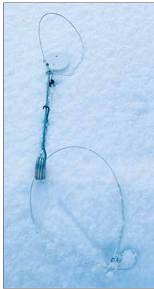
Sivusuuntaisia "viiruja" ei saa lumeen jäädä, ainoastaan jäljen myötäisiä viiruja voi olla -aivan kuten ketun tassu olisi kulkiessaan viistänyt lunta.

Koulutus jatkui maastossa pyyntikierroksen läpikäynnillä, jossa kouluttaja korosti jalkanarujen oikeanlaista asennuspaikkaa ketunjälkijotoksessa. Parhaita asennuspaikkoja ovat suoraan kulkevat jälkijonot, jotka ylittävät pyyntikierroksen tai kulkevat sen sivulla, risteyspaikat, joissa kahdet tai useammat ketun jäljet yhdistyvät sekä ojan ylittäneen ketunjäljen ojapohjalla oleva jälki. Jalkanaru pyritään asentamaan jäljen sivulta päin, siten että omaa jälkeä saa peitettyä vähintään 5-8 metriä asennuspaikalta poistuttaessa. Jalkanaruasennuksessa on muistettava, että ketun jäljen on pysyttävä täydellisenä asennuksen jälkeenkin. Sivusuuntaisia "viiruja" ei saa lumeen jäädä, ainoastaan jäljen myötäisiä viiruja voi olla -aivan kuten ketun tassu olisi kulkiessaan viistänyt lunta.