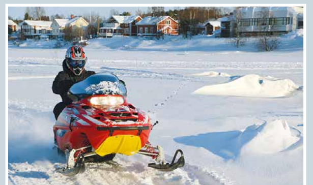
Kelkkailijan kelit.

Martti Kähkönen lukijoiden palaute ja jutut: vkkmedia.fi