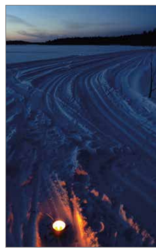
Ladut olivat hyvässä kunnossa ja roihut valaisivat reittiä.

Kiitoksia kaikille osallistujille, talkoolaisille ja yhteistyökumppaneille – tämä on