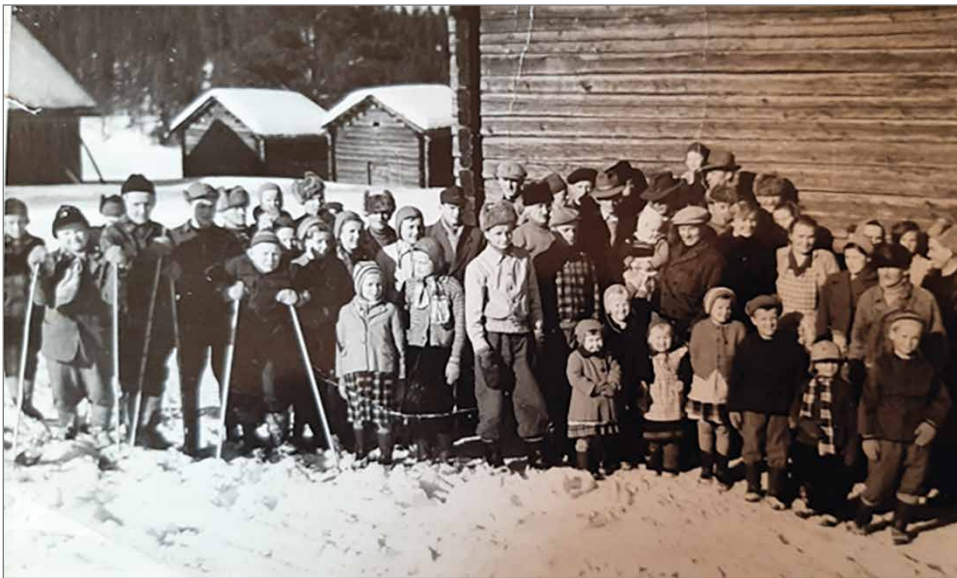
Korppuhiihdon osanottajat noin 70 vuotta sitten. Sakarilan puojin päässä otettu valokuva mistä käy ilmi kisan suosion yltäneen vauvasta vaariin.

Muistiini on jäänyt myös kerrallinen tapahtuma Leppälän kartanolta. Sin- ne ilmestyi muutamia naa- purikylän poikia. Niitä kat- sottiin vähän kieroon, että mitä tänne tuutta norkoi- lemaan. Siihen aikaan taisi olla aika yleistä pieni kylä-