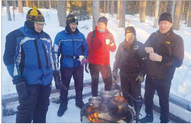
Kilpailijoille oli tarjolla nokipannukahvia, makkaraa ja mehua. Tarjottavat maittoivat hiihtäjille hyvin.