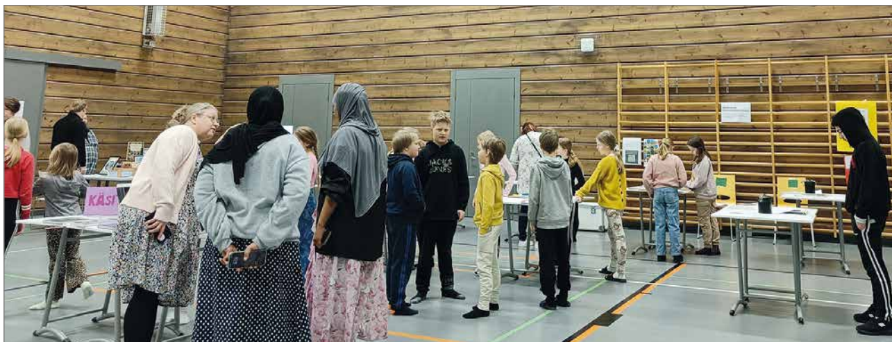
Idea kirjallisuusmessuista oli saanut alkunsa syksyn lukemisteemaisesta kirjastopalaverista, jossa olivat olleet mukana äidinkielenopettajat sekä kirjaston väkeä.

Miina Jylhänlehto ja Zeynep Eren, kuvat Miina Jylhänlehto