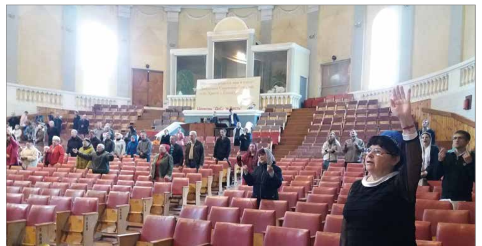
Kramatorskin seurakunta auttaa tänä päivänä jakamalla vaatteita, ruokaa ja vettä kaupunkilaisille sekä auttamalla lääkäreitä ja sairaanhoitajia.