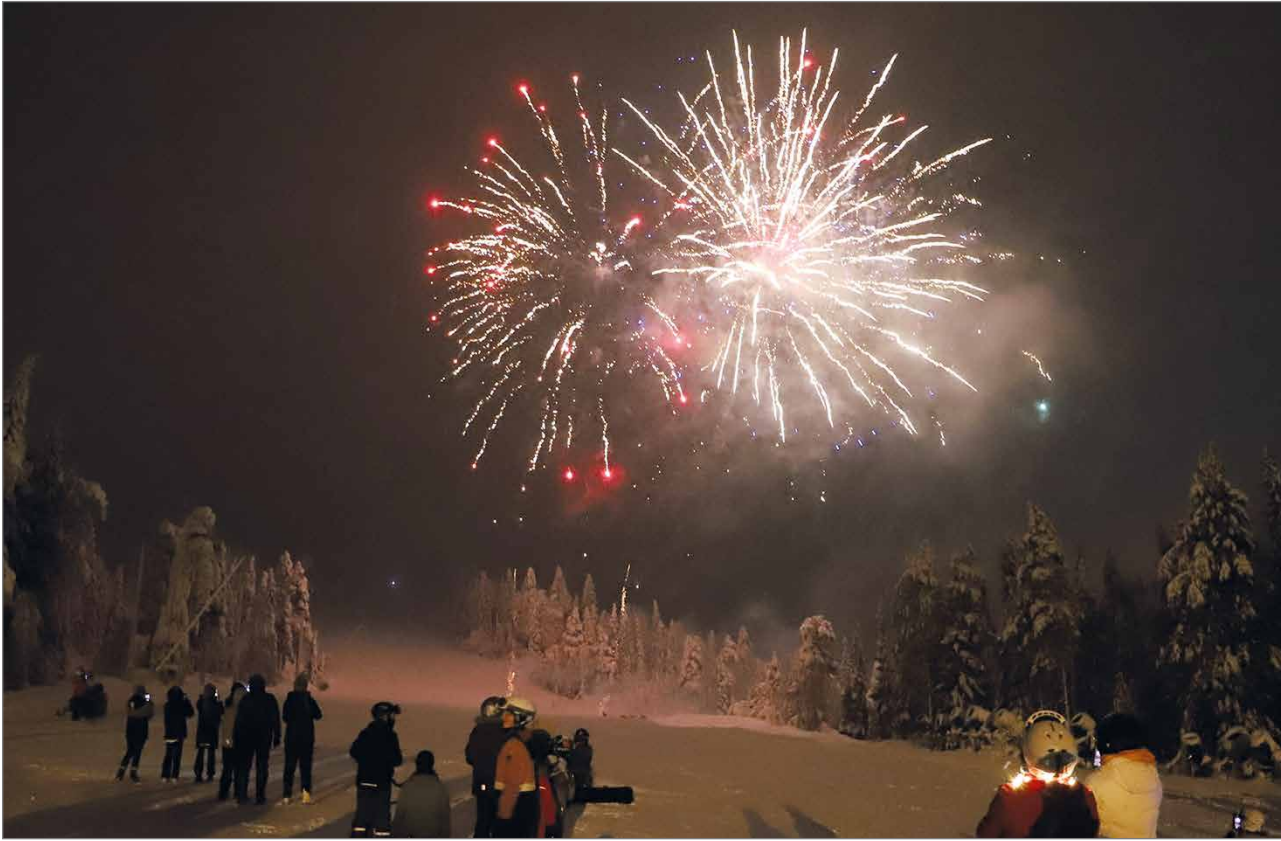
Ilotulitus järjestettiin Iso-Syötteellä yhteistyössä eri yritysten kanssa.