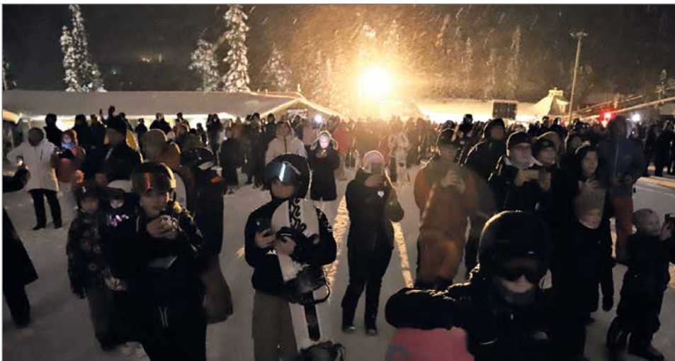
Uuttavuotta oli vastaanottamassa Iso-Syötteen rinteiden juurella arviolta reilusti yli tuhat henkeä.

Syötteellä vuoden 2022 viimeistä päivää vietettiin lumisateisessa säässä. Alueelle oli saapunut tuhansia ihmisiä nauttimaan ulkoilun ilosta ja juhlimaan alkavaa vuotta. Innokkaita talviurheilijoita riitti koko viikonlopun niin laskettelurinteissä ja laduilla, kuin kävelen ja läskipyörien selässäkin. Kotimaisten matkailijoiden, alueen mökkiläisten ja vau- nulaisten lisäksi tänä vuonna Syötteen uudesta vuodesta nautti myös moni ulkomailta lomailemaan tul- lut asiakas. Alueen toimijat järjestivät vuoden vaihteen viikonloppuna erilaisia tapahtumia, jotka huipentuivat vuoden vaihteeseen. Iso-Syötteen laskettelurinteiden ilmainen yömäki päättyi ennen puolta yötä, jonka jäl- keen satapäinen lapsijoukko pujotteli upeana soihtujono- na alas tunturin eturinteen. Soihtulaskun jälkeen, vuo-