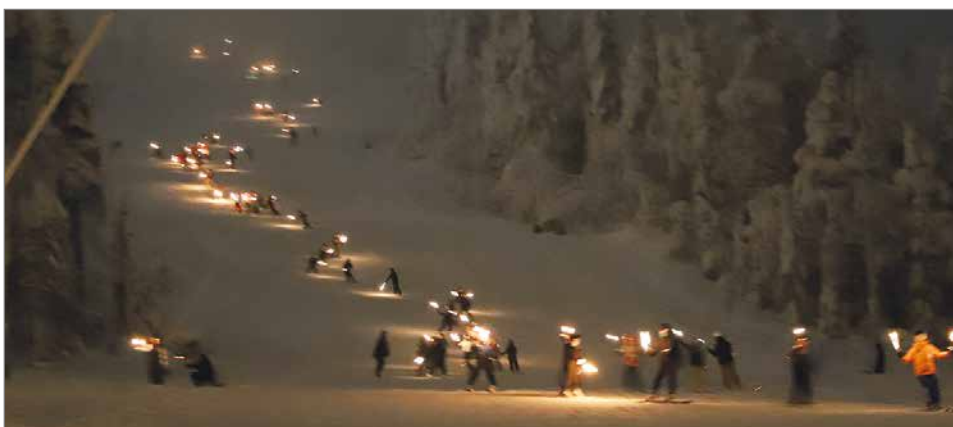
Näyttävään soihtulaskuun juuri ennen puolta yötä osallistui yli 100 nuorta laskijaa.