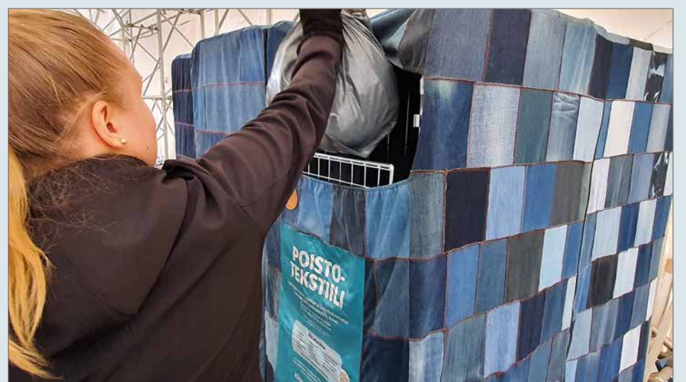
Poistotekstiilin keräys käynnistyy Pudasjärvellä vuoden alusta alkaen. Keräyspaikkana toimii 4H-yhdistyksen kierrätysmyymälä Topi-Tori.

tiilien hyödyntämisestä paikallisia ideointi- ja infotilaisuuksia alkuvuodesta 2023.