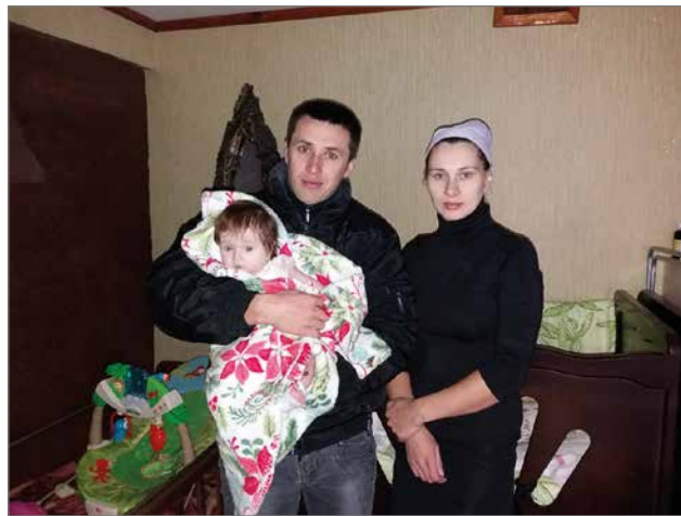
Viktorin pojan perheen pienokainen syntyi kauttaaltaan paikallisena. Lääkäri ovat tehneet parhaansa.

Vuonna 2018 olin kolmannen kerran Ukrainassa. Silloin Pyhän Maan Kristittyjen järjestämällä matkalla. Kiovaasta matkustimme Ljubnin kaupunkiin, jossa veimme lastenkotiin avustusta ja tutustuimme missä mallissa seurakunnan remontoima vanhustenkeskus on. Kaupunginjohtaja kertoi meille sosiaalityön haasteista. Ljubnista jatkoimme Itä-Ukrainassa sijaitsevaan Kramatorskin kaupunkiin. Lukijat muistanevat, että kesällä venäläiset ampuivat raketteja kaupungin rautatieasemalle, jonne tulimme junalla.