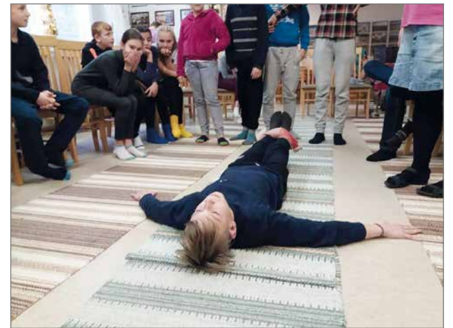
Sodasta kärsivien lastenleirillä oli monenlaista ohjelmaa. Eräs 12-vuotias tyttö sanoi Posion kirkossa pidetyssä tilaisuudessa: "Leirillä lauletti hengellisiä lauluja, jotka ovat parantaneet minun sydämeni."

Pyhän Maan Kristityt ry ja Global Christian Support ovat yhteistyössä järjestäneet sodasta kärsineille lapsille hoitavia leirejä Suomessa, kaksi kertaa Kuhmossa ja kaksi kertaa Posiolla. Itse olen saanut olla apulaisena molemmilla Posion leireillä. Ensimmäisellä leirillä 2019 syntyi laulu, "Kohtaaminen". Jos pienen lapsen kohtaata, jota tunne et, niin anna silloin hymy, jonka huomaisi hän, kun tietää et voi mitään,