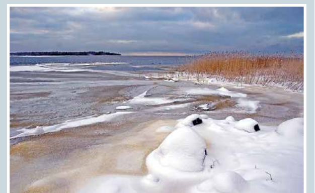
Maaklaaman rantaa.

Martti Kähkönen lukijoiden palaute ja jutut: vkkmedia.fi