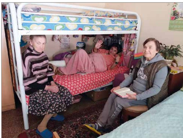
Nämä naiset olivat ennen juoppoja ja asuivat kadulla. Uusi Elämä seurakunnan työntekijät löysivät heidät, antoivat ensiapua, pesivät, vaatettivat ja tarjosivat sisämaajoituksen. Nyt he auttavat toisia.