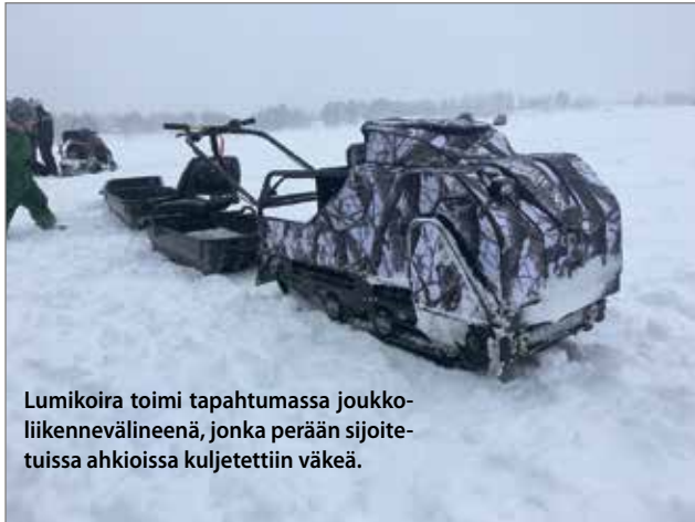
Lumikoira toimi tapahtumassa joukkoliikennevälineenä, jonka perään sijoituissa ahkioissa kuljetettiin väkeä.

Reilut sata henkeä Jakkukylästä ja lähiseudulta kokoontui Onkilahteen lauantaina 24.3 pilkkimään, koeajamaan monenlaisia koneita ja laitteita sekä viettämään talvipäivää jutustellen ja nauttien tarjotusta lauhassa, lumisateisessa säässä.