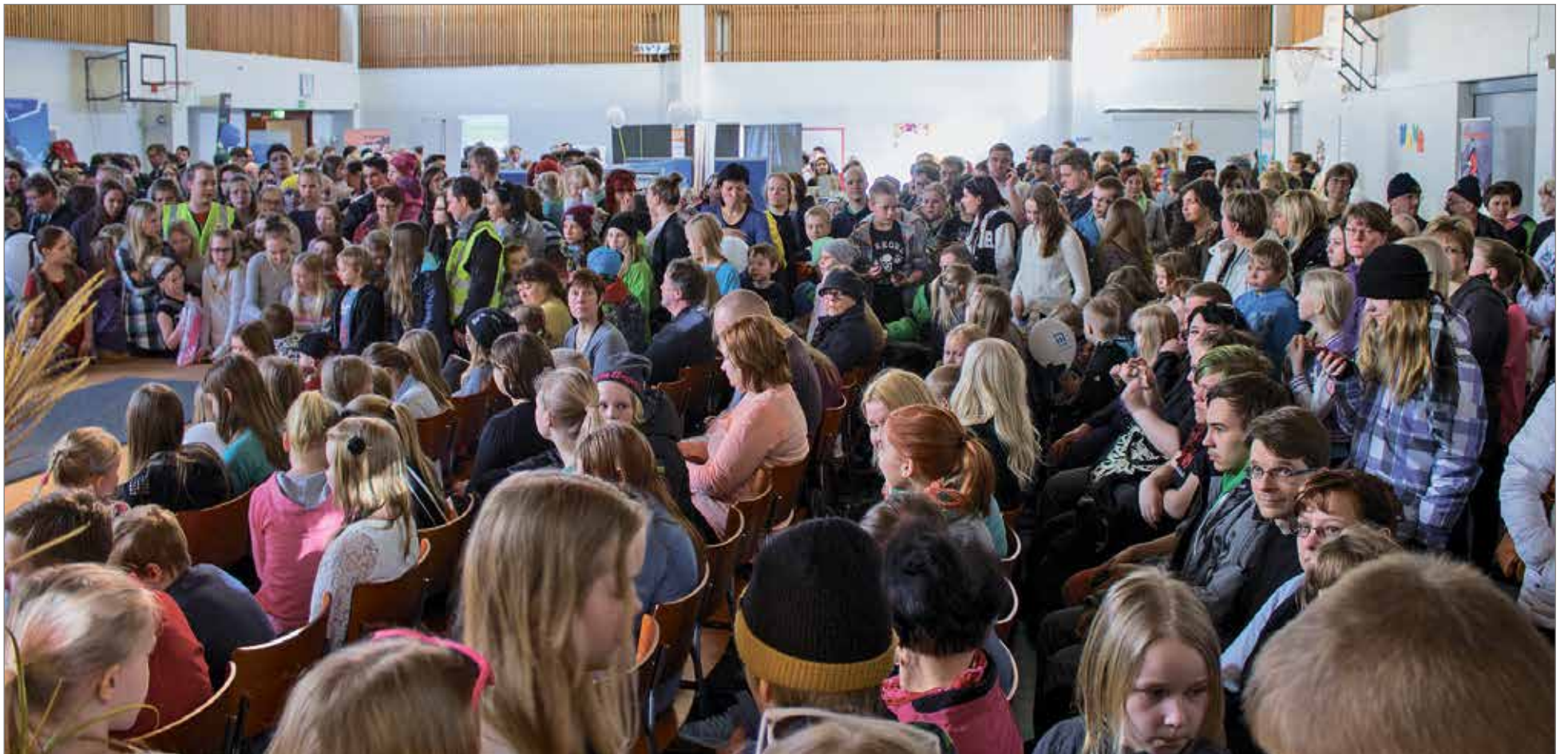
Messut ovat keränneet aiempina vuosina paljon porukkaa.

Pääsymaksu on viisi eu- roa yli seitsemänvuotiailta. MTR