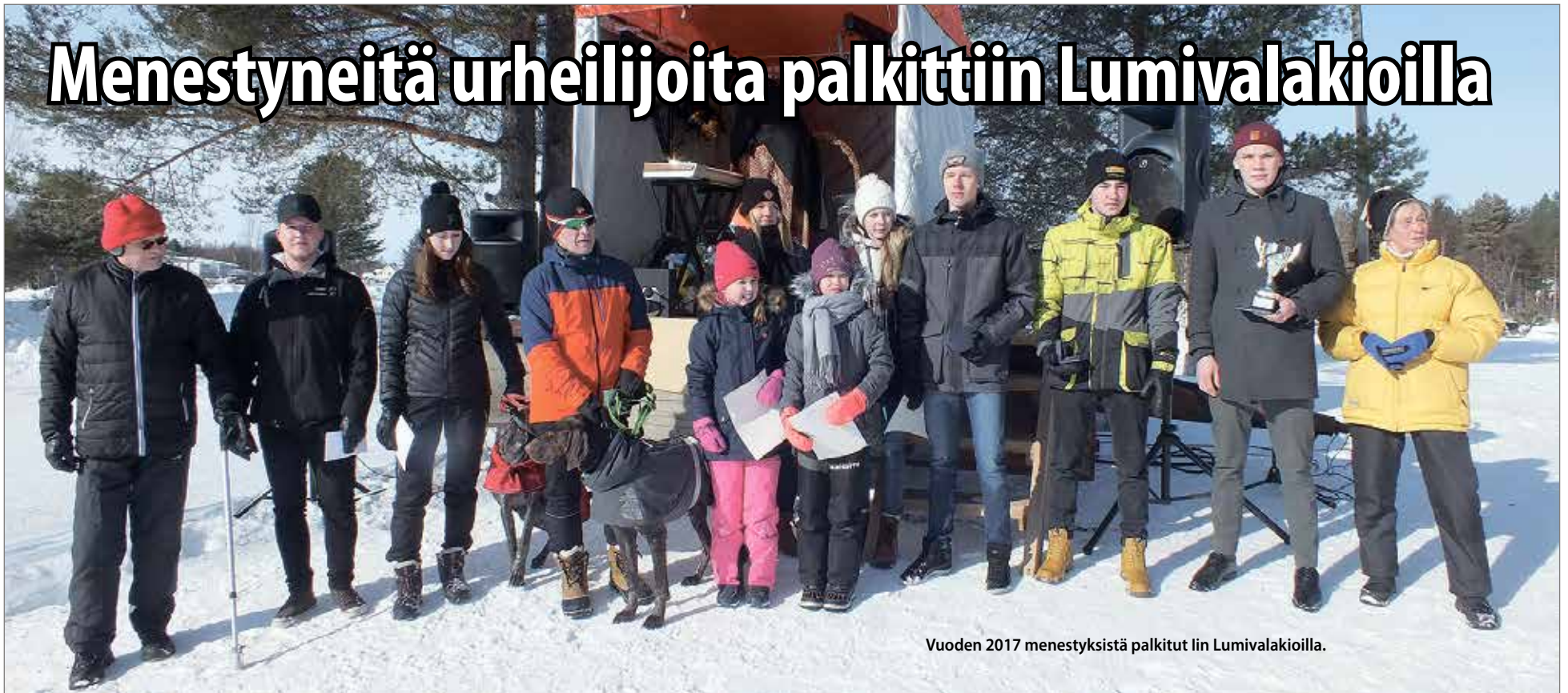
Vuoden 2017 menestyksistä palkitut Iin Lumivalakioilla.