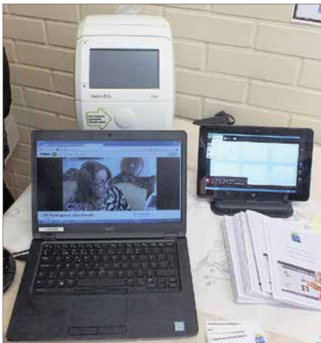
Läakerobotit ja kuvapuhelimet ovat tulleet kotihoidon asiakkaiden apuvälineiksi.

-Meillä on jo kymmenen lääkerobottia käytössä