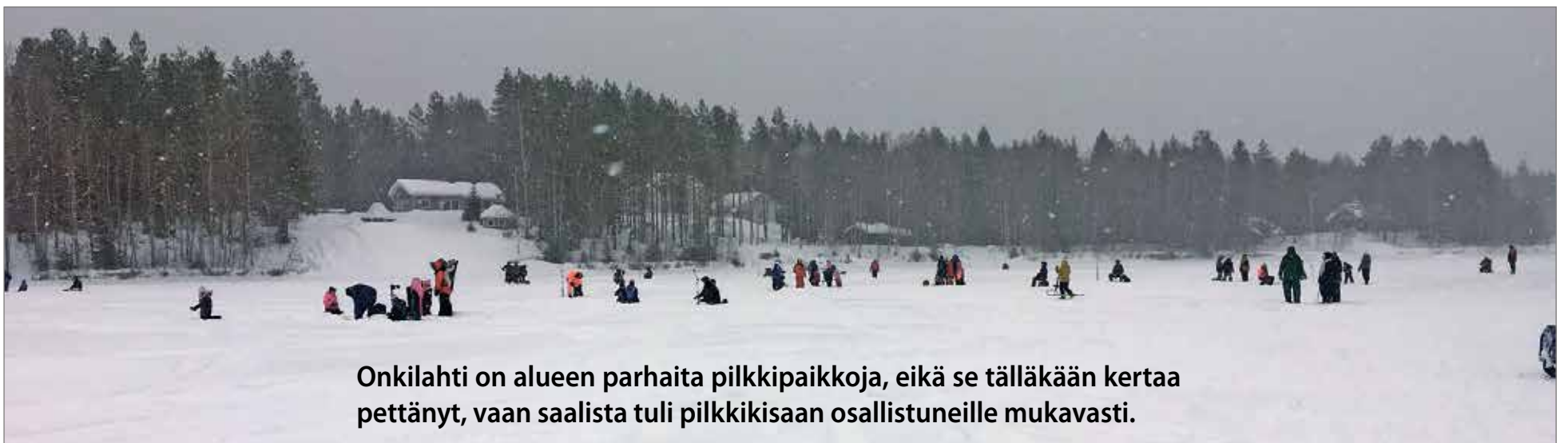
Onkilahti on alueen parhaita pilkkipaikkoja, eikä se tälläkään kertaa pettänyt, vaan saalista tuli pilkkikisaan osallistuneille mukavasti.

Jakkukylän kyläyhdistys järjesti tapahtuman yhdessä Jakun koulun leirikoulutoimikunnan ja Iin Kärkkäisen kanssa. HK