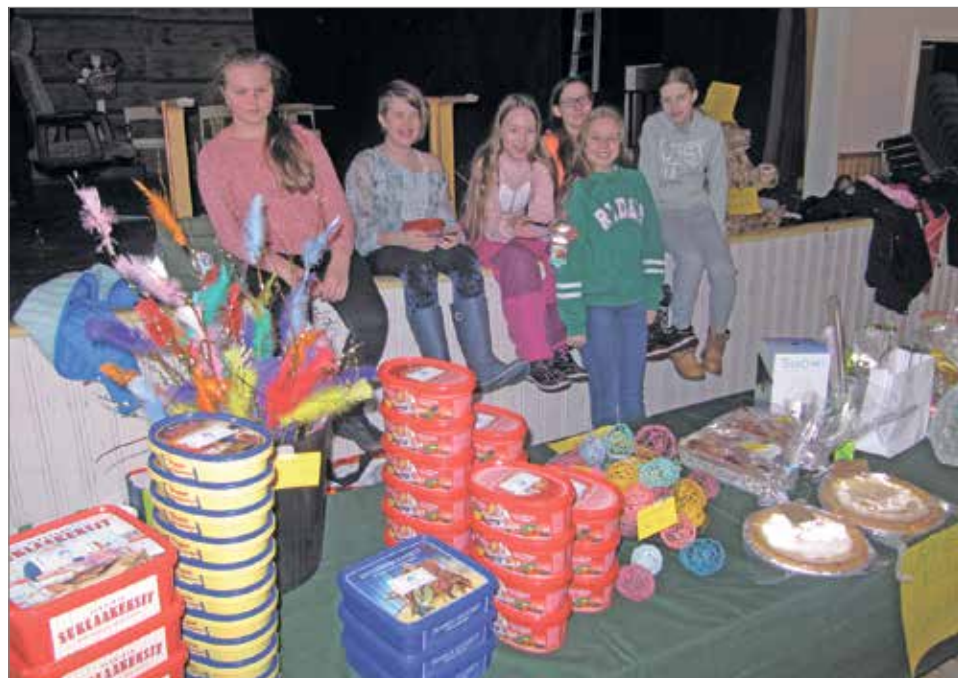
6.-luokkalaiset tytöt keräävät retkirahaa opintomatkalle Saksaan muun muassa myyjäisiä järjestämällä.