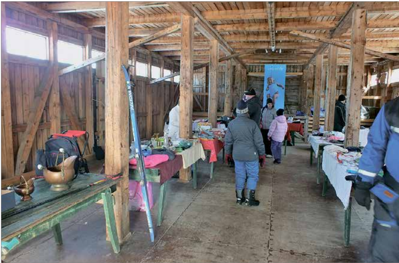
Unicef keräsi varoja katastrofirahastoonsa kirpputorin avulla.