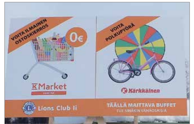
LC Ii oli kehittänyt mukavia kilpailuja hyvine palkintoineen.

Järjestäjien arvion mukaan tapahtumassa vieraili päivän aikana reilusti yli 1000 ihmistä, etupäässä lapsiperheitä. MTR