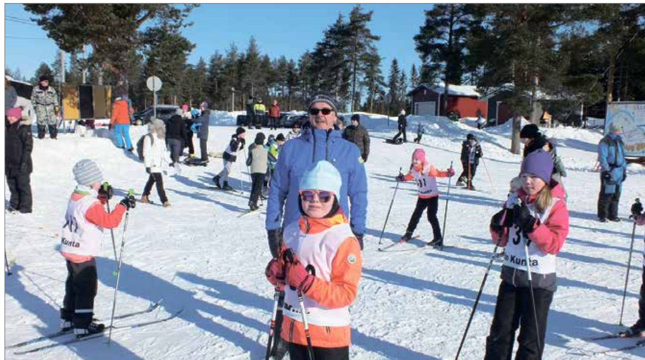
Tyttöjen 2lk valmistautuvat lähtöön vanhempien ja isovanhempien kannustamina.