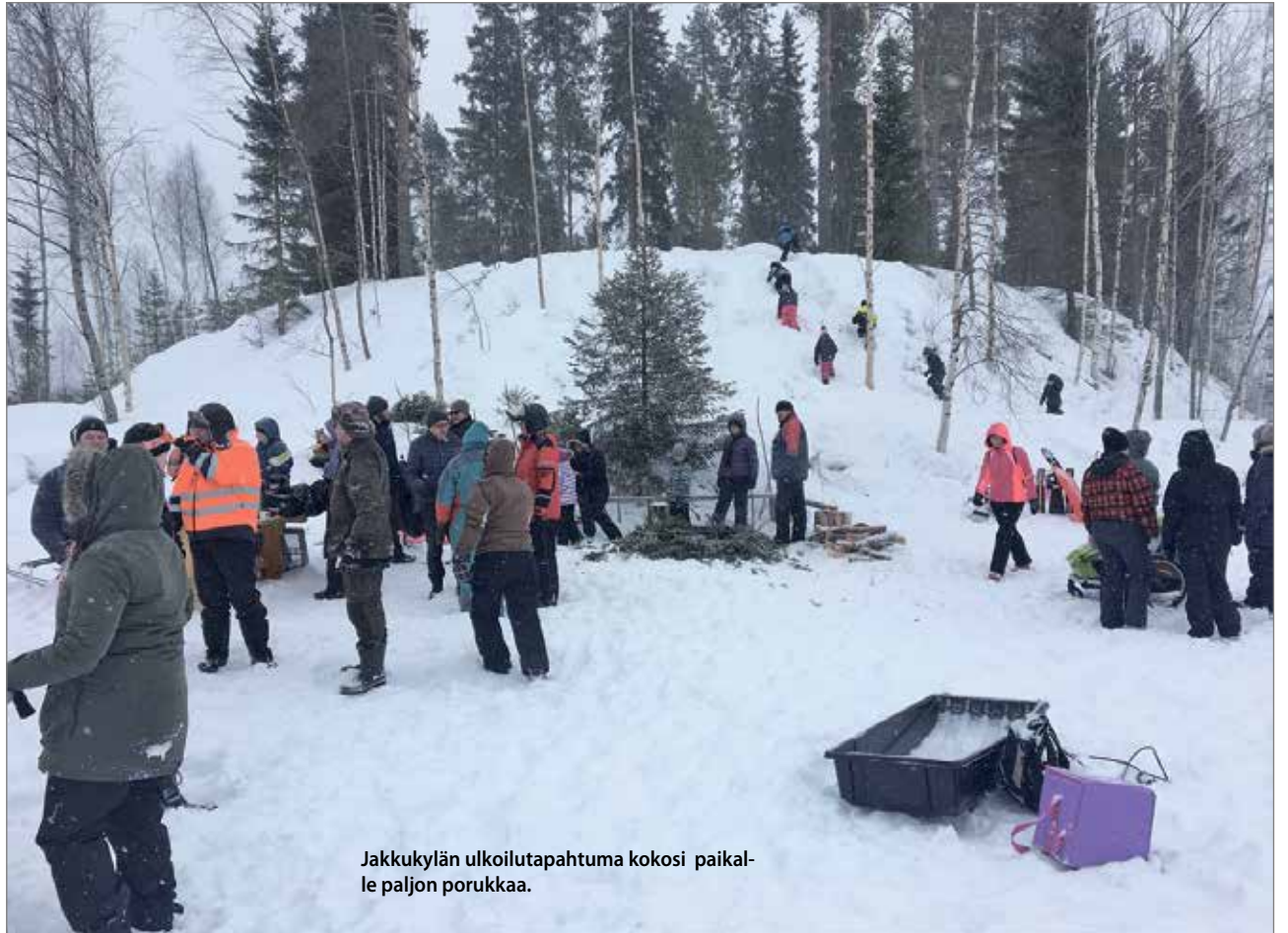
Jakkukylän ulkoilutapahtuma kokosi paikalle paljon porukkaa.

Saaren tehdään nuotiopaikan lisäksi noin kahden