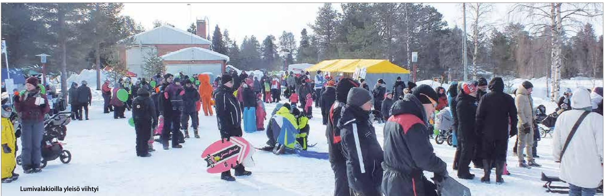
Lumivalakioilla yleisö viihtyi