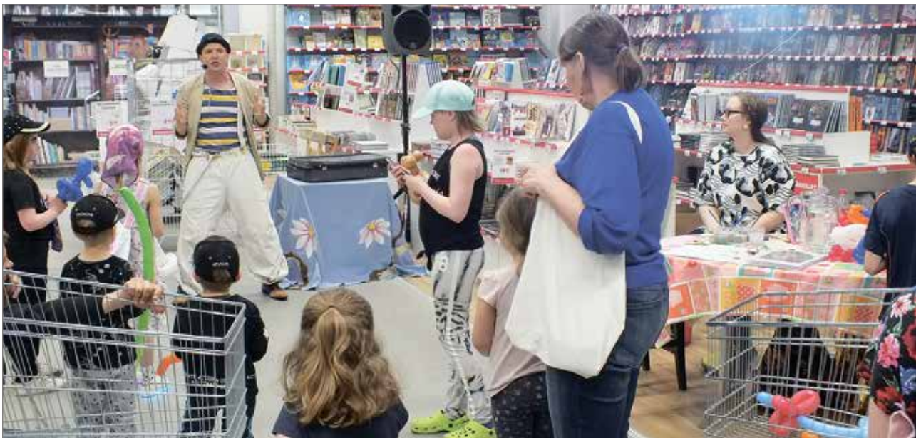
Taikuri Alfrendo kiinnosti etenkin lapsiasiakkaita