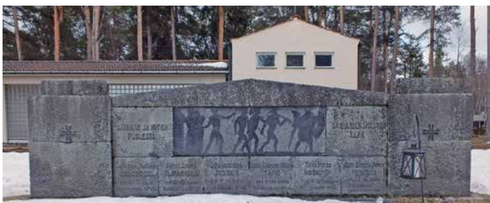
Sisällissodassa kaatuneille kuudelle valkoiselle on pystytetty muistomerkki Iin kirkkotarhaan.