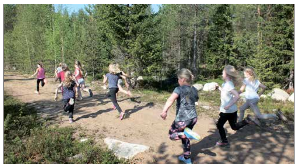
2.luokan tyttöjen lähdössä oli vauhtia.