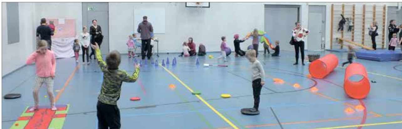
Leikkilauantai tarjosi monenlaista tempurataa ja muuta toimintaa.

Mannerheimin Lastensuojeluliiton Iin osasto järjesti ensimmäisen leikkilauantain 5.5. Valtarin koululla. Koulun saliin oli luotu monenlaista toimintaa pomppulinnaa kasvomaalaukseen ja onginnasta vauvanurkkaukseen. Lisäksi salin aulassa toimi puhvetti,