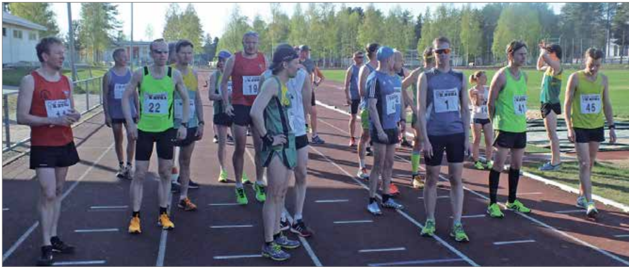
Ratakypille osallistui kolmisenkymmentä juoksijaa.