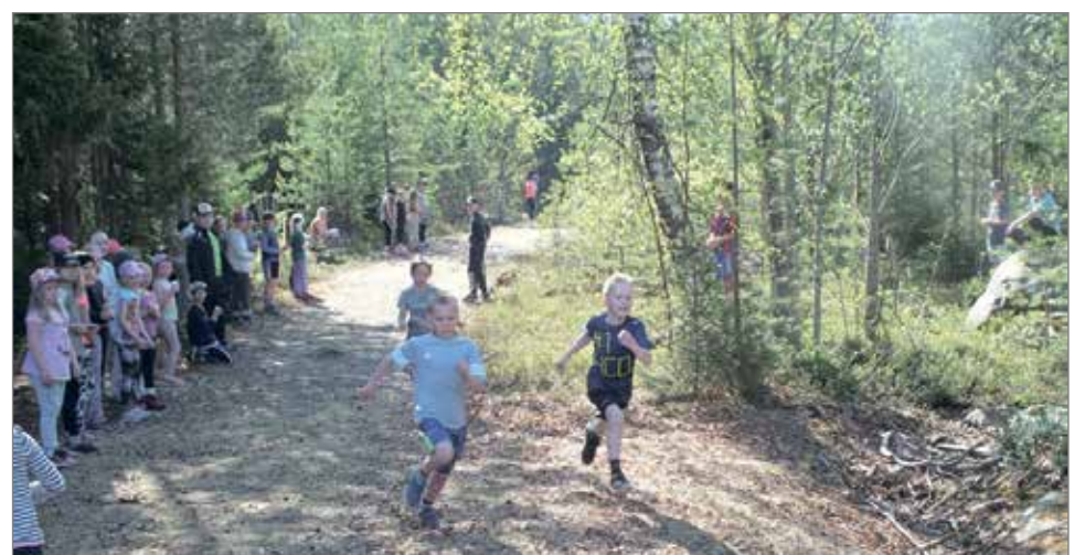
1.luokan pojissa taisteltiin voitosta maaliviivalle saakka.

tällä kertaa tärkeää. Siihen Aseman koulun oppilaiden kanttiini tarjosi hyvät mahdollisuudet niin kilpailijoille kuin kannustajille. MTR