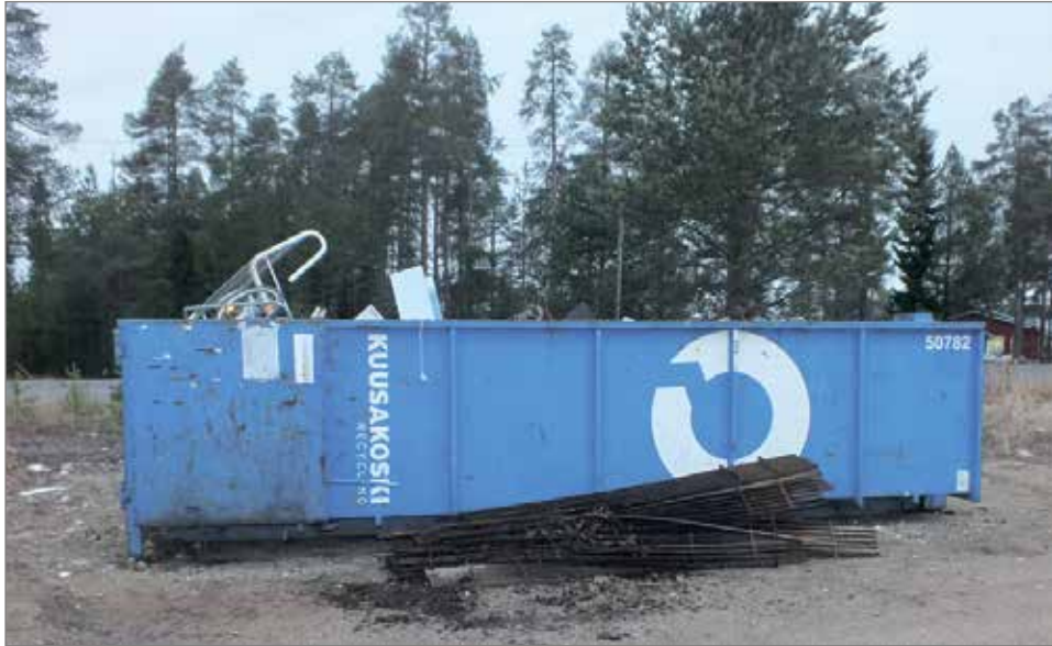
Rysän parkkipaikan nurkassa nököttävästä vaihtolavasta on ehtinyt muodostua tuttu näky kyläläisille.

Iin Urheilijat ry on kerännyt jo yli puoli vuotta metalliromua yhdistyksen seuratalon, Rysän pihassa. Keräys alkoi 6.5., ja sen oli tarkoitus kestää kolmisen viikkoa, mutta kun romua vain tuli ja tuli, aikaa jatkettiin. Aluksi Rysän pihalla oli kaksi Kuusakosken vaihtolavaa, jotka tyhjennettiin kerran viikossa. Heinäkuussa keräystahti hiljeni sen verran, että käyttöön jäi vain yksi lava, jota sitäkin on tyhjennetty kerran viikossa lokakuulle saakka. Metallirohua ehtii tuoda lavalle vielä marraskuun loppuun asti, jolloin ainakin tältä vuodelta keräysprojekti päättyy.