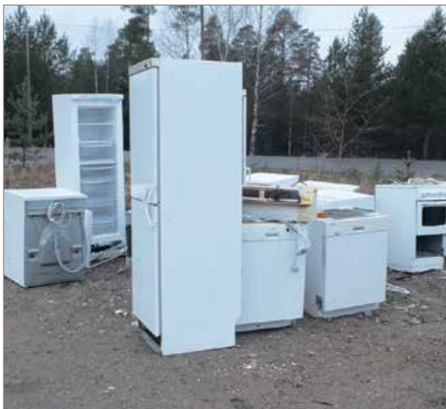
Yllä: Robotti Ruttunenkin pitäisi tästä seurasta.

Iin Urheilijoiden nettisivuilla voi liittyä seuran jäseneksi, ilmoittautua mukaan toimintaan ja sieltä näkee myös tietoa tulevista tapahtumista. Pesäpallojoukkueessa on Jussilan mukaan hyvin tilaa, ja kunhan lumet saadaan maahan, niin alkavat hiihtokoulut. RT