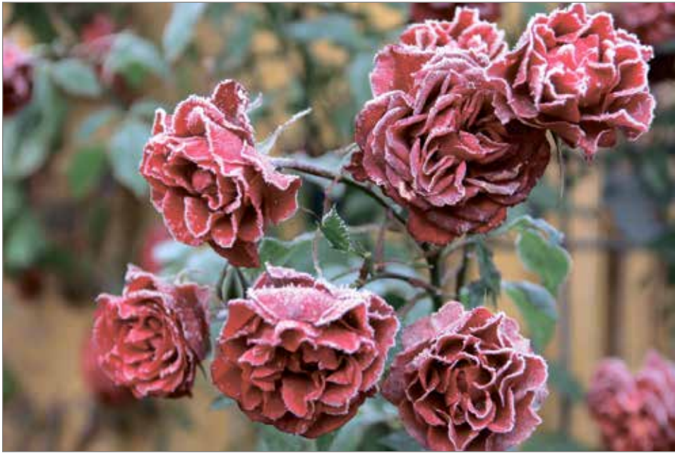
Äitienpäiväruusuni piharuukussa marraskuussa.