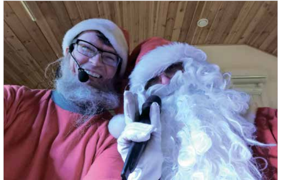
Valto-tonttu on monelle tuttu Pressan Katti -lasten yhtyeestä.

että Nuorisotila Nurkassa on Iin Helluntaiseurakunnan Gospel Nurkka lauantaina kello 18-22. RH/HT