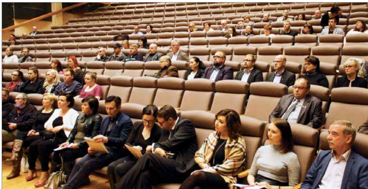
Vuosikokoukseen Raahesalissa osallistui 77 virallista kokousedustajaa, kaikkiaan noin 100 henkeä. Iin Yrittäjien kokousedustajat ovat ylimällä istuinrivillä.