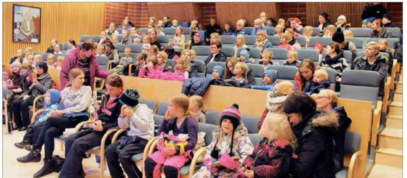
Nätteporin auditorio oli lähes täynnä, kun Joulupukki saapui.