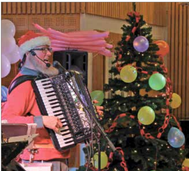
Valto-tonttu laulatti lapsia Nätteporissa.