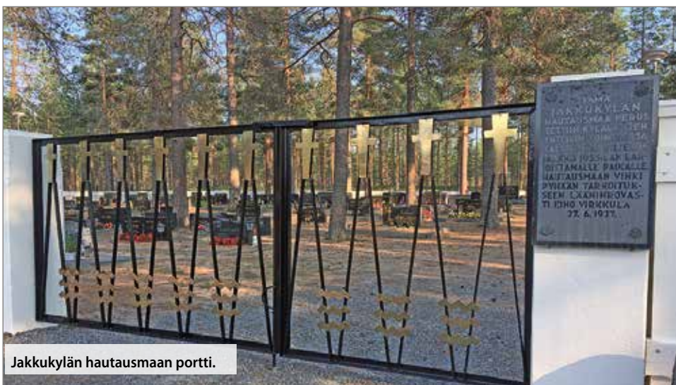
Jakkukylän hautausmaan portti.