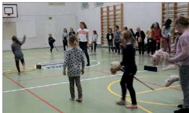
Keppihevokurssilla koulun liikuntasalissa.