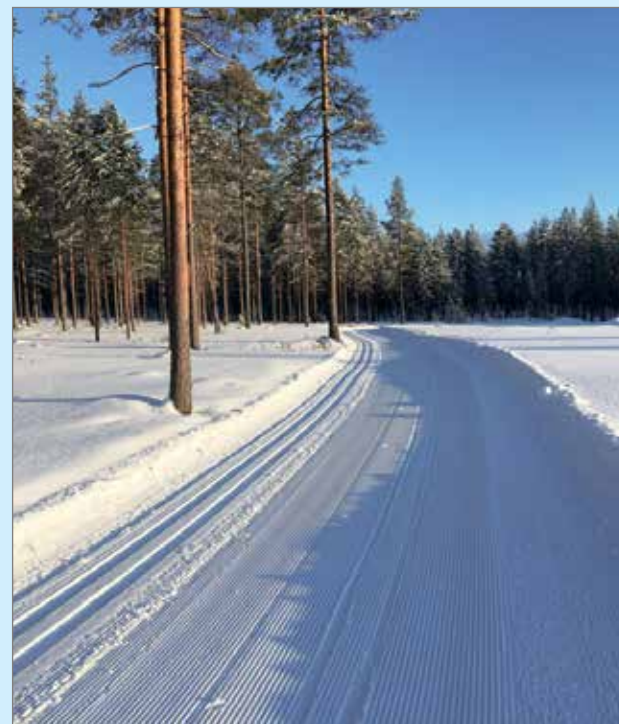
Jakun koulun vieressä sijaitsee Oulun kaupungin ”läksiäislahja”, n. 3,5 km pituinen uusi, kivituhkan ja purun seoksella päällystetty kuntorata, jossa on talvella perinteisen latu sekä luistelubaana. Reitin varrella sijaitsee laadukas nuotiopaikka

”Perusajatukseksi on, että hallintovalta nousee kansasta ja toteuttaa kansan tahtoa. Jos näin ei ole, kansa ei seuraa sivusta tumput suorana, ei ainakaan Jakkukylässä. Se on jälleen kerran nähty. Iin läheisyys, sen kylämyönteinen henki ja parempi mahdollisuus vaikuttaa päätöksentekoon antavat meille hyvät mahdollisuudet oman kylämme elinvoiman kehittämiseen.”