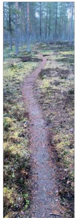
Kuivien kankaisten metsäpolut kutsuvat lenkkeilemään.