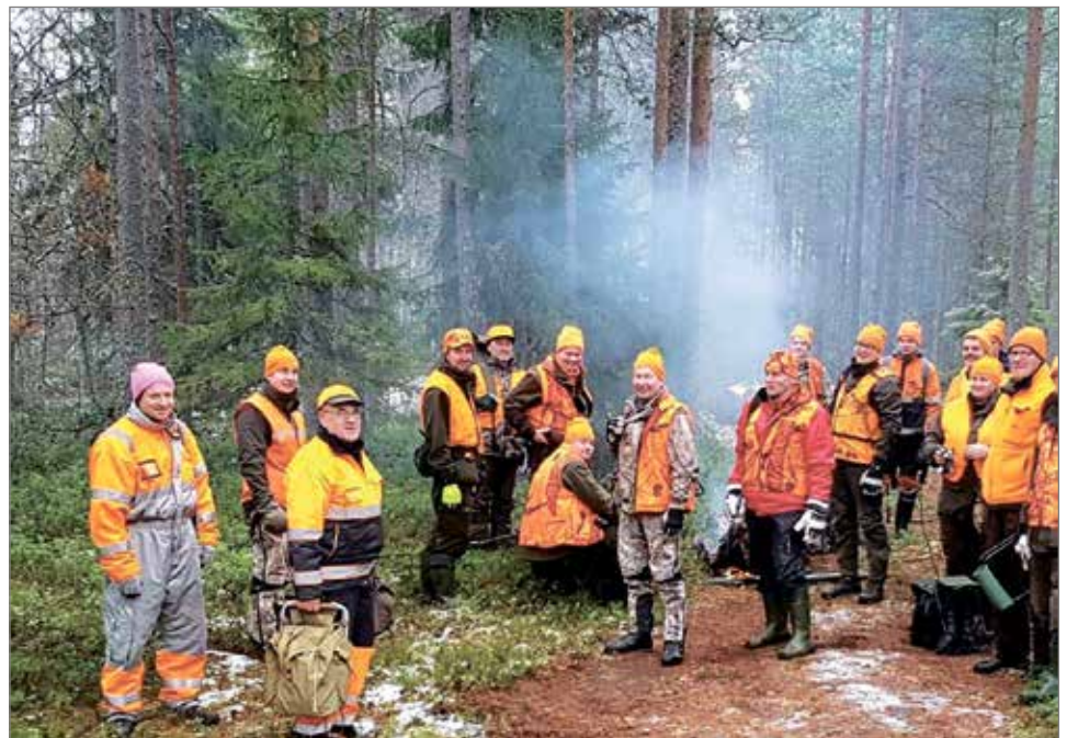
Evvää on syöty ja vaatteet on märät eikä mittään oo saatu, mutta mukavaa oli