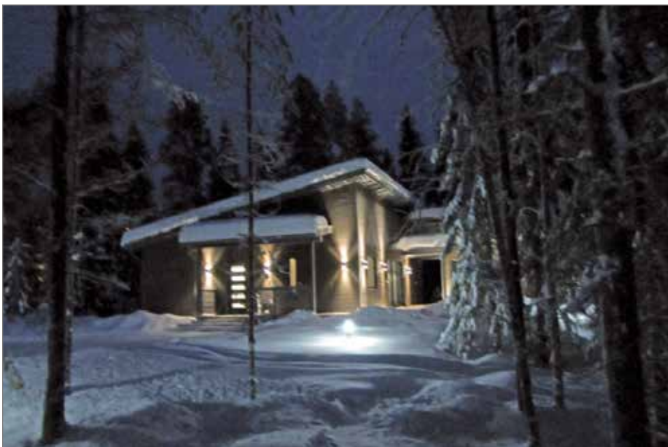
Jakkukylän uusiin talo on ihanteellisella paikalla rauhaa rakastaville.