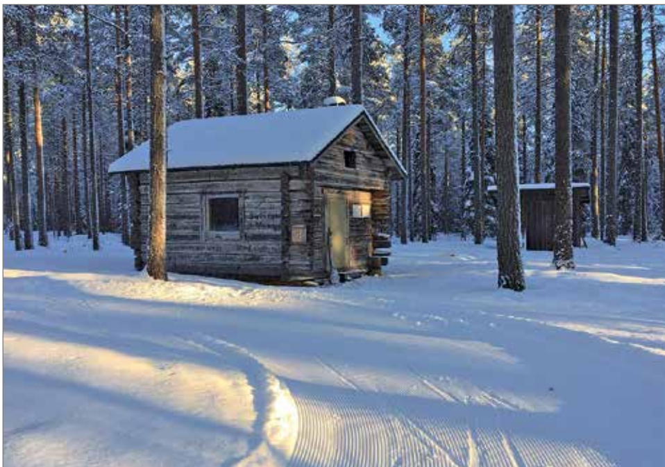
Impivaaran kämppä on oiva retkeilykohde hyvien marjamaiden ympäröimänä

vesiosuuskunnan nykyinen isännöitsijä Tapani Päckilä.