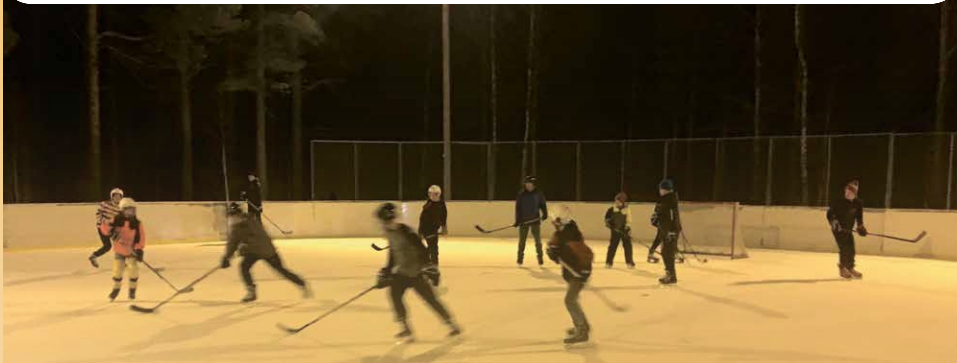
Jakun koulun vieressä oleva jääkiekkokaukalo täyttyy iltaisin innokkaista pelaajista