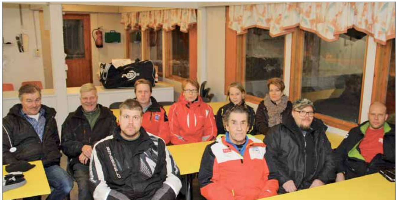
Kilpailun onnistumiseksi on pidetty ja tullaan pitämään useita kokoontumisia. Viimeksi sellainen oli viime viikon keskiviikkona 10.1 Illinsaaren hiihtomajalla.