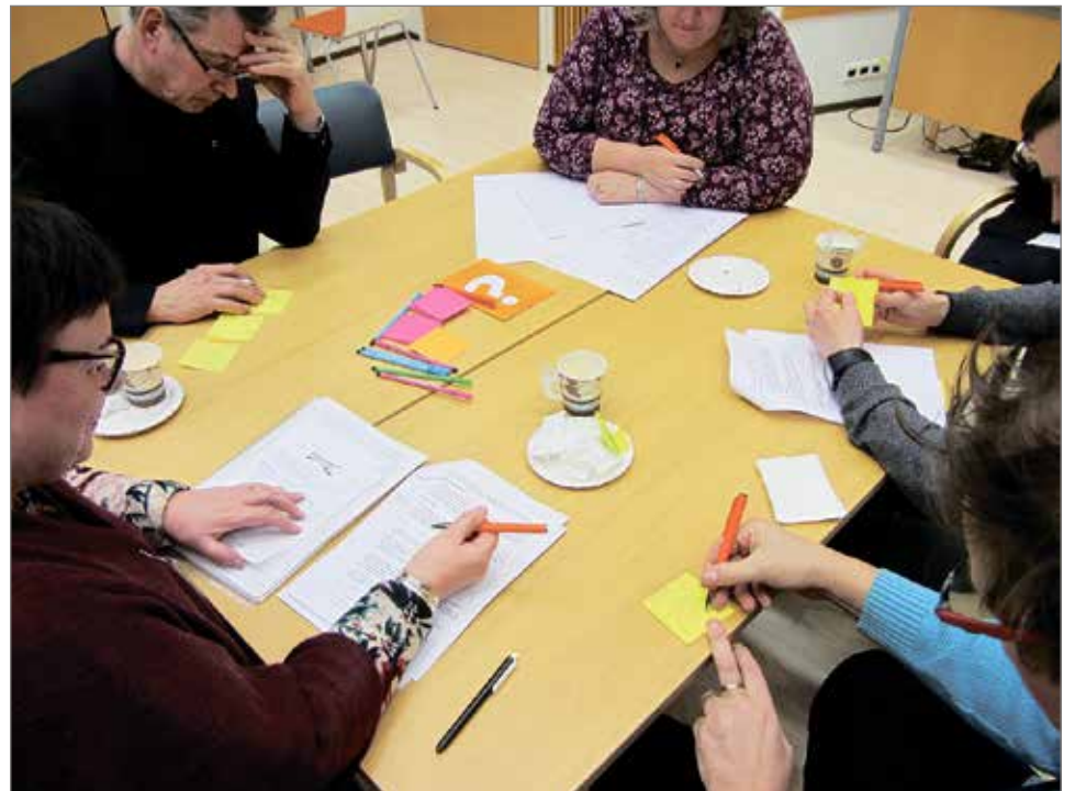
Kuntalaisraati ideoi viihtyisä koti -teemaa.