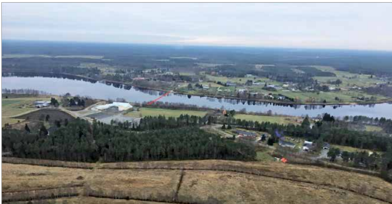
Kuva Jakkukylään suunnitellun riippusillan paikasta, Jakun koulun kohdalta.