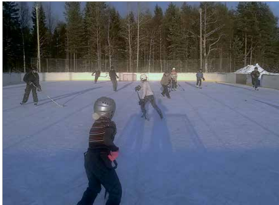
Koulun pihassa oleva kaukalo on aktiivisessa käytössä talvikaudella.