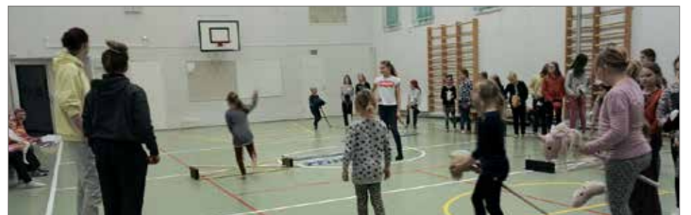
Kyläkisällin keppihevoskurssi Jakkukyläläisille.