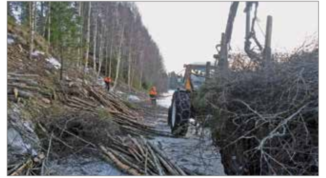
Purusaaren rantatörmien maisemointiraivausta tehtiin talkoilla keväällä 2017.

Purusaaren virkistysalue palvelee niin kyläläisiä kuin ulkopaikkakuntalaisiakin. Liijoella kulkeville tulee saareen mukava taukopaikka ja tutustumispaikka. Purusaaren maisema ulospäin siistyy rantatörmien raivauksen ansiosta. Purusaaren luodaan hyvät edellytykset liikkuu ja retkeillä luonnossa. Saareen kulkeminen kesällä tehdään helpoksi ja nostalgiseksi elämykseksi kapulalossin avulla.