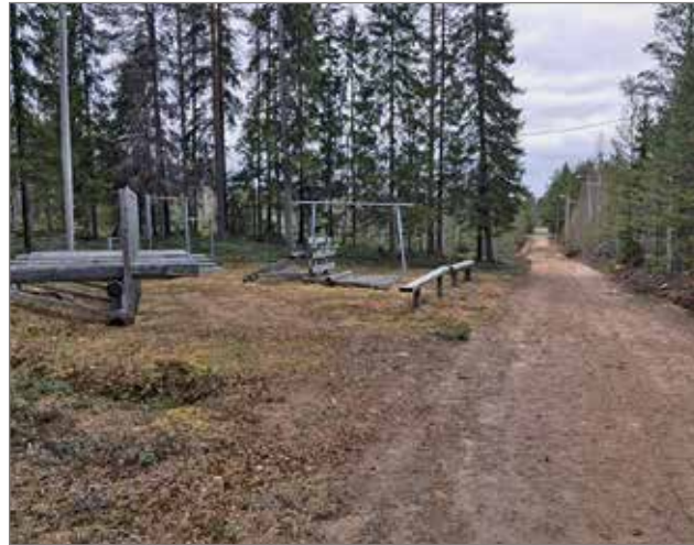
Joen eteläpuolella on kuntorata, jonka varrella on myös kuntoiluun tarkoitettuja rakennelmia. Talvisin kylällä on runsaasti hoidettuja hiihtolatuja.