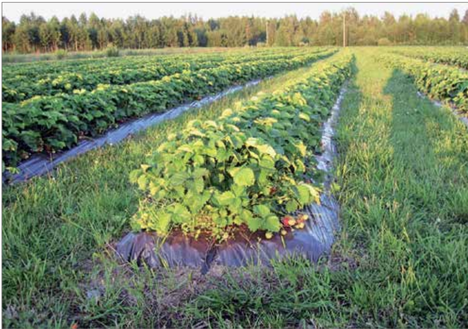
Kuva kesältä 2004. Hyvissä olosuhteissa mansikkapenkeistä tulee näyttäviä ja satoa tulee.