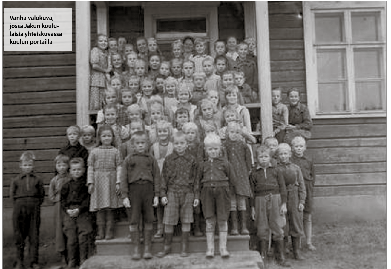
Vanha valokuva, jossa Jakun koululaisia yhteiskuvassa koulun portailla

Kuntakokous päätti pyytää Suomen valtionvaroista 10000 markan suuruisia valtionapua Pirttitörmän,