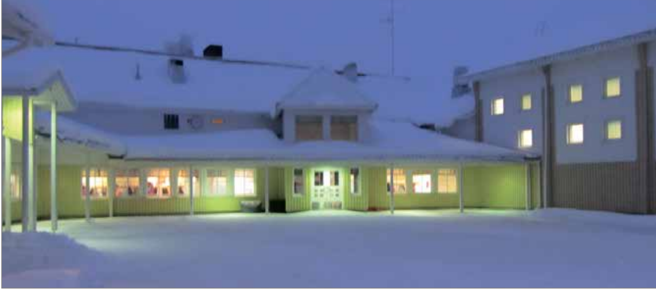
Jakkukylän koulu kiinteistö on hyvässä kunnossa

Jakkukylän koulu sijaitsee Iijoen pohjoisrannalla. Koulun oppilasmäärä on tällä hetkellä 66, joista esiopetuksessa 10. Opettajia koululla työskentelee neljä, joista yksi esiopetuksessa. Oppilaista 20 on venekuljetuksessa eli asuvat Iijoen toisella puolella. Talvella he kulkevat kouluun