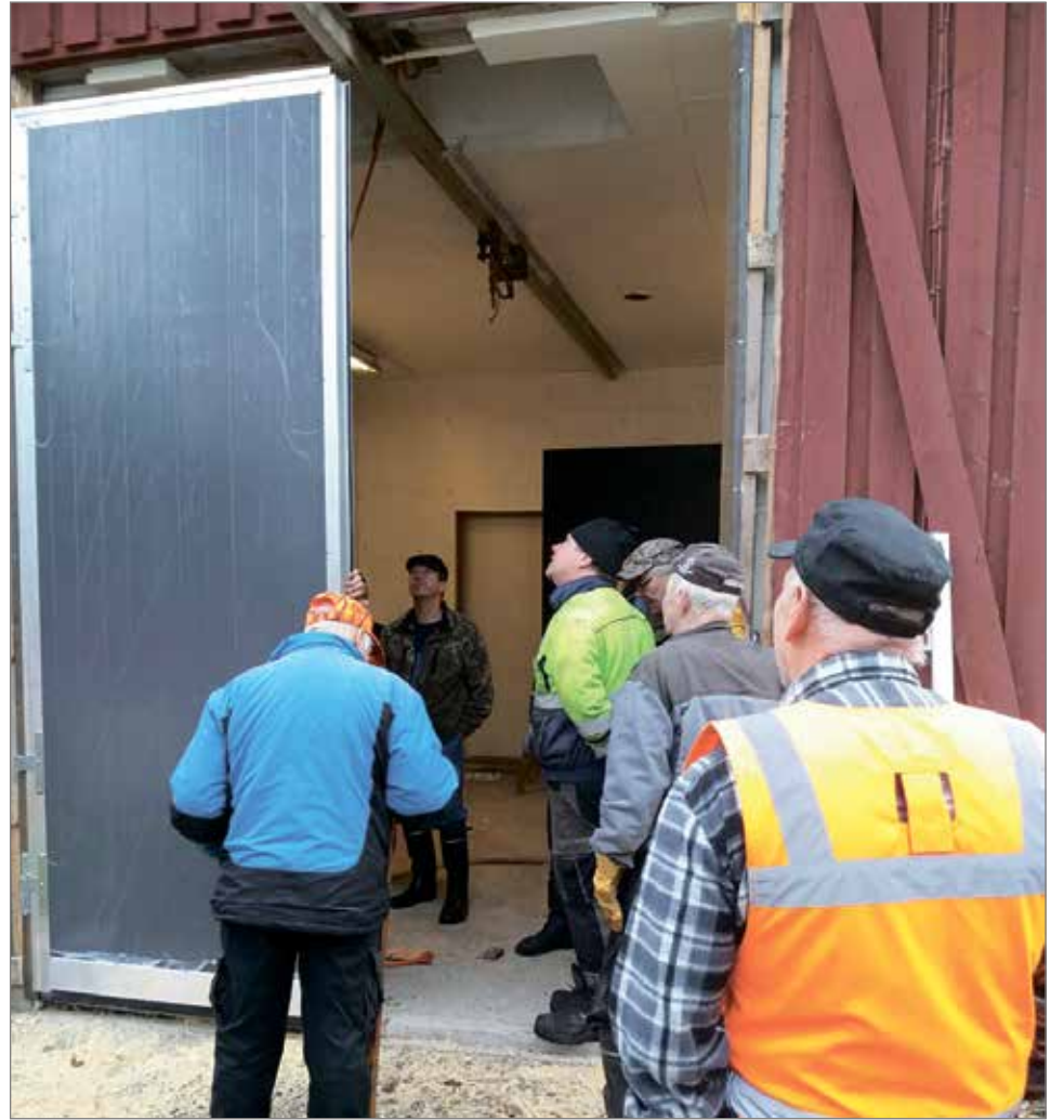
Pirttitörmän riistaveikot tekevät yhdessä talkoita. Tässä on meneillään hirviteurastamon ovien vaihto.

Seura järjestää erilaisia talkoita ja porukalla käydään harjoittelemassa ammuntaa radalla. Jokavuotuisen seurojenväliseen vasakipailuun osallistuminen on muodostunut perinteeksi. Seura omistaa kämpän jossa on tupa ja nylkyvaja. Lisäksi grillikota on jäsenten käytössä.