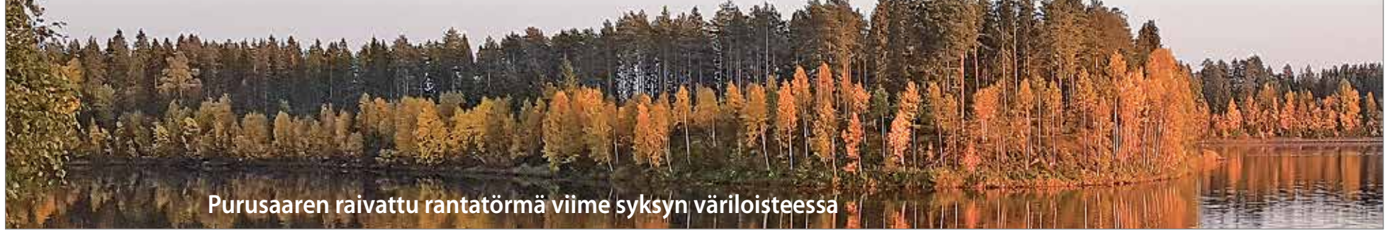
Purusaaren raivattu rantatörmä viime syksyn väriloisteessa