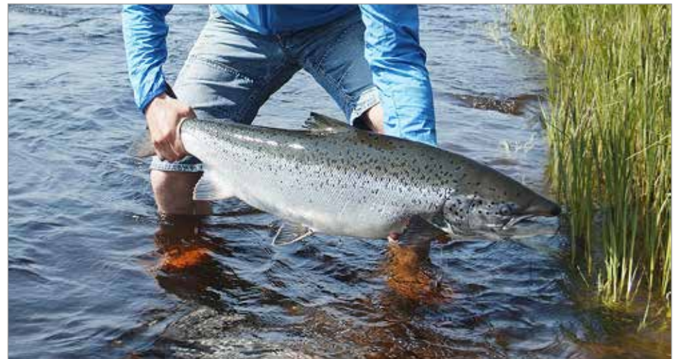
Iijoelle siirretty noin yhdeksänkiloinen koiraslohi.

Lohi Iijoki -hankkeen toimenpiteitä ovat smolttien telemetriaseuranta Haapakoskella ja Pahkakoskella (Luonnonvarakeskus), vedenalainen kameraseuranta Haapakosken smolttien alasvaellusväylällä, alasvaellusväylän koekäyttö