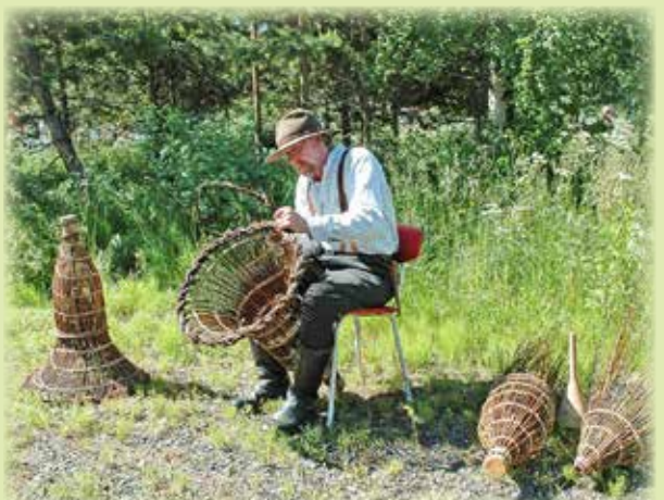
NAHKISMERRAN TEKOA.

lukijoiden palaute ja jutut: vkkmedia@vkkmedia.fi