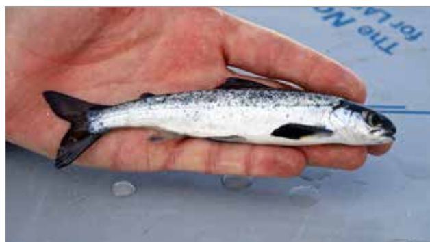
Iijoen haapakosken alasvaellusväylästä kiinniottettu lohismoltti.