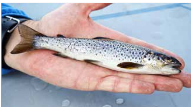
Iijoen haapakosken alasvaellusväylästä kiinniottettu taimenmoltti.

Tiedote ja kuvat: Pohjois-Pohjanmaan liitto