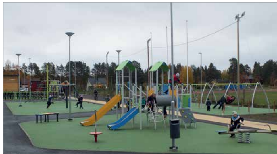
Koulun uutta pihaa oppilaat kehuvat hauskaksi ja leikkipaikkaa monipuoliseksi.