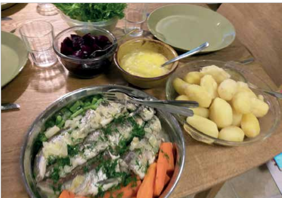
Kalapotun salaisuus piilee kalaliemessä kypsyneissä perunoissa.