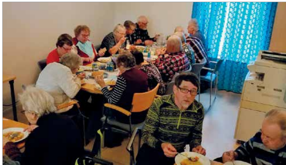
Porinapiiri aloitti syksyn toimintansa tarjoamalla yhdessäoloa ja ruoan