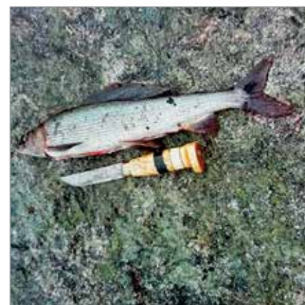
Muhojoen antimia_Pyydykseen jäi reilunkokoinen n 40 cm luonnonvarainen harjus.