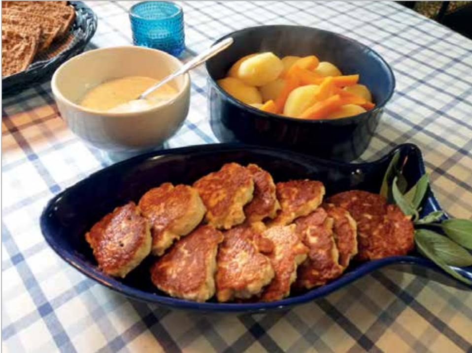
Haukipihvit maistuvat myös perheen pienimmille.