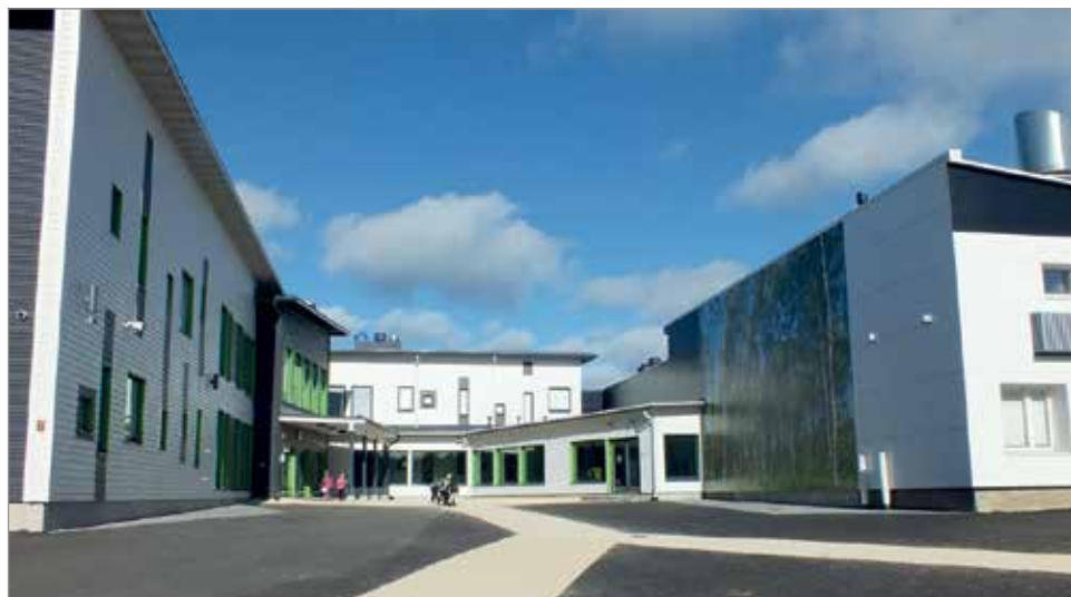
Kaikki kuntalaiset pääsivät tutustumaan uuteen, nykyaikaiseen kouluun 6.10.