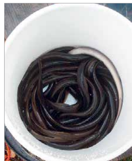
Muhojoesta pyydettyjä nahkisia - Saalis on runsas ja maittävä.