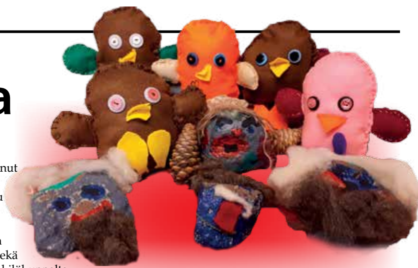
Tenavatuvan lapset ovat askarrelleet iltapäivähoidossa Satu Väänänen kanssa pöllöjä ja kivipeikkoja.