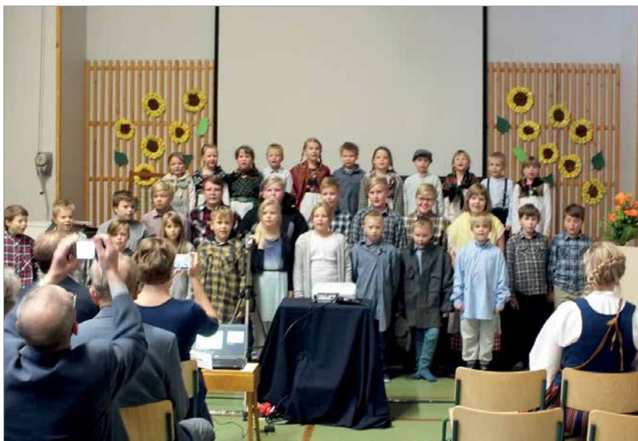
Olhavan koulun oppilaat esiintymässä koulunsa 125-vuotisjuhlassa.

-1940- ja 1950-luvuilla kyläkouluja perustettiin myös Olhavajokivarren kylille. Omat koulunsa saivat Vuosioja, Kaihua, Yli-Olhava, Konttila ja Lapinranta. Koululaisten määrän vähennyttä nuo koulut on lakkautettu ja yhdistetty Olhavan kouluun.