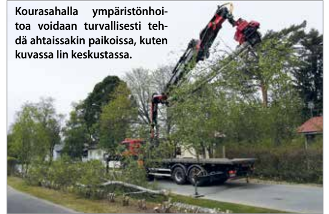
Kourasahalla ympäristönhoitoa voidaan turvallisesti tehdä ahtaissakin paikoissa, kuten kuvassa Iin keskustassa.