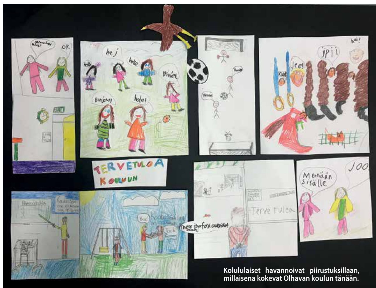
Koululaiset havainnoivat piirustuksillaan, millaisena kokevat Olhavan koulun tänään.