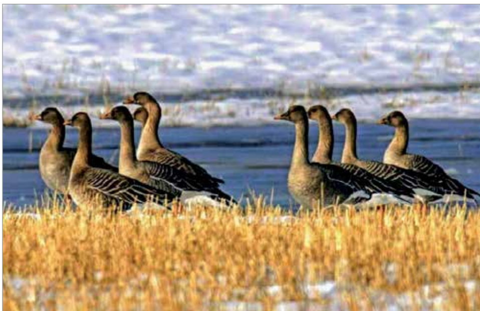
Metsähanhia rantapellolla. Kuva: Harriet Hannon

Mikäli Muhosuon ojitus ja turpeen nosto aloitetaan, se vie osan alueesta ja ennen kaikkea se tuo pesimäaikaisen ihmistoiminnan lisääntymisen kautta voimakkaan häiriötekijän pesinnälle. Tällä on alueellisesti erittäin merkittävä heikentävä vaikutus metsähanhen pesinnälle ja lisääntymiselle sekä sitä kautta kannan säilymiselle alueella.