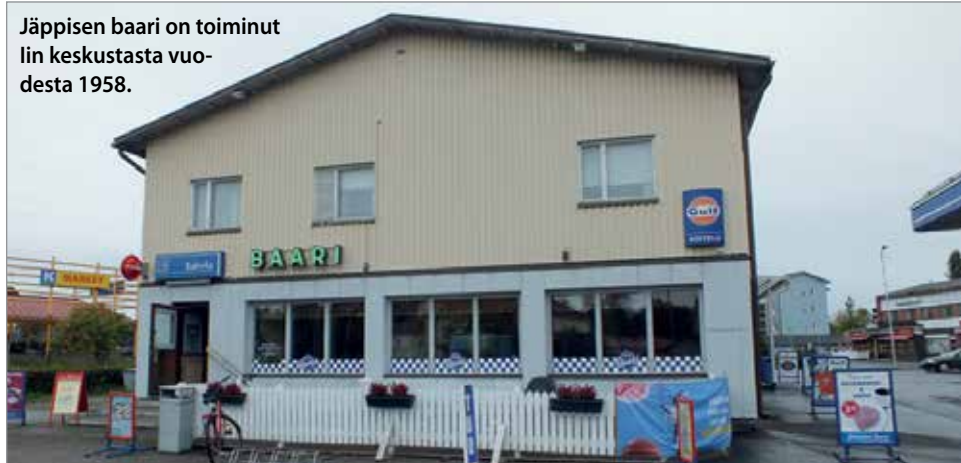
Jäppisen baari on toiminut Iin keskustasta vuodesta 1958.