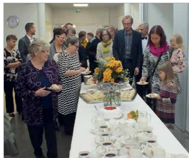
Vihkiäisjuhlan jälkeen kutsuvieraat siirtyivät juhlahahveille.