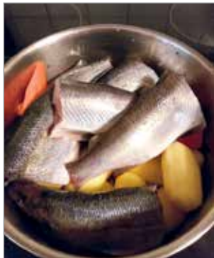
Kalat perunoiden päälle. Vettä vain sen verran että perunat juuri ja juuri peittyvät.