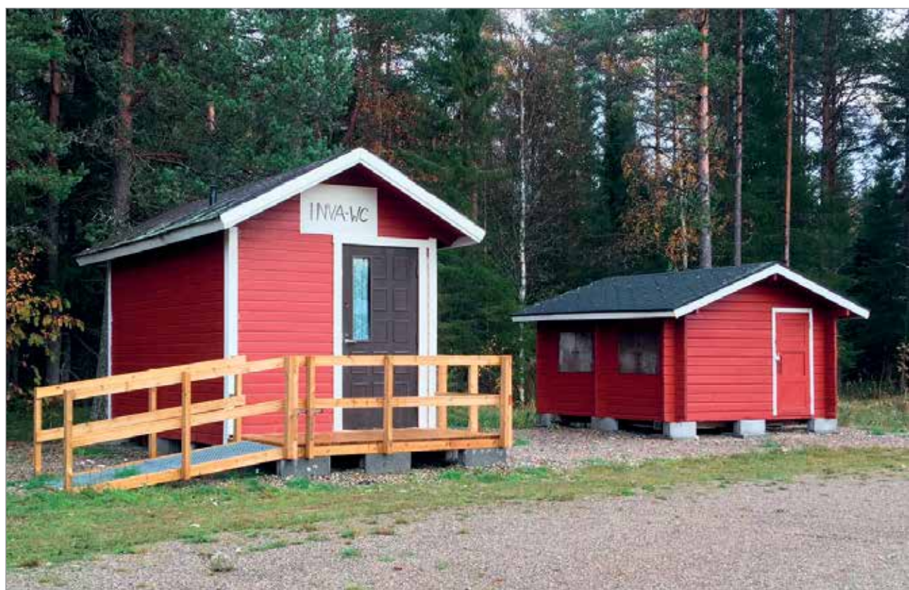
Kevään ja kesän aikana talkoiltiin mm. Olhavan Areenalle INVA-WC palvelemaan tapahtumien aikana. Itse rakennus saatiin lin seurakunnalta lahjoituksena; se siirrettiin Olhavaan Karhusaaresta ja kunnostettiin INVA-WC:n varustuksella, tarvittavilla kahvoilla sekä luiskalla.