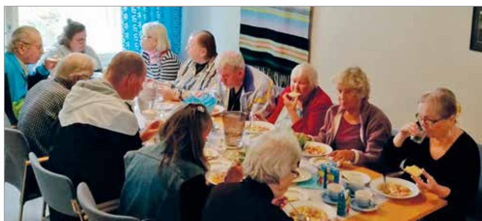
Porinapiiri yhdistää joka toinen maanantai. Tilat käyvät ahtaiksi mutta sopusijaa antaa