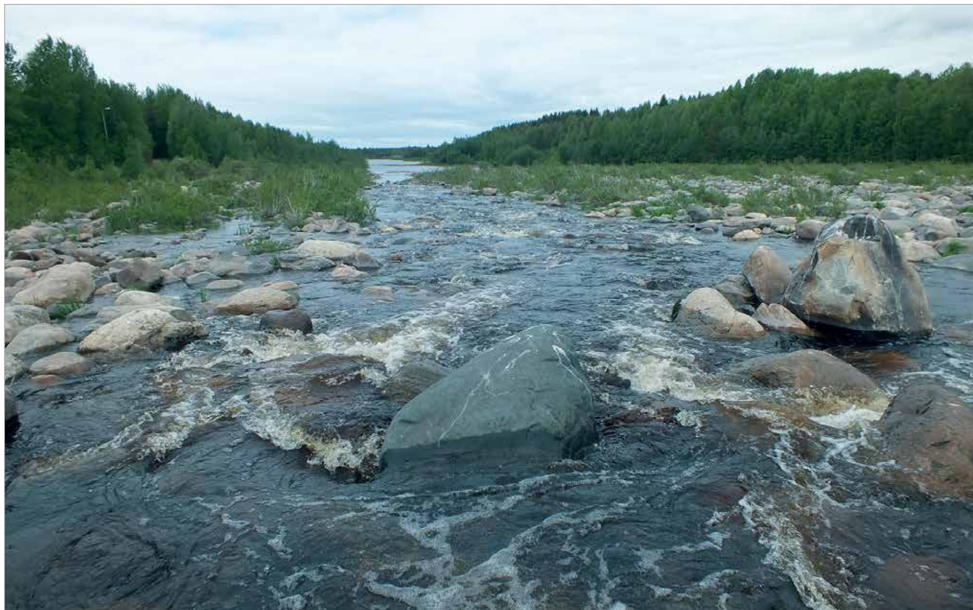
Iijoki-sopimuksella sitoudutaan Iijoen vesistövisioon ja toimenpideohjelman toteuttamiseen myös kalakantojen elinolosuhteiden osalta.

Iin kunnanvaltuusto käsittelee Iijoki-sopimusta kokouksessaan 8.10. MTR