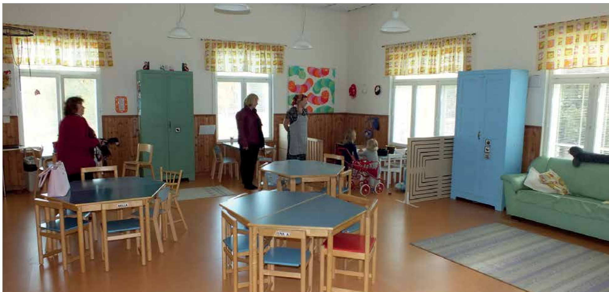
Olhavan päiväkotii Tenavatupa toimii Olhavan vanhassa koulurakennuksessa.

täyteinen yleisö, joka sai juhlan jälkeen nauttia täyte-kakkukahvit, sekä tutustua koulun historiaa valottaneeseen valokuvanäyttelyyn. MTR