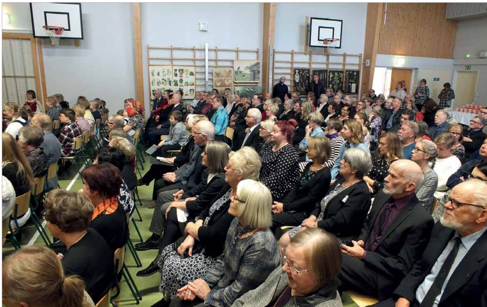
Koulun juhlasali on ääriään myöten täynnä juhlayleisöä.

-Ilman 125-vuotiaasta kansakoulua, nykyistä peruskoulua, Olhavan kylä olisi olennaisesti köyhempi. Nykyisessä ajassa, jossa raha ratkaisee, on pelkona kunnanisien jonakin päivänä toteavan "tuokin 125-vuotias joutaa pois". Toivotaan, ettei näin käy, vaan kuntapäätäjät ovat valistuneita kehittä-