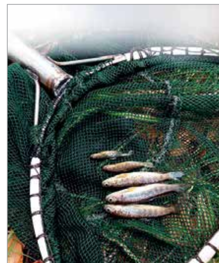
Koekalastuksen tulos Muhojoessa syntyneitä luonnonvaraisia taimenenpoikasista.