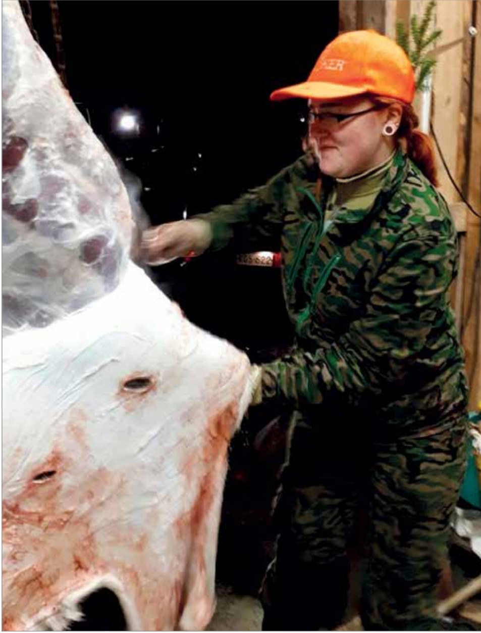
Hirvenvasan nylkypuuhissa. Tänä syksynä lida onnistui kaatamaan vasan peltoon kyttäyksen tuloksena.

Vaikka Olhava on pieni kylä ja harrastusmahdollisuudet on rajalliset, niin täällä on kiva asua. Nuorille suunnattua toimintaa ei vain ole kovinkaan paljon. Meillä on kuitenkin oma kuntosali ja kerran viikossa on mahdollisuus pelata sähköisiä Olhavan koululla, josta