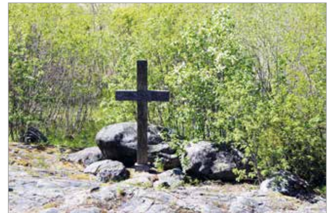
Polun varrelta löytyy hiljentymispaikka.