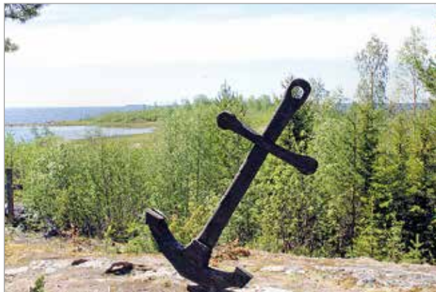
Merimiehen polku kulkee kauniissa merimaisemissa.

taiden kanssa kuljettavaksi. Hämärän laskeutuessa pit- kospuureitti on myös valais- tu. Polun lähtöpiste sijaitsee valtatie 4 varrella 25 kilo- metriä listä pohjoiseen. MTR