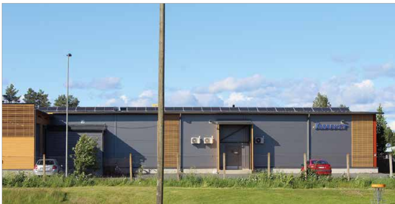
S-Market Iin katolle ilmestyneet aurinkopaneelit tuottavat sähköä yrityksen omaan käyttöön.