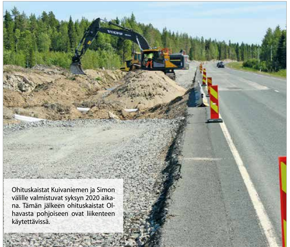
Ohituskaistat Kuivaniemen ja Simon välille valmistuvat syksyn 2020 aikana. Tämän jälkeen ohituskaistat Olhavasta pohjoiseen ovat liikenteen käytettävissä.