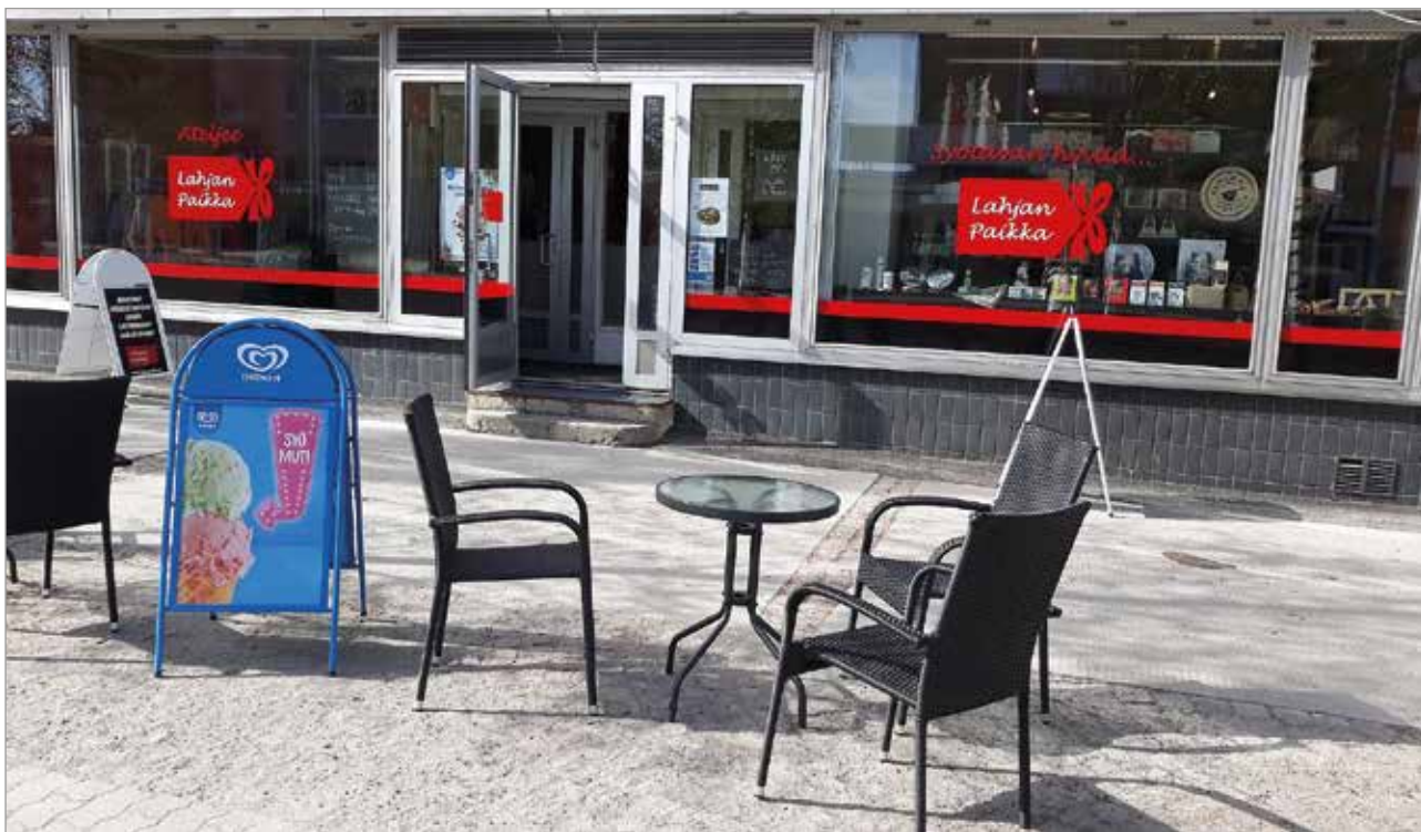
Lahjan Paikan kivijalkamyymälä sijaitsee Kemissä.