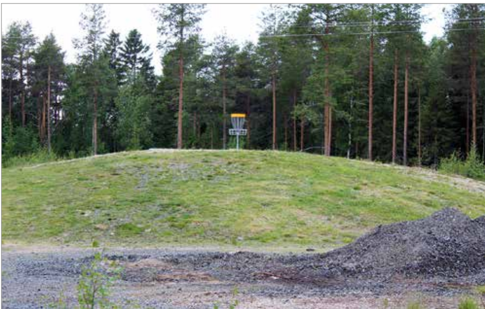
Illinsaaren frisbeerata tarjoaa hyvät ja vaihtelevat radat SM-karsintakilpailuille.

- Rajoitukset ovat tietenkin harmillisia, mutta haluamme varmistaa kaikille turvallisen osallistumisen kilpailuihin. Kunta on laittanut radat huippukuntoon ja jokainen väylä on nimetty oululaisen tai iiläisen yhteistyökumppanin mukaan. Monenlaista oheisohjelmaa olimme myös yleisölle suunnitelleet. Ne eivät kuitenkaan toteudu, koska yleisöä emme voi paikalle päästää. MTR