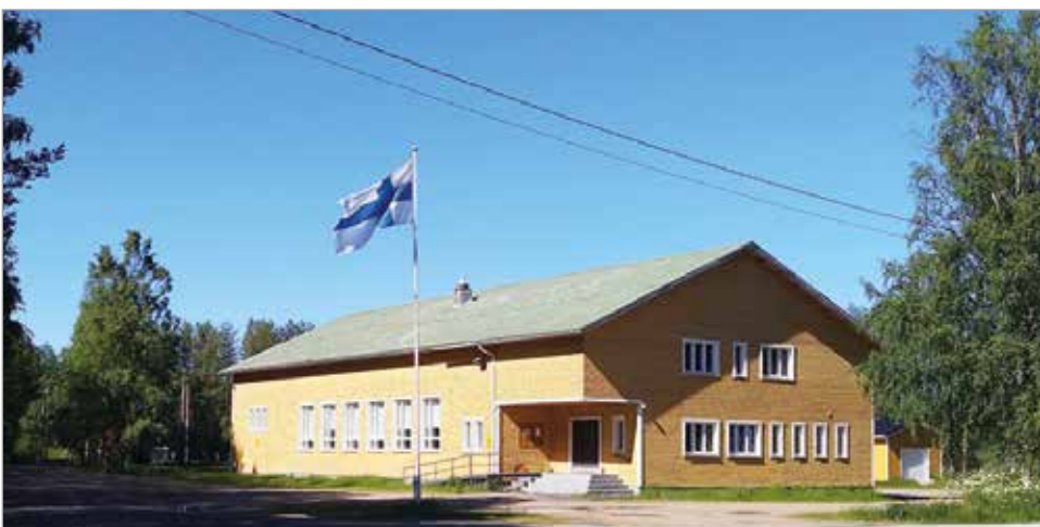
Kuivaniemen Nuorisoseurantalo juhannuksena 2020.

Ilman bingotoimintaa emme olisi taloa pystyneet kunnostamaan Raimo Ikonen toteaa eläkkeelle päässeeseen bingokoneen takana.