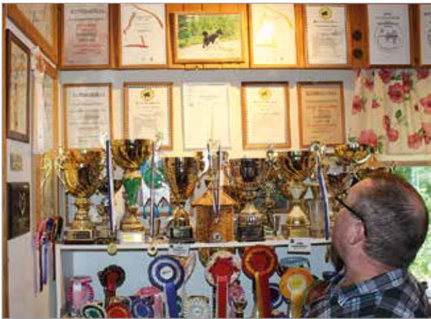
Harrin palkintokaapissa on SM-mitalien lisäksi monista saavutuksista kertovia pokaaleja ja kunniakirjoja.

hyvän mielen. Hän suosittelee muille samaa ja hyvän kiertämään laittamista lahjoituspentujen myötä. MTR