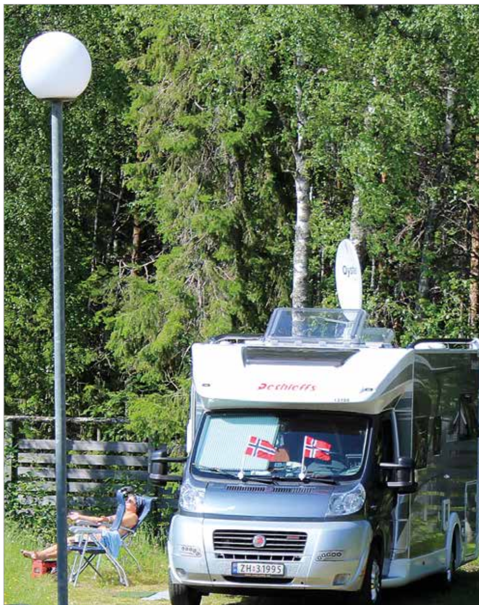
Koronarajoitusten poistuminen ja rajojen avautuminen näkyvät Merihelmi Campingissä norjalaisten paluuna asiakaskuntaan.